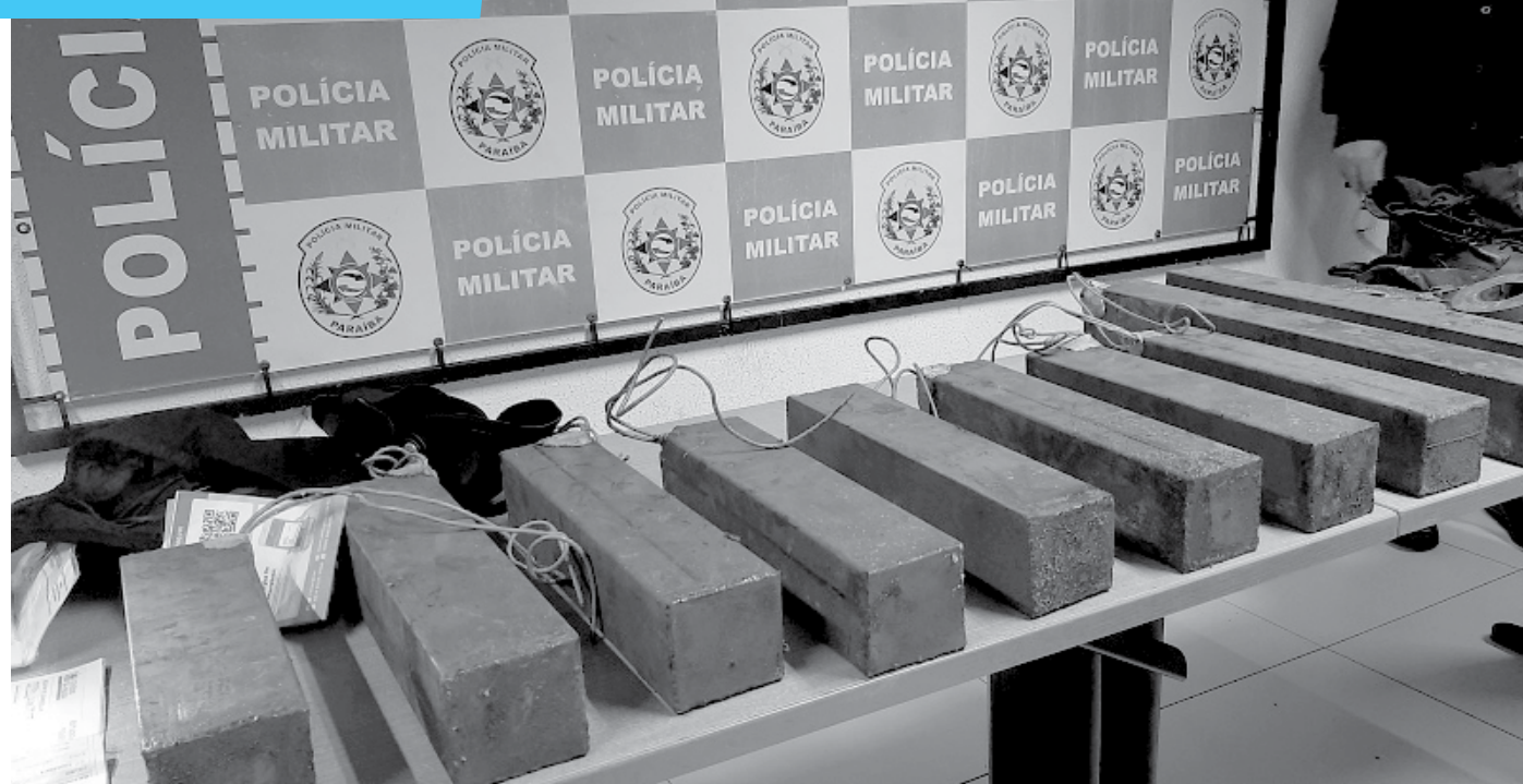
Explosivos apreendidos têm alto poder destrutivo; polícia está investigando para saber a procedência do material e onde ele seria utilizado