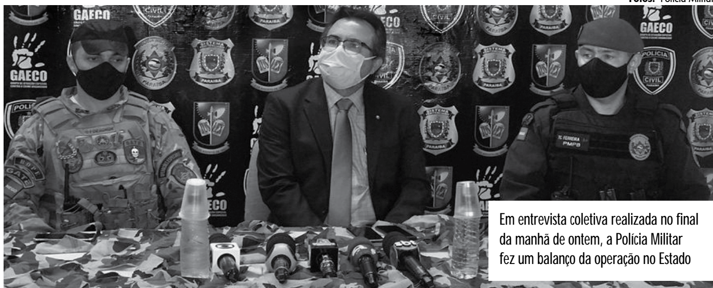
Em entrevista coletiva realizada no final da manhã de ontem, a Polícia Militar fez um balanço da operação no Estado