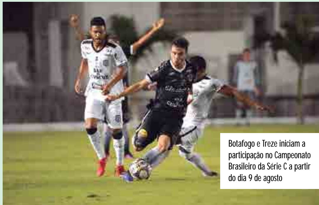
Botafogo e Treze iniciam a participação no Campeonato Brasileiro da Série C a partir do dia 9 de agosto