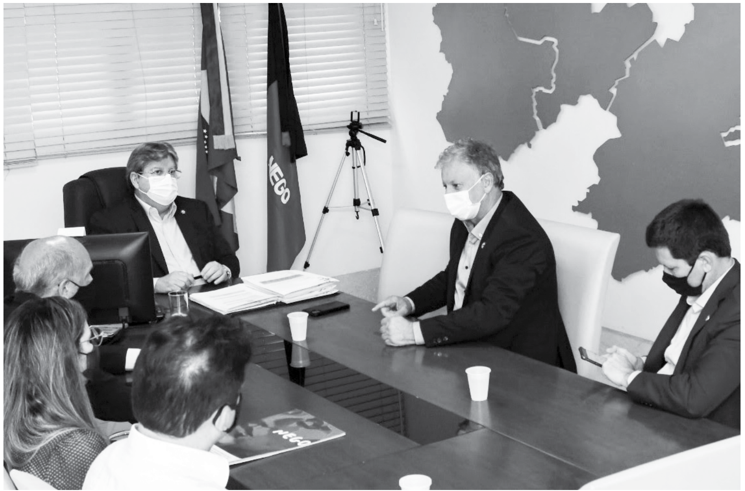
João Azevêdo apresentou durante a reunião com Aírton Soligo as medidas adotadas pelo Governo do Estado no combate à covid-19 na Paraíba

Também participaram da reunião, o deputado federal Hugo Motta; o assessor especial do Ministério da Saúde, Gustavo Pires; o secretário de Estado da Saúde, Geraldo Medeiros; e a secretária executiva da Saúde, Renata Nóbrega.