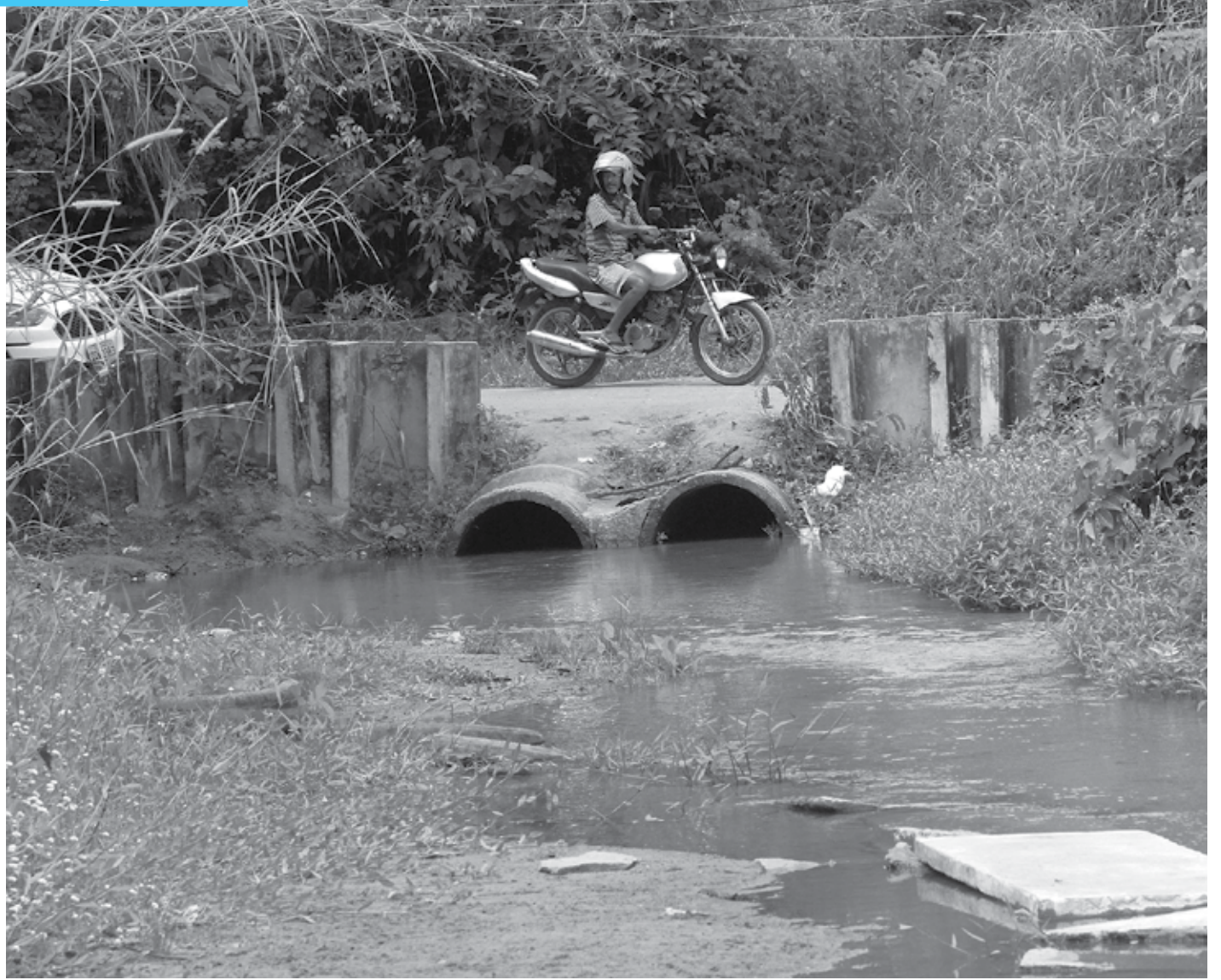
Segundo o MPPB, a passagem molhada construída sobre o Rio do Meio está causando dano ambiental e ameaça desabar, oferecendo riscos à população