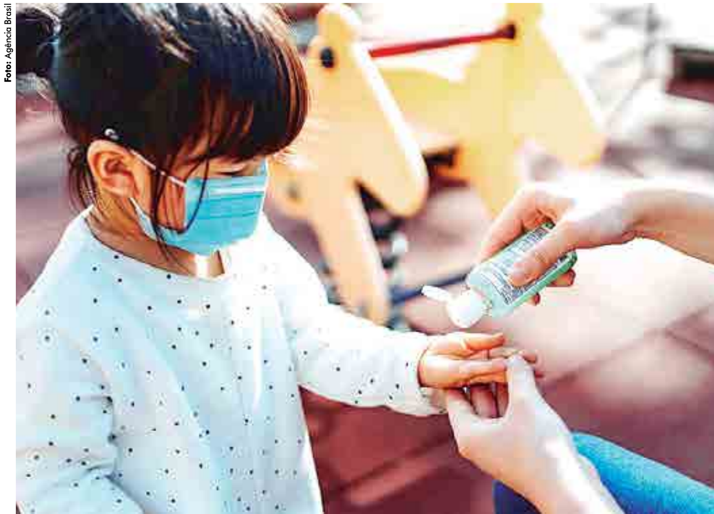
A decisão abrange toda a Educação Infantil, como berçários e creches, Pré I e Pré II, mas pais têm autonomia para decidirem se liberam os filhos

Para fazer a inscrição no curso, basta acessar o QR Code acima