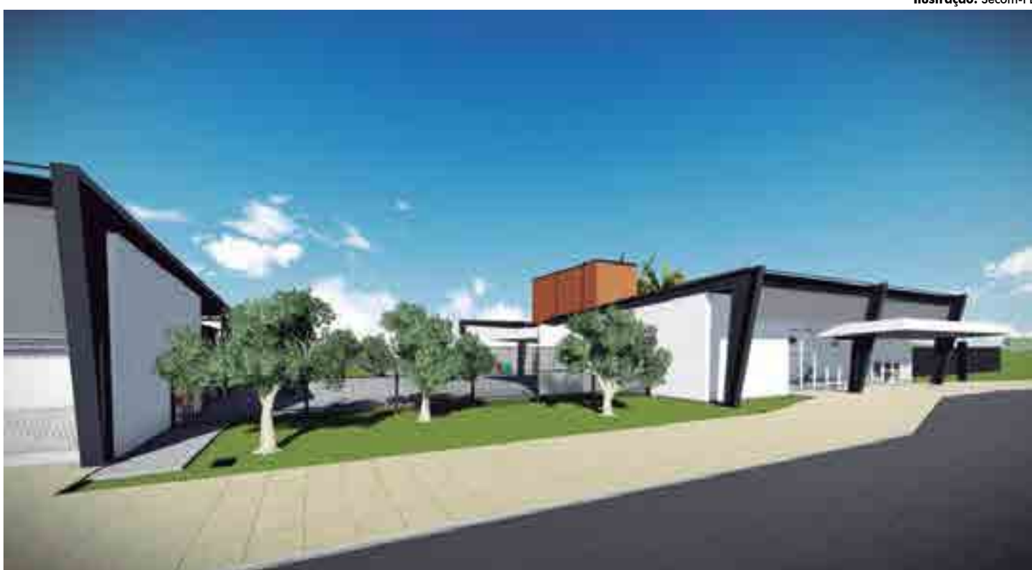
Iniciativa visa fortalecer o comércio da cidade, que é um importante polo do Sertão, além de incentivar o setor turístico, sobretudo durante as festividades juninas

O terminal aeroviário já existe no município, mas os investimentos que serão feitos agora possibilitarão uma reconstrução de todo o equipamento. Ele hoje tem potencial para operar com cerca de 100 mil passageiros, mas deve aumentar sua capacidade de voos após a conclusão das obras. A iniciativa visa fortalecer o setor comercial da cidade, que é polo comercial do Sertão, além de implementar o setor turístico, sobretudo durante as festividades juninas. A obra, autorizada pelo Ministério da Infraestrutura em 1º de