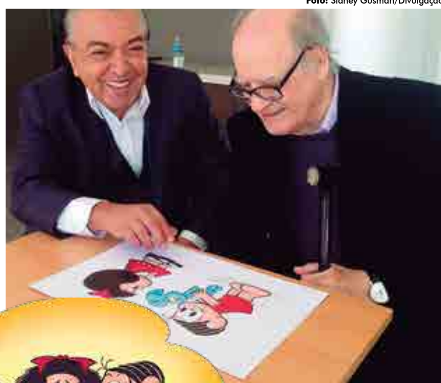
Maurício de Sousa (E) dando um presente a Quino (D) numa visita a Buenos Aires, em 2015; ao lado, a arte do brasileiro com as criações máximas de ambos se lamentando pela morte do argentino

Sidney Gusman presenciou um importante reencontro de titãs dos quadrinhos produzidos na América Latina, ocorrido em 2015, quando o pai da Turma da Mônica se encontrou com o pai da Mafalda, na capital da Argentina. “Imagina para alguém que é muito fã de quadrinhos, como foi ser testemunha desse reencontro”, comenta. “Em abril de 2015, acompanhei Mauricio a Buenos Aires, para um novo encontro dele com Quino (que já havia visitado os estúdios da MSP em 1999), e fiquei ali ouvindo os dois prozarem, enquanto registrava fotos de tudo”. O momento emocionante é definido de uma forma direta: “Foi um privilégio”.