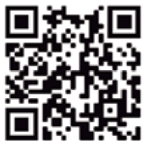
Através do QR Code acima, acesse o site oficial do Salão Parahyba

Tavares resumiu que a clausura das pessoas transpira através da arte. “Muitos desenhos que vi são frutos da agonia ou do protesto que aflorou nessa pandemia. Muitas obras estão inscritas no contexto da revolta. Essa revolta que nós estamos vivendo por vivermos em um país sem governo. Achei isso importantíssimo em termos ideológico e estético”.