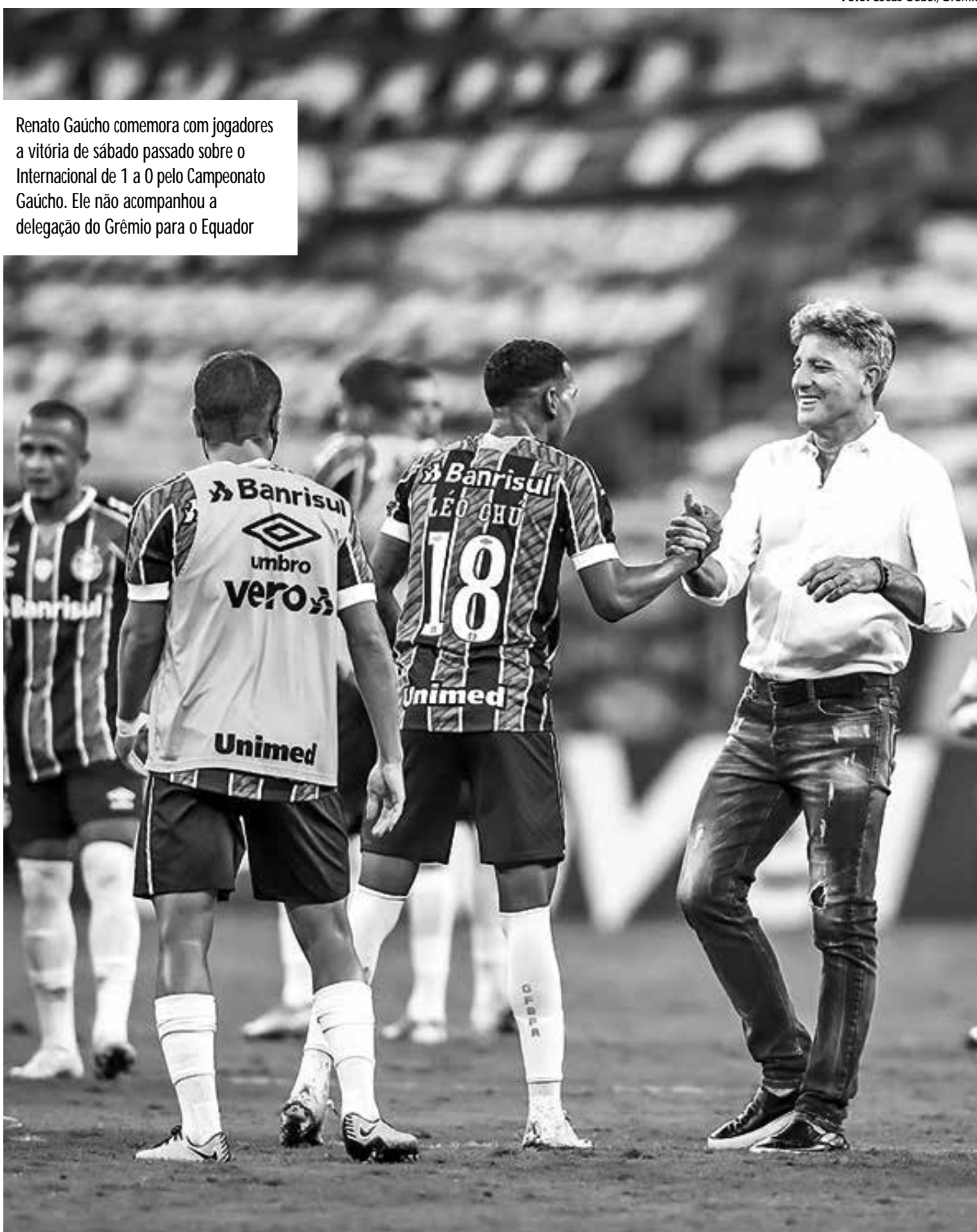
Renato Gaúcho comemora com jogadores a vitória de sábado passado sobre o Internacional de 1 a 0 pelo Campeonato Gaúcho. Ele não acompanhou a delegação do Grêmio para o Equador