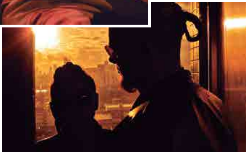
À direita, último trabalho do paraibano na direção: a crítica social em um futuro distópico presente no curta 'Deus não acredita em máquinas (DNA_M)', de 2019