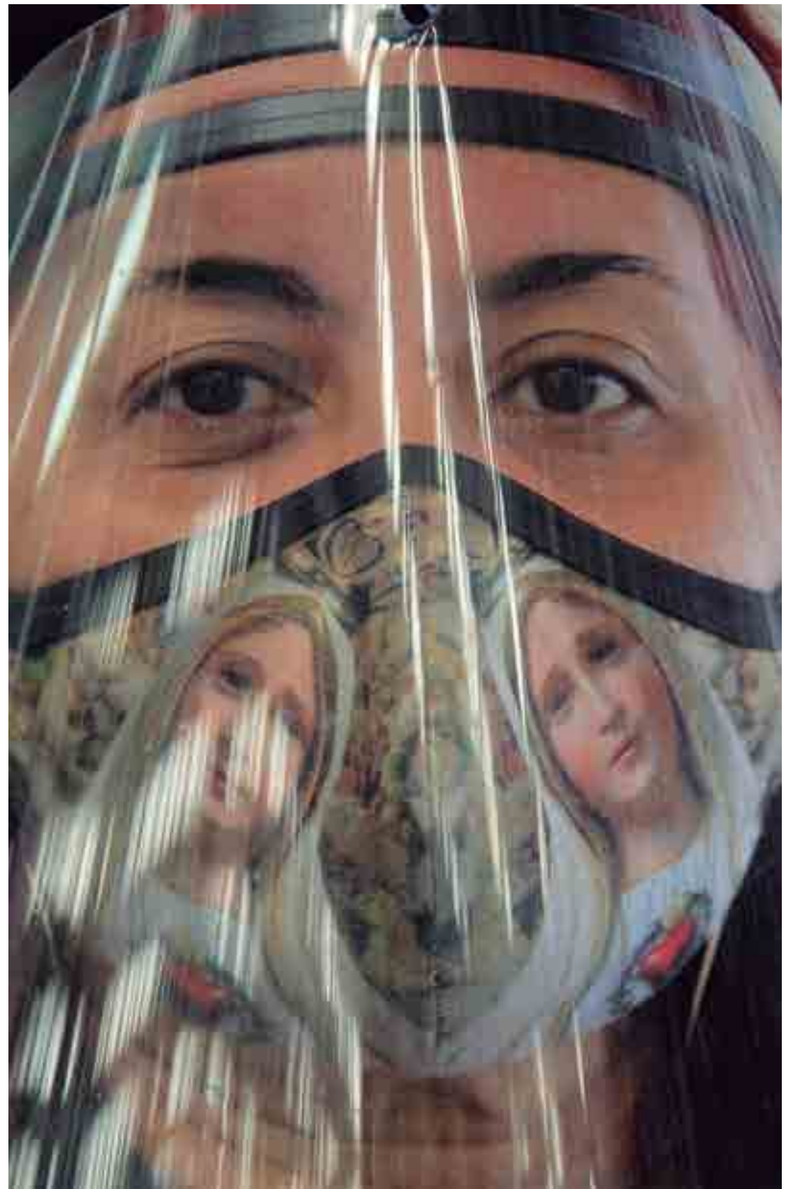
Autoridades de saúde alertam para a continuidade do uso obrigatório de máscara e de medidas de distanciamento social