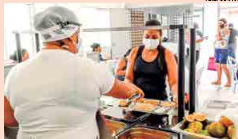
A distribuição de comida e refeições acontece nos Restaurantes Populares e Cozinhas Comunitárias mantidos pela Prefeitura de João Pessoa