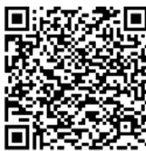
Através do QR Code acima, acesse um vídeo promocional da Apple Records no YouTube

No YouTube é possível encontrar os vídeos promocionais lançados pela gravadora, na época (a Apple também atuava no ramo de cinema, de educação e artigos eletrônicos), e há muitos depoimentos dos Beatles sobre essa "aventura". No QR Code, escolhi compartilhar um vídeo de divulgação (infelizmente, só com legendas em inglês) para o lançamento da edição em CD, disponibilizada pela Amazon dos EUA. Enjoy it!