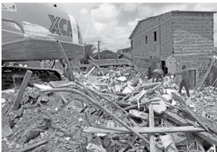
Só restaram entulhos do prédio que ficava na rua Alfredo Ferreira da Rocha

Ainda segundo a delegada, caso não apresente a documentação, ele pode ser