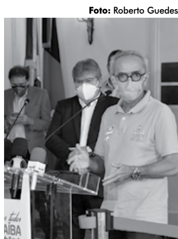
Prefeito de JP, Cícero Lucena destacou a visão de futuro de João Azevêdo

O programa está previsto para iniciar no próximo mês de julho. “Vamos iniciar essas obras imediatamente para que possamos executá-las nos próximos dois anos. O DER (Departamento de Estradas e Rodagens da Paraíba) já está autorizado a iniciar todos os processos de licitação e, nos próximos três meses, essas obras estarão sendo executadas”, garantiu João Azevêdo.