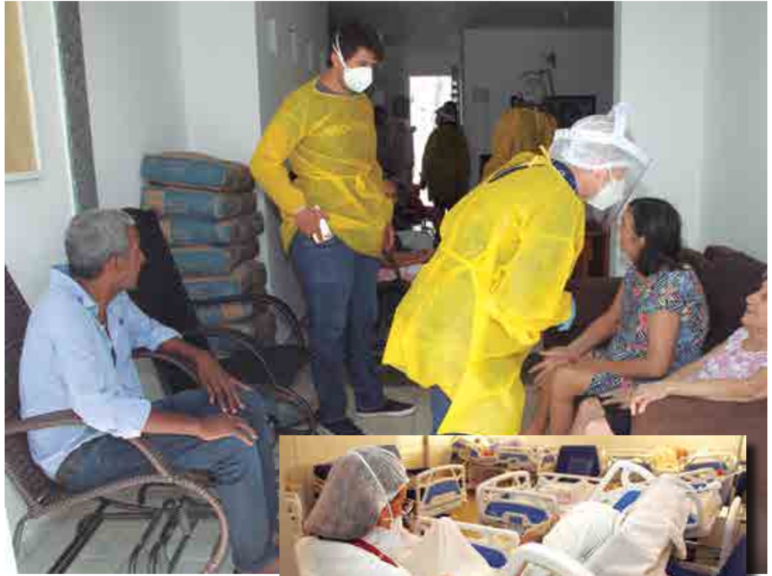
O espaço deve ser fechado e, tanto a administração, quanto familiares dos internos serão responsabilizados; 17 foram levados para o Hospital Padre Zé e 22 continuam internados no local