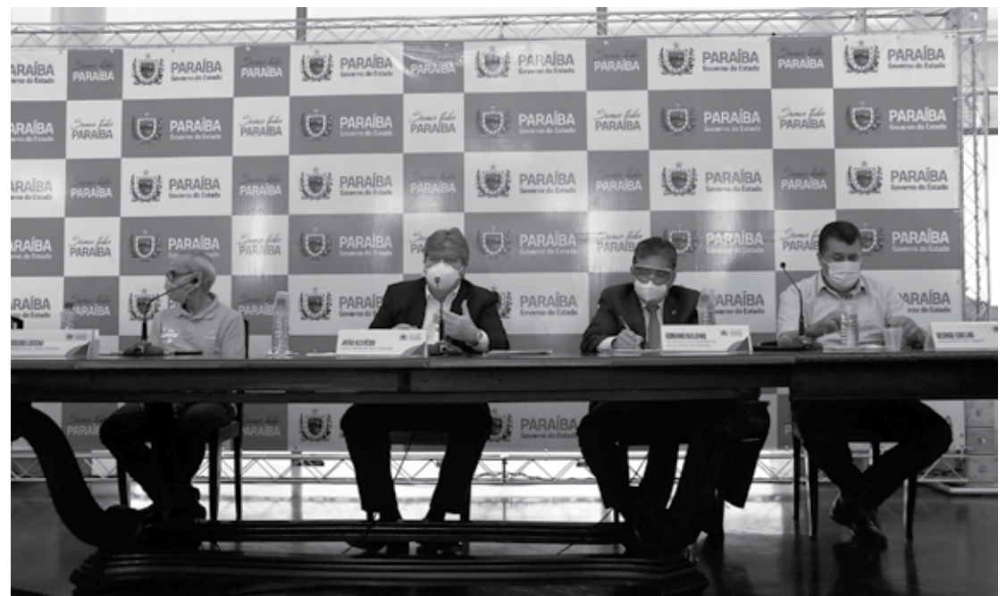
Governador João Azevêdo (ao microfone) anunciou 55 obras como projeto para impulsionar desenvolvimento