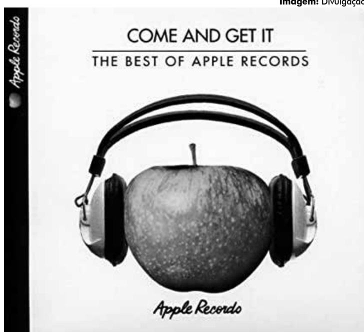
Nome da coletânea vem da canção de McCartney para o filme 'Um Beatle no Paraíso'

Aparecem muitas faixas produzidas por George Harrison, uma delas 'Ain't that cute', escrita por ele em parceria com a intérprete da canção, Doris Troy (revelada através da banda de James Brown). Segundo as notas históricas, ele a conheceu durante as gravações do álbum That's The Way God Planned It , de Billy Preston (disco produzido por Ray Charles e George Harrison, com participação de gente como Eric Clapton, Keith Richards e Ginger Baker) e logo se tornaram amigos, tanto que a canção, na real, foi praticamente toda escrita pelo generoso ex-beatle.