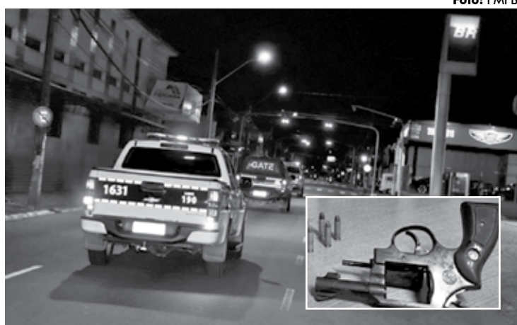
Guarnições da PM estiveram em todas as regiões na apreensão de armas

A Polícia Militar apreendeu 34 armas de fogo, entre a quarta-feira (31) e o domingo (4), nas ações de reforço da segurança no feriadão da Semana Santa. Houve um aumento de 6% do número de apreensões em relação ao ano passado, conforme os dados da Coordenadoria de Avaliação e Estatística da PM.