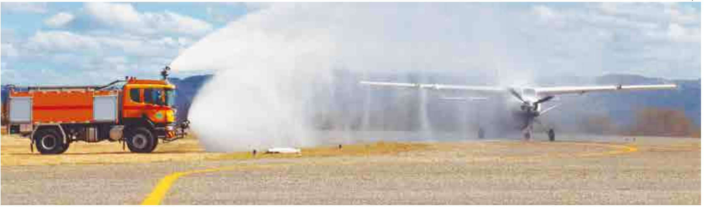
Operação da rota aérea Recife/Patos terá duração aproximada de 1h15 e será feita por aeronaves da empresa Azul Conecta, modelos Cessna Gran Caravan, com capacidade de até 11 lugares, sendo dois tripulantes e nove passageiros