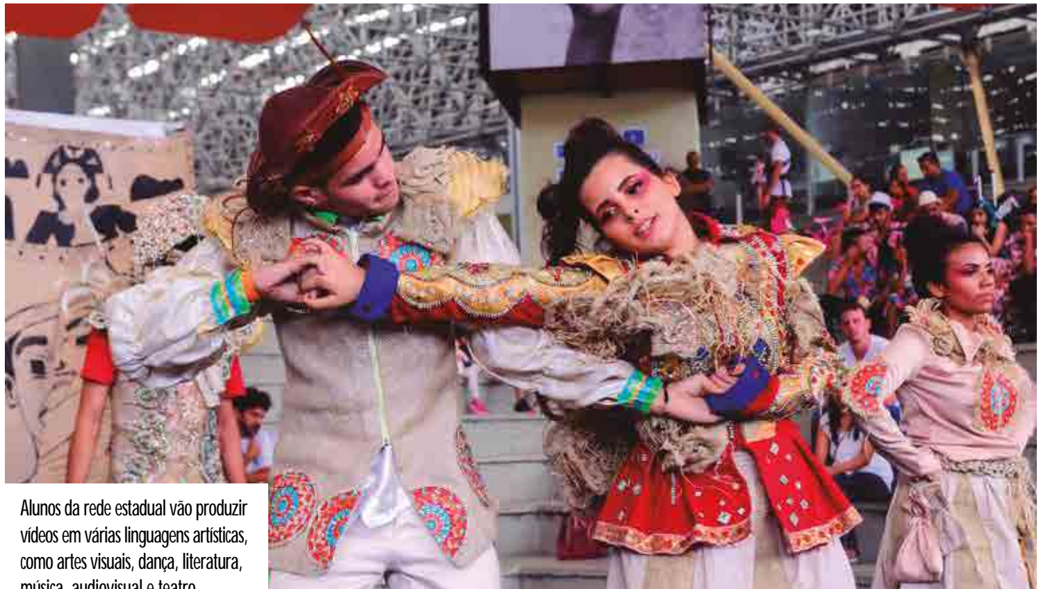
Alunos da rede estadual vão produzir vídeos em várias linguagens artísticas, como artes visuais, dança, literatura, música, audiovisual e teatro

"A ideia é pegar a obra de José Lins do Rego e trazer para a questão das mídias digitais que estão extremamente popularizadas entre os jovens. O momento da pandemia faz com que nós pensemos nas ferramentas que foram desenvolvidas pela Secretaria por