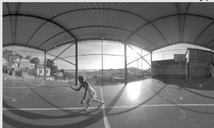
'Na Pele VR' é o primeiro documentário em realidade virtual em favela

Neste mês acontece a primeira edição do Festival Imersivo das Favelas (FIF). As inscrições estão abertas até o dia 18 para jovens que queiram apresentar projetos. O evento será exibido online entre os dias 27 e 29.