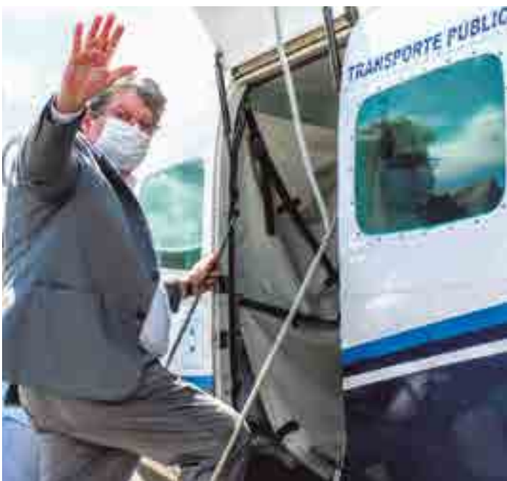
Governador João Azevêdo participou da solenidade de inauguração do voo diário Patos/Recife e reafirmou a importância da iniciativa: "Eu não tenho dúvida nenhuma de que esse voo é a redenção de toda essa região"

A nova rota comercial vai dar mais agilidade e diminuir a distância entre o interior do Estado e a capital pernambucana. Uma viagem que pode demorar entre seis e sete horas, dependendo se o deslocamento é feito de carro particular ou ônibus intermunicipal. Com os novos voos, esse percurso pode ser feito um pouco mais de uma hora. Com grande bagagem na aviação,