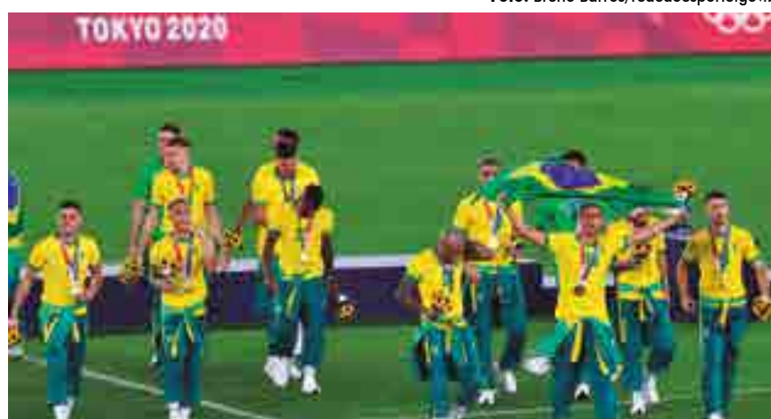
Jogadores não vestem o agasalho do COB durante a premiação do ouro no futebol