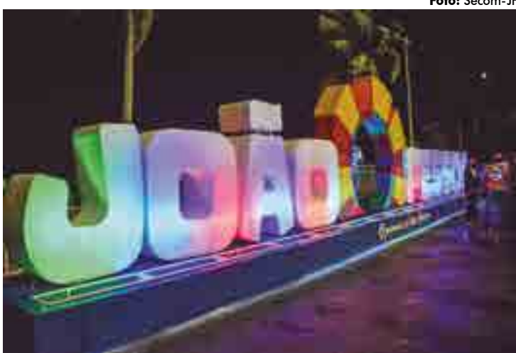
Iluminação predominantemente lilás lembra as ações da campanha social

O novo letreiro instalado no Busto de Tamandaré, entre as praias de Tambaú e Cabo Branco, além de ser um atrativo e impulsionador do Destino João Pessoa, também iniciou ontem a sua função social. Numa iniciativa das Secretarias de Turismo e das Mulheres, a cor lilás passou ontem a ser predominante durante todo o mês de agosto no letreiro simbolizando e reforçando as ações de prevenção e combate contra as agressões contra as mulheres.