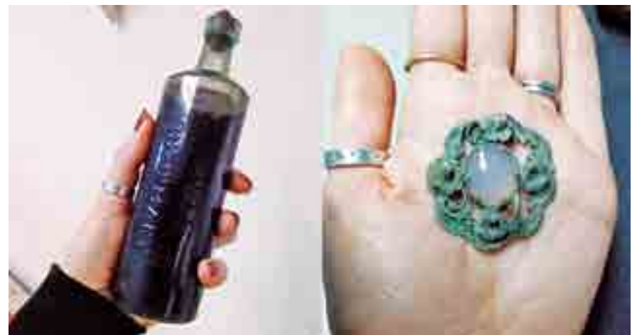
Os arqueólogos estão analisando as defesas da cidade inglesa onde está localizado o cemitério pós-medieval e muito material já foi coletado, inclusive a garrafa misteriosa