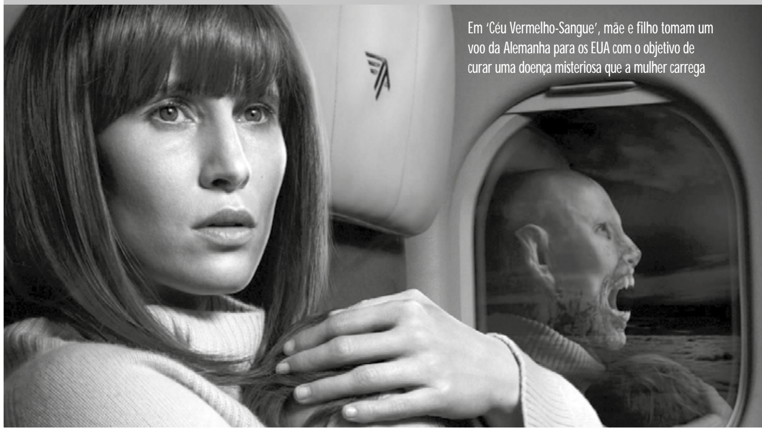
Em 'Céu Vermelho-Sangue', mãe e filho tomam um voo da Alemanha para os EUA com o objetivo de curar uma doença misteriosa que a mulher carrega