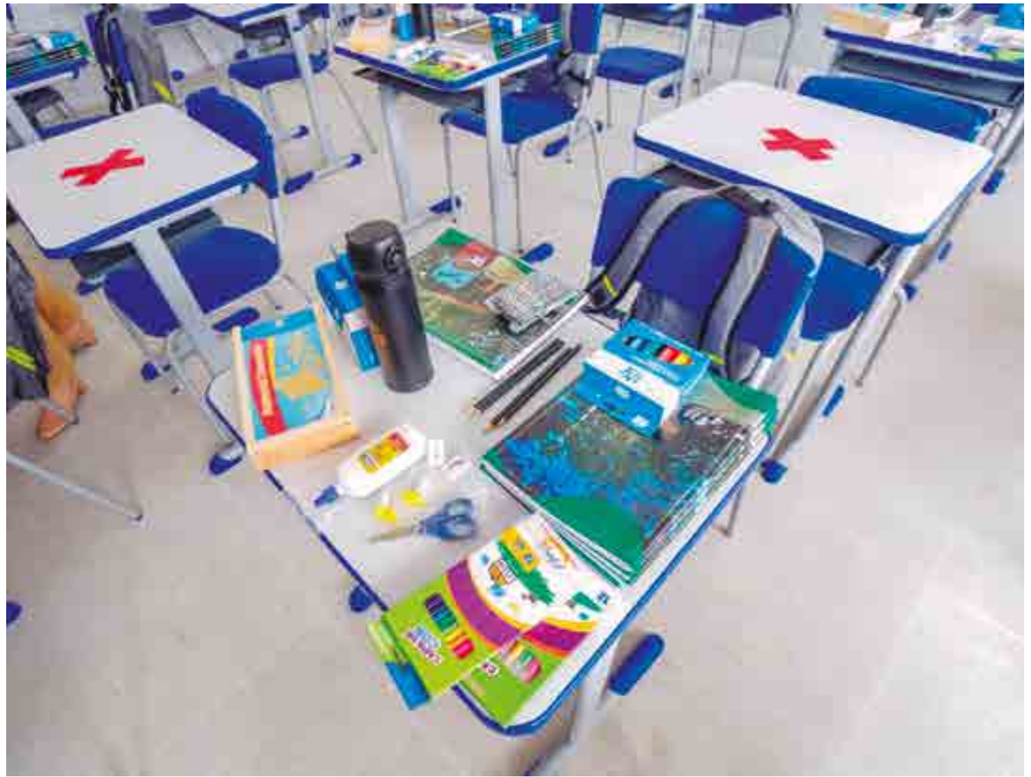
Salas de aulas serão preparadas seguindo protocolo de segurança sanitária, começando com a volta dos alunos de Educação Especial e Infantil

Pais de alunos serão convidados a visitar as escolas e vão decidir se desejam aderir ao retorno ou manter os filhos no ensino remoto