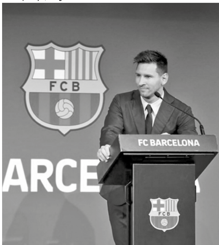
Messi se despediu do Barcelona em entrevista coletiva no último domingo