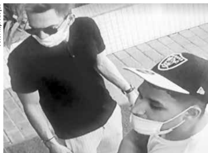
A dupla teve muita facilidade para entrar no prédio onde praticou o furto