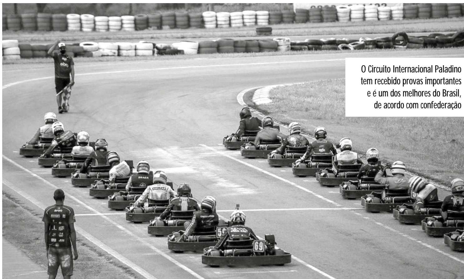
O Circuito Internacional Paladino tem recebido provas importantes e é um dos melhores do Brasil, de acordo com confederação

Outra demonstração importante da atenção ao desenvolvimento do kart no Nordeste, é que as duas competições mais importantes dessa modalidade no Brasil devem ocorrer, em 2022, na região. A primeira delas, já confirmada, será a Copa do Brasil, que está marcada para ocorrer em Aracaju. Já o Campeonato Brasileiro de Kart, ainda não teve sua sede anunciada, mas a tendência, de acordo com a FAEP, é que, assim como em 2016, no ano da abertura do Paladino, essa disputa volte a ocorrer em solo paraibano.