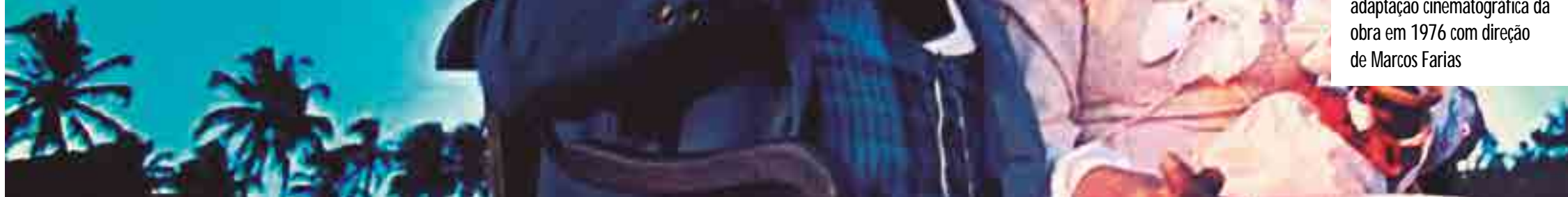
Othon Bastos e Ângela Leal na adaptação cinematográfica da obra em 1976 com direção de Marcos Farias