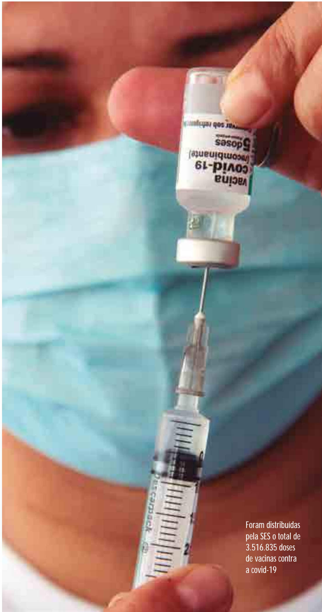
Foram distribuídas pela SES o total de 3.516.835 doses de vacinas contra a covid-19

Foi o total de novos casos registrados pela Secretaria de Saúde, com 10 mortes