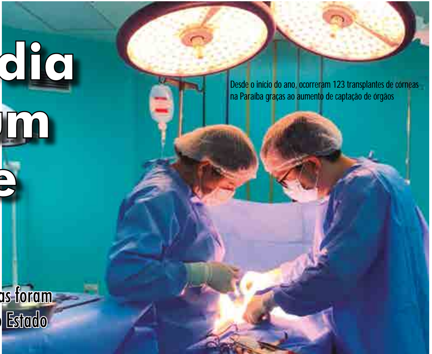
Desde o início do ano, ocorreram 123 transplantes de córneas na Paraíba graças ao aumento de captação de órgãos

Entre os meses de junho e julho, 56 cirurgias foram registradas pela Central de Transplantes do Estado