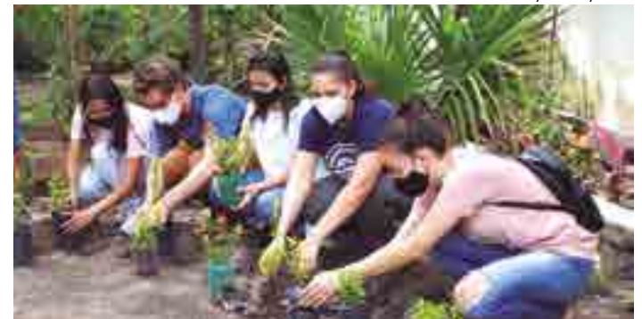
O 'Trote Verde' foi realizado no Centro de Ciências da Saúde