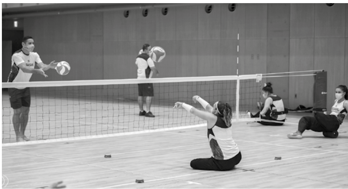
A seleção treina para subir ao pódio como aconteceu na Rio-2016 com a medalha de bronze. Jogos serão abertos no dia 24

A Seleção Brasileira Feminina de Vôlei sentado, que já conhecia as adversárias do seu grupo, ficou sabendo a ordem dos confrontos na semana passada. No dia 27, às 6h30 (de Brasília), estreia contra o Canadá, depois enfrenta as japonesas no dia 29, às 8h30 (de Brasília), e encerra a primeira fase contra a Itália no dia 31, às 22h (de Brasília).