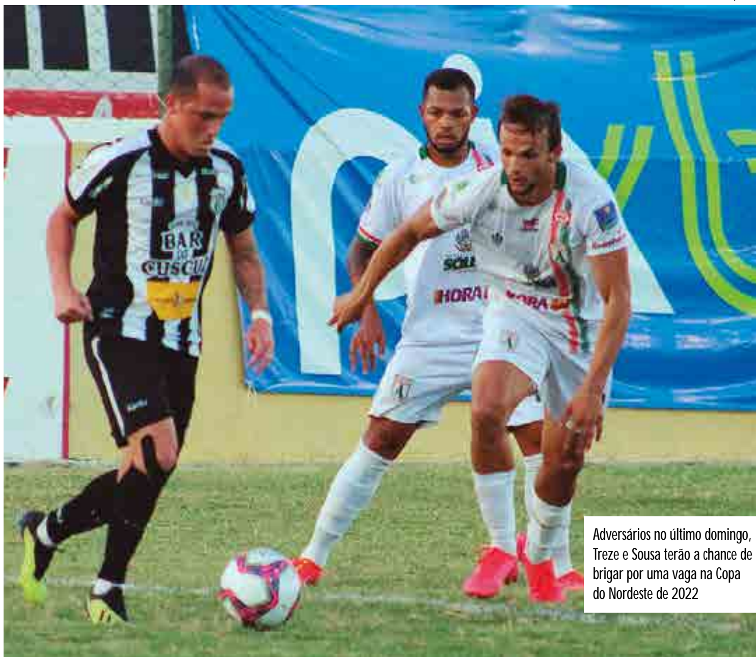
Adversários no último domingo, Treze e Sousa terão a chance de brigar por uma vaga na Copa do Nordeste de 2022