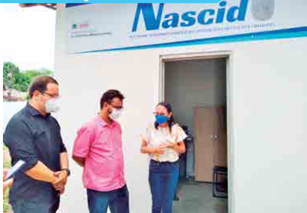
Instituição terá espaço para expedição de documentação social para os jovens em cumprimento de medida socioeducativa