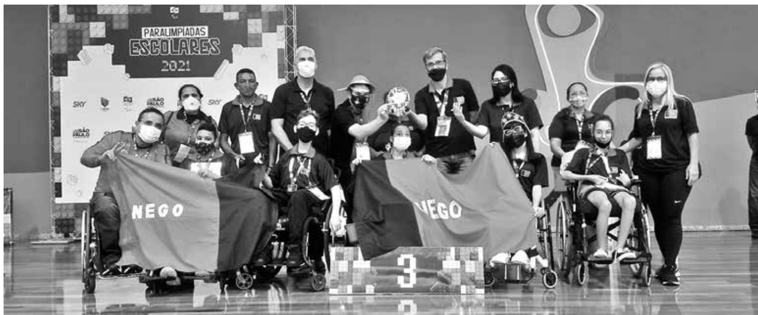
Paraíba mostrou a sua força nas Paralimpiadas Escolares com a conquista de 60 medalhas na edição disputada no mês passado em São Paulo