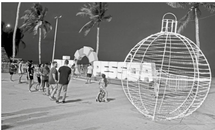
Lançado pela Prefeitura de João Pessoa no dia 3 de dezembro, a expectativa é de que o Natal dos Sentimentos aumente a demanda de turistas em 200%, movimentando cerca de R$ 80 milhões

Para cada um dos polos há uma programação específica. No polo do Amor, que está localizado no Largo de Tambaú, tem uma feirinha de artesanato ligada ao Celeiro Espaço Criativo Cantor Gabriel Diniz. "A curadoria foi feita por mim e a gente selecionou artesãos para estarem expondo aqui. O celeiro, que é onde