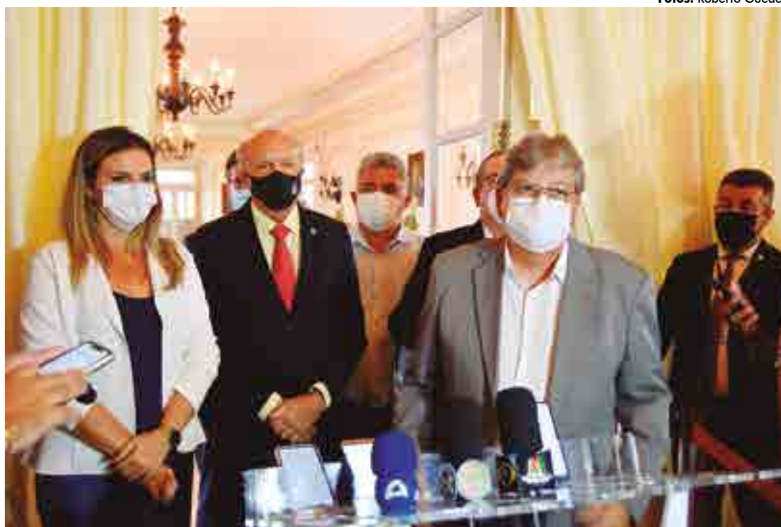
Ao assinar o contrato da PB Saúde com o Hospital Metropolitano Dom José Maria Pires, o governador João Azevêdo destacou o esforço de sua gestão para ampliar o atendimento à população com serviços de qualidade no Estado