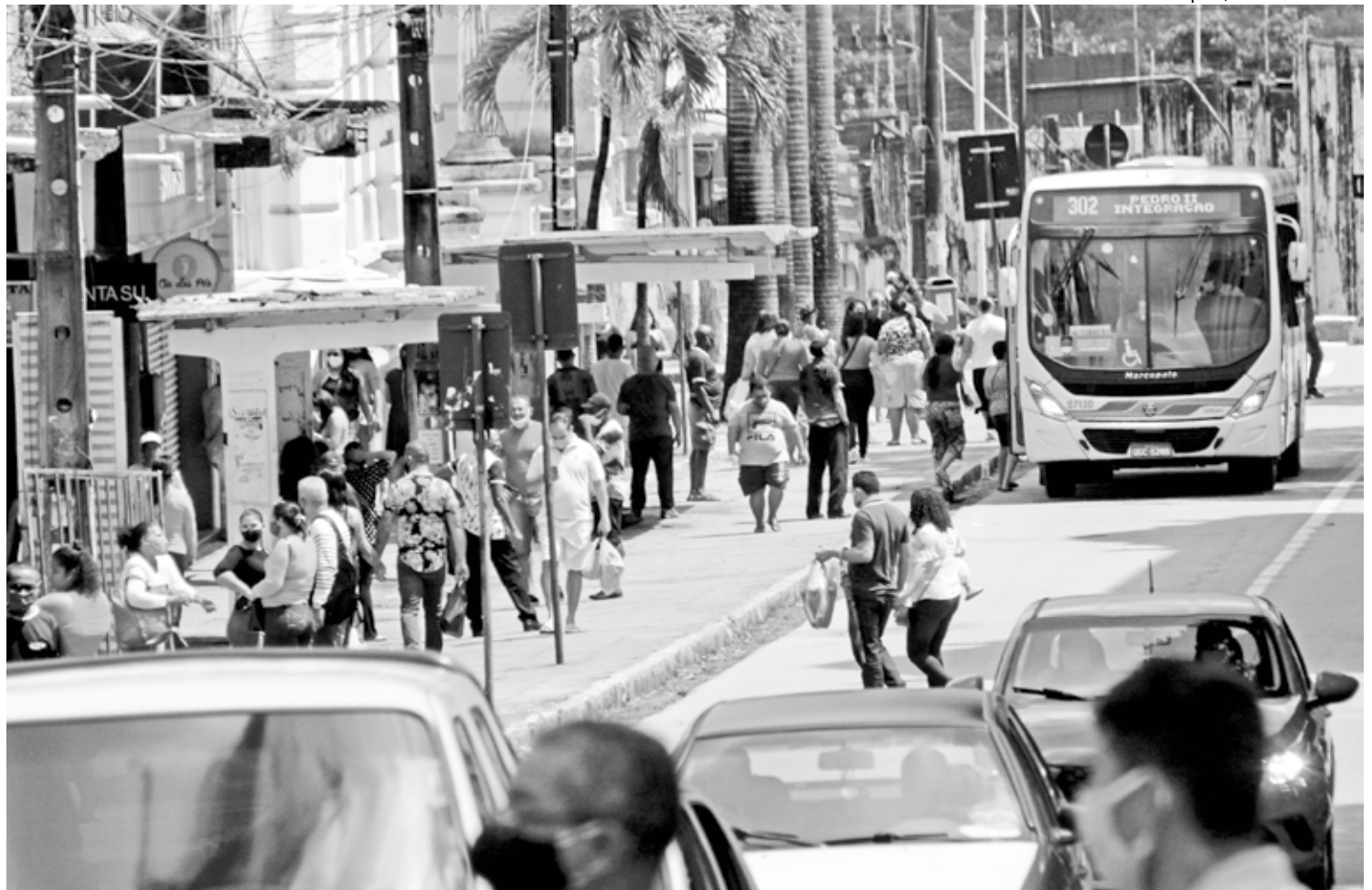
O funcionamento dos transportes coletivos de João Pessoa e da Região Metropolitana terá mudanças por conta do feriado de Natal, segundo revelou a Semob

Sobre o funcionamento dos ônibus de João Pessoa, a Superintendência Execu-