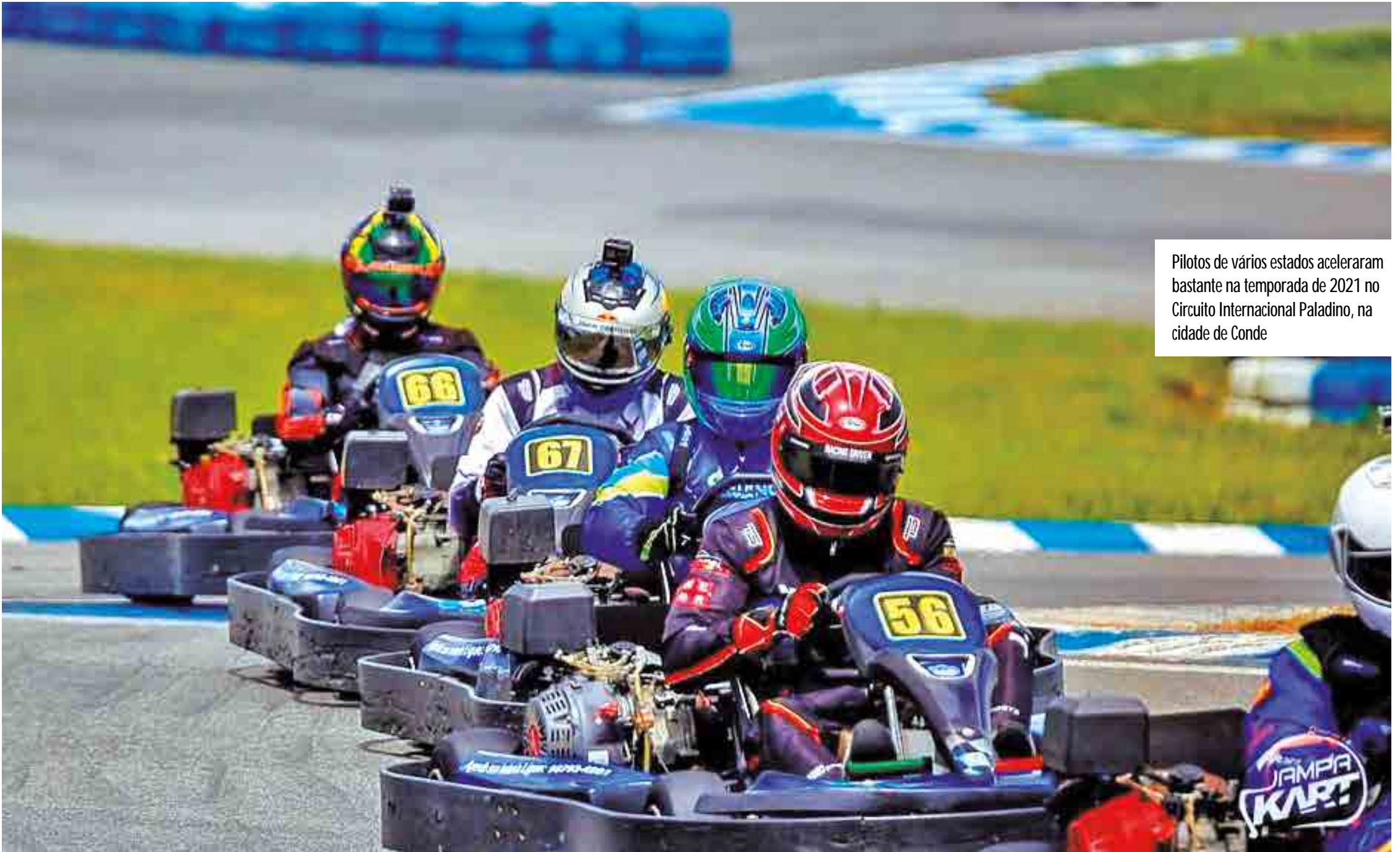
Pilotos de vários estados aceleraram bastante na temporada de 2021 no Circuito Internacional Paladino, na cidade de Conde