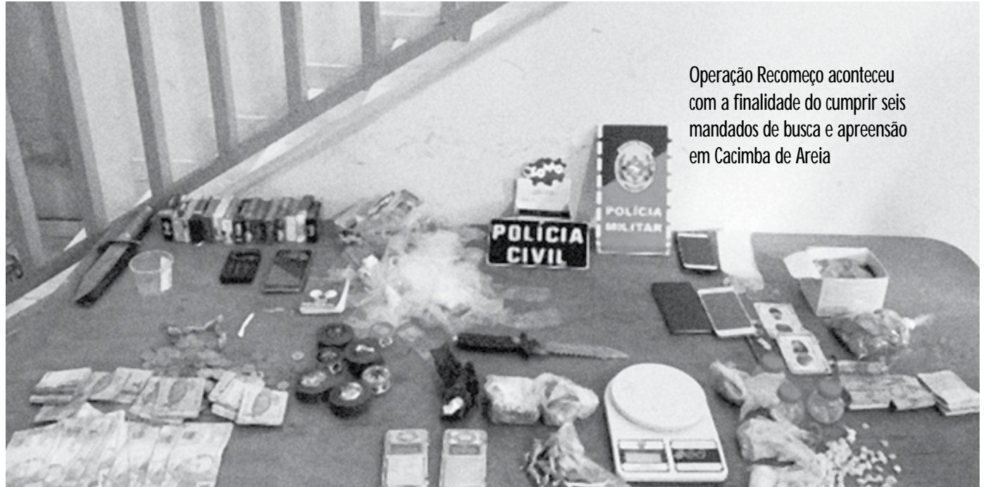
Operação Recomeço aconteceu com a finalidade de cumprir seis mandados de busca e apreensão em Cacimba de Areia