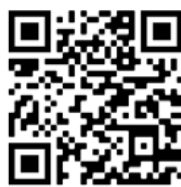
Através do QR Code acima, acesse o portal oficial da Lei Aldir Blanc na PB

Na Lei Aldir Blanc, o Plano de Ação do Estado da Paraíba foi o quarto no país a ser aprovado e recebeu R$ 36.164.540,30 para investir na emergência cultural: renda emergencial direta (inciso I, também chamado Cadastro Cultural PB) e em 12 editais de credenciamento, chamada pública e premiação. A Paraíba também recebeu R$ R$ 450.729,92, que foram revertidos ao estado por causa de municípios que não aderiram à Lei. A Paraíba investiu R$ 17.223.000,00 e devolverá R$ 18.941.540,30.