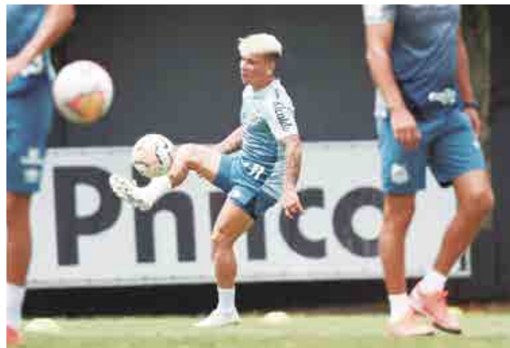
Depois de dois jogos fora, por causa da covid, o venezuelano Soteldo está liberado para jogar