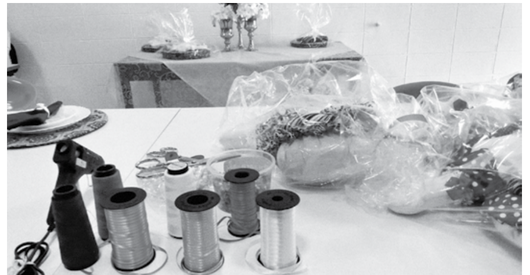
Projeto ‘Castelo de Bonecas’ permite que as detentas trabalhem, aprendam uma profissão e reduzam a pena