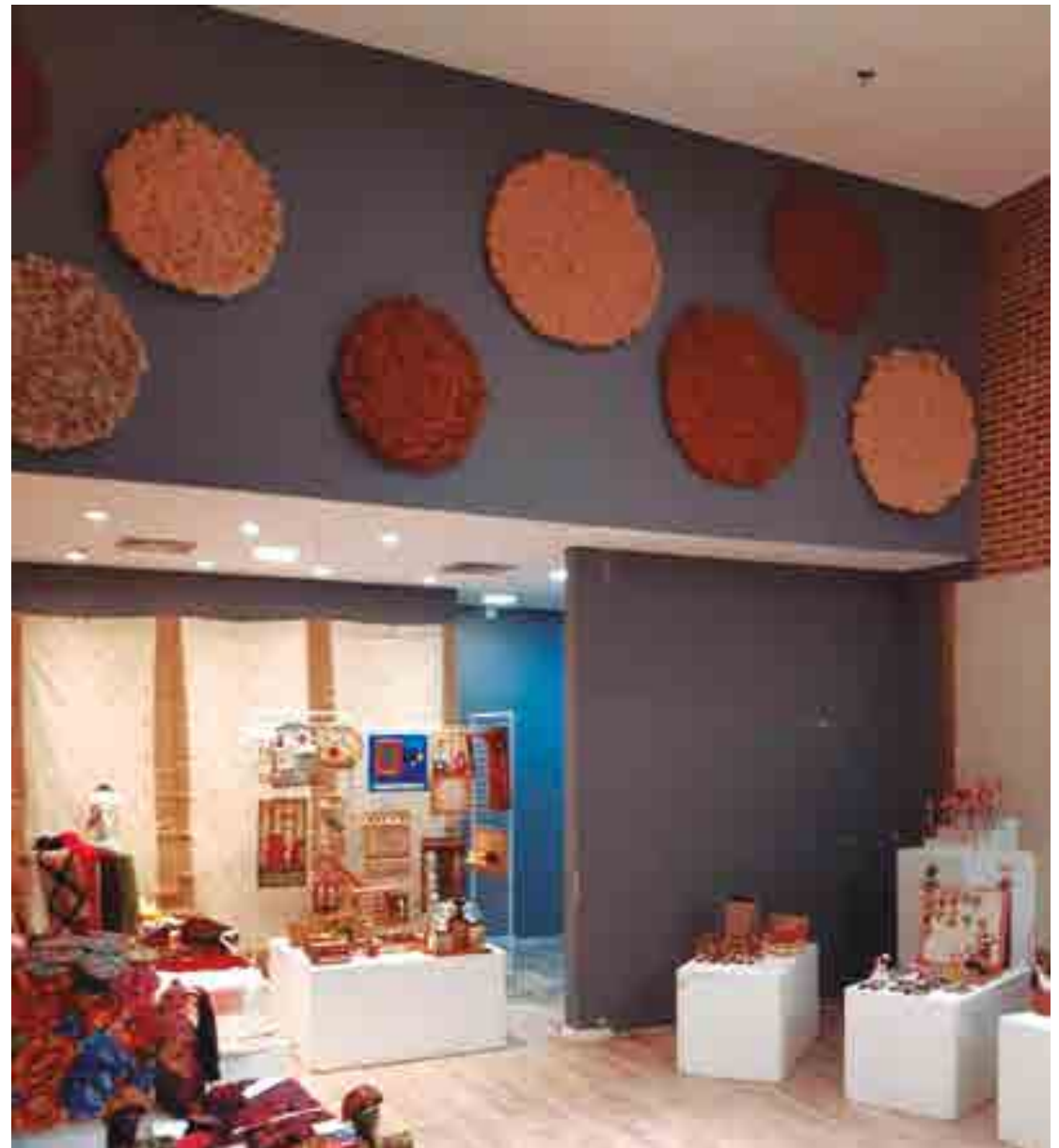
Estão expostos para comercialização artigos típicos da produção do artesanato da região da Borborema

A Feira de Artesanato Rainha da Borborema tem como tema "Feita de Nós" e tem o apoio do Programa de Artesanato Paraibano