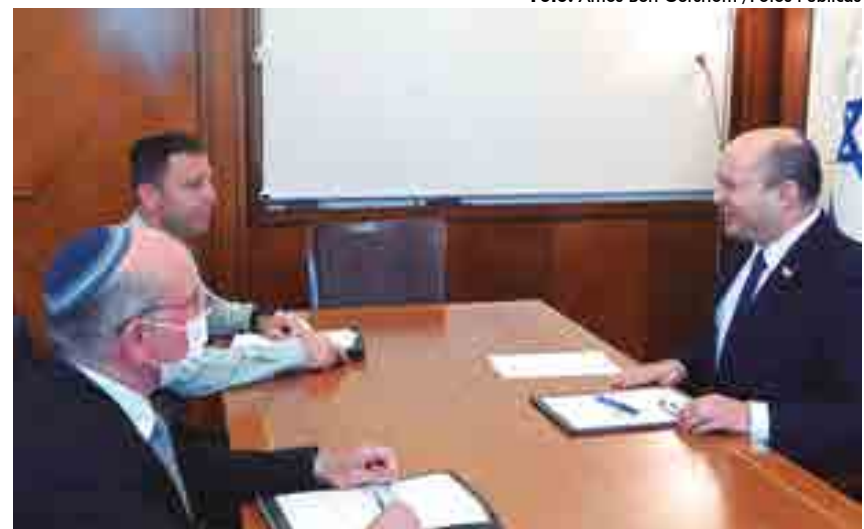
O primeiro-ministro Naftali Bennett (em reunião de trabalho) é um defensor dos colonos israelenses, um dos grandes entraves para os acordos de paz com os palestinos