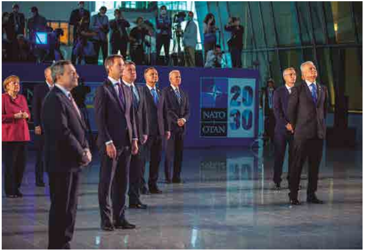
Representantes dos 30 países que integram a Otan se reuniram em Bruxelas e avaliaram como ameaçadoras as ambições militares russas e chinesas

Biden também conversou com aliados sobre o encontro que terá na quinta-feira, em Genebra, com o presidente russo, Vladimir Putin. Questionado por jornalistas, ele disse que não divulgaria a estratégia para a reunião. “O que vou transmitir ao presidente Putin é que não estou procurando um conflito com a Rússia, mas que responderemos se o país continuar com suas atividades ameaçadoras”, afirmou. “Não deixaremos de defender a aliança atlântica ou de defender os valores democráticos.”