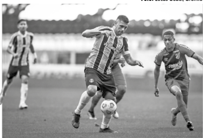
O Grêmio teve alterações nos seus jogos do Brasileirão em três rodadas

O jogo entre Cuiabá e Grêmio, em Cuiabá, por exemplo, não precisará ser adiado em função da Copa América, que ocupa a Arena Pantanal na primeira fase da