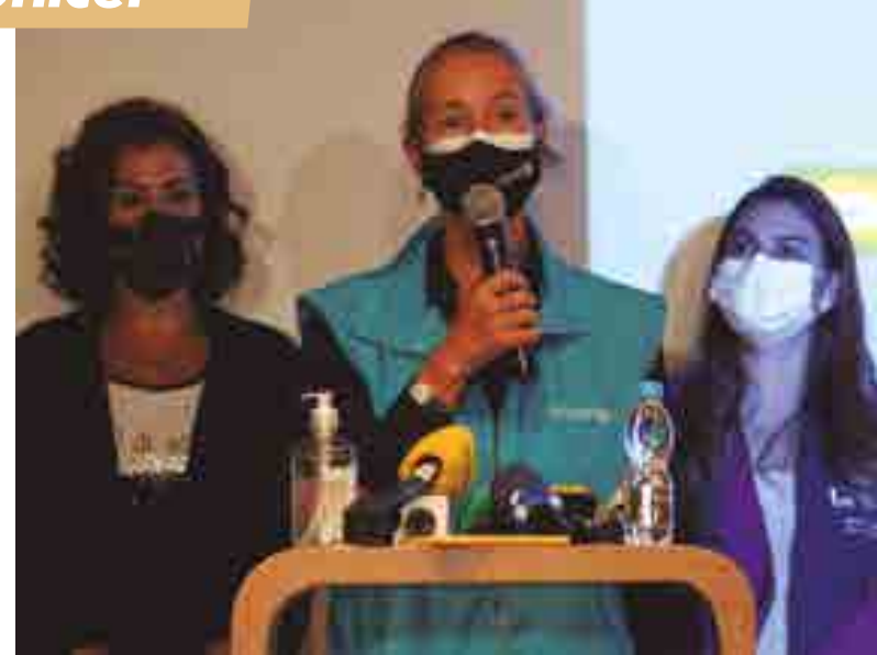
O lançamento da Edição 2021-2024 do Selo ocorreu com transmissão no YouTube do Unicef no Brasil