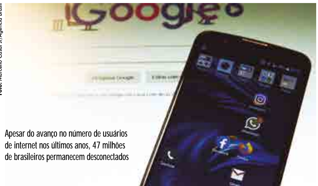
Apesar do avanço no número de usuários de internet nos últimos anos, 47 milhões de brasileiros permanecem desconectados