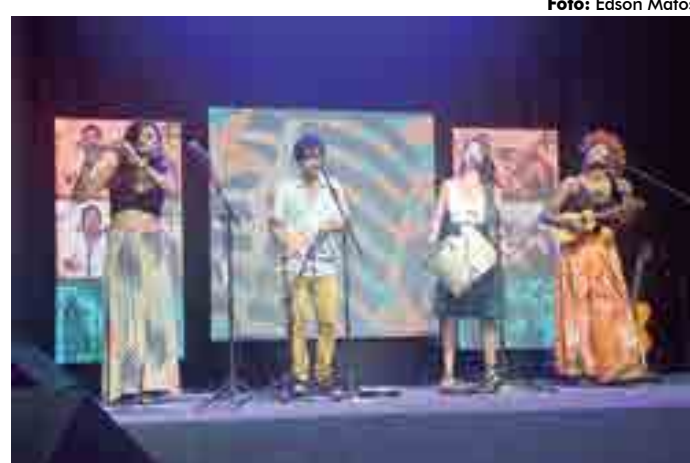
Palco Tabajara especial “Usina Energisa 18 anos” teve muito forró na noite de ontem

“A gente vinha de outra formação, mas reduzimos devido a algumas dificuldades. Achei que seria um modo diferente de fazer um forrozinho, sem sanfona. Uma responsabilidade grande, mas nos encontramos nesse quarteto. Não estamos em condições de ser mais expansivo, até pela pandemia