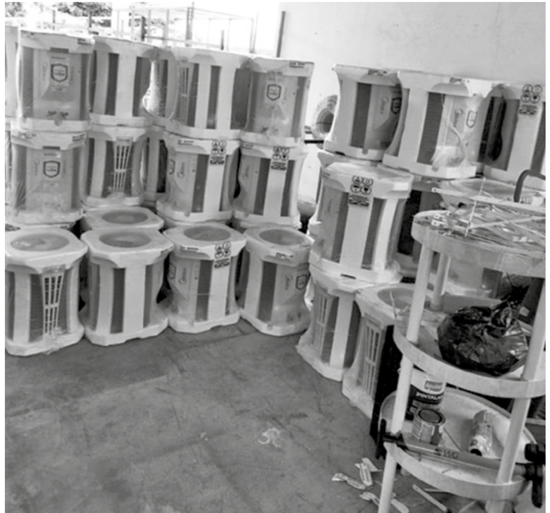
Após apreender os aparelhos, a Polícia Civil está à procura dos envolvidos com o roubo e receptação dos produtos