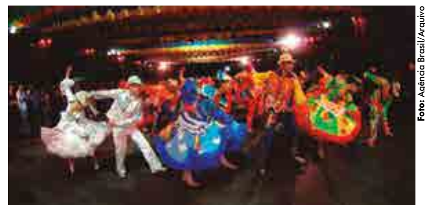
Danças e músicas típicas ajudam a criar o clima propício para a formação dos novos casais

As festas juninas são realizadas no Brasil desde a época colonial e têm como principal fator de motivação a celebração dos dias de três santos principais da Igreja Católica: São João, Santo Antônio e São Pedro. A devoção e os festejos dedicados a esses santos produziram ao longo do tempo uma série de simpatias, ou seja, rituais supersticiosos, típicos do catolicismo popular.