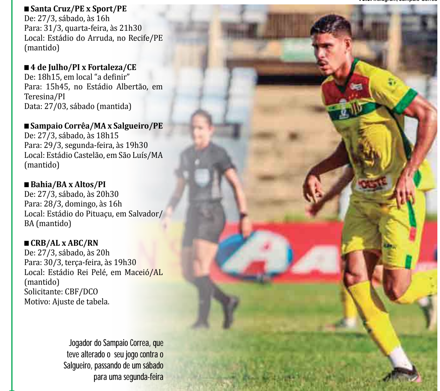
Jogador do Sampaio Correa, que teve alterado o seu jogo contra o Salgueiro, passando de um sábado para uma segunda-feira

De: 27/3, sábado, às 20h Para: 30/3, terça-feira, às 19h30 Local: Estádio Rei Pelé, em Maceió/AL (mantido) Solicitante: CBF/DCO Motivo: Ajuste de tabela.