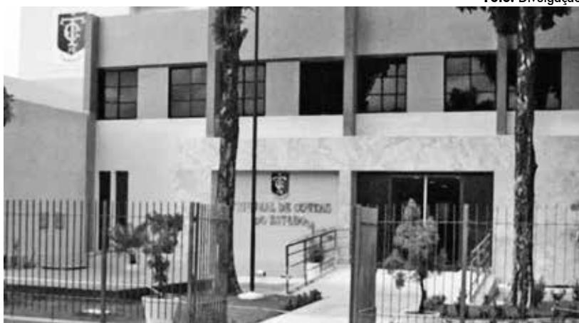
Decisão ocorreu durante sessão ordinária da 2ª Câmara do Tribunal de Contas do Estado

terou que os recursos são provenientes do Fundo Nacional de Saúde (FNS) e que chegou ao município com vinculação às ações de combate ao novo coronavírus. Tendo em vista a origem dos recursos – do Governo Federal –, o processo será encaminhado ao TCU, a quem caberá as providências, inclusive em relação à comunicação à Controladoria Geral da União (CGU) e possíveis representações junto ao Ministé-