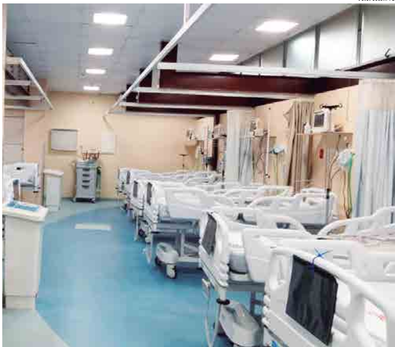
Novos leitos para pacientes com covid-19 do Hospital de Emergência e Trauma, em João Pessoa, que passou a contar com 45 vagas, sendo 25 deles de UTI