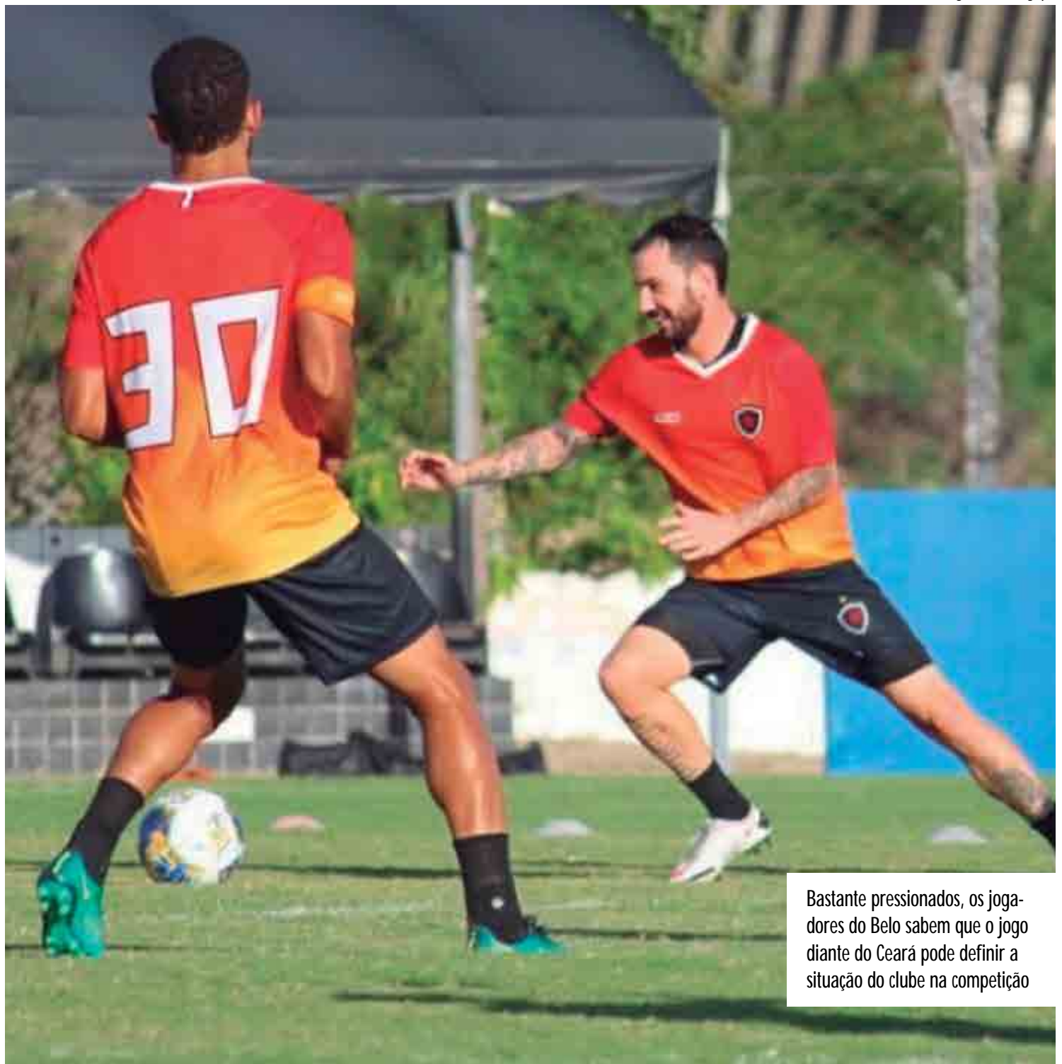
Bastante pressionados, os jogadores do Belo sabem que o jogo diante do Ceará pode definir a situação do clube na competição

Nos quatro jogos disputados, o Botafogo empatou três e perdeu um, aparecendo na sétima posição do grupo B da Copa do Nordeste