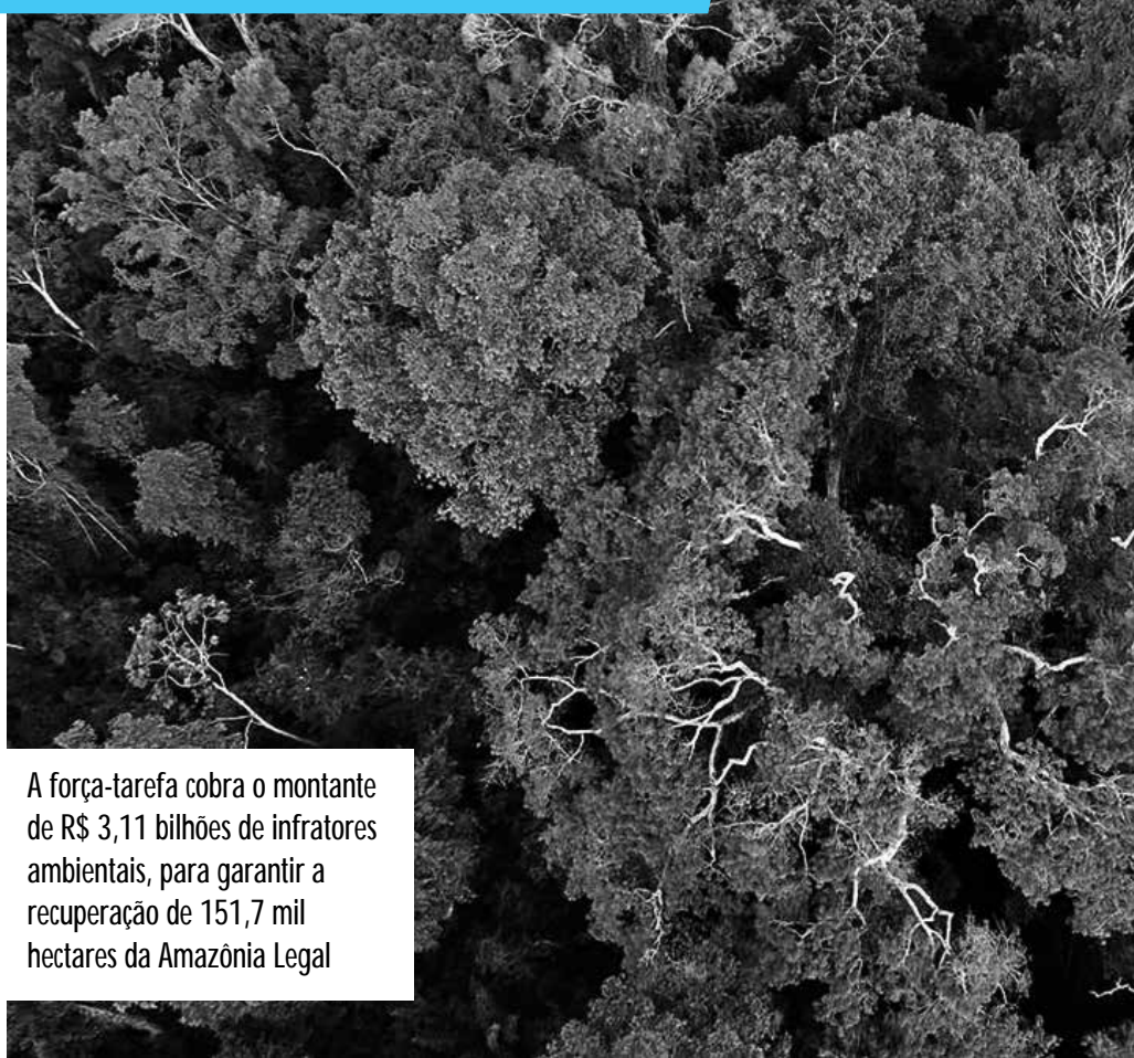
A força-tarefa cobra o montante de R$ 3,11 bilhões de infratores ambientais, para garantir a recuperação de 151,7 mil hectares da Amazônia Legal