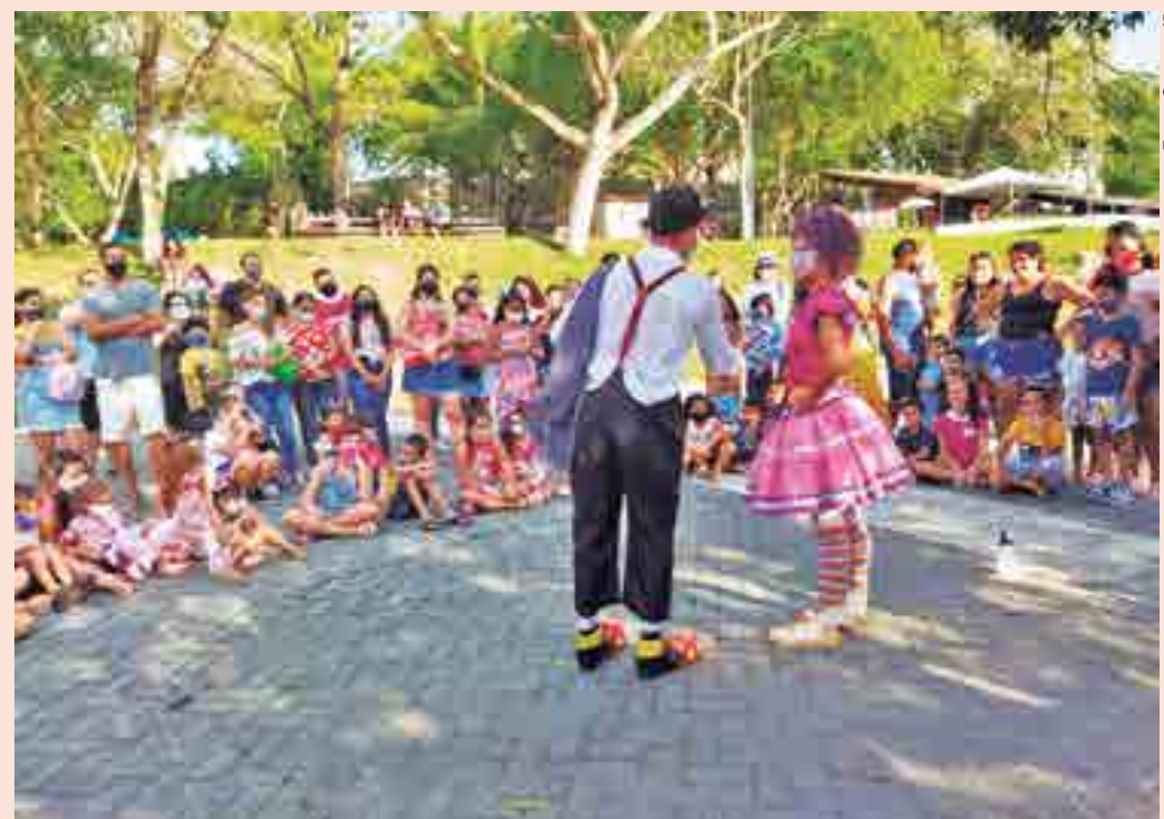
Atrações circenses, como apresentação de palhaços, fazem parte da programação do Projeto ‘Vem Bicar Comigo’