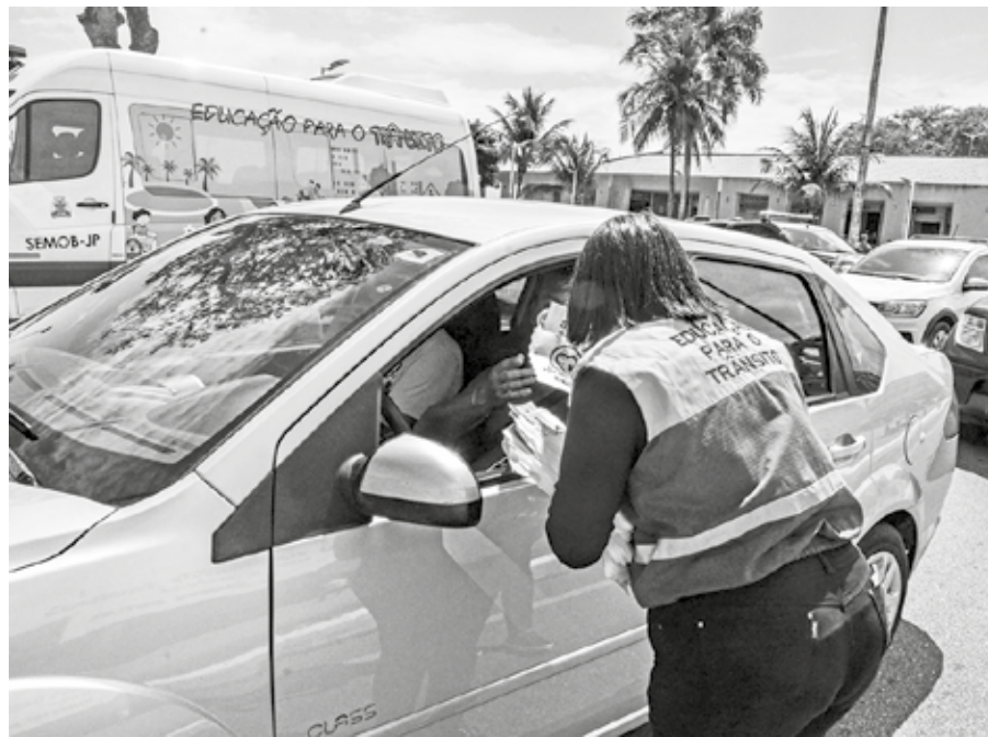
A Divisão de Educação da Semob realizará abordagens em locais e horários diversos