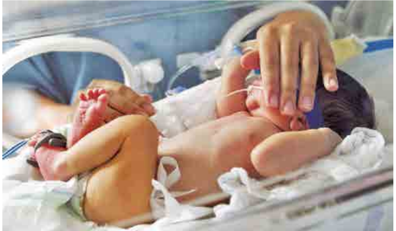
Carta-compromisso será divulgada e buscará engajamento de autoridades na luta pelo atendimento adequado às gestantes e aos neonatos