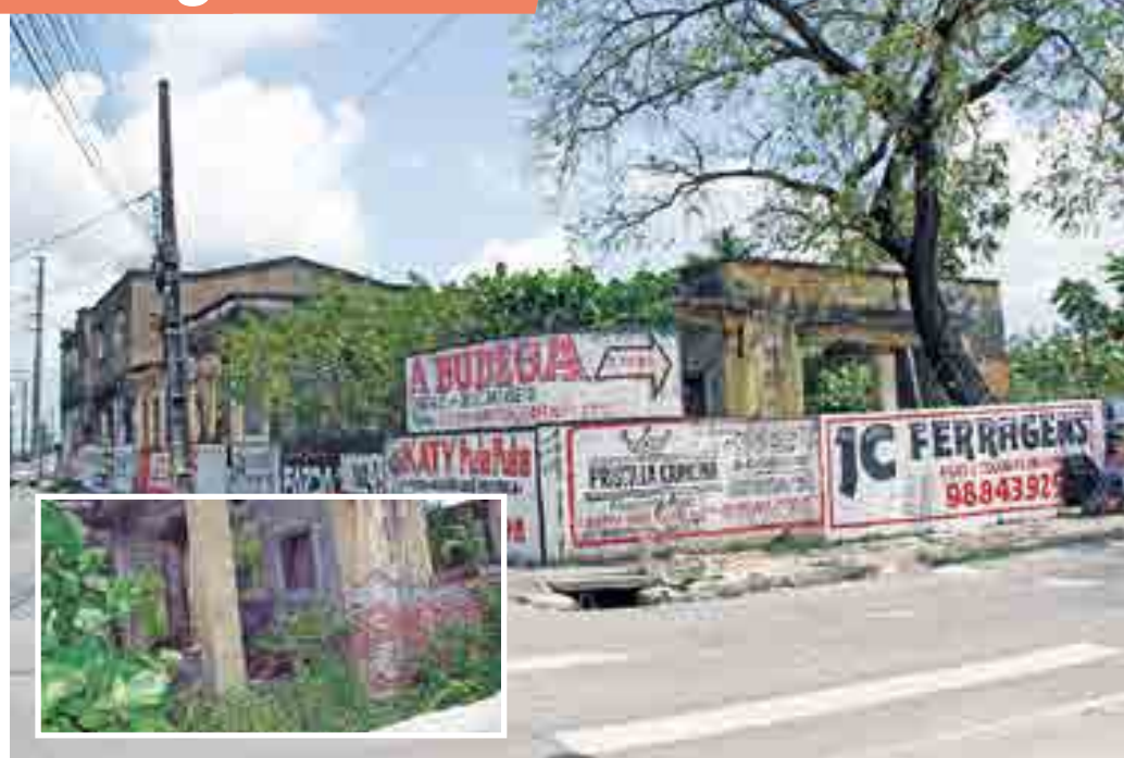
Depois de mais de uma década sem uso, o prédio será transformado no Museu da Medicina Paraibana e numa UBS