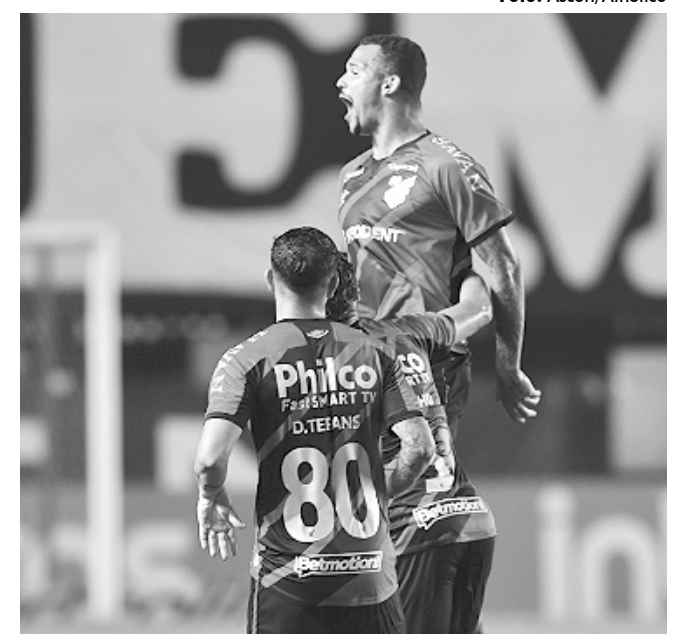
Por ter feito uma campanha melhor, o Athletico vai decidir em casa