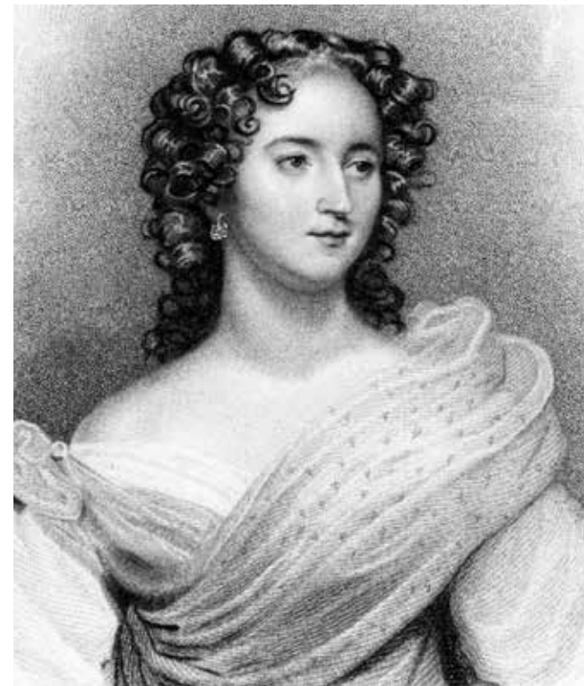
Harriet Smithson, atriz irlandesa apelidada de ‘Mademoiselle Idée Fixe’