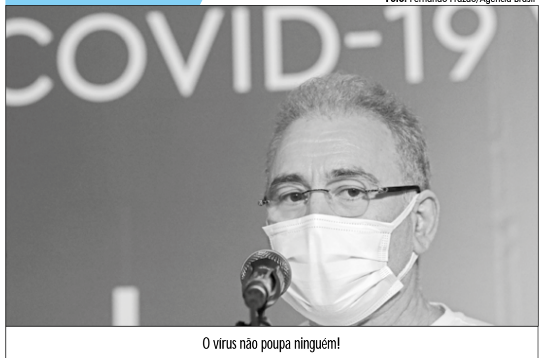
O vírus não poupa ninguém!

SECRETARIA DE ESTADO DA COMUNICAÇÃO INSTITUCIONAL EMPRESA PARAIBANA DE COMUNICAÇÃO S.A.