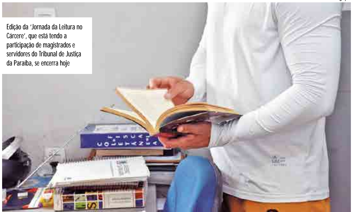
Edição da 'Jornada da Leitura no Cárcere', que está tendo a participação de magistrados e servidores do Tribunal de Justiça da Paraíba, se encerra hoje