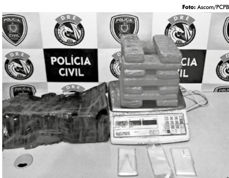
O traficante negociava em sua residência frutas, no entanto, o objetivo era despistar a polícia durante as investigações para encontrar o entorpecente

vestigação já durava dois meses e ação aconteceu quando um homem chegou na casa e ao deixar o local estava com um pequeno pacote. Ao ser abordado, os policiais encontraram droga escondida no embrulho. O homem foi autuado em flagrante pelo crime de tráfico de droga.