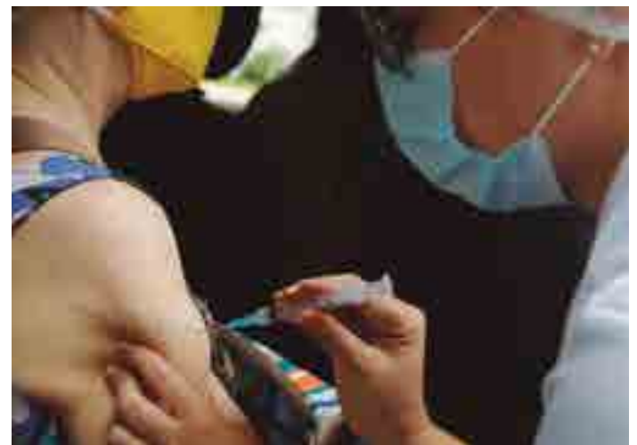
Cerca de 255 milhões já receberam ou as duas doses ou a dose única

Agora, o bloco como um todo já vacinou 70% de sua população adulta, o que significa que pelo menos 255 milhões de pessoas já receberam ou as duas doses das vacinas da Pfizer/BionTech, AstraZeneca ou Moderna ou uma da Janssen, da Johnson & Johnson, de dose única.