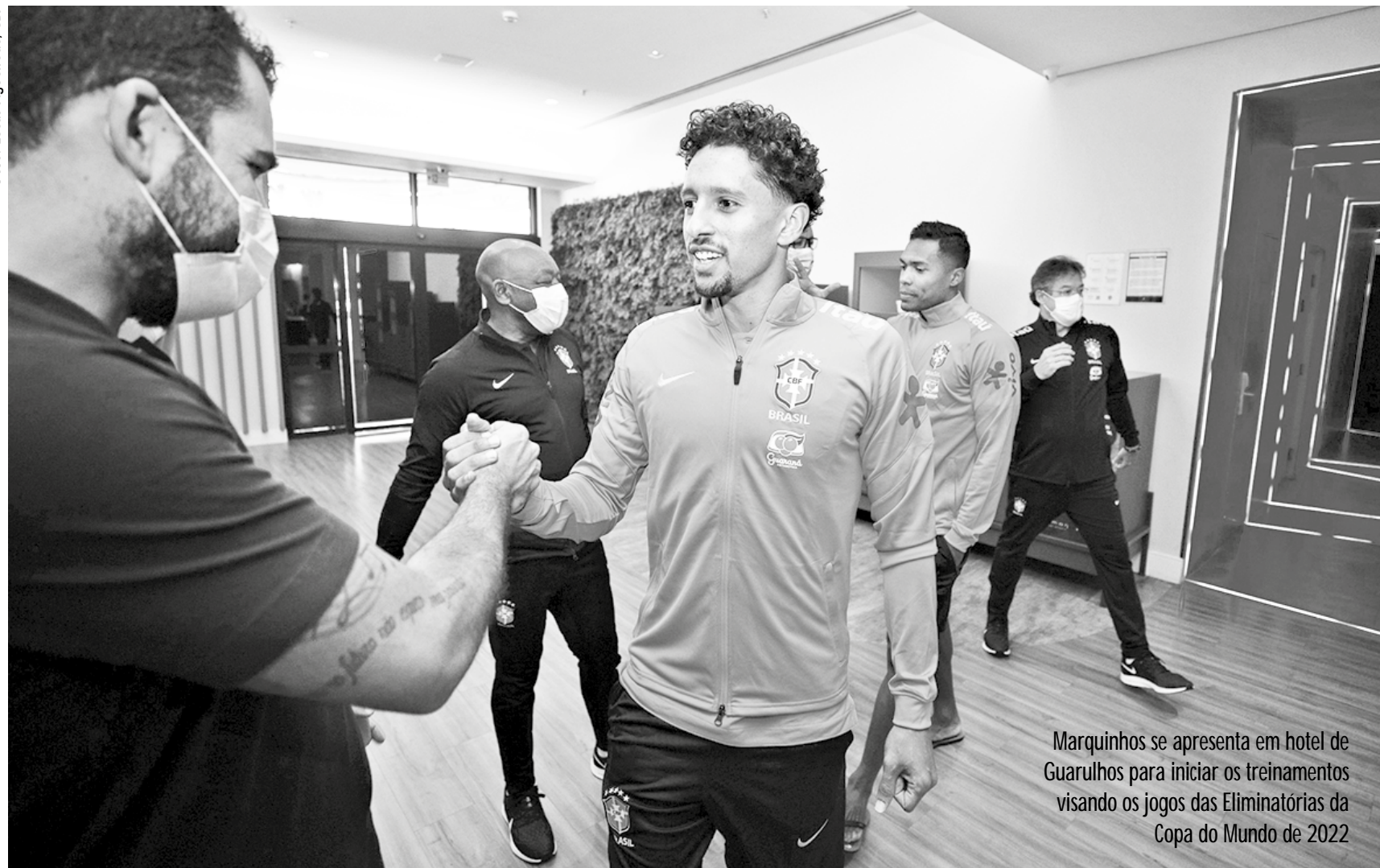
Marquinhos se apresenta em hotel de Guarulhos para iniciar os treinamentos visando os jogos das Eliminatórias da Copa do Mundo de 2022