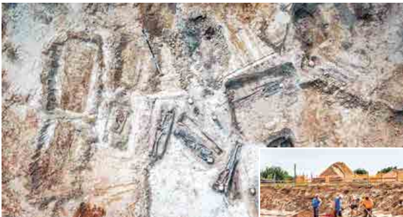
Muitas túmbas encontradas no local guardam os esqueletos de famílias inteiras, vítimas da praga que começou a se espalhar entre os anos de 1710 e 1711

Os restos mortais deverão continuar sendo analisados pelos pesquisadores e, após os exames serem finalizados, serão enterrados em uma vala comum em um cemitério na região.