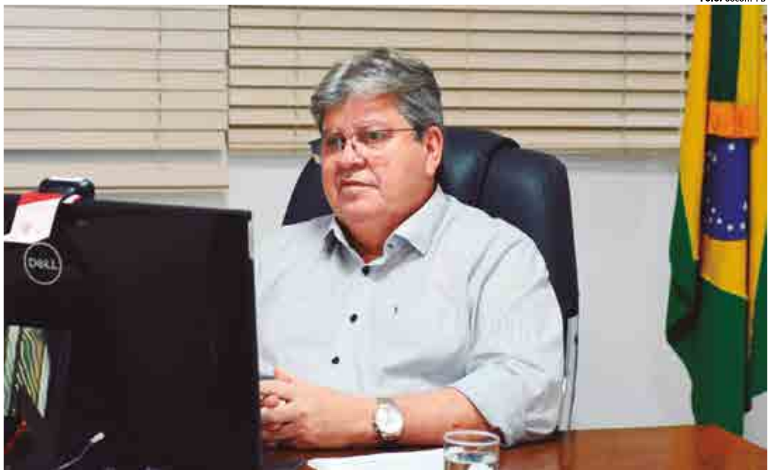
Lei sancionada pelo governador assegura o acesso com prioridade aos serviços públicos de saúde, assistência social, psicológica e também na área jurídica

Para as instituições públicas e privadas que possuem contas nas redes sociais, é preciso que mantenham a atenção nas publicações. Segundo o documento,