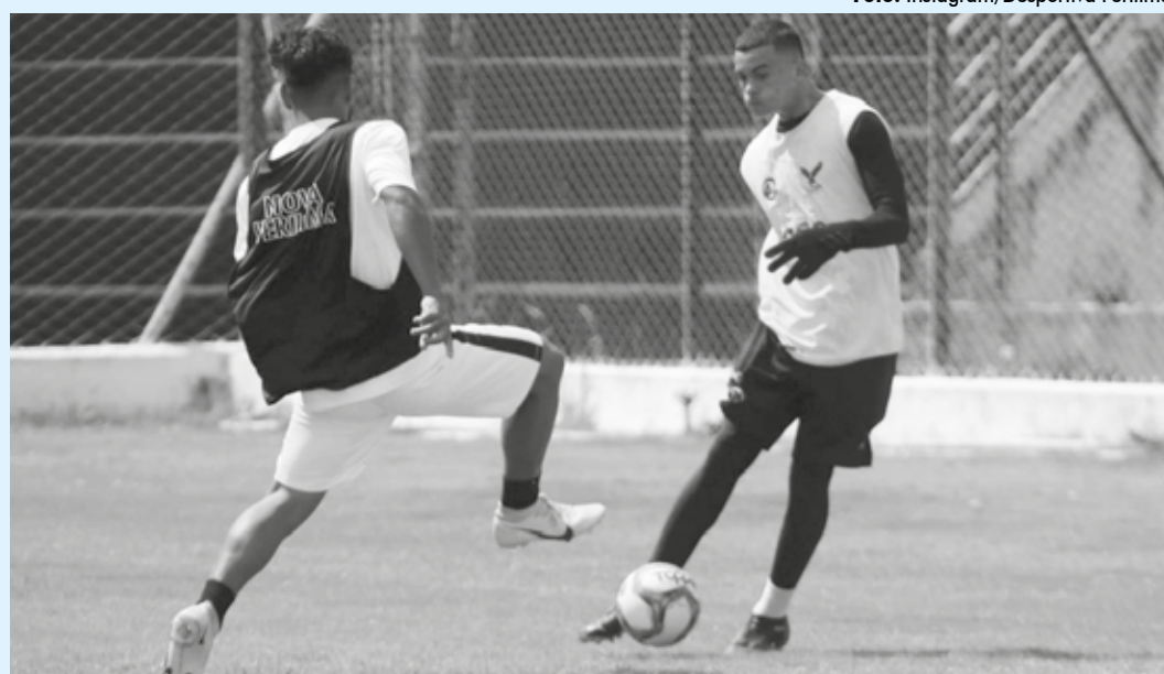
Jogadores da Perilima treinam visando o jogo decisivo de hoje, no Amigão, em busca de abrir vantagem