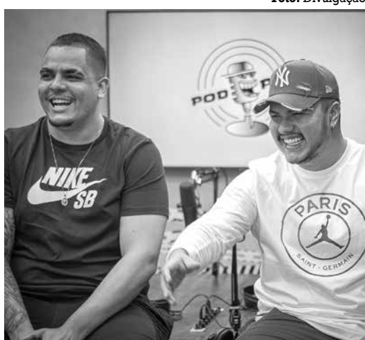
Uma mídia crescente no Brasil, os podcasts explodiram no momento de reaproximação, pós-período pandêmico

E isso provavelmente aconteceu porque lá naquele momento das lives pandêmicas (trocadilho proposital), foi-se percebendo que os usuários de redes sociais têm interesse em longas conversas em vídeo, ainda hoje, como geralmente acontecia em programas grandes de entrevistadores como Marília Gabriela, Pedro Bial, Jô