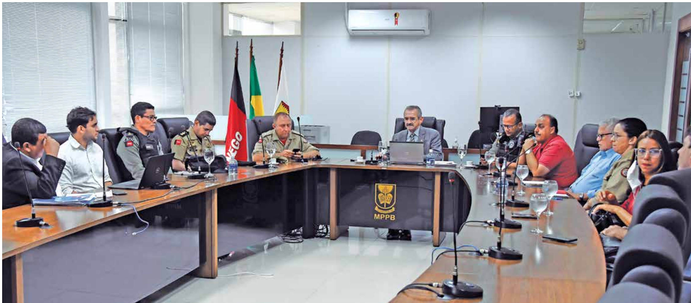
Reunião aconteceu na manhã de ontem, na sede da Procuradoria Geral de Justiça, com dirigentes e gestores dos estádios e, ainda, as Forças de Segurança e o MP