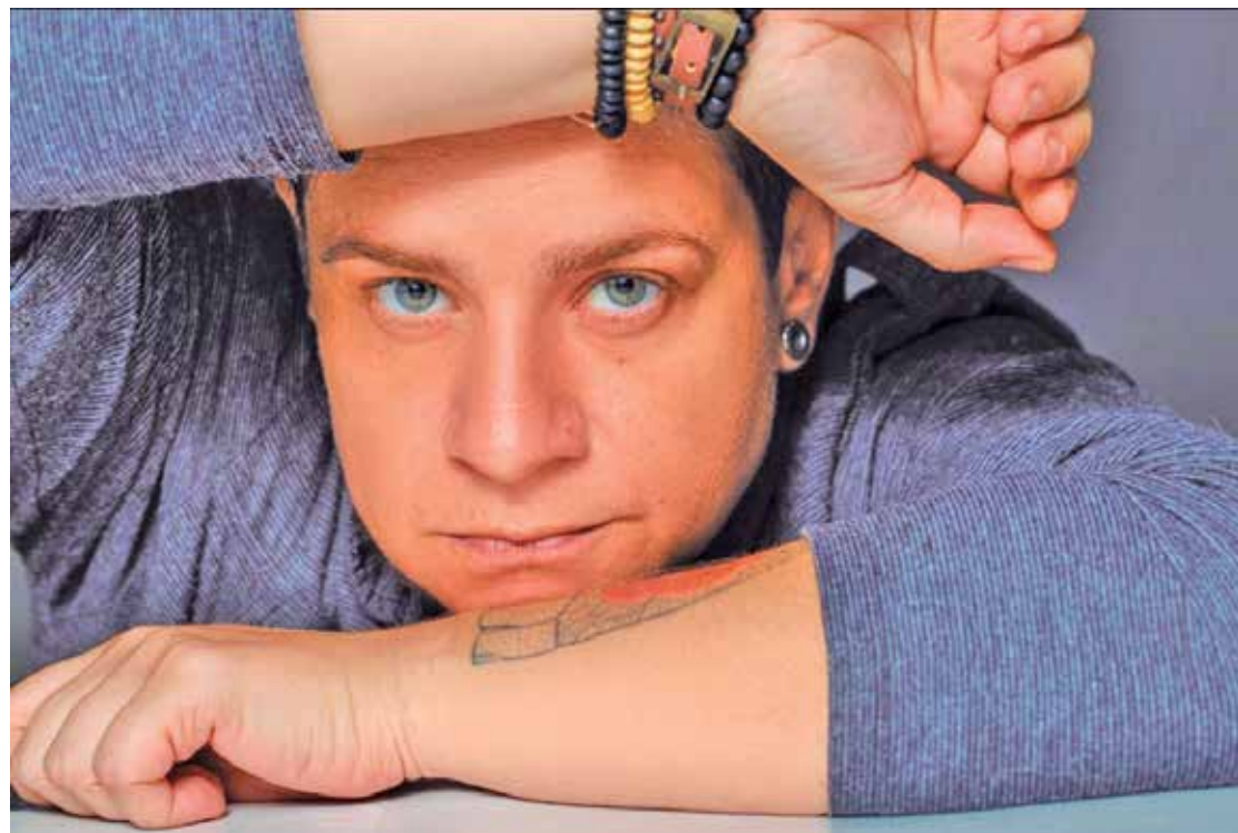
A cantora e compositora Val Donato será a atração da primeira prévia do Baile dos Artistas