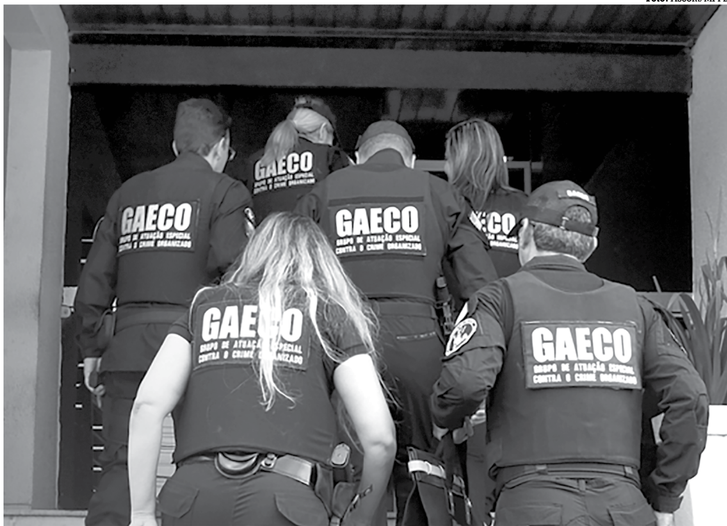
Agentes do Gaeco, da PMPB e da Polícia Civil participaram da operação de busca e apreensão realizada ontem, em Sapé

Foram cumpridos os mandados judiciais de busca e apreensão nas duas cidades paraibanas. O trabalho conta com a participação de três equipes do Gaeco, duas da CGU e duas da Polícia Civil. O nome da operação “Apáte” é oriundo do grego e faz referência a um espírito que personificava o “engano, o dolo, a fraude”.