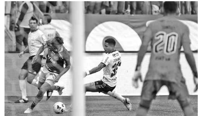
Jogo aconteceu no último domingo, no Allianz Parque