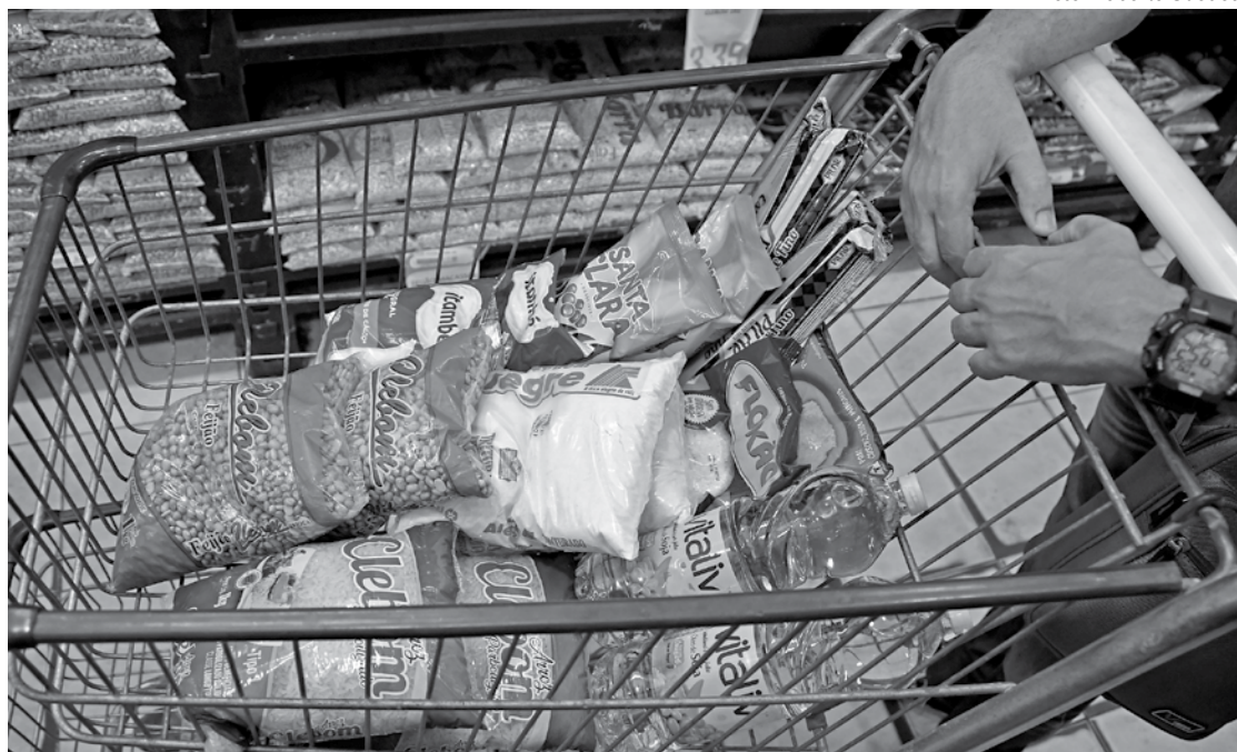
Levantamento do Procon da capital traz preços de 72 produtos coletados em 14 estabelecimentos