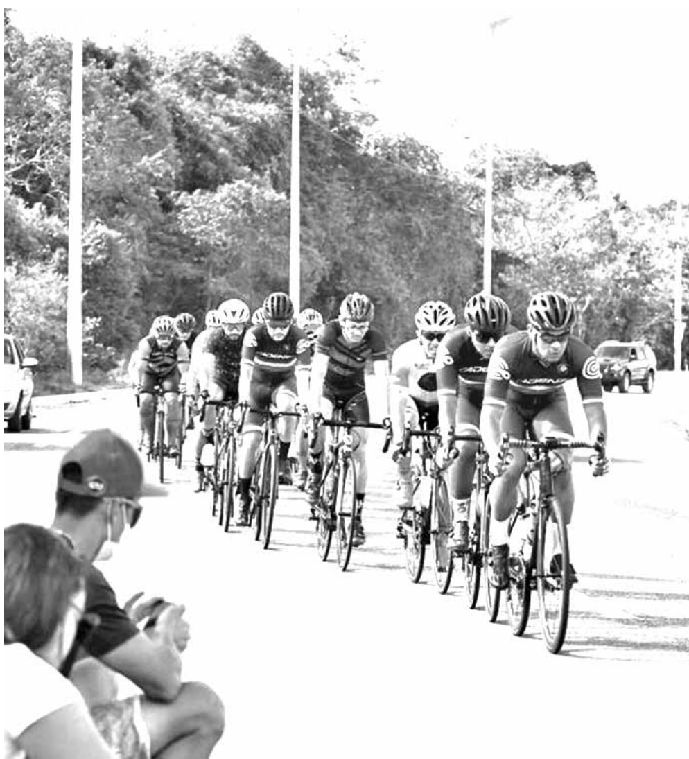
A Volta Ciclística será realizada no dia 11 de setembro, partindo do Centro de Convenções

gundo a organização, é proporcionar experiência de uma competição de ciclismo, oferecendo entretenimento e fomentando o esporte, a saúde e estimulando o turismo local. Essa é a segunda edição do evento que no ano passado aconteceu no mês de dezembro.