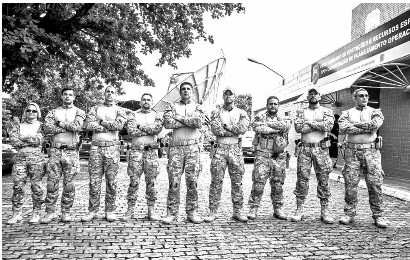
Os primeiros três dias do curso de nivelamento ocorrerão na cidade de Olinda, em Pernambuco, e os demais, na Paraíba

Os policiais participantes do nivelamento terão que cumprir disciplinas de tiro tático e entradas táticas. O treinamento visa promover a capacitação continuada dos policiais civis, além da integração e troca de ideais entre os estados.