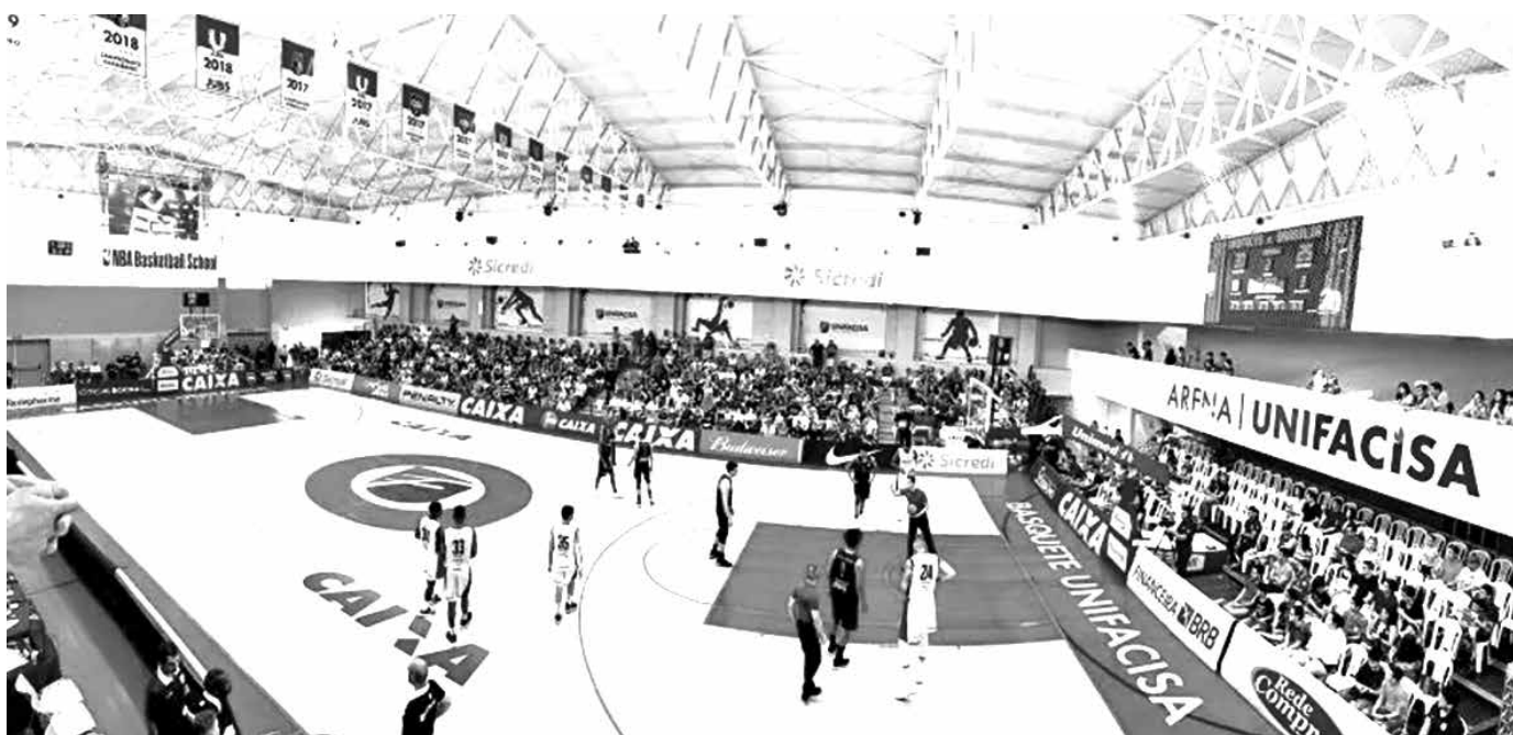
A Arena da Unifacisa, na cidade de Campina Grande, será palco do Sul-Americano de Basquete entre os dias 21 e 23