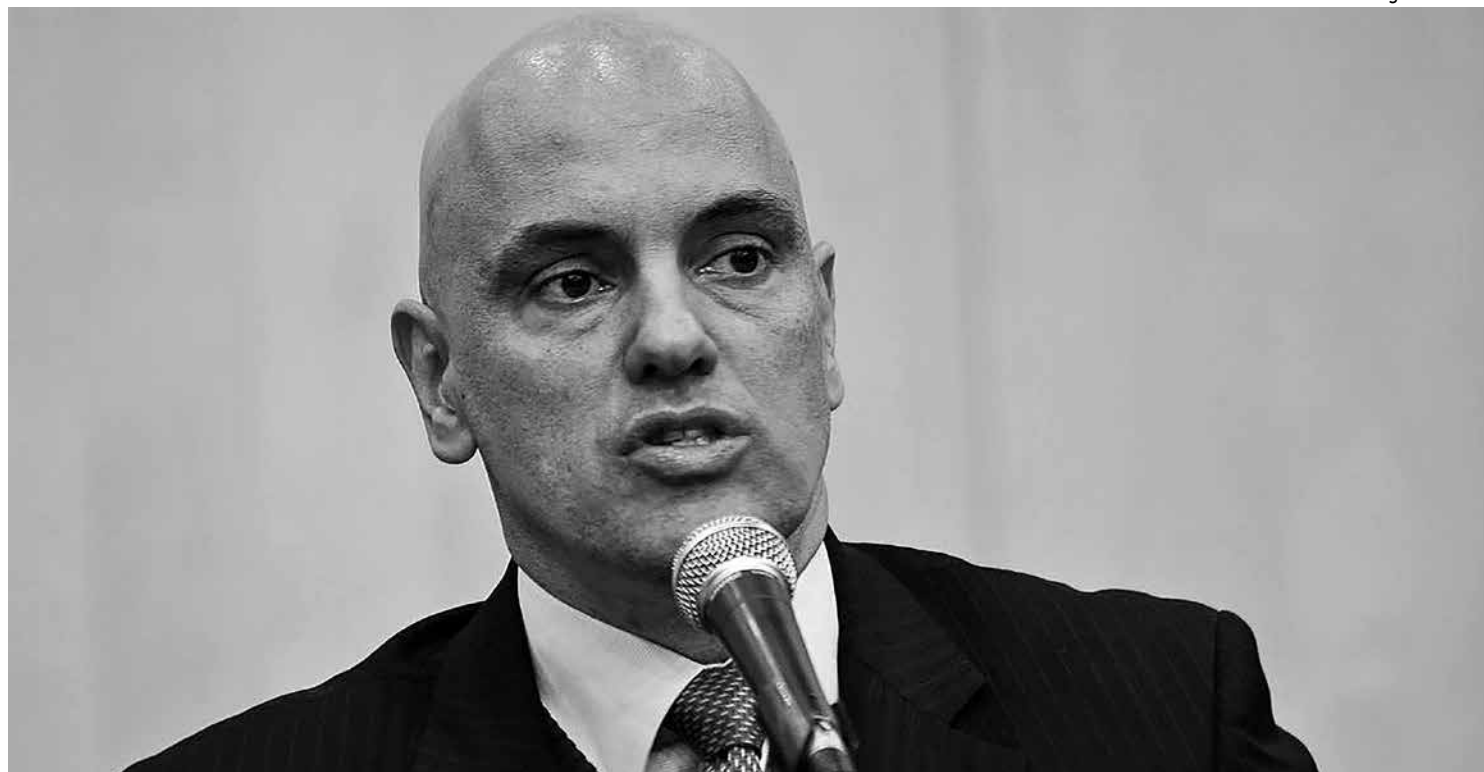
A operação foi aberta por determinação do ministro Alexandre de Moraes para apurar mensagens em defesa de um golpe de Estado

Ao solicitar a diligência, a Procuradoria-Geral da República ressaltou que a elaboração do relatório era necessária para ‘impulsionar a marcha investigativa’.