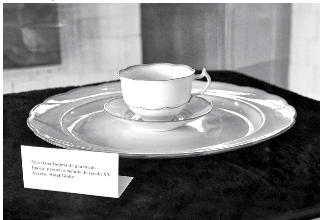
História, beleza e preservação