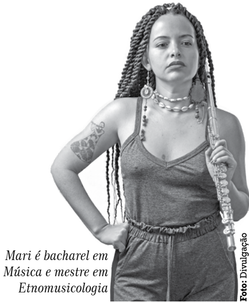
Mari é bacharel em Música e mestre em Etnomusicologia

Com acesso gratuito, acontece no próximo domingo (28), às 17h, na Casa da Pólvora, no Centro da capital paraibana, mais uma edição do Jazz & Beats, um projeto que nasceu em terras paraibanas no contexto de retorno gradual dos eventos culturais em novembro de 2021. Visando atuar nas mais diversas vertentes da cultura popular, música instrumental, jazz, rap e cultura hip-hop, música experimental, música eletrônica e música popular brasileira, o projeto reivindica as raízes das práticas artísticas que, através de formações culturais horizontais e transversais, promovem a cultura em movimento, os processos criativos e a reflexão acerca do acesso às manifestações culturais brasileiras.