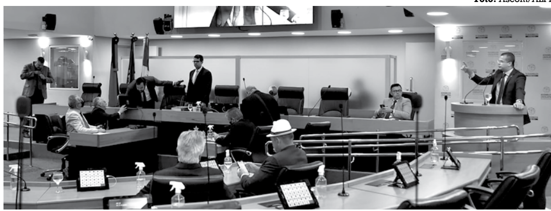
Os deputados aprovaram, por unanimidade, projeto que prioriza mulheres arrimo de família

O parlamentar afirma que é preciso preparar o jovem para exercer o papel estratégico de agente do desenvolvimento rural, através da disponibilidade de linhas de crédito rural específicas para esses jovens, no sentido de estimular a abertura de novos empreendimentos e a manutenção e expansão dos negócios já existentes.