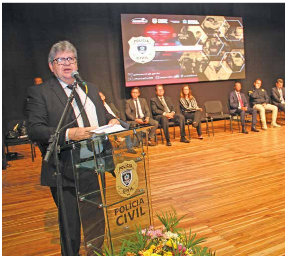
O governador João Azevêdo destacou, durante a aula inaugural do curso de formação dos 535 concursados da Polícia Civil, os investimentos que o Governo tem feito na área de Segurança