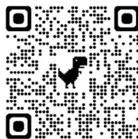
Através do QR Code acima, acesse o site da Funesc

A Funesc prorrogou a inscrição para o edital que selecionará propostas de ocupação dos espaços expositivos. O objetivo é selecionar 13 projetos, distribuídos entre a Galeria Archidy Picado, Território Parahyba de Arte e Muro da Filgueiras. As inscrições podem ser feitas até o dia 30, também no site da instituição.