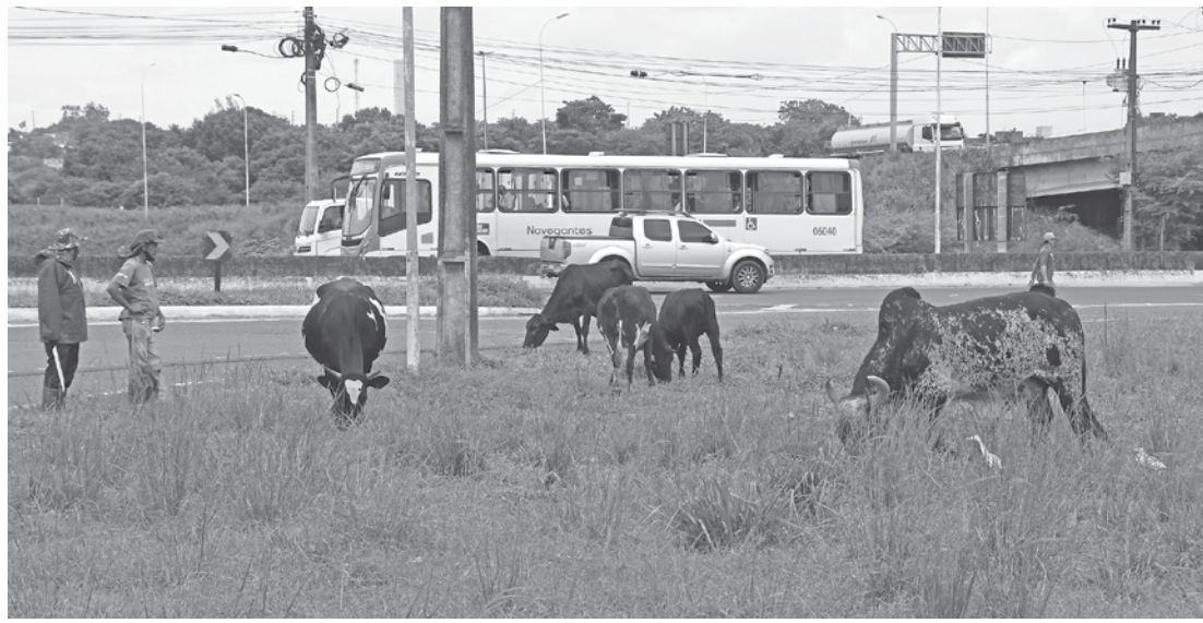
Apesar da supervisão, o perigo!