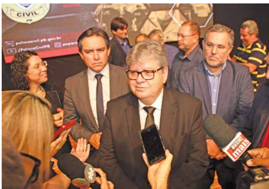
Na conversa com a imprensa e na fala aos aprovados do concurso da Polícia Civil, o governador João Azevêdo chamou a atenção para o compromisso que todos precisam ter com os paraibanos