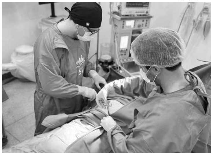
Ação aconteceu em Sousa, Queimadas e Catolé do Rocha

A caravana itinerante do programa Opera Paraíba passou, durante este final de semana, por hospitais de três cidades paraibanas: Sousa, Catolé do Rocha e Queimadas. Ao todo, foram 272 cirurgias realizadas da última sexta-feira (21) até este domingo (23).