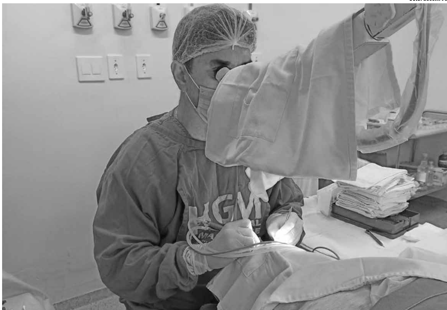
Mutirão faz parte do projeto itinerante do programa, que visa descentralizar os atendimentos cirúrgicos para todo o estado

Para ter acesso ao programa, o usuário precisa ter indicação cirúrgica e encaminhar os exames e documentação pessoal à Secretaria de Saúde de seu município ou realizar o cadastro no site operaparaiba.pb.gov.br. O procedimento é agendado por meio da Central Estadual de Regulação e segue a ordem de inscrição.