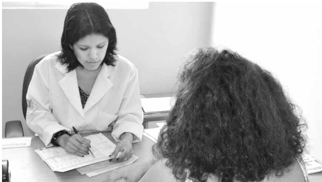
Mulheres de 25 a 64 anos podem realizar os exames em USFs até as 16h de hoje, na capital