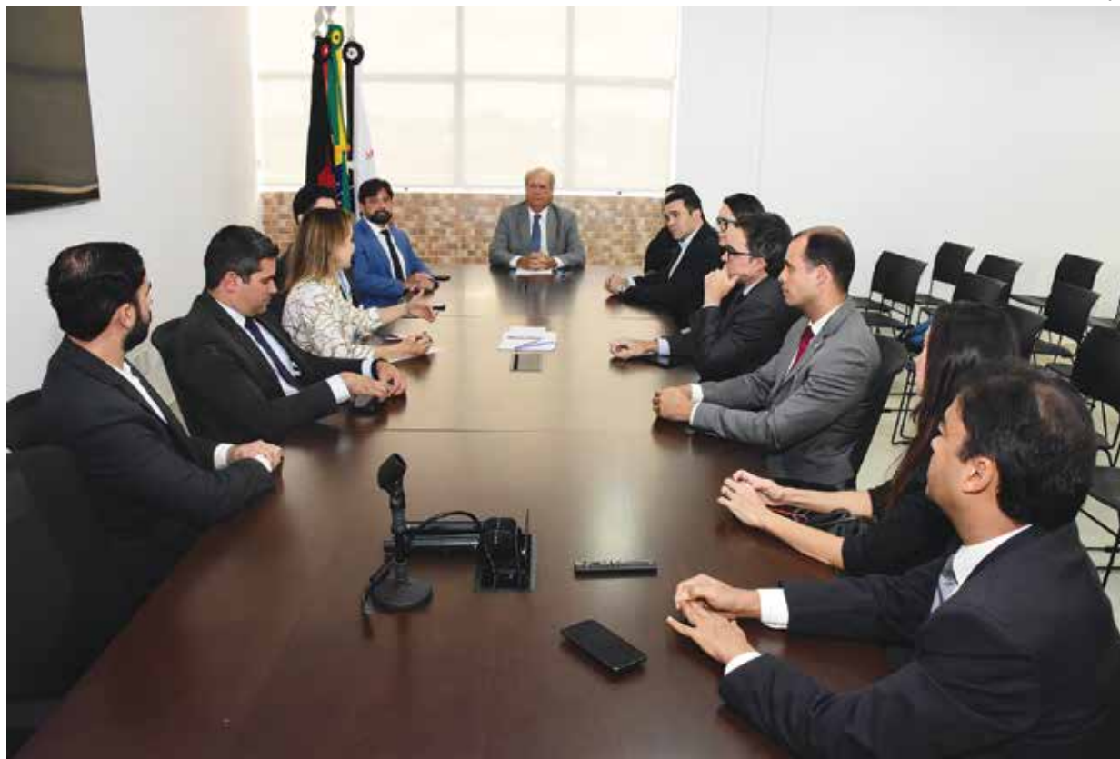
Reunião definiu o funcionamento do Centro Judiciário de Solução de Conflitos e Cidadania da Saúde

Secretaria de Saúde se comprometeu em disponibilizar um grupo de profissionais para interagir com o Centro Judiciário de Solução de Conflitos e Cidadania da Saúde