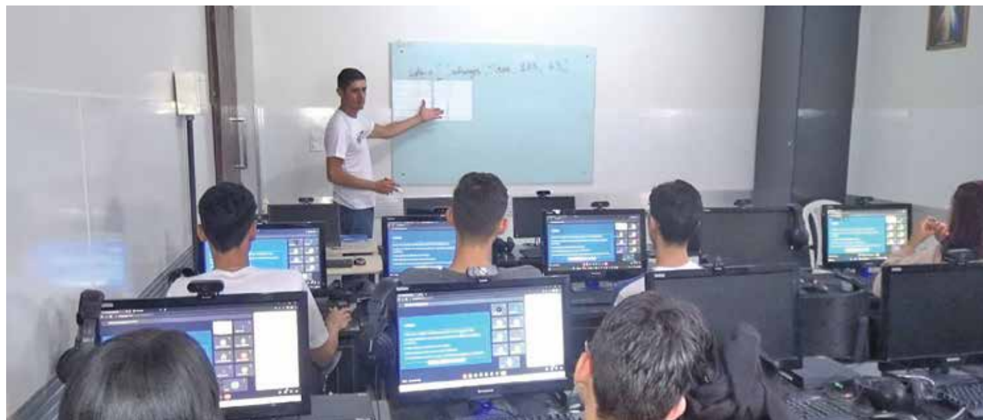
O ensino de programação para as crianças e os adolescentes tem crescido exponencialmente no Brasil e no mundo