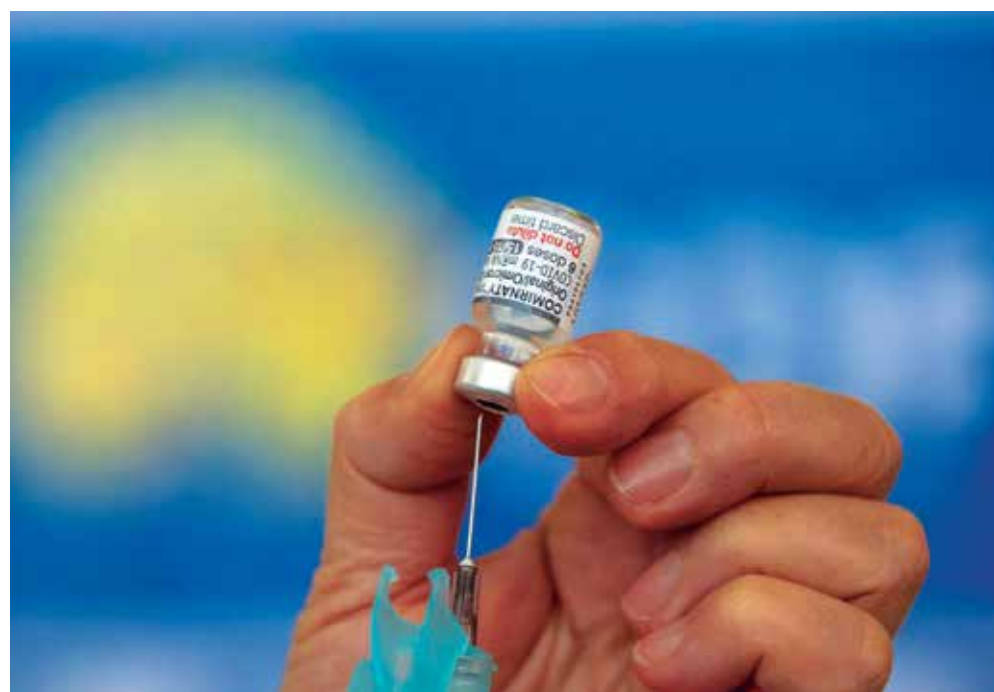
O Ministério da Saúde ressalta que as vacinas têm segurança comprovada e são eficazes

Até o dia 20 deste mês, mais de 10 milhões de pessoas já tinham tomado o reforço bivalente, sendo 8,1 milhões idosos, conforme dados divulgados pelo ministério.