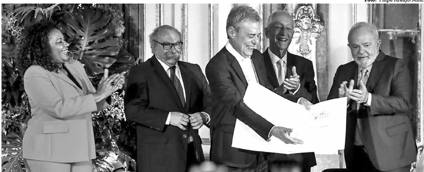
Após quatro anos, o presidente Luiz Inácio Lula da Silva entrega o Prêmio Camões ao cantor e compositor Chico Buarque

Mesmo com a possibilidade da votação da urgência e do mérito nesta semana, o texto não é unanimidade na Câmara. Parlamentares de partidos como PSOL, PDT e União Brasil apresentaram requerimentos para a criação de uma comissão especial, com isso, o texto seria debatido por mais tempo pelos deputados federais.