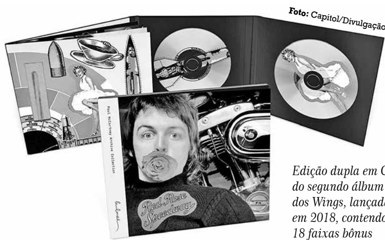
Edição dupla em CD do segundo álbum dos Wings, lançada em 2018, contendo 18 faixas bônus

Felizmente, essa edição dupla Archive Collection está disponível nas plataformas de streaming de música, onde é possível ouvir essas outras faixas raras da sessão de Red Rose... , como 'The mess', lado B do single 'My love' e que se tornou presença obrigatória no repertório dos Wings.