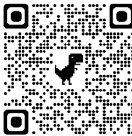
Através do QR Code acima, acesse a audição coletiva

O mais difícil dessa jornada é fazer a mala. Para uma primavera que muda o tempo todo. Frio, ameno, chuva, ventos, e nós, da praia, levamos ou não tal agasalho? E se perder os óculos? Levo dois, por via das dúvidas. E com as brasileiras quer foram presas em Berlin? Com malas trocadas? Lembro do filme O Expresso da Meia-Noite e o terror em Istambul. Quando fui à Turquia há alguns anos, fiquei cismada. E agora? um tal de fotografar a mala, fitinhas de identificação, vejo a hora estampar meu codinome em letras rosa choque. Ó céus! Mas o que nos pegou de cheio foi a necessaire de remédios. Quatro mulheres já com os anos vividos, temos lá as nossas dorezinhas. Para tudo, se precisar. E os anjos hão de orar, para que não precisemos de nenhum. A tecnologia bem que ajuda. Mas também atrapalha, pois falamos com robôs o tempo todo,