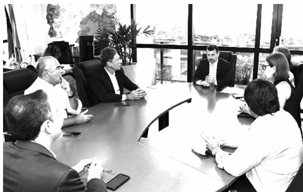
Órgão realizou duas reuniões com vários segmentos da imprensa para construir documento

construídas conjuntamente. Essas orientações foram reunidas na nota técnica, que destacou entre as principais orientações evitar o “efeito contágio” com matérias que façam alusão a “aniversários” de massacres; dar maior ênfase a reportagens que mostram a necessidade de enfrentar o bullying. Em caso de violência a escolas, o recomendável é não divulgar nomes, fotos ou vídeos com os ataques, nem das vítimas. Outra recomendação é a de não mostrar símbolos, roupas, máscaras, armas ou outros objetos usados no ataque; não compartilhar carta, manifesto ou postagem atribuídas aos autores de ataques.