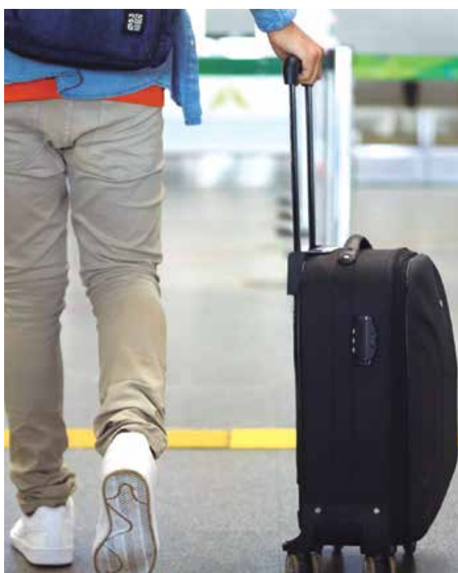
Em alguns casos, o consumidor precisa pagar novo pacote

gens, ele não chega ao estabelecimento de hospedagem”, destaca o diretor de Marketing.