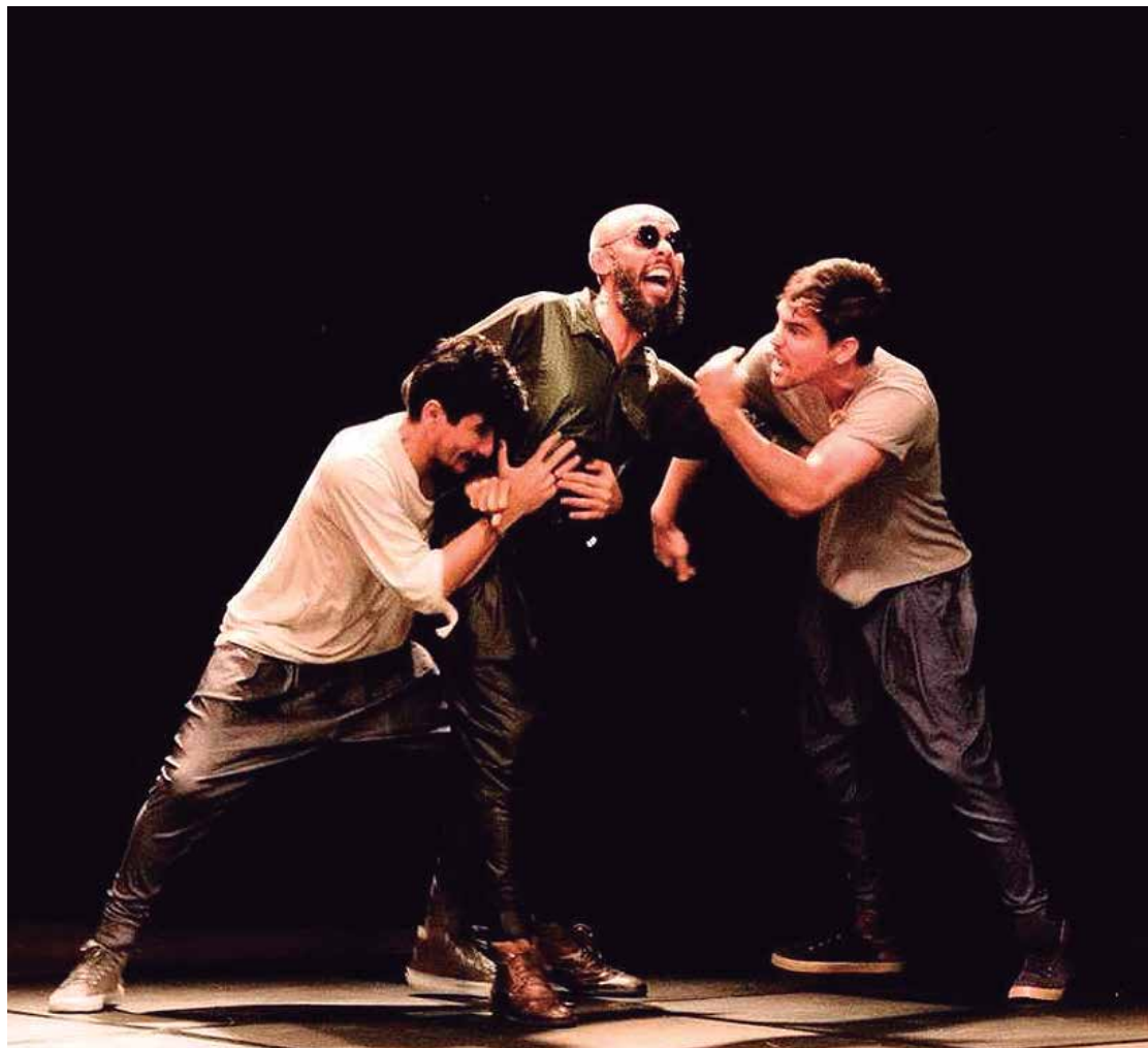
Peça do Grupo Carmin (RN), vencedora do Prêmio Shell, será encenada hoje, no Teatro Municipal Severino Cabral, em Campina Grande, e na próxima quinta-feira (27), no Teatro Santa Roza, na capital paraibana