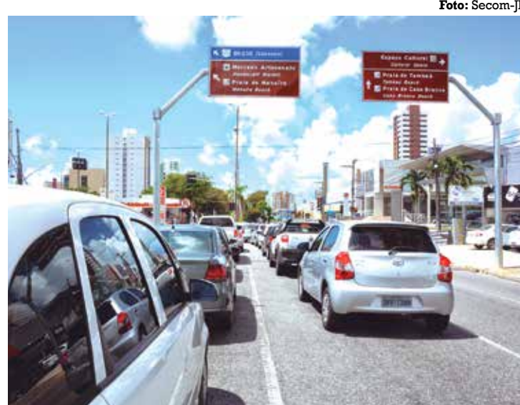
Mais de 175 placas informativas deverão ser confeccionadas

“Estamos trabalhando para melhorar a comunicação visual dos nossos pontos turísticos com os turistas e até mesmo com as pessoas que residem na cidade e que, muitas vezes, não conhecem bem as rotas que devem utilizar para chegar a determinado ponto turístico”, afirmou