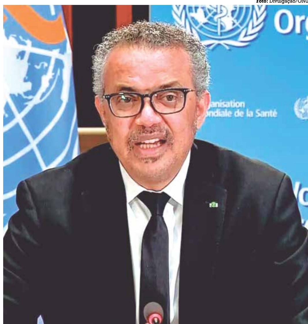
O diretor-geral da OMS, Tedros Ghebreyesus, participou da abertura do evento na Índia

O objetivo é mobilizar compromisso político e ações baseadas em evidências para fortalecer o