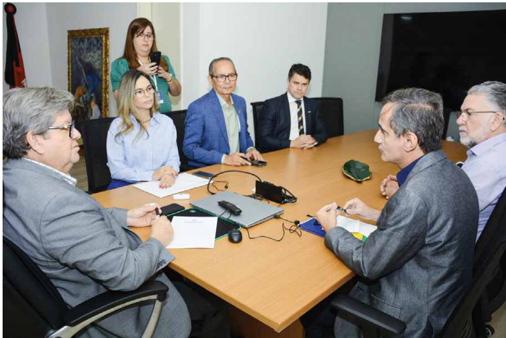
O governador João Azevêdo ressaltou a importância do programa Nota Cidadã para estimular as compras e aquecer o comércio na reunião de ontem

solicita apenas o nome, número do CPF, data de nascimento, e-mail, telefone e a criação de uma senha. Após a finalização, basta exigir, em toda compra no comércio, a nota fiscal com o número do CPF, passando, assim, a concorrer aos sorteios mensais.