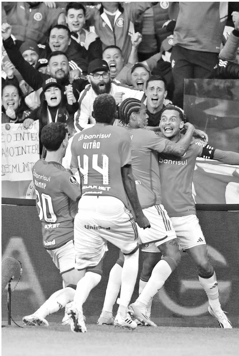
No Beira-Rio, campo do Inter, jogadores comemoram gol junto à torcida em jogo do Brasileiro

tão da transparência, que é uma das principais bandeiras da minha gestão”, afirmou o presidente.