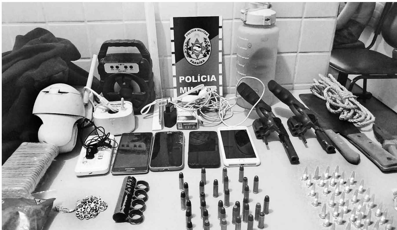
Além das armas, celulares, munições e até câmeras de monitoramento foram apreendidos durante a operação da Polícia Militar

A dupla integrava um grupo criminoso que estava atirando em via pública para intimidar moradores, em uma comunidade do bairro Mário Andrezza. Um dos presos responde por tráfico e tentativa de homicídio e estava foragido da Justiça. Os dois presos residem nos bairros de Tibiri (Santa Rita) e Quadramares (João Pessoa), no entanto, estavam agindo em Bayeux. O caso foi levado para a 5ª Delegacia Distrital, em Bayeux.