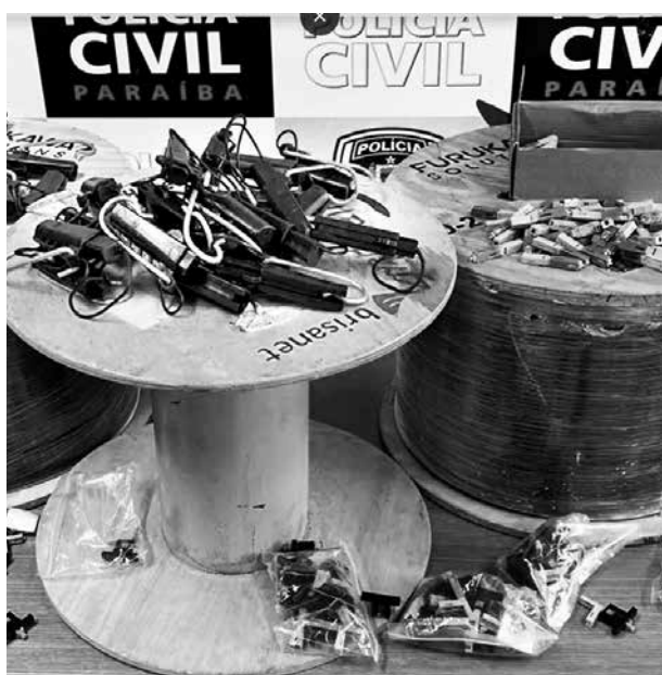
Vários produtos, inclusive fibra óptica, eram vendidos

Quase no mesmo horário, um homem foi preso com um 'paredão de som', que havia furtado no dia anterior, na cidade de Pilar. O delegado João Paulo Amazonas informou que o furto foi praticado por homens que invadiram uma residência vazia, e levaram um carro e o paredão de som.