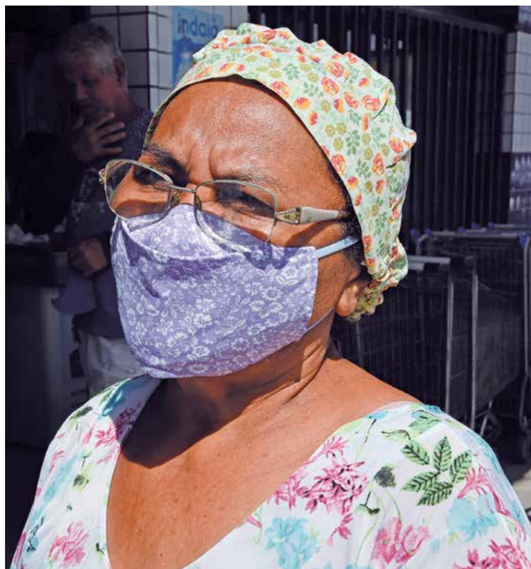
A indicação de máscara é para a população de risco em locais fechados e aglomeração

O Complexo terá 36 aerogeradores em Picuí, 33 em Nova Palmeira, 25 em Pedra Lavrada, 10 em São Vicente do Seridó e quatro em Baraúna