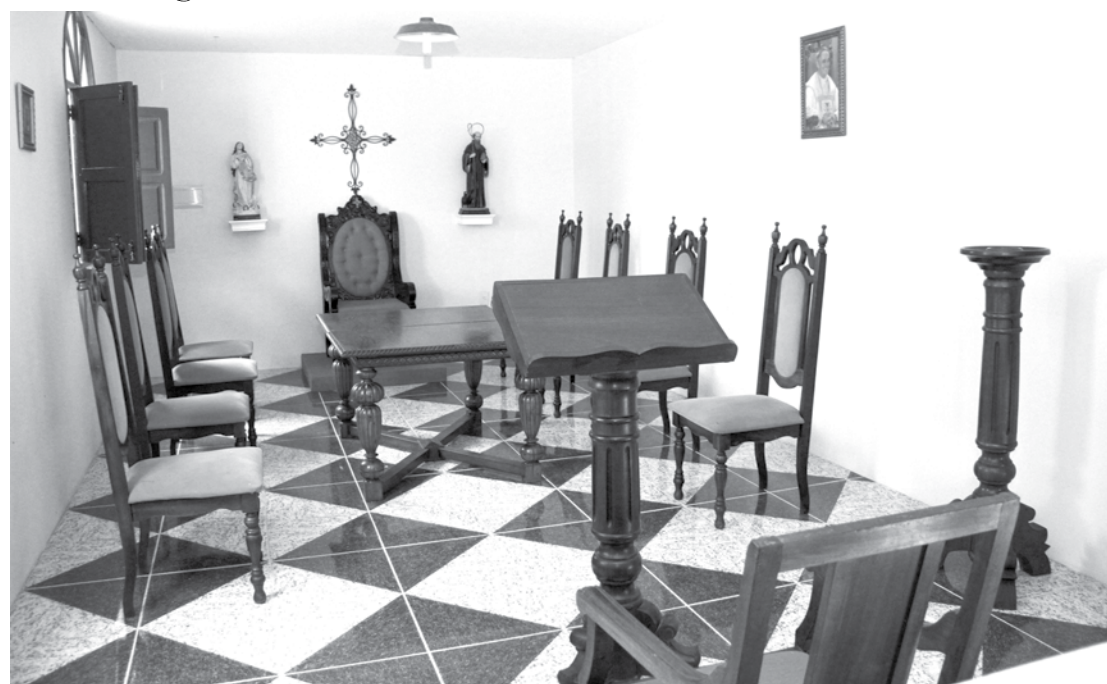
A beleza da arte sacra