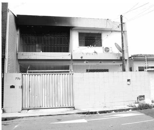
A casa foi fechada e passará por perícia e reforma

A casa de acolhimento é mantida pela Prefeitura Municipal de João Pessoa. Técnicos estiveram no imóvel para uma avaliação.