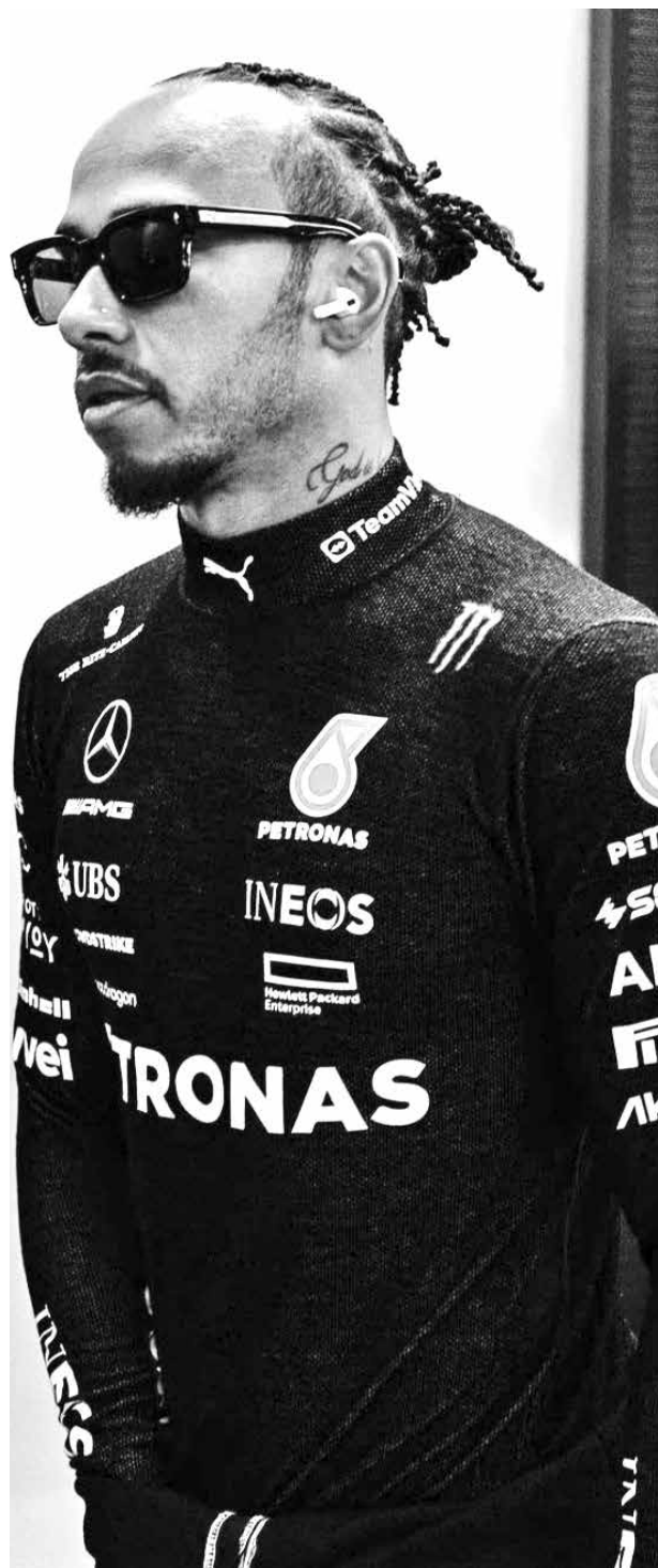
Lewis Hamilton é um dos pilotos da equipe Mercedes

A temporada volta na próxima semana, entre 25 e 27 de agosto, no GP da Holanda, mas Wolff acabou deixando escapar que a ansiedade é por ter um carro competitivo de verdade para o próximo ano. “As velas estão prontas para 2024”, explicou. “Com o desenvolvimento do carro quase parado para este ano, acho bom porque podemos otimizar o carro atual sem olhar muito para atualizações. Vamos ver como podemos realmente colocá-lo em um ponto ideal e, ao mesmo tempo, obter mais compreensão para o próximo ano.”