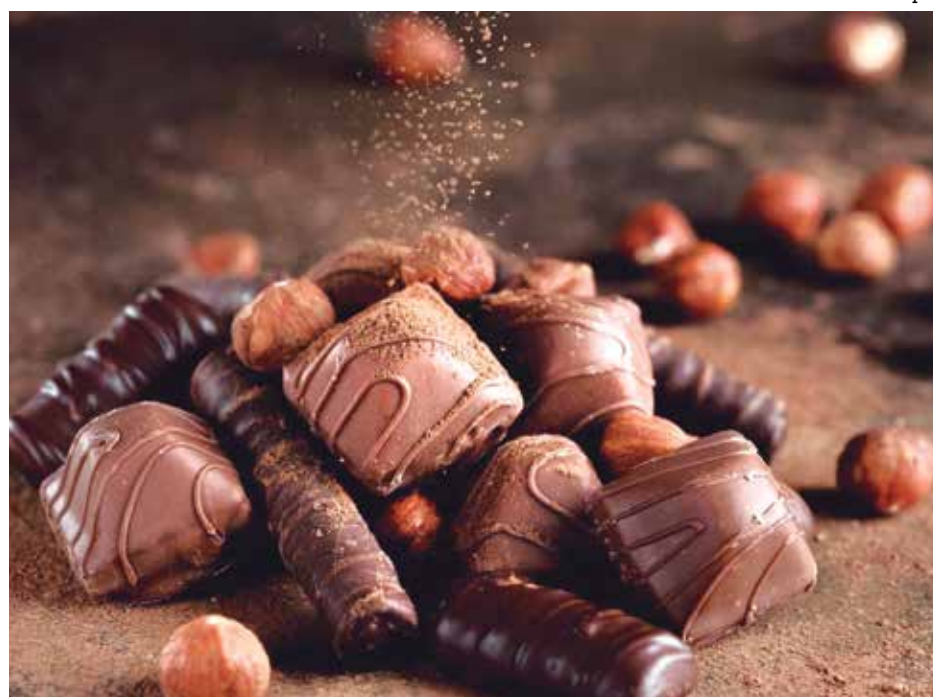
Levantamento foi realizado em três lojas especializadas e em 14 supermercados

O Procon-JP traz preços de produtos como óleo, feijão (cariocinha e preto), arroz parboilizado, café, macarrão, fubá, açúcar, sal, leite em pó e em caixa, margarina, manteiga e biscoitos doces e salgados.