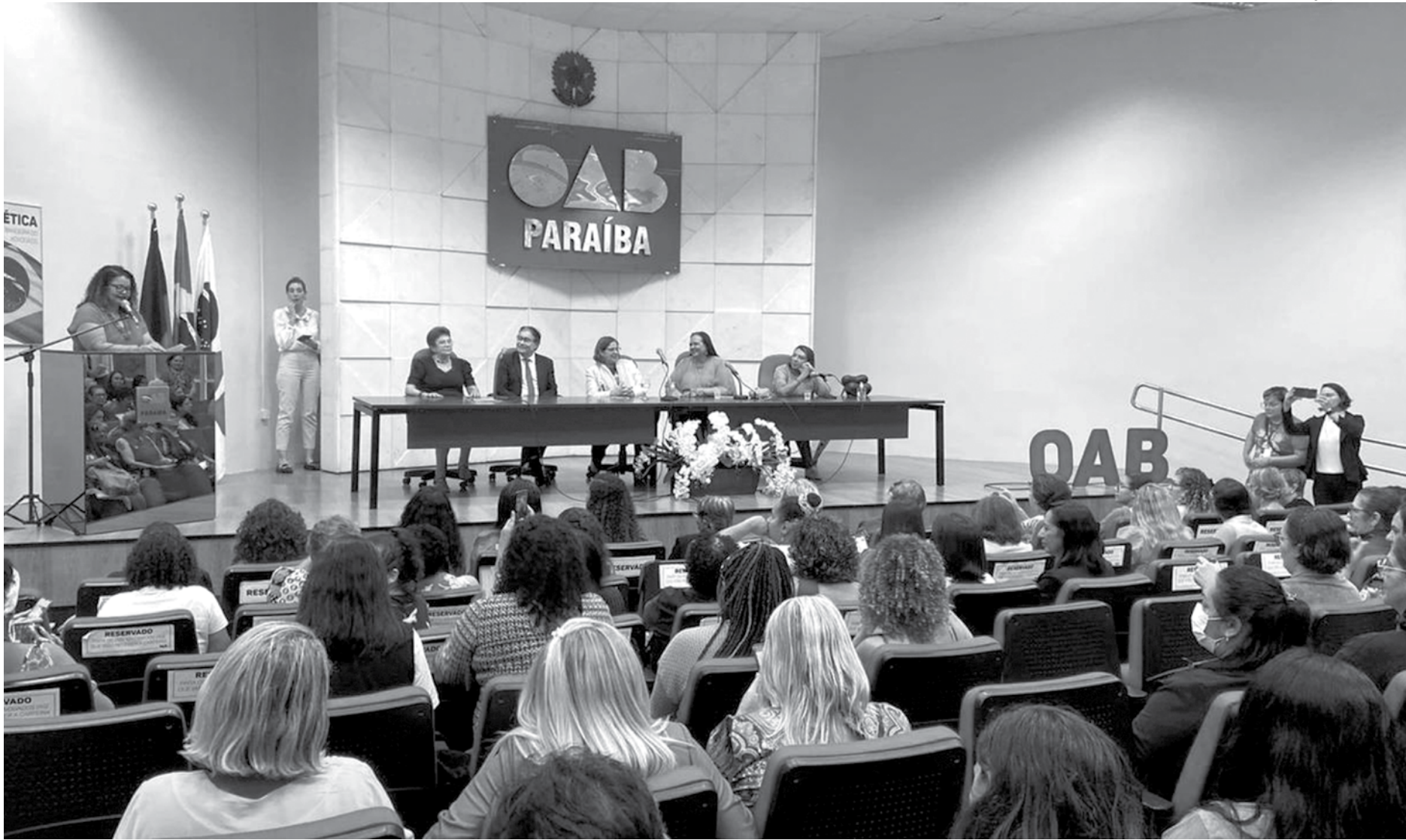
Ministra das Mulheres do Governo Federal, Cida Gonçalves foi à OAB-PB ouvir reivindicações de maior proteção e qualidade de vida em programas para a mulher

ves ainda especificou linhas de combate à violência contra a mulher. Disse que está sendo elaborado um pacto nacional contra o feminicídio, uma marcha contra a misoginia, que é o ódio contra as mulheres, contra a violência doméstica, sexual que está colada no país.