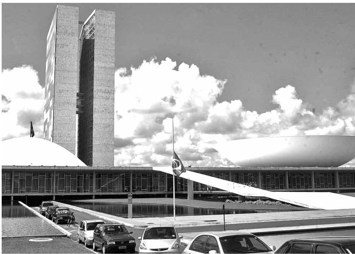
Senadores e deputados receberam os recursos do governo que serão investidos em obras nos estados e municípios sem nenhum critério

■ Após a revelação do uso da emenda Pix, o governo exigiu neste ano que as prefeituras apontem para onde pretendem aplicar o dinheiro. As indicações feitas, no entanto, são genéricas, como "saúde" e "infraestrutura