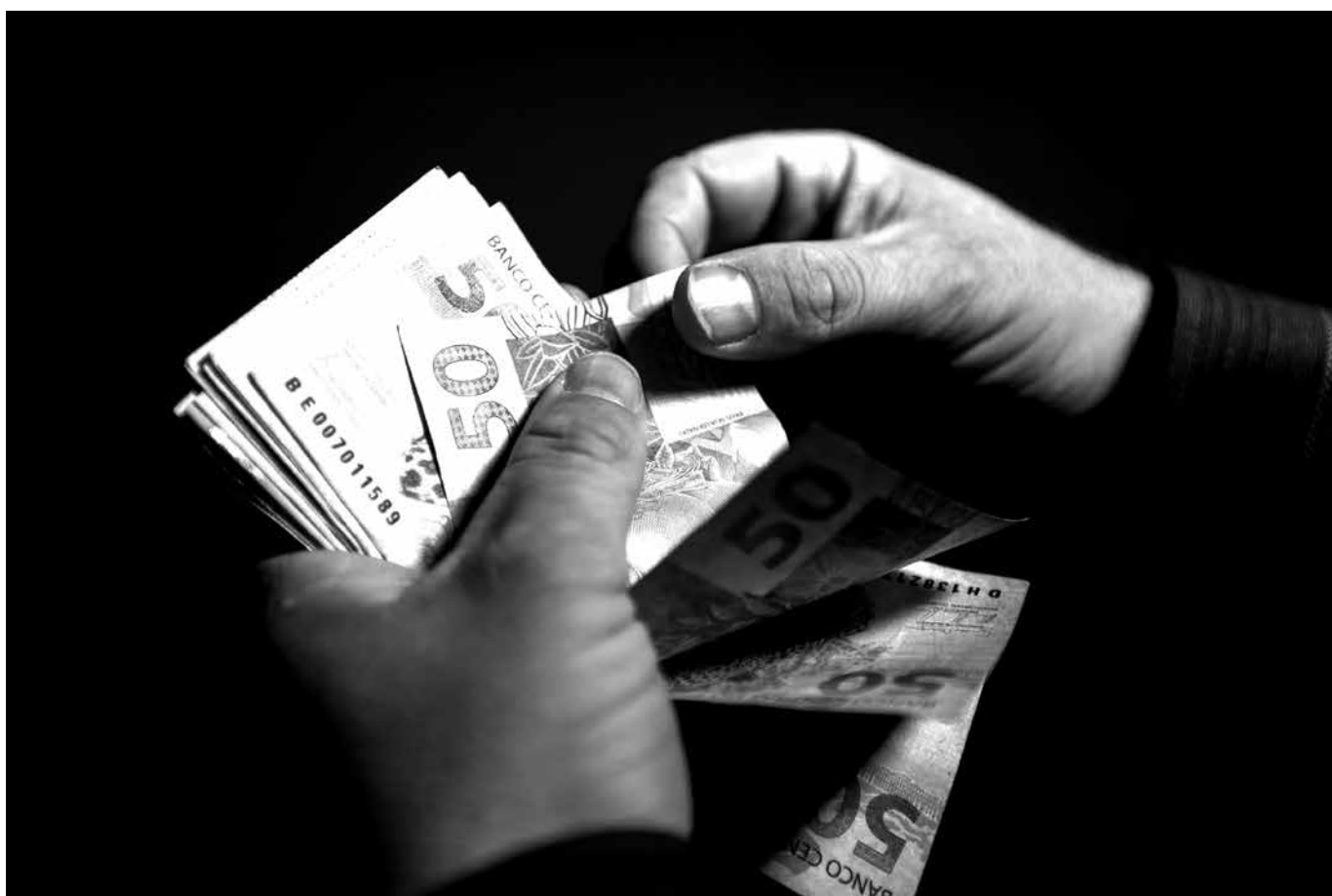
Além da alta no PIB, a reforma resultaria em uma expansão de 1,63% acima do previsto na produtividade da economia

“A mudança da estrutura tributária também produziu resultado positivo para o saldo do emprego (estoque de população ocupada), embora os ganhos sejam muito pequenos. Todavia, há aumento do emprego mais qualificado e de maior rendimento. Particularmente, esse resultado é expressivo, visto que, com a mudança nos tributos, há ganhos reais na produtividade do trabalho, o que se configura como mais uma evidên-