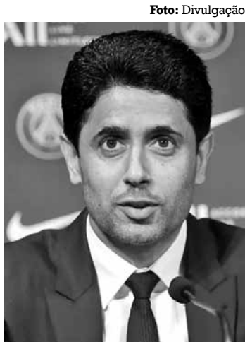
Al-Khelaifi acompanhou as buscas no apartamento

De acordo com o jornal francês L'Equipe, os investigadores e o juiz de instrução do caso receberam o dirigente na saída do seu avião. Al-Khelaifi teria colaborado com os investigadores, sem oferecer resistência durante as buscas em seu apartamento. A assessoria do presidente do PSG afirmou que ele “é uma vítima nessa questão”.