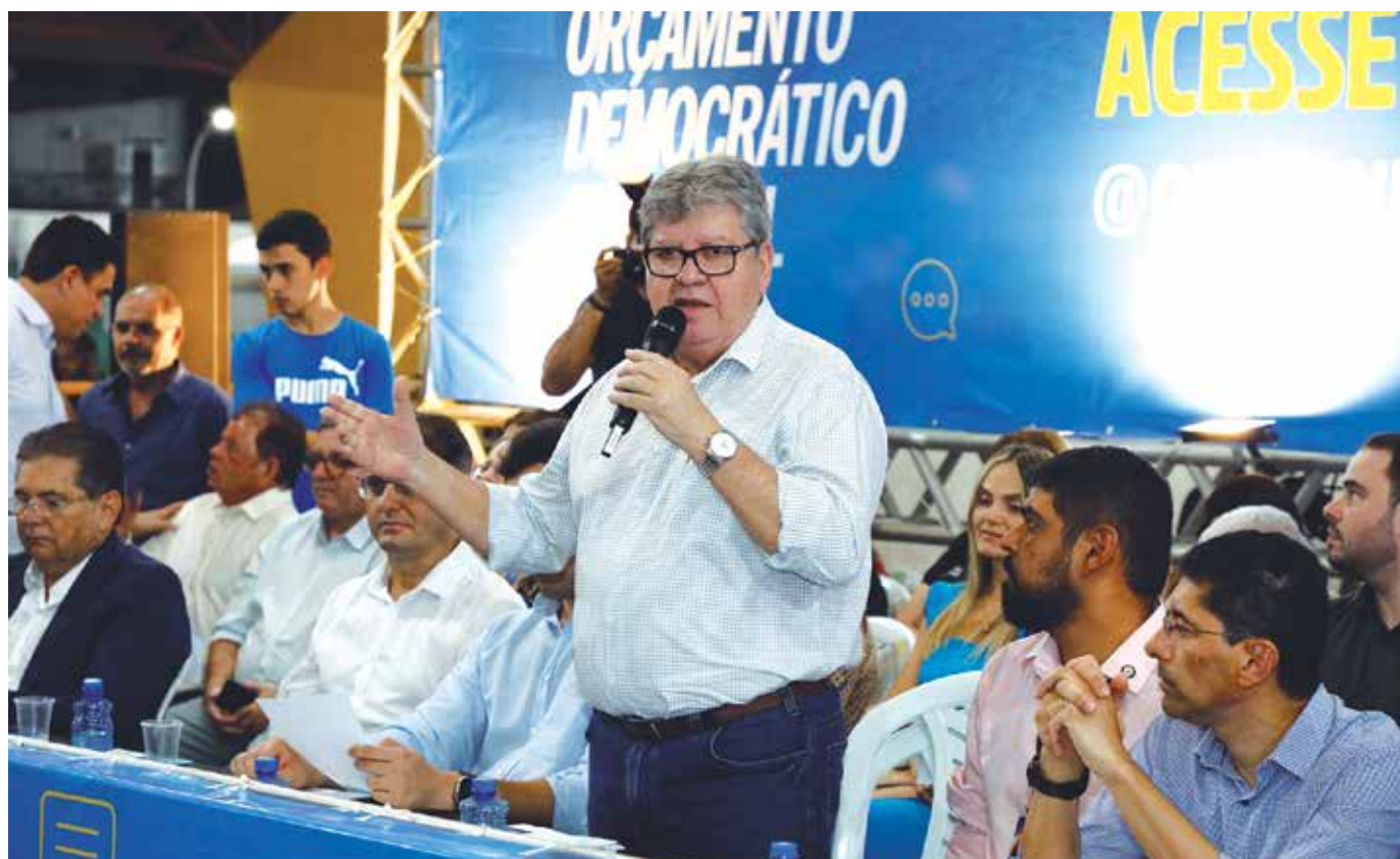
João Azevêdo revela que a escuta atenta às demandas dos paraibanos é o segredo para o sucesso do ODE e de toda a gestão