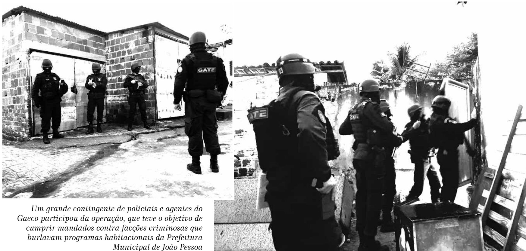
Um grande contingente de policiais e agentes do Gaeco participou da operação, que teve o objetivo de cumprir mandados contra facções criminosas que burlavam programas habitacionais da Prefeitura Municipal de João Pessoa