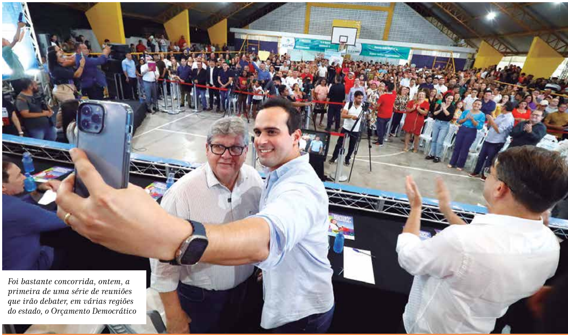
Foi bastante concorrida, ontem, a primeira de uma série de reuniões que irão debater, em várias regiões do estado, o Orçamento Democrático