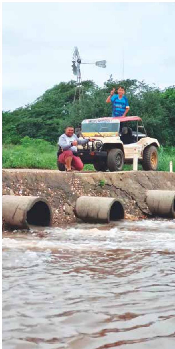
Os participantes irão conhecer as belas paisagens

O evento faz parte da programação das festividades de São Pedro, uma das mais populares do município. A trilha será realizada no sábado, com concentração na Chácara Caaporã, onde será servido um café da manhã, às 7h. O percurso conta ainda com parada por volta do meio-dia, na comunidade Riacho da Serra, de onde retorna para o local de largada, onde será servido almoço com shows ao vivo. "A trilha ainda passa pelas torres de energia eólica onde paramos para tirar fotos, porque lá é muito bonito", destaca o organiza-