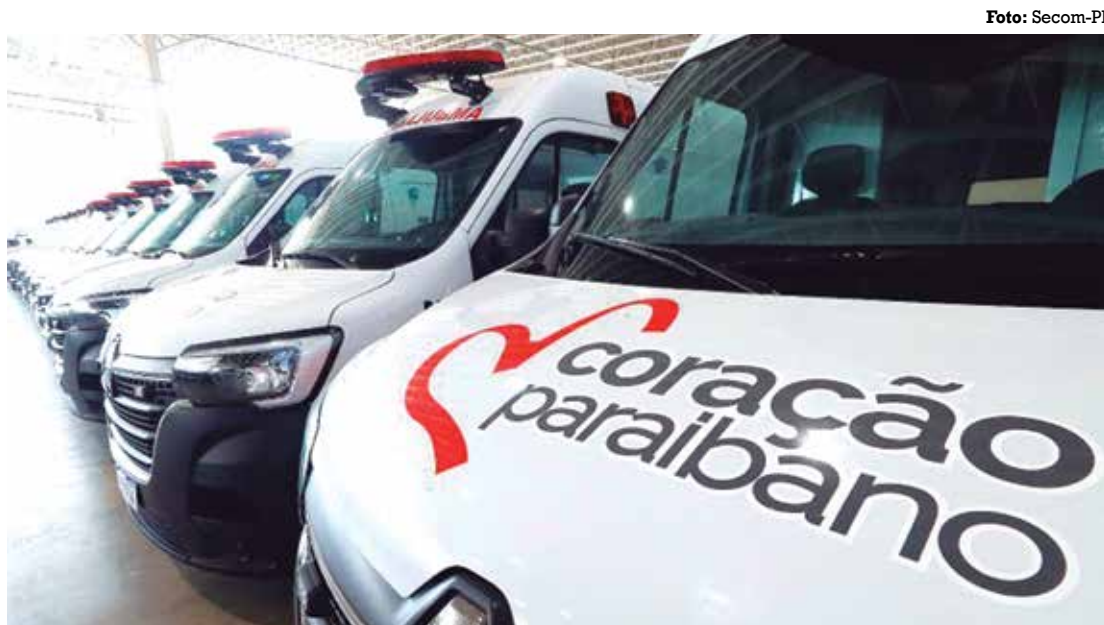
Coração Paraibano tem 40 novas ambulâncias para que seja feito o transporte adequado dos pacientes

de Saúde, 12 hospitais auxiliares para dar suporte na estabilização do paciente e na aplicação do trombolítico e uma rede de telemedicina que dá suporte 24h por