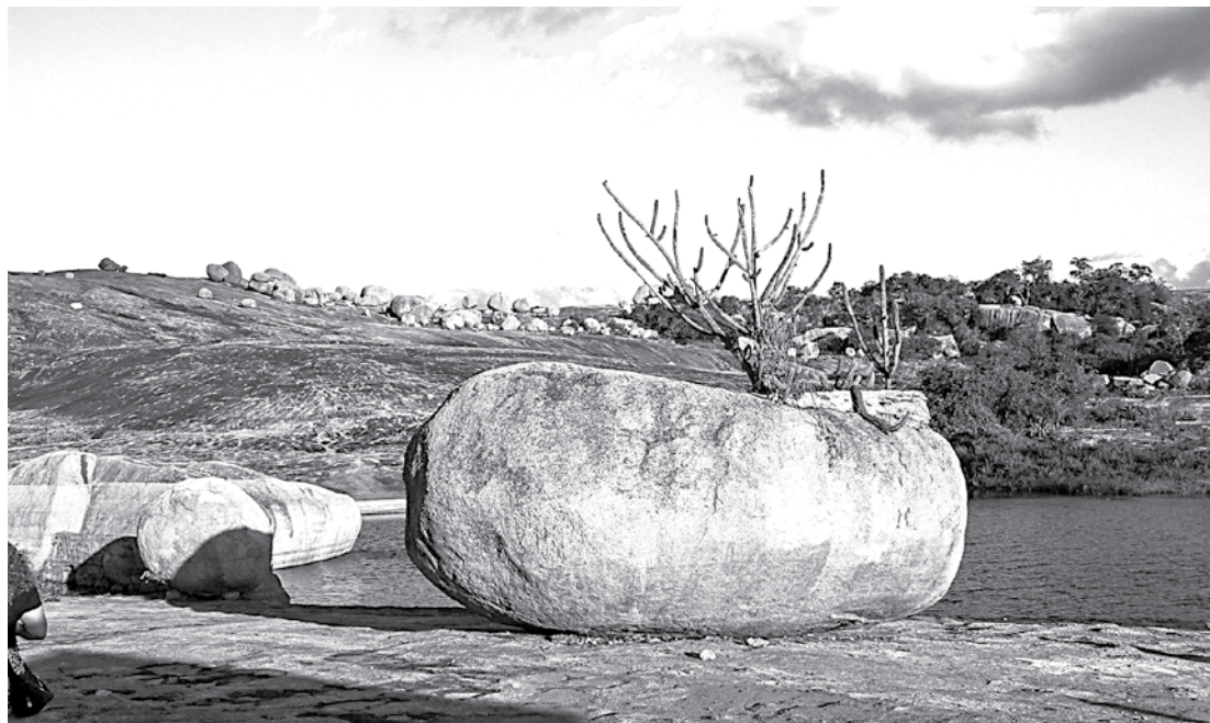
Das belezas da Paraíba!