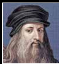
Leonardo da Vinci

“Assim como um dia bem passado produz um doce sonho, uma vida bem aproveitada causa uma doce morte.”