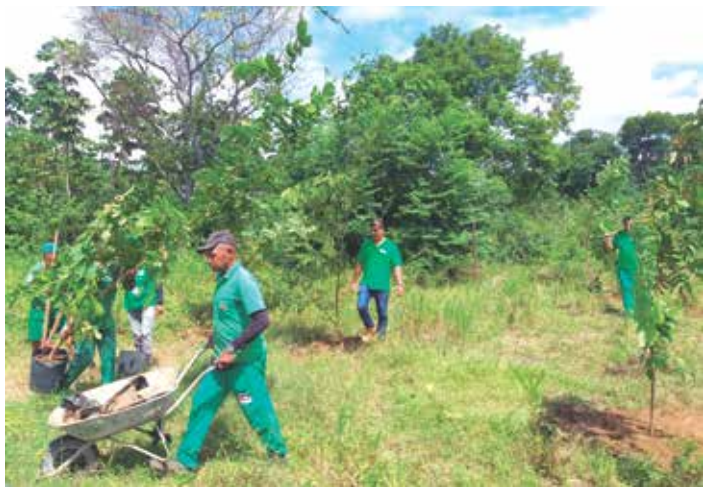
Equipe da Semam fez o plantio de mudas, a exemplo de jatobá, leiteira, jutaí e cupiúba

Segundo os estudos realizados pelos técnicos da Semam, a área verde da antiga comunidade Dubai, em conjunto com a APP do Rio Cabelo, formam um complexo de vegetação nativa de 147,25 hectares de área preservada, que corresponde a 4,28% da cobertura florestal do município.