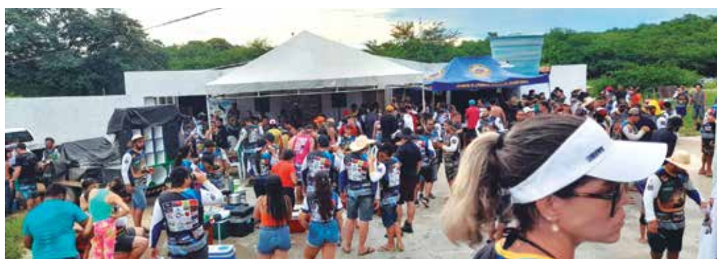
Os jeepeiros irão se concentrar no centro da cidade e depois saem para realizarem a trilha