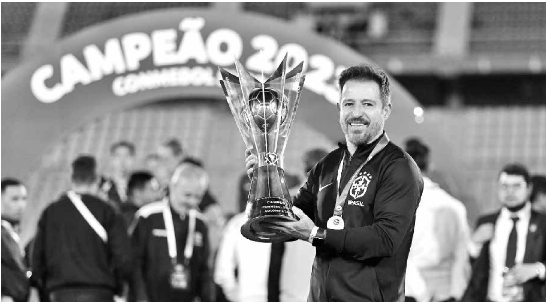
Ramon entrou para a história ao ser campeão do Sul-Americano como jogador e técnico; agora, é anunciado para comandar novamente a Seleção Brasileira

“Fiquei muito feliz. Isso mostra o nosso trabalho aqui dentro. Quero agradecer novamente a oportunidade ao presidente da CBF, Ednaldo Rodrigues, pela confiança no trabalho. Agora é fazer o que eu sempre faço aqui dentro: