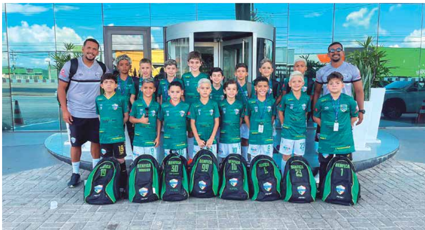
Em caso de vitória, os garotos do futsal do Benfica disputam, amanhã, a final da Taça Brasil de Clubes de Futsal Divisão Especial