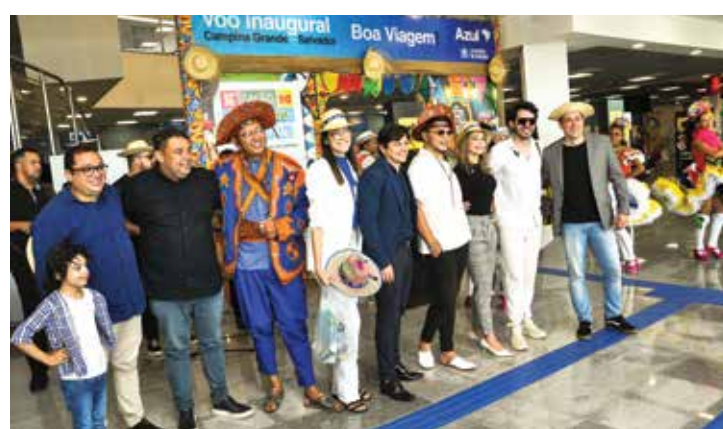
Operações da Azul em Campina continuam após o Maior São João do Mundo, pois a companhia já constatou aumento da procura