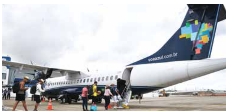
Passageiros do voo inaugural foram recebidos por um grupo de danças folclóricas e trio pé de serra, no aeroporto João Suassuna

O representante da companhia aérea explicou ainda que essas operações da companhia não estão restritas à demanda junina, quando acontece o Maior São João do Mundo na cidade. Pelo contrário, os voos continuarão durante todo o ano e poderão aumentar, visto que há dois meses a empresa já constatou aumento na procura por essa operação por meio do aeroporto Santos Dumont.