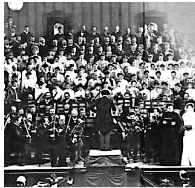
1905: Mahler na regência da ‘Nona Sinfonia’, de Beethoven