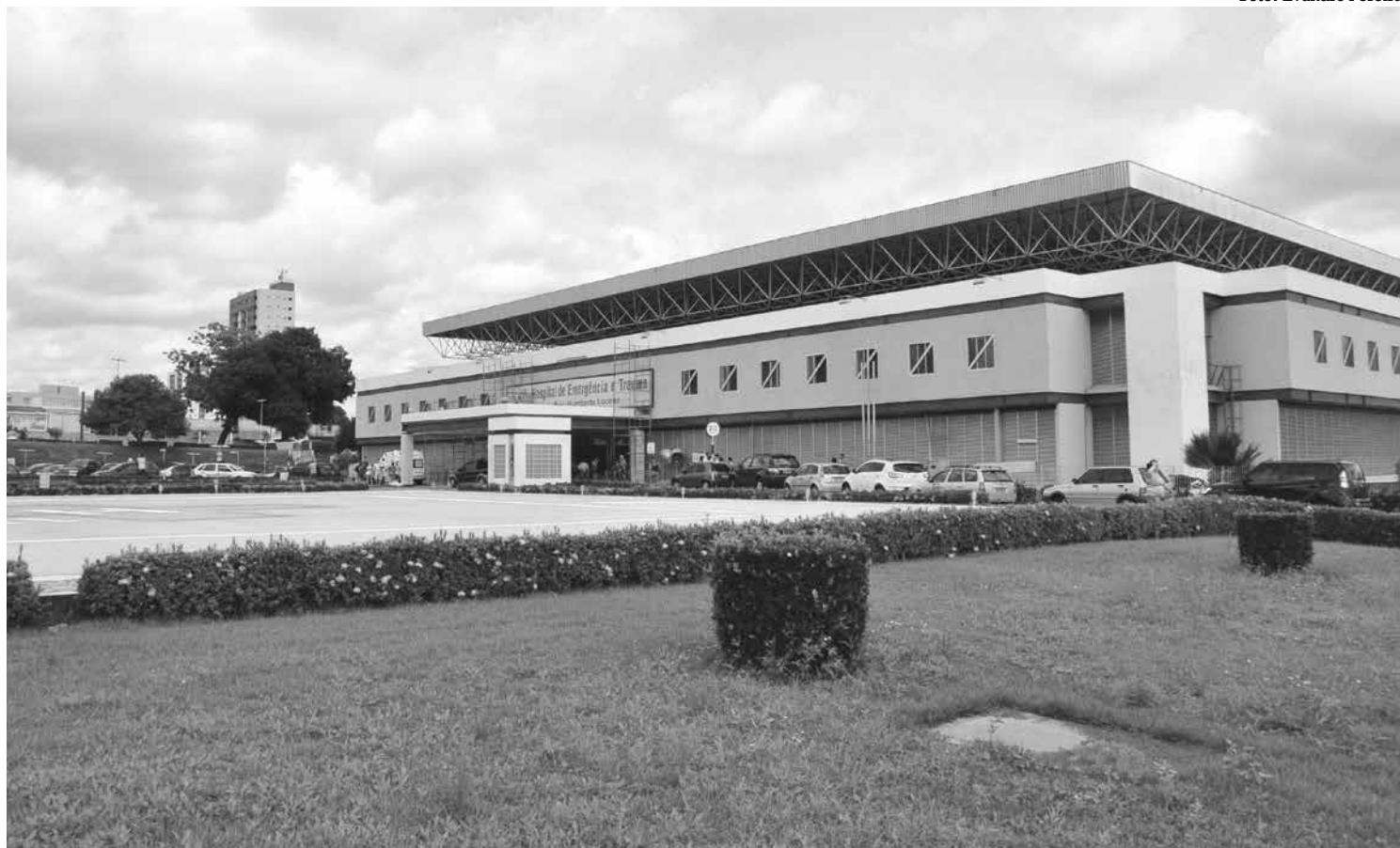
Hoje, amanhã e durante o fim de semana, o Hospital Estadual de Emergência e Trauma estará com as equipes reforçadas