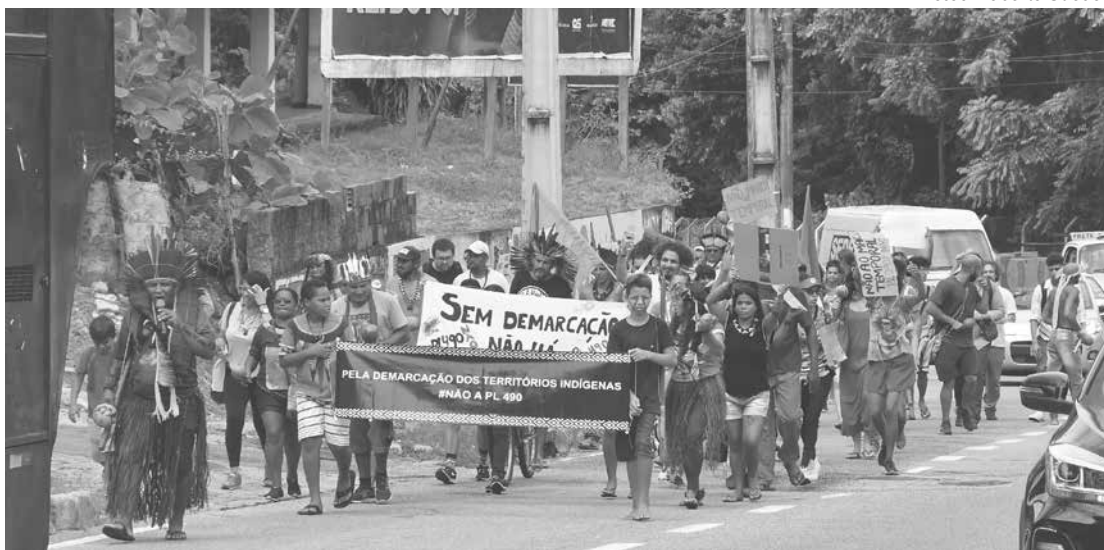
Os manifestantes saíram em caminhada da UFPB até a Praça dos Três Poderes, no centro

Para o julgamento, 50 cadeiras foram reservadas no plenário do STF para que in-