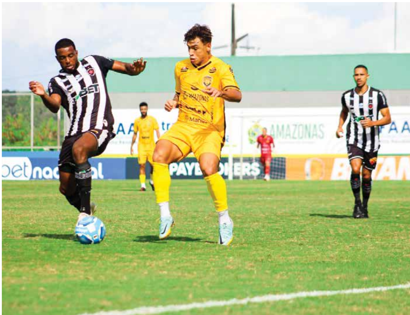
Botafogo empatou sem gols com o Amazonas-AM, em duelo pela sequência da sétima rodada da terceira divisão nacional