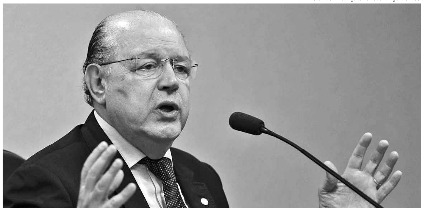
O TRE-PR entendeu que Luis Carlos Hauly não atingiu votos suficientes para ser eleito como suplente de Deltan Dallagnol

■ O relatório na Câmara aprovado traz uma série de mudanças em relação ao texto original da medida