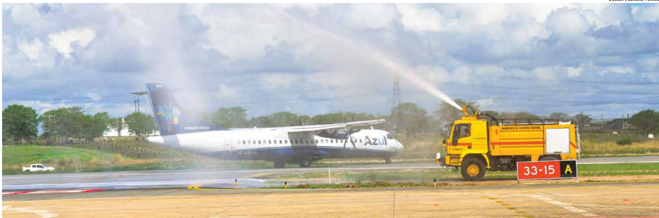
O batismo da aeronave, na pista do aeroporto João Suassuna, marcou o novo voo saindo de Campina Grande, que passa a ser, a partir de agora, um mini-hub regional da companhia aérea Azul