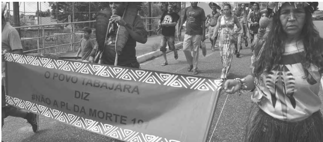
Ato reuniu representantes dos Potiguara, Tabajara e Kariri contra a demarcação de suas terras

dígenas acompanhassem o debate e outras 250 pessoas indígenas também puderam acompanhar o julgamento através de um telão, instalado na lateral do STF.