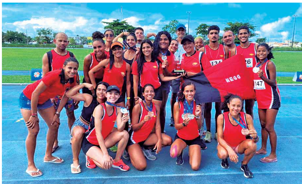
Delegação paraibana presente nas disputas da competição na pista da Universidade Federal de Pernambuco