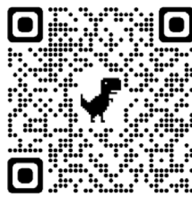
Através do QR Code acima, acesse o site oficial da Rádio Tabajara