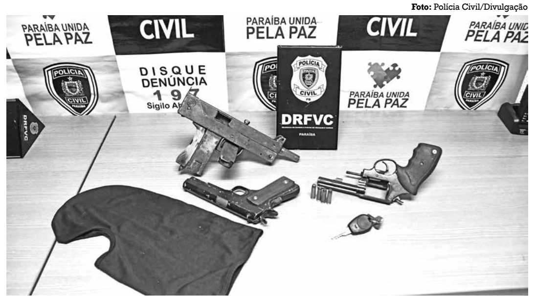
Com o trio, foram apreendidas armas e um veículo roubado; suspeitos têm antecedentes criminais

O militar disse ainda que aquela comunidade é conhecida pelos policiais devido ao intenso tráfico de drogas. “Vamos intensificar o policiamento na área”, garantiu.