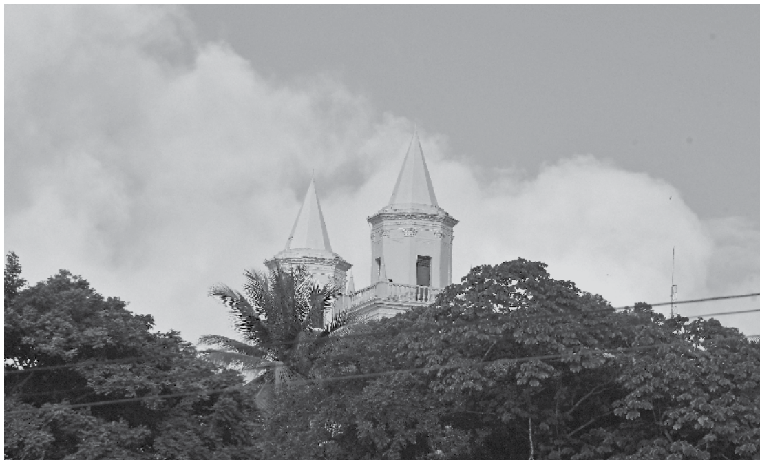
Torres da Catedral Basílica de Nossa Senhora das Neves