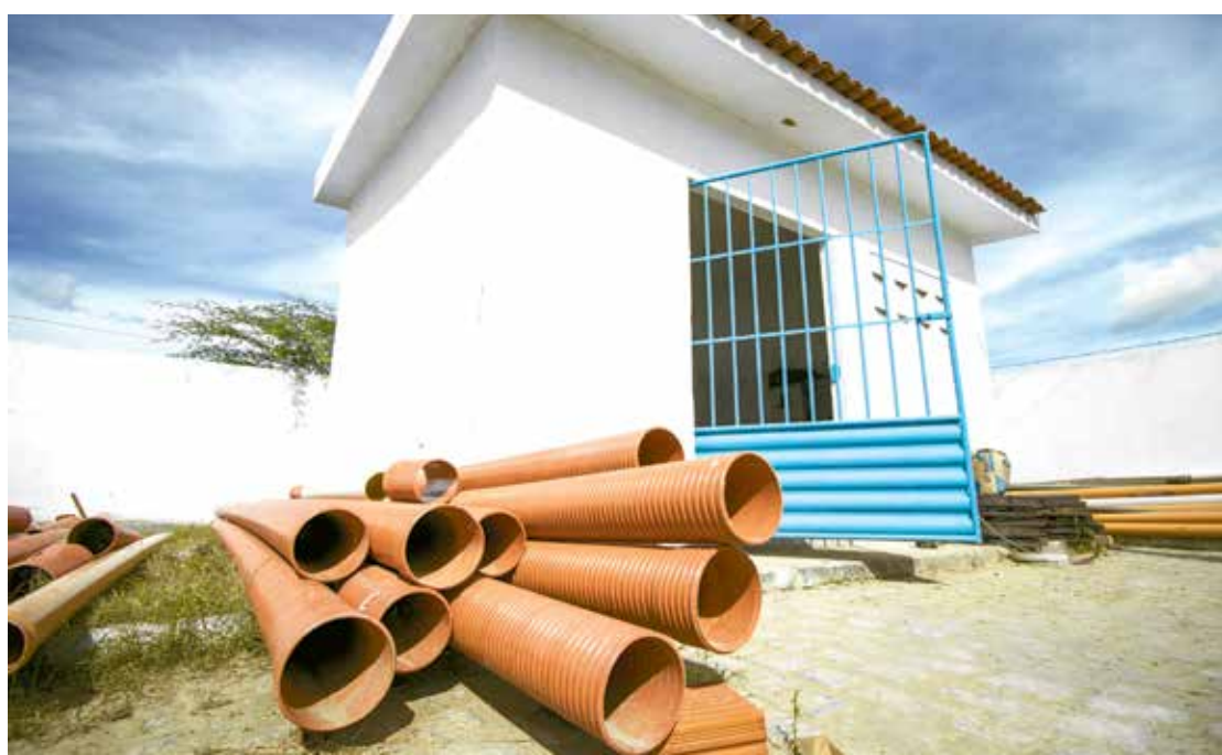
Cabaceiras, Livramento, Coremas, São José dos Cordeiros e São José de Piranhas são beneficiadas