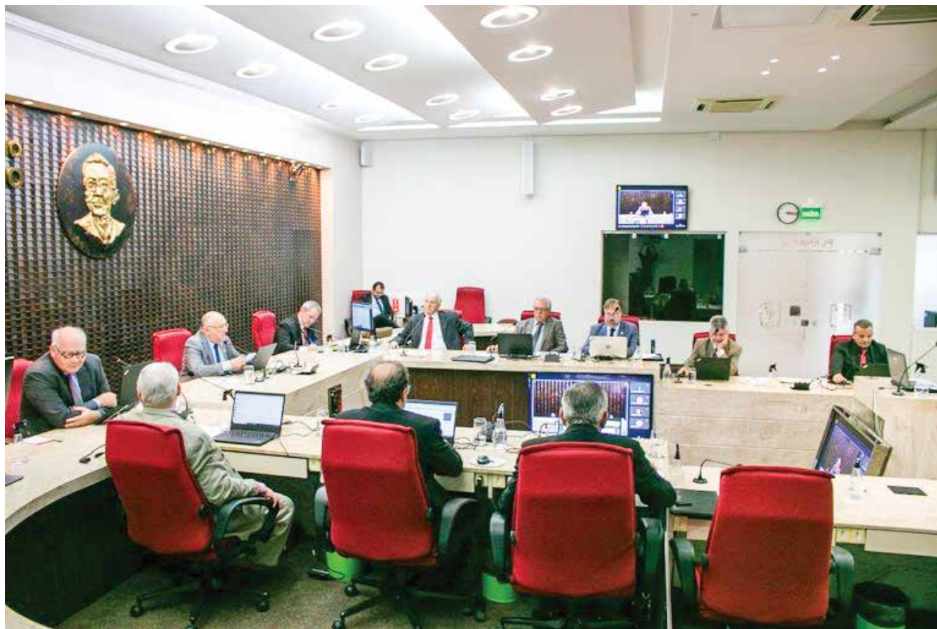
Pleno do TCE se reuniu ontem para analisar denúncias contra ex-gestores e decidiu pela imputação de débitos

Na decisão, o TCE recomendou ainda à atual gestão da Secretaria de Estado da Administração guardar estrita observância às normas substanciadas na Constituição Federal e às normas infraconstitucionais pertinentes, em especial à Lei de Licitações e Contratos, para evitar novas condenações futuras.