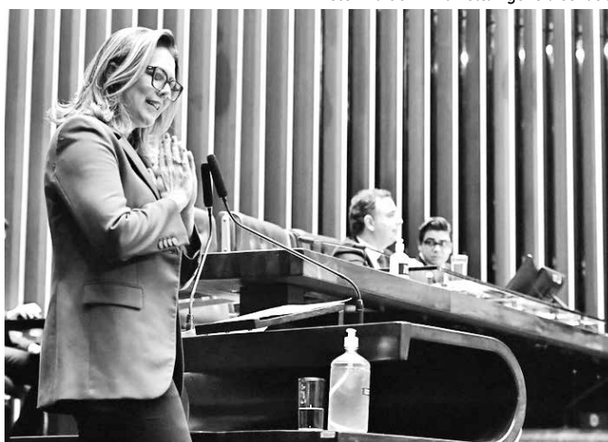
A senadora Leila Barros defendendo a Lei Geral do Esporte