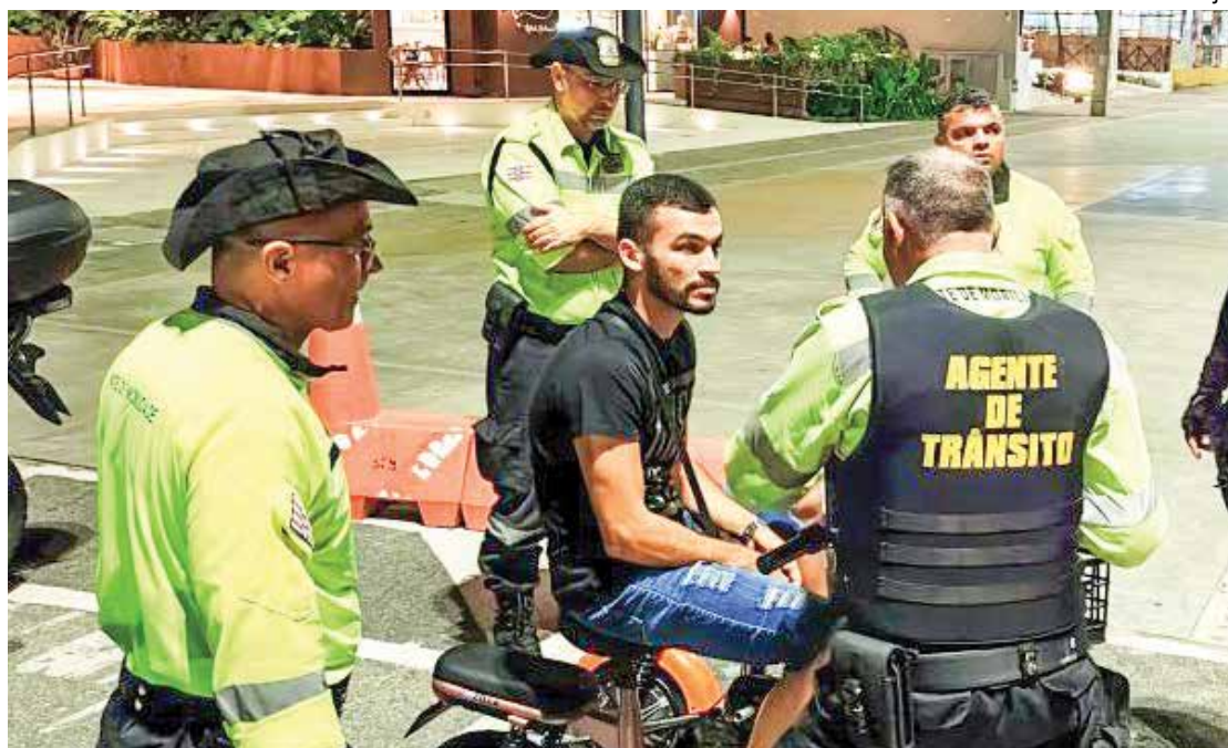
A ação tem por objetivo ordenar e orientar sobre o uso educativo dos ciclomotores, garantindo o bem-estar e segurança de todos os condutores e pedestres na área de tráfego na Orla de João Pessoa