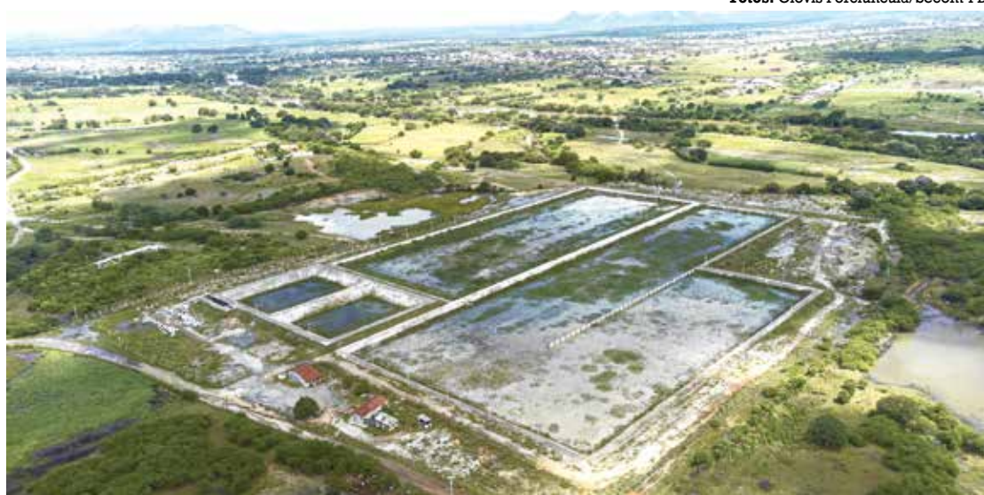
Obras em São Bento, uma das cidades contempladas, serão entregues ainda neste mês de maio