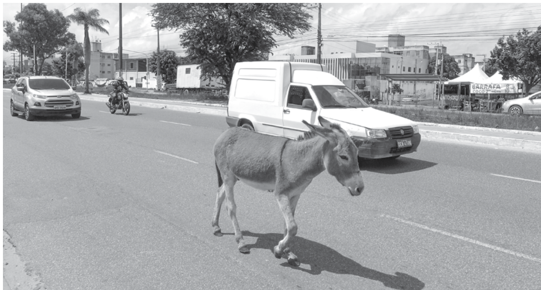
Dividindo o trânsito e o perigo