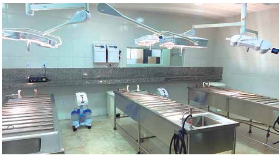
A reforma do SVO contou com melhoria e adequações de sua infraestrutura, interna e externa

A reforma da unidade contou com melhoria e adequações de sua infraestrutura, interna e externa. Essas melhorias envolveram a reestruturação das instalações de energia elétrica, hidráulica e sanitária; pintura dos ambientes e troca de revestimentos de banheiro e de fachada; troca de pisos em ambientes críticos; troca e pintura de esquadrias (portas, janelas); melhoria da identidade visual; e adequações para recebimentos de novos equipamentos, como luminárias do tipo foco, câmaras frigoríficas, mesas de necropsia, entre outros.