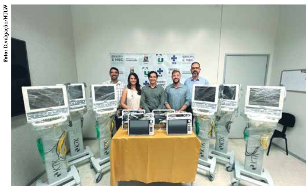
O HULW doou seis ventiladores pulmonares e quatro monitores multiparâmetros

Com o objetivo de fortalecer a parceria para prestar assistência ao povo Yanomami, o Hospital Universitário Lauro Wanderley (HULW-UFPB/Ebserh/MEC) realizou a doação de equipamentos médico-hospitalares que vão auxiliar na assistência à saúde da população indígena que vive em Roraima. São seis ventiladores pulmonares e quatro monitores multiparâmetros.