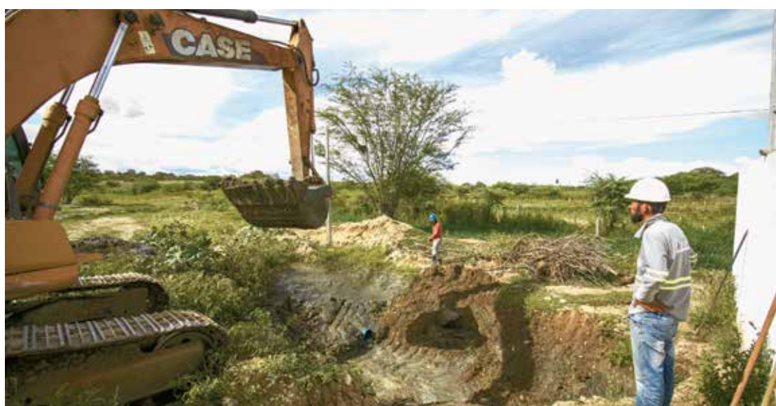
Sistemas contam com estação elevatória, de tratamento, emissão de recalque e rede coletora