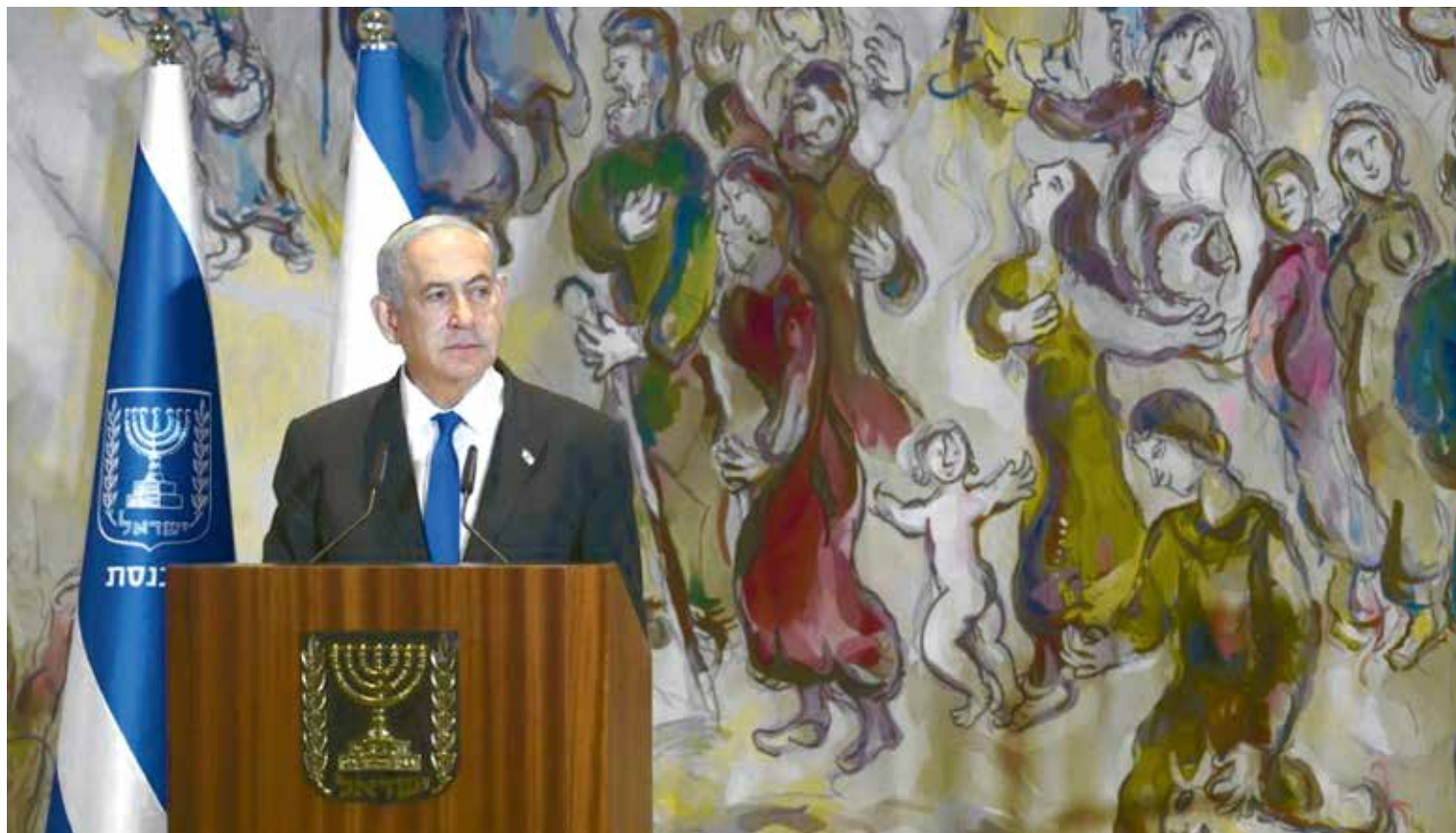
O primeiro-ministro de Israel, Benjamin Netanyahu, determinou um novo bombardeio na Faixa de Gaza pelo segundo dia consecutivo

Desde o início do ano, 132 palestinos morreram, assim como 19 israelenses, uma ucraniana e um italiano no conflito israelense-palestino, de acordo com um balanço da AFP baseado nos números oficiais divulgados pelas duas partes.