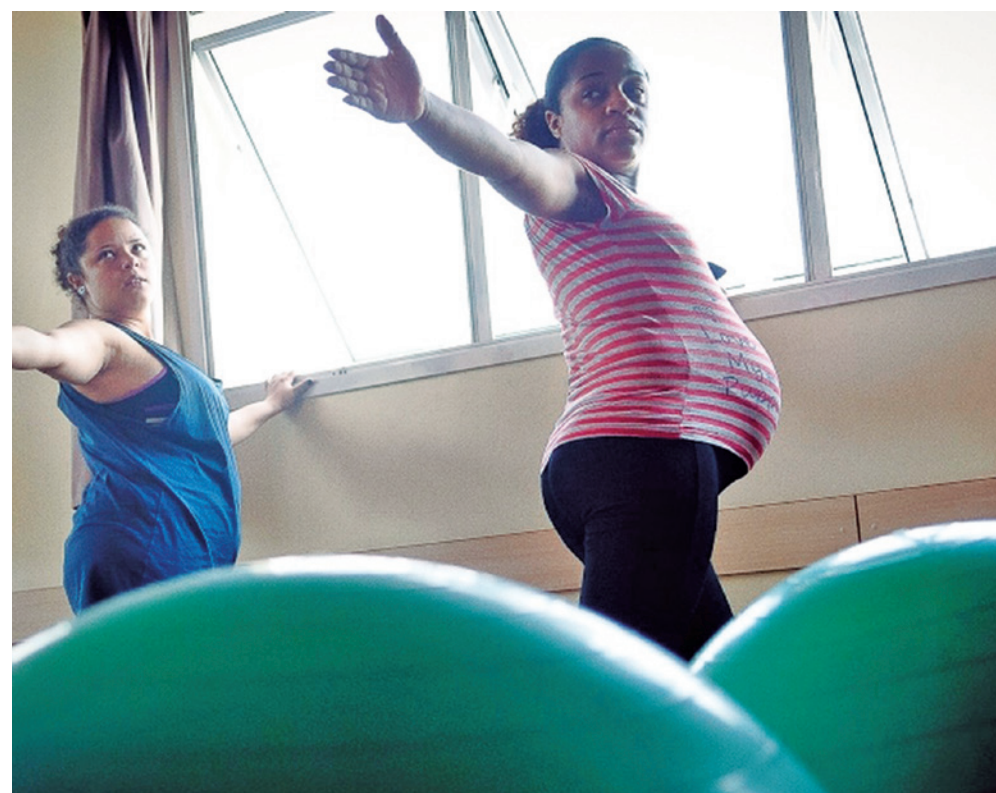
Assistência psicológica à gestante e à puérpera deve ser indicada por profissional de saúde

Além de estabelecer procedimentos de assistência psicológica, a lei determina ainda que hospitais e estabelecimentos de atenção à saúde de gestantes, públicos e privados, desenvolvam atividades educativas para conscientização, esclarecimento e respeito à saúde mental da mulher no período da gravidez e do puerpério.