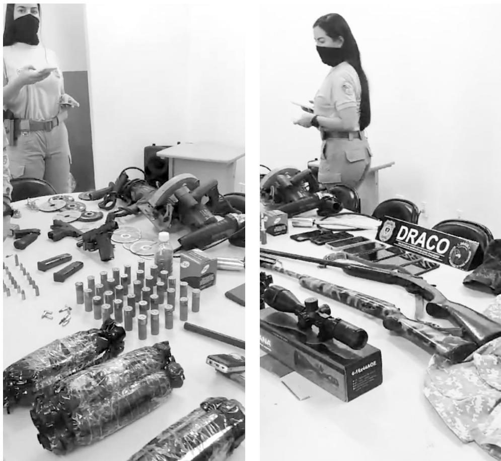
O arsenal seria usado em ação contra carro-forte na região de Cabaceiras, na Paraíba

De acordo ainda com a polícia, o grupo desarticulado em Cabaceiras tem envolvimento com outros narcotraficantes, que age na região de Surubim, em Pernambuco. Os presos e material apreendidos foram levados para a Central de Polícia de Campina Grande, onde foram autuados em flagrante, por organização criminosa.