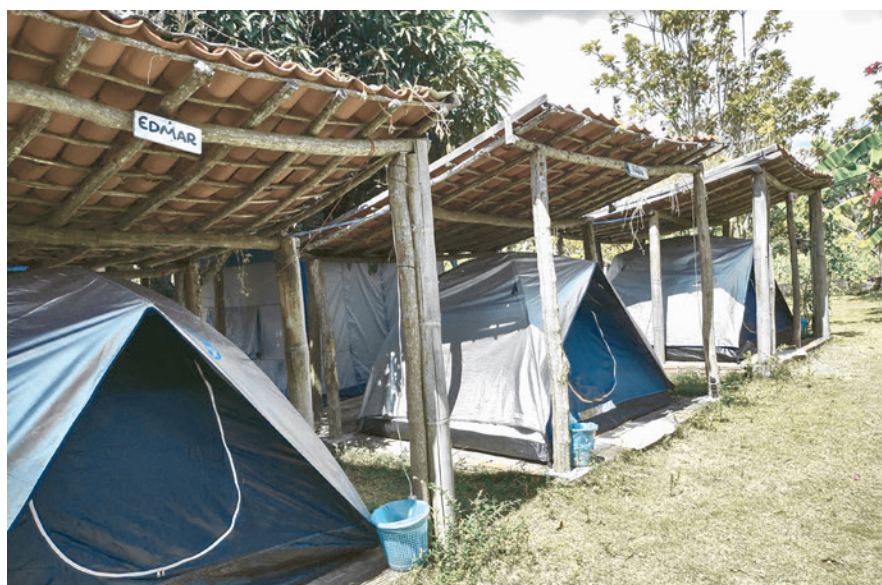
Empreendimento não permite que hóspedes levem estruturas externas