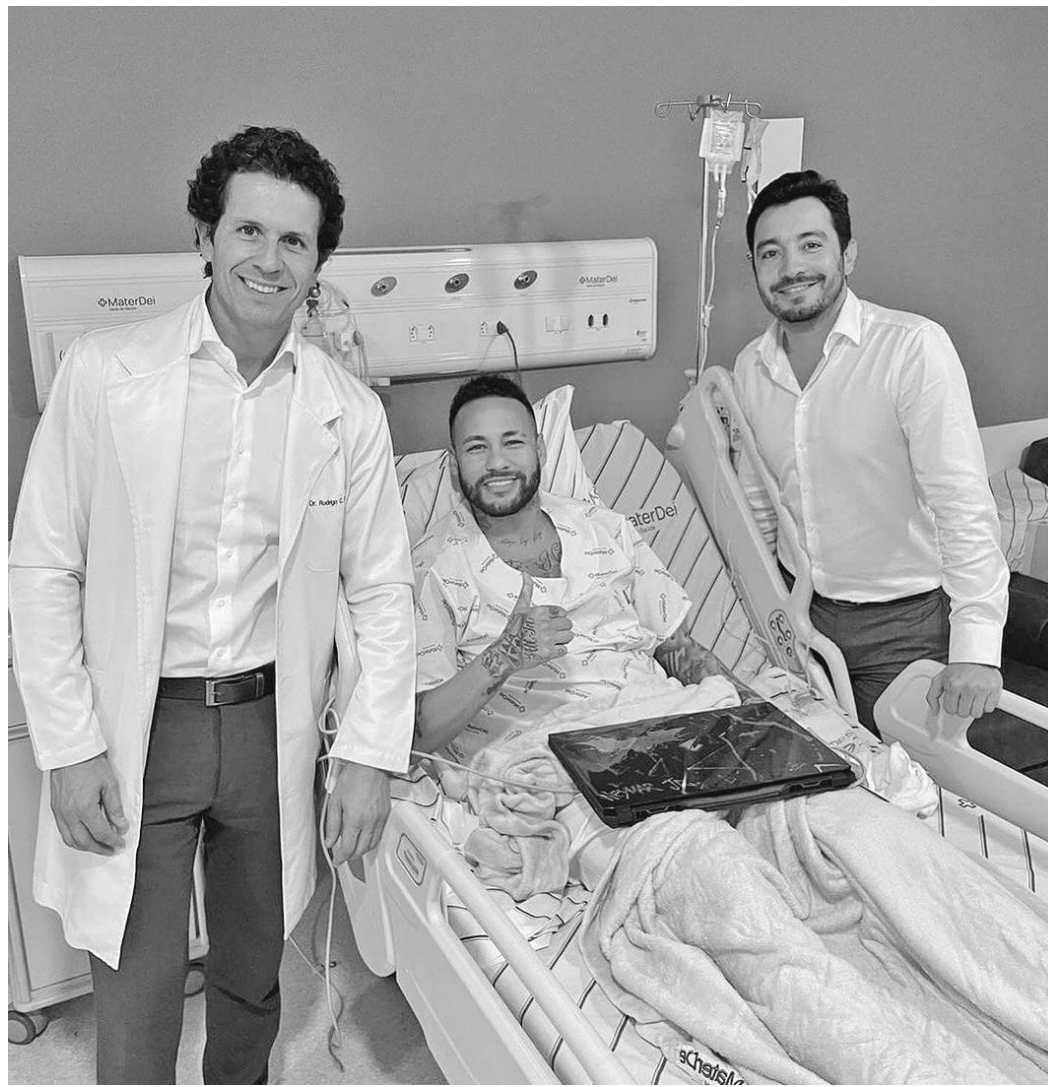
Médicos com Neymar após a cirurgia para reconstrução do ligamento colateral do joelho

Com novas alternativas, apesar de uma recuperação grave levar, em média, oito meses, contra pelo menos um ano e meio nos anos 80 e 90, a chance de um jogador voltar a atuar normalmente é muito maior, diz Runco. Inclusive em função do fortalecimento muscular, já que são linos estourasse durante uma apresentação.