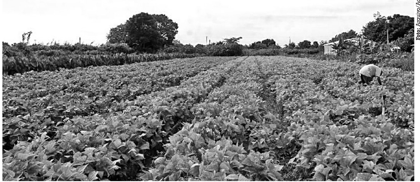
Famílias que moram em projetos de assentamento criados por outros órgãos governamentais podem ser incluídas no PNRA

Após o reconhecimento, um novo processo terá início por meio de um formulário que deverá ser apresentado à Superintendência Regional do Incra ou à Diretoria de Desenvolvimento e Consolidação de Projetos de Assentamento, para que seja feita análise sobre os perfis das famílias em relação ao que está previsto