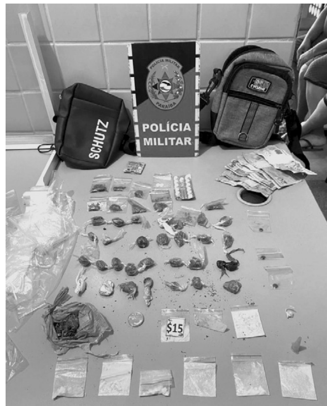
Com os suspeitos foram encontrados maconha, haxixe e crack