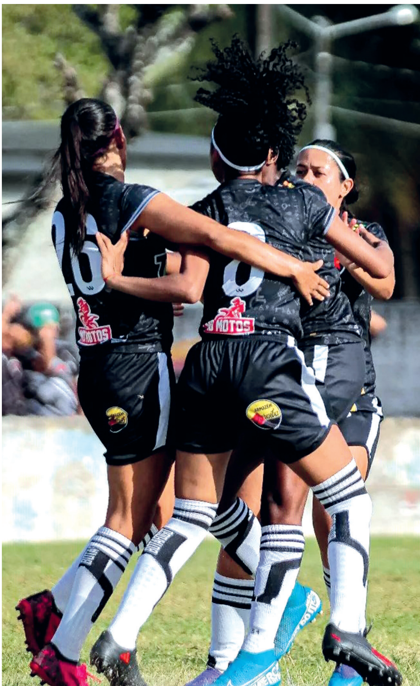
As Belas do Belo vão representar a Paraíba na 1ª Copinha de Futebol Feminino que vai acontecer em São Paulo

■ Grupo D: Fortaleza-CE, Atlético-MG, Botafogo-RJ e Corinthians.