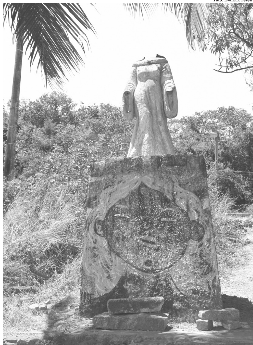
Federação dos Cultos Afro-Brasileiros pede que a escultura fique em local movimentado

A campanha do Novembro Azul deste ano convida a população masculina a buscar atendimento para todas as áreas da saúde e não especificamente para a prevenção do câncer de próstata. O Ministério da Saúde recomenda a convocação de todas as pessoas do gênero masculino, independentemente da idade, para buscar os serviços da Atenção Primária à Saúde (APS). Em Campina Grande, por exemplo, as principais causas de morte nos homens adultos são doenças cardiovasculares e acidentes de trânsito, segundo o Sistema de Informação de Mortalidade (SIM).