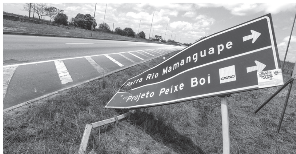
Indicação confusa pela destruição