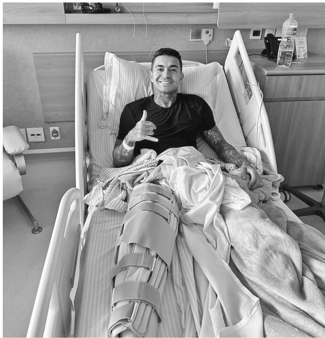
Dudu também rompeu o ligamento cruzado anterior e menisco e passou por cirurgia

copia e que atuou como médico do Internacional “Naquela época (anos 70 e 80), as cirurgias para correção da lesão não eram bem-sucedidas. Hoje esta situação mudou radicalmente, pois nos últimos 30 anos houve uma melhor compreensão da anatomia e biomecânica do joelho e um grande avanço tecnológico”, destaca.