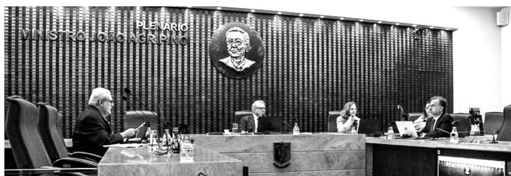
Em outro processo, o TCE aprovou pregão realizado pela Secretaria de Administração