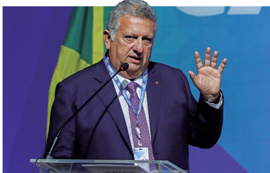
Lula pediu para ‘gerar governança’ na Caixa, declara Carlos Vieira Fernandes

A Huawei é uma das líderes globais de soluções de tecnologia da informação e comunicação. A empresa atua em mais de 170 países e regiões, atendendo a três bilhões de pessoas em todo o mundo, promovendo o desenvolvimento da indústria e a operação de redes seguras e estáveis