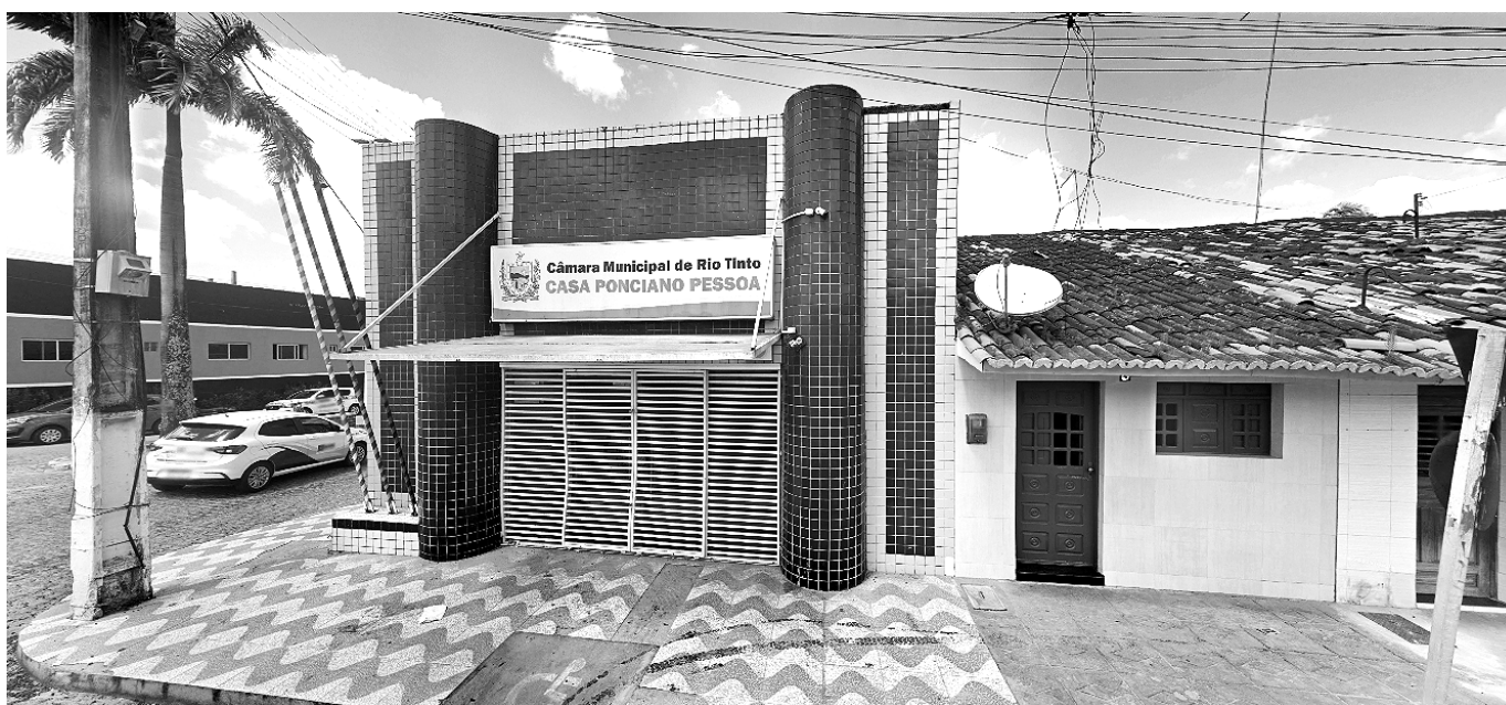
Cassados perderam o prazo para recurso, o que levou o TRE a determinar a retotalização e a posse dos novos parlamentares

Os vereadores cassados devem ser afastados da Câmara Municipal após notificação da Justiça Eleitoral. Desta forma, os novos vereadores devem ser diplomados pelo Tribunal Regional Eleitoral (TRE-PB), em seguida, empossados no Poder Legislativo municipal como determina a Justiça Eleitoral.