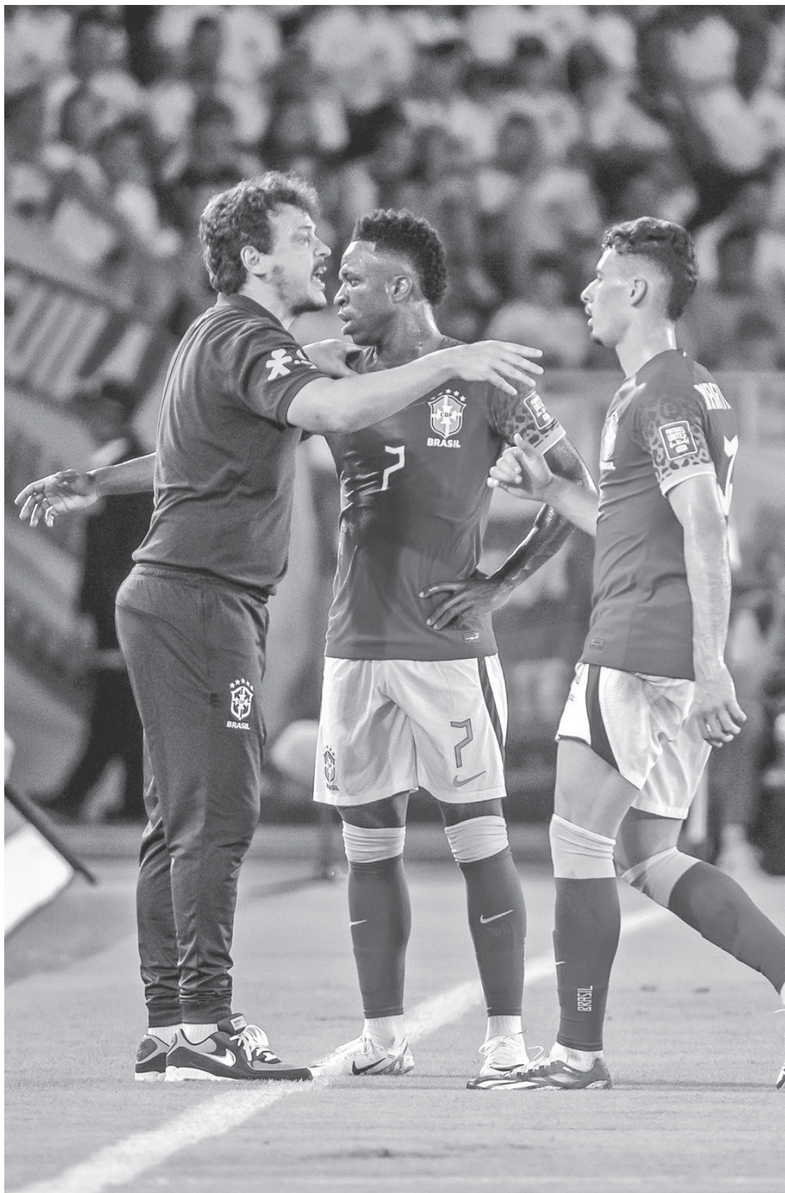
O técnico Fernando Diniz orienta Vini Jr e Martinelli durante o jogo do Brasil contra a Colômbia

“Não tem garantia que a equipe vai ganhar da Argentina, mas vamos corrigir o que não vem dando certo e a equipe tende a evoluir e os resultados positivos vão aparecer”, mostrou esperança. “Tem de analisar o que está acontecendo, não só o resultado. Ver o tanto que mexeu na equipe da Copa (do Catar) para cá, o pouco tempo que teve para treinar. Criar é mais difícil que corrigir os aspectos defensivos.”