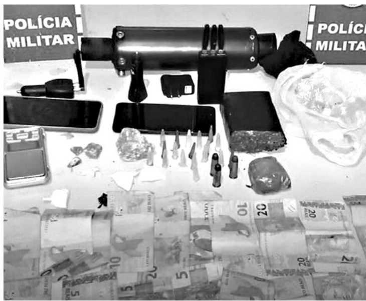
Dinheiro, substância análoga à maconha e munição foram apreendidos