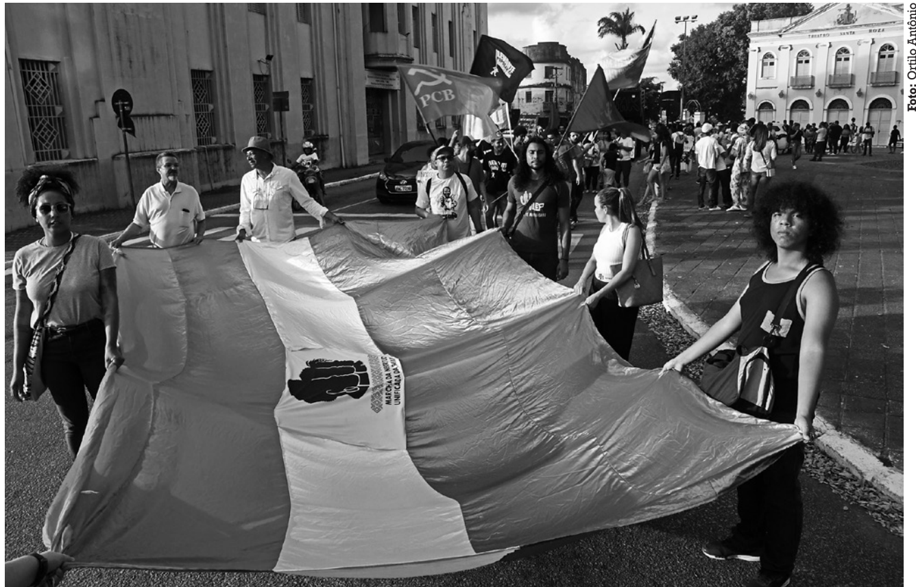
Marcha da Negritude teve concentração em frente ao Teatro Santa Roza e depois seguiu para o Parque Solon de Lucena

■ O que era apenas um espetáculo, o Auto dos Orixás, idealizado em 2011, ao longo dos anos tomou grandes proporções