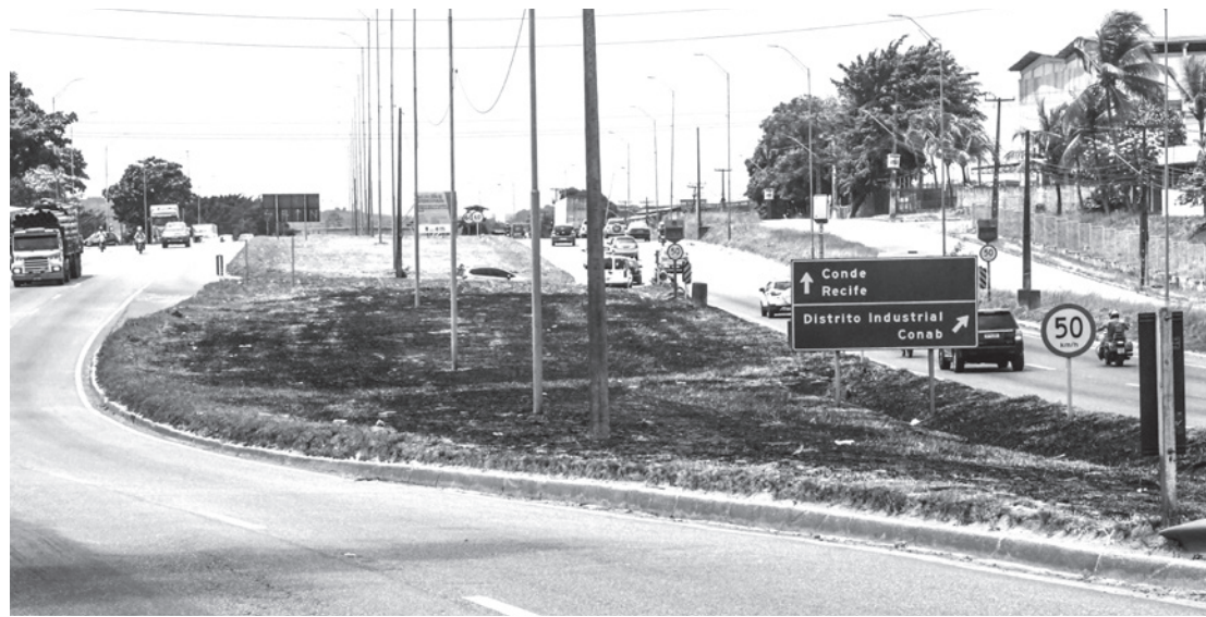
O calor e uma de suas sequelas, o fogo