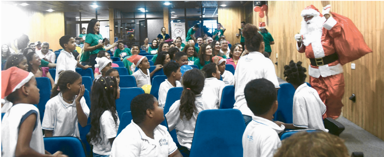
Papai-noel foi recebido com entusiasmo pela criançada que enviou cartinhas pedindo presentes por conta das festas natalinas

As cartinhas podem ser adotadas através do blog https://blognoel.correios.com.br/adocao/ ou presencialmente nos postos de arrecadação dos Correios.