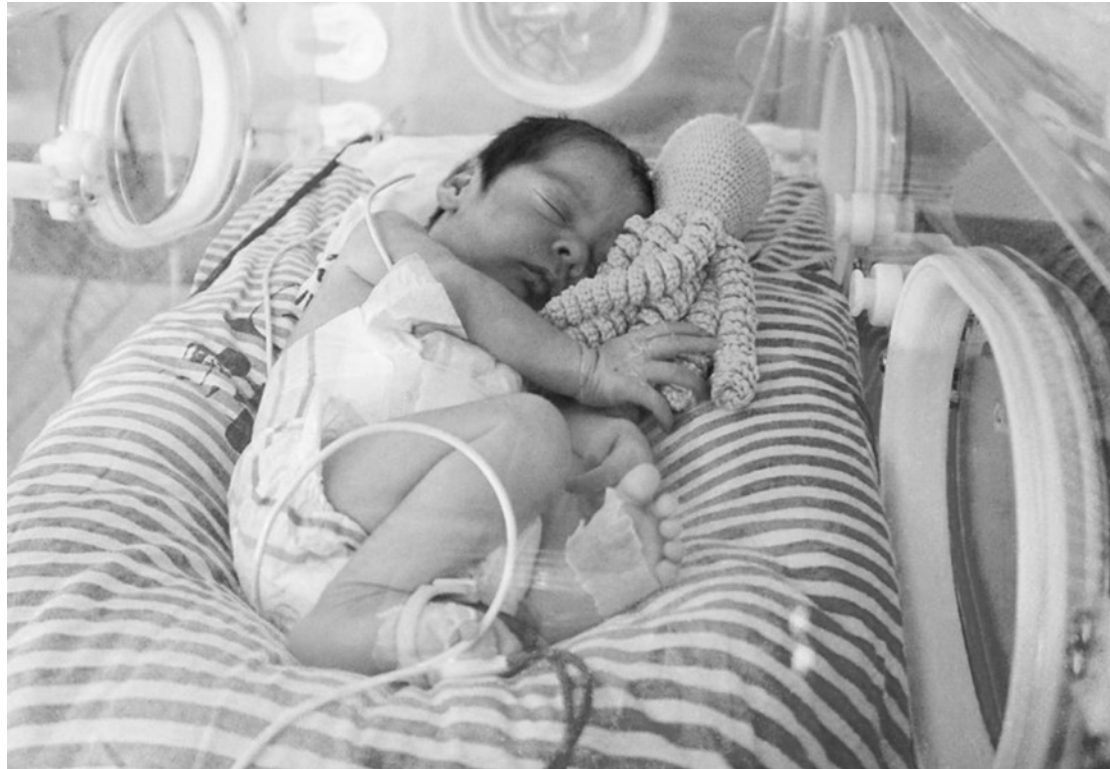
Tentáculos do “bichinho” se assemelham a cordão umbilical, ajudando a acalmar o recém-nascido