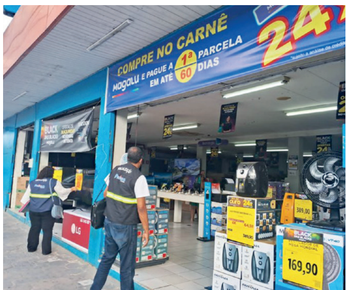
Órgão de proteção aos consumidores no estado orienta a população sobre os direitos durante a campanha promocional realizada neste mês

A população pode acessar o site do Procon Estadual, www.procon.pb.gov.br , para consultar pesquisas anteriores e comparar os preços praticados, garantindo a veracidade do desconto oferecido. Além disso, é sugerido veri-