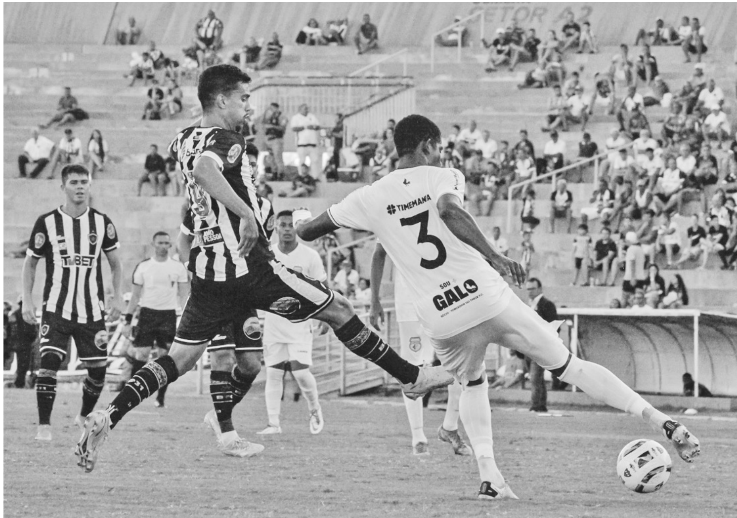
Lance do jogo Botafogo x Treze disputado em janeiro deste ano, no Almeidão; os dois clubes defendem mudanças no Paraibano