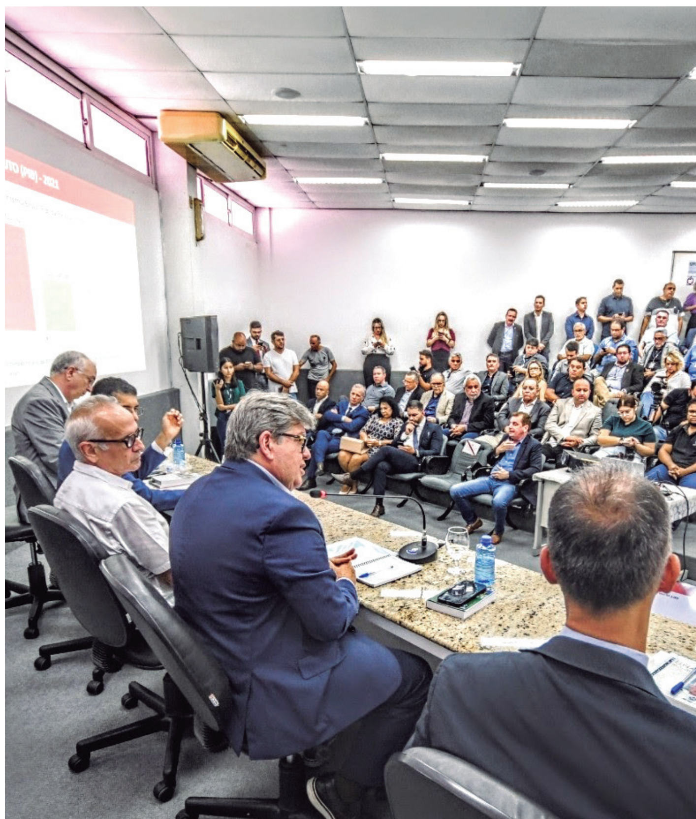
O governador João Azevêdo comemorou os números do PIB e lembrou das dificuldades enfrentadas com a pandemia

“É importante entender que esses dados têm um recorte de 2020 e 2021, período em que teve uma forte influência da pandemia, início da pandemia em 2020 e também durante 2021. O que é importante entender é que mesmo nesse período, a economia da Paraíba cresceu. Nós conseguimos manter um nível de investimento que fez com que os resultados aparecessem. Crescemos 10% do valor do PIB, saímos de R$70 bilhões para