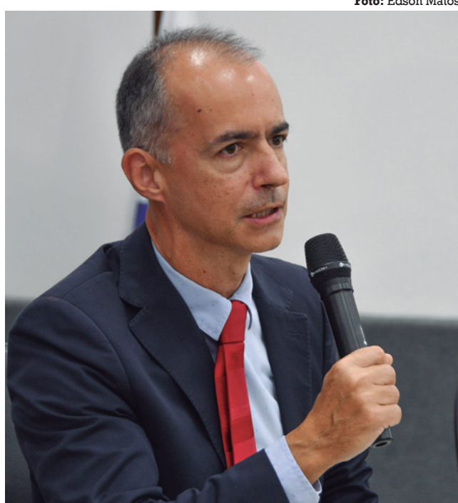
Roberto destacou a importância do PIB para o estado

O PIB, um dos principais indicadores econômicos dos estados, é calculado a partir de metodologia homologada pelo IBGE em fóruns com órgãos estaduais de estatística