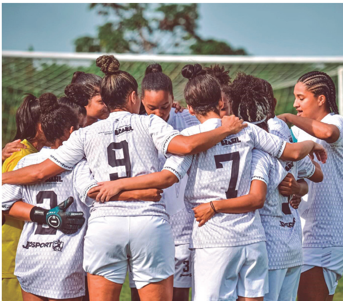
Jogadoras do VF4 comemoram mais um gol no jogo contra o Kashima, quando confirmou a classificação

Na próxima fase do certame estadual, o 1º colocado do Grupo A enfrenta o 2º colocado do Grupo B, enquanto o 1º colocado do Grupo B encara o 2º colocado do Grupo A em confrontos únicos até ser conhecida a grande campeã estadual. A equipe vencedora do Paraibano Feminino de 2023 carimba passaporte para a disputa da Série A3 do Campeonato Brasileiro de 2024. No entanto, caso o VF4 chegue à final, o outro finalista é quem fica com a vaga pelo fato de o clube já estar inserido na disputa do Brasileirão Feminino da Série A3 de 2024.