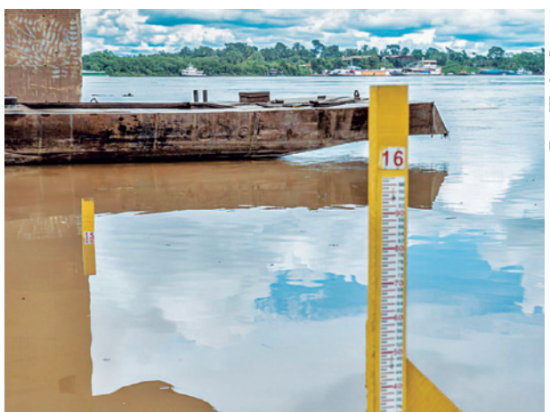
Rio Madeira registra severa crise hidrológica

“Além disso, pretendo aprimorar a qualidade de vida dos servidores da Procuradoria. Acho que é uma preocupação que todos nós temos que ter. Olhar também para a nossa própria Instituição. E trazer um ambiente de trabalho cada vez mais sadio e equilibrado, apoiando o servidor naquilo que ele precisar, inclusive oferecendo cursos e oficinas. Pretendo também implantar algumas oficinas aqui na Procuradoria”, acrescentou o procurador-chefe.