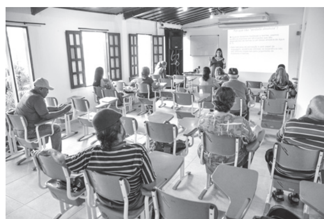
Universidade Aberta à Maturidade já formou 900 idosos

“Os alunos fazem desse lugar um local para adquirir conhecimento e são levados e orientados a lançar um olhar em um horizonte de ideias ao lado dos colegas. Tenho testemunhos de alguns que relatam terem encontrado novas famí-