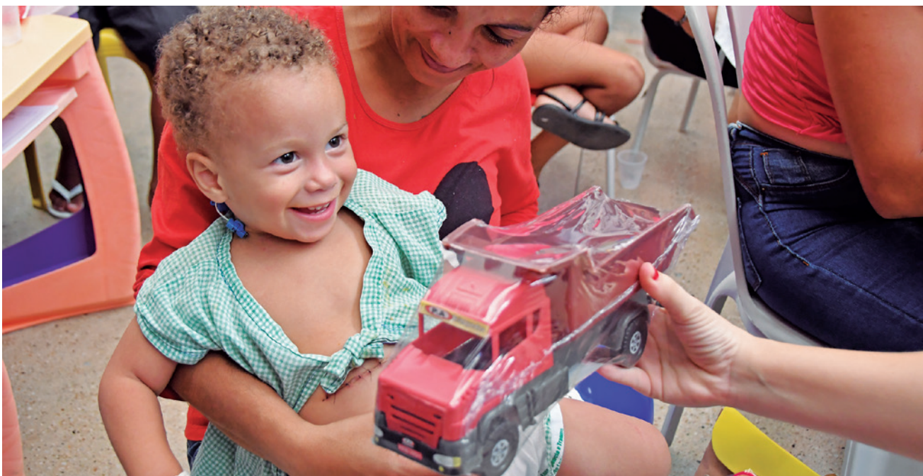
Criança recebe presente durante evento que contou com a presença de animadores e atividades educativas

Também é no Rio Madeira que funcionam as Usinas Hidrelétricas de Jirau, com capacidade instalada de 3.750 Megawatts (MW) e maior resiliência à seca; e de Santo Antônio, com capacidade instalada de 3.568 MW, o suficiente para abastecer cerca de 45 milhões de habitantes, e que está com as atividades suspensas desde o início deste mês de outubro.