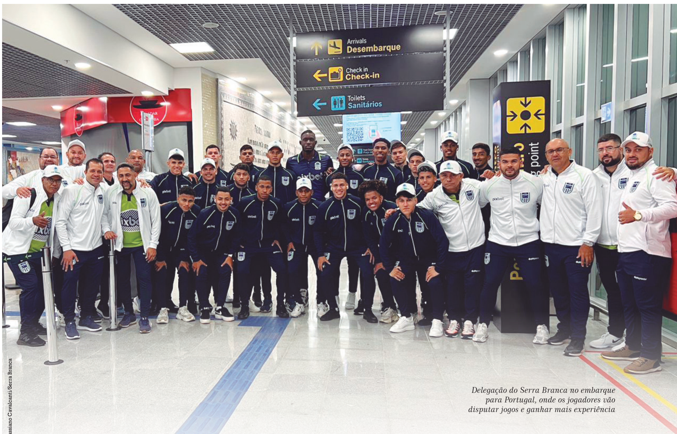
Delegação do Serra Branca no embarque para Portugal, onde os jogadores vão disputar jogos e ganhar mais experiência