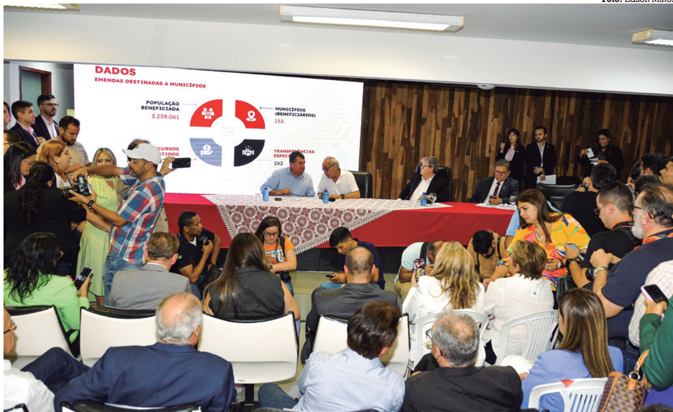
O governador desejou que os gestores façam bom uso do dinheiro que foi liberado para as instituições e prefeituras