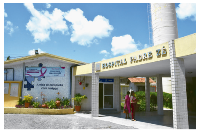
Hospital Padre Zé atende à população vulnerável desde 1935. Apenas no primeiro semestre recebeu 1.289 pessoas