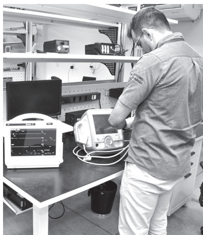
Nutes desenvolve e aprimora equipamentos na área da saúde

A pesquisa recebeu a carta patente emitida pelo Instituto Nacional da Propriedade Industrial (INPI) em outubro.