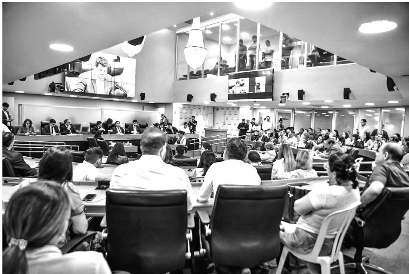
Deputados, técnicos e gestores abordaram a melhoria na regulação para a prestação eficaz do serviço de saúde

“É um debate importante porque não tem sentido que 90% das internações estejam concentradas em João Pessoa. Precisamos ter uma fila única coordenada pelo Governo do Estado para que tenhamos mais transparência e para que os doentes das cidades menores possam também ser con-