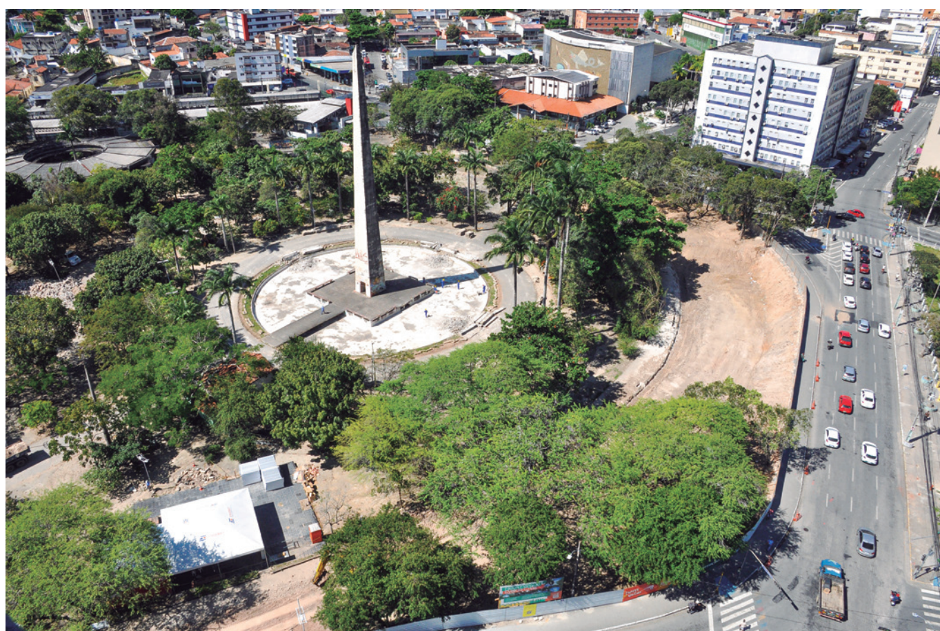
Desde o início da gestão João Azevêdo, a cidade de Campina Grande já recebeu R$ 1,5 bilhão em investimentos

A previsão é que o Hospital das Clínicas seja construído em um período de dois anos. Ainda no setor da saúde, o governador também autorizou a reforma e ampliação da área vermelha e do centro cirúrgico, a construção da unidade funcional de UTI/queimados e unidade funcional coronariana e a aquisição