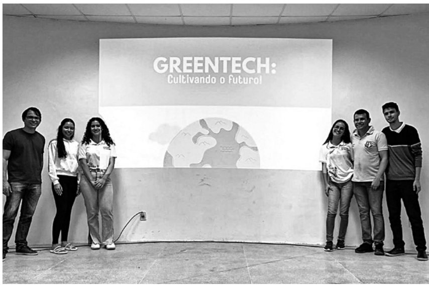
‘Greentech: Cultivando o futuro’ foi criado por dois professores locais

Dos 10 finalistas, três projetos serão vencedores nacionais classificados em 1º, 2º e 3º lugares. O resultado final será divulgado no mês de novembro deste ano.