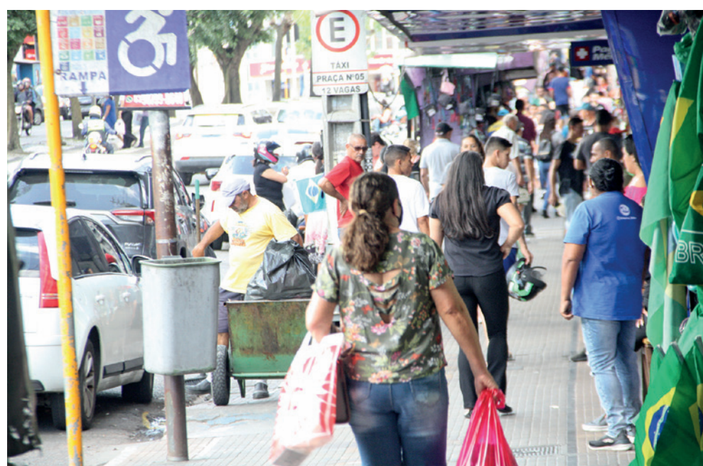
Mais de 12 mil micro e pequenas empresas ativas no município são do setor de comércio