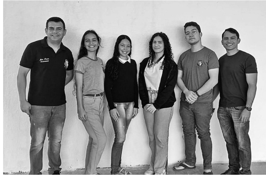
Estudantes participantes são da 2ª série do Ensino Médio do curso de Informática