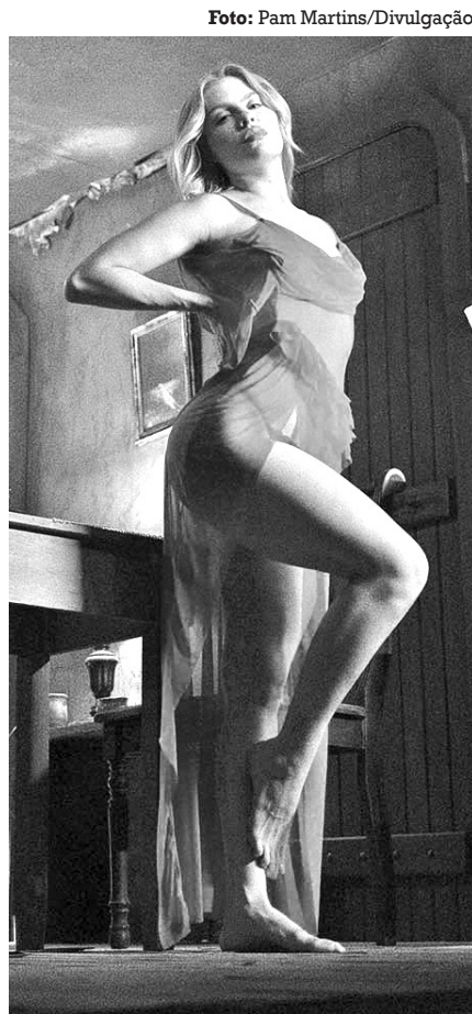
Sonza se apresenta na Domus Hall e Spazzio

Recém-lançado, o terceiro disco da carreira de Luísa Sonza, Escândalo Íntimo já bateu a marca de mais de 200 milhões de acessos nas principais plataformas de áudio. Com 24 faixas, tendo apenas 18 liberadas em seu lançamento, a obra traz feats nacionais e internacionais com ar-