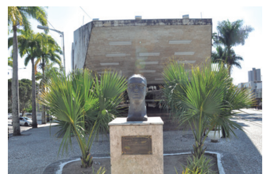
De cima para baixo: fachada e interior do Museu dos Três Pandeiros; busto e frente do Teatro Municipal Severino Cabral, que completa seis décadas neste ano