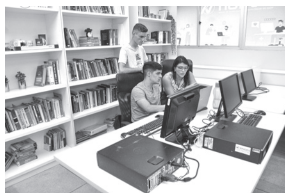
UEPB projetou software que regula as cirurgias

A regulação de cirurgias compreende a solicitação de