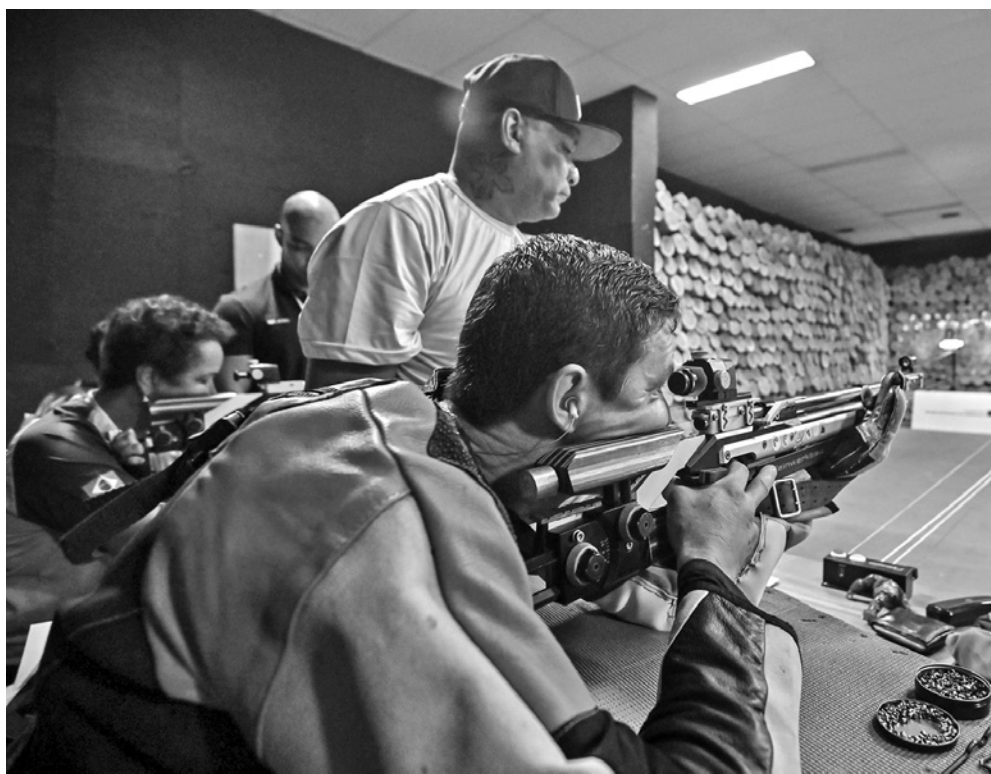
Sete atletas vão representar o Brasil no Tiro Esportivo no Parapan de Santiago