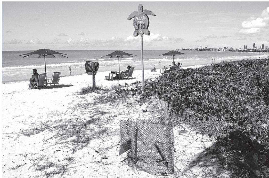
Protegendo os ninhos de tartarugas