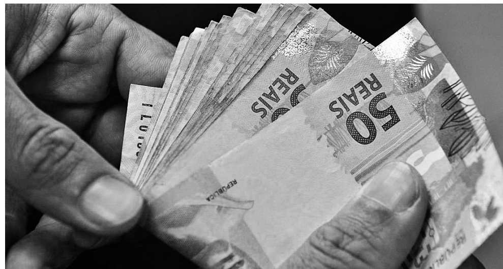
Entidade informou que número de contratos de dívida renegociados chegou a 1,9 milhão

No caso dos contratos incluídos nas condições do programa, as instituições ganharão créditos fiscais do governo, como forma de incentivo a participar do pro-