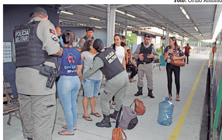
Objetivo é garantir a segurança dos usuários do transporte público

Os passageiros que seguíam no trem foram retirados do veículo e passaram por