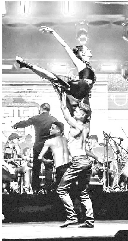
No Santa Roza: Cia. Municipal de Dança

banda Cabruêra, na Casa da Pólvora, a partir das 17h.