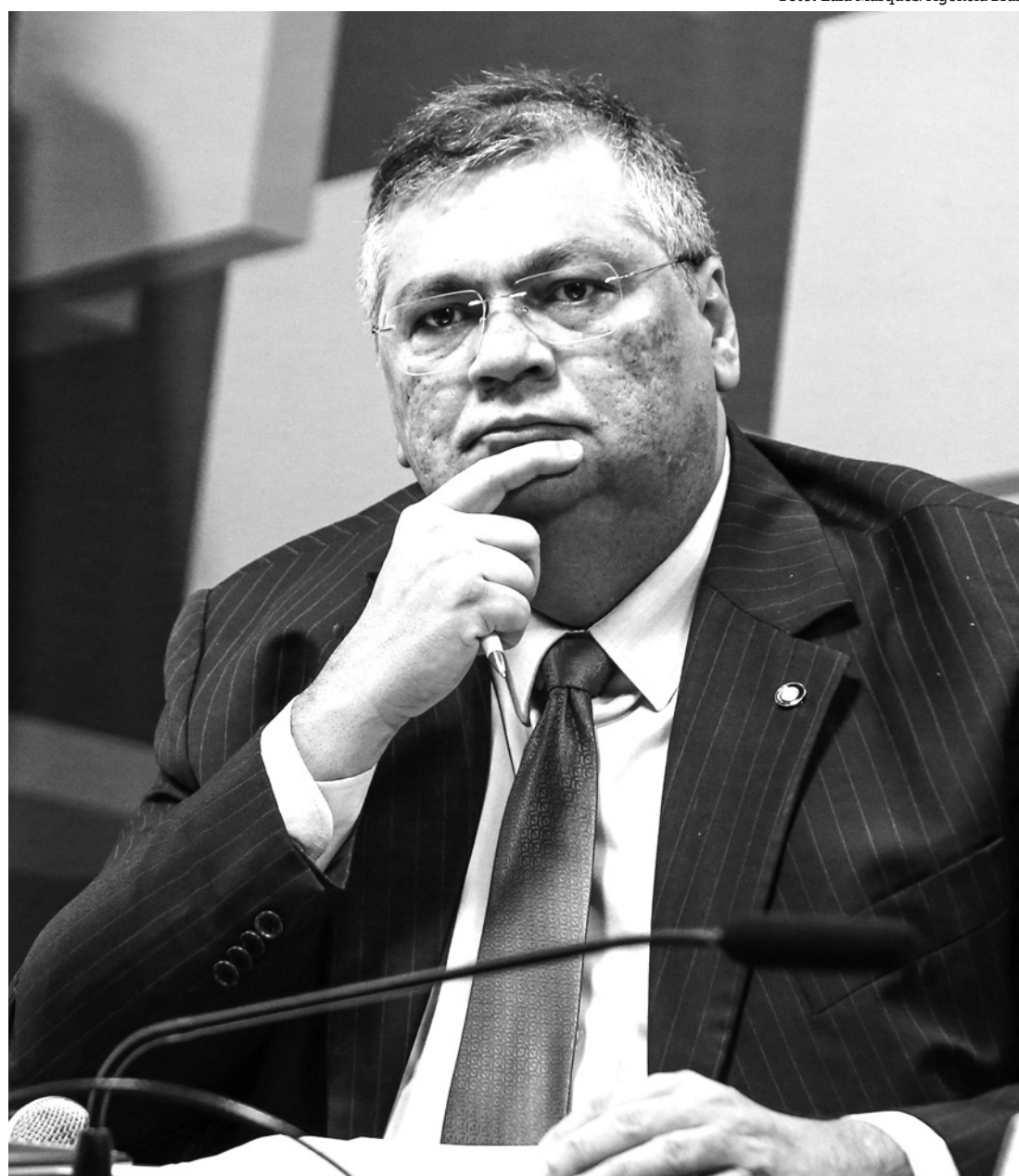
Ministro da Justiça recebeu relatório apontando irregularidades na homologação de acordos da operação

“No que se refere às alegações sobre a criação de fundação (Fundação Lava Jato) para gerir valores de acordo entre a Petrobras e o DOJ/SEC dos Estados Unidos, o que não se concretizou, trata-se de fato posterior a minha saída da 13ª Vara Federal”, disse o senador.