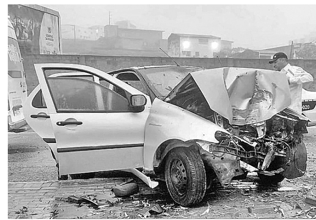
O Siena ficou com a frente totalmente destruída