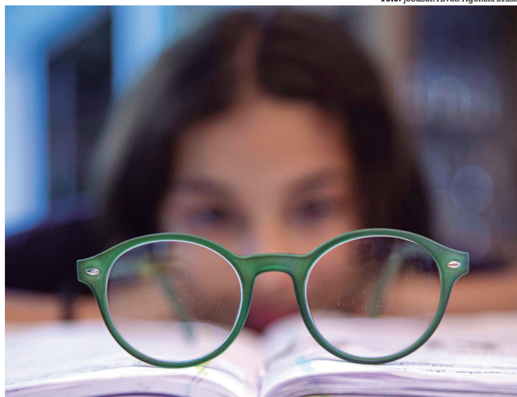
Projeções indicam que, em 2050, em torno de 50% da população global será considerada míope

■ Os dados também servirão para a elaboração de material educativo a ser utilizado na formação de cidadãos e de agentes públicos, com foco na promoção da diversidade e da equidade