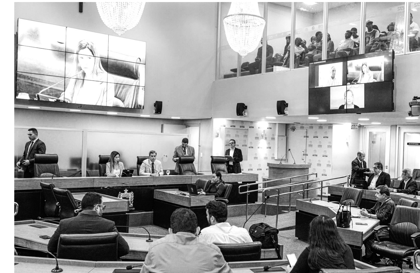
Agora, os parlamentares terão os meses de novembro e dezembro para apresentar emendas, antes do parecer definitivo