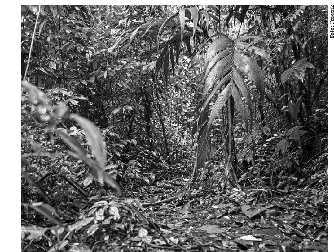
Na Paraíba, foram emitidos nove alertas de desmatamento a serem fiscalizados

Durante a operação, as equipes de fiscalização visitam áreas identificadas com possível ocorrência de degradação. As localizações são mapeadas principalmente a partir da utilização de tecnologia do projeto MapBiomas, ferramenta que permite a obtenção de imagens de satélite em alta resolução para a constatação de desmatamentos. Quando detectados os ilícitos ambientais, os responsáveis são autuados e podem responder judicialmente nas esferas cível e criminal, além de estarem sujeitos às sanções administrativas relacionadas aos registros das propriedades rurais. No ano passado, a Operação Mata Atlântica em Pé identificou 11,9 mil