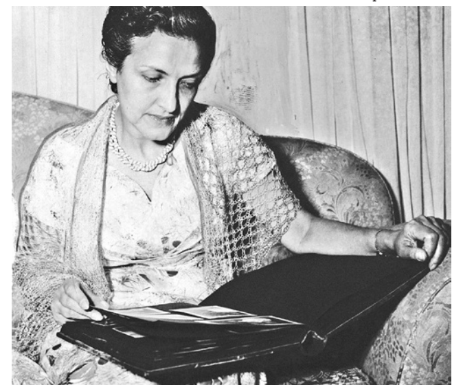
Cecília Meireles escreveu várias crônicas como “poema em prosa”