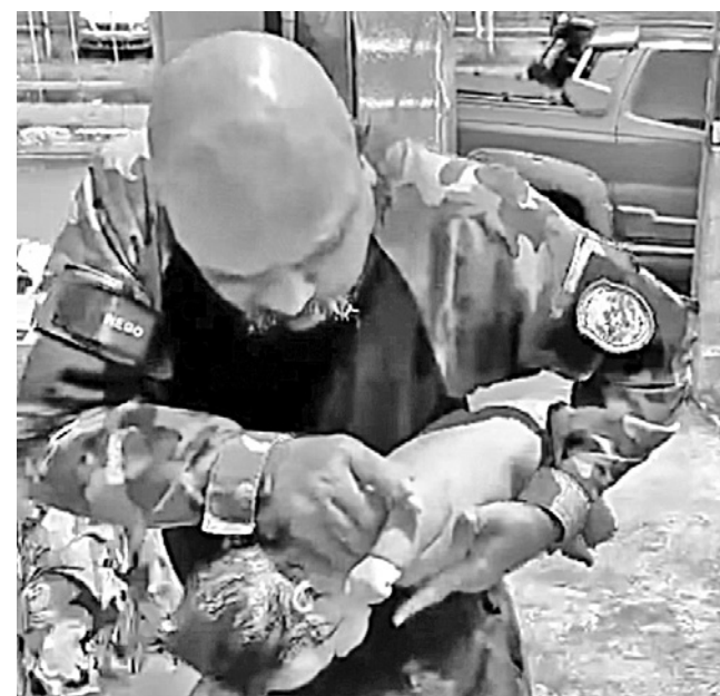
Militar fez os procedimentos para reanimar o bebê