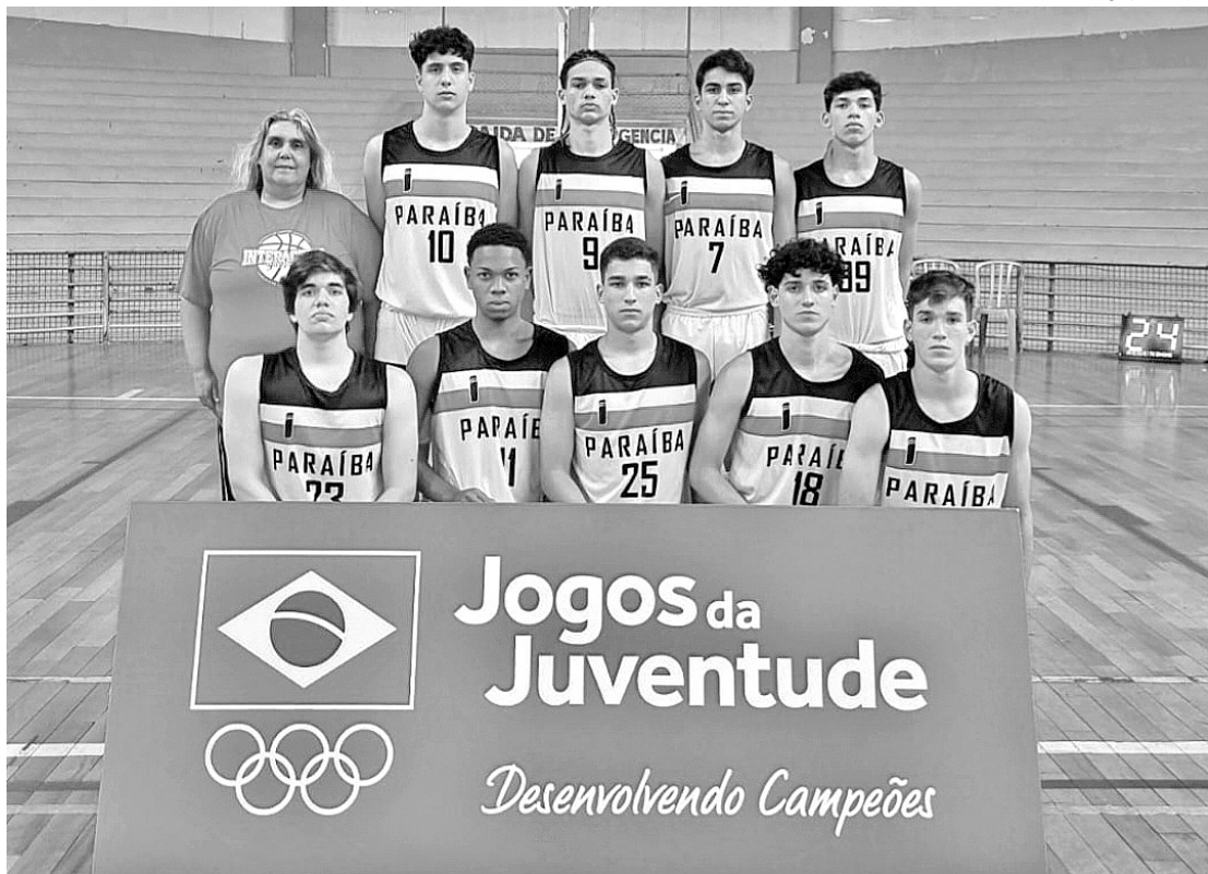
A equipe de basquete masculino conseguiu uma medalha de prata nas modalidades coletivas

Com 17 medalhas conquistadas, sendo cinco de ouro, quatro de prata e oito de bronze, a Paraíba concluiu a participação nos Jogos da Juventude na oitava colocação geral, sendo o segundo melhor estado das regiões Norte e Nordeste. Organizada pelo Comitê Olímpico do Brasil (COB), a competição foi encerrada no sábado (16) em Ribeirão Preto, interior de São Paulo e o Governo do Estado, por meio da Secretaria de Estado da Juventude, Esporte e Lazer (Sejel) arcou com as 200 passagens da delegação paraibana.