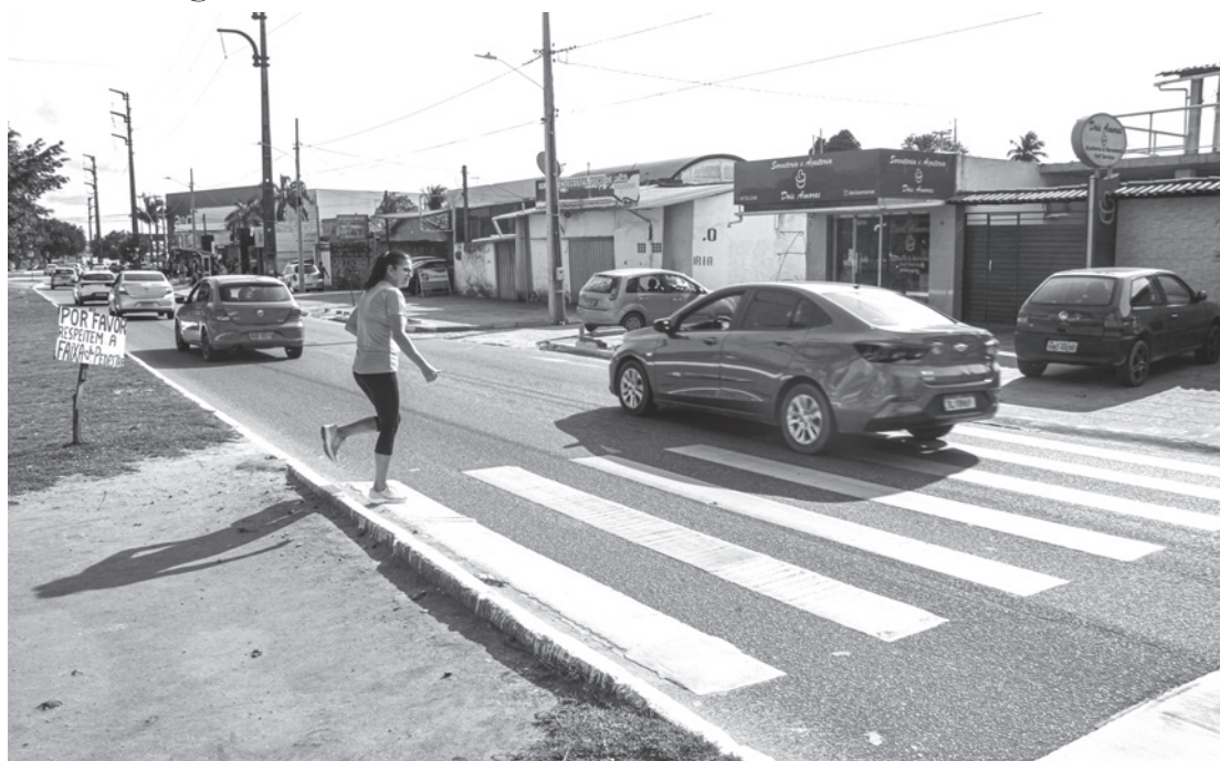
Lugar do pedestre ou do automóvel?