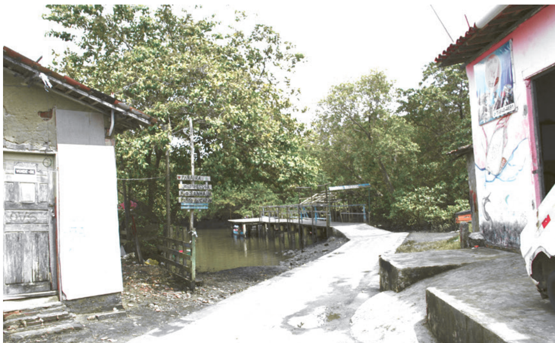
A Comunidade do Porto do Capim, no Varadouro, compreende a Vila Nassau e Vila Frei Vital

A atual proposta para a área da Proserv limitado ao terreno que foi demolido é exclusivamente a construção de habitações, sem prédios comerciais. Já a urbanização total da comunidade Porto do Capim é um outro projeto que pode contemplar tanto unidades habitacionais como comerciais, mas isso ainda não foi definido pela prefeitura. Acerca da possibilidade dos moradores da Comunidade Porto do Capim serem encaminhados ao local do antigo prédio da Proserv, a secretária de Habitação informou que não existe nada definido neste sentido porque isso depende de uma avaliação da demanda de quem estaria em risco e quem realmente precisava sair e estas são discussões que ainda serão realizadas.