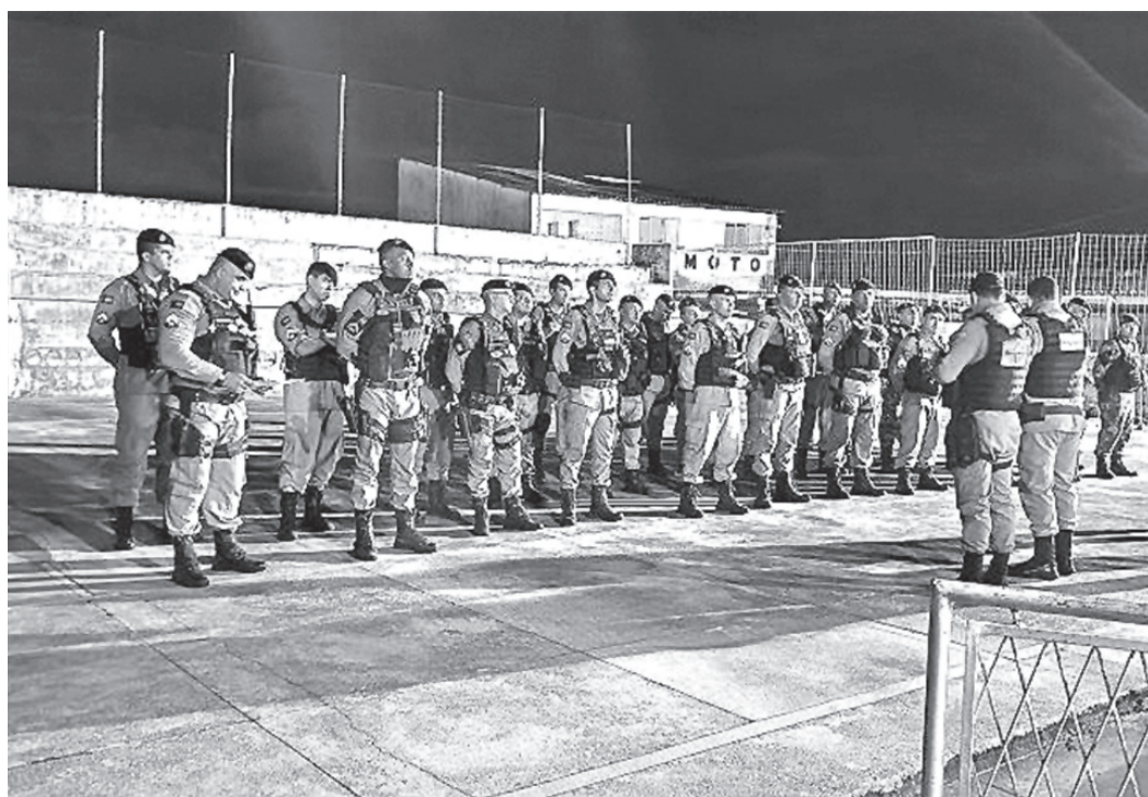
Policiais se reuniram na quadra do 1º BPM, de onde saíram para cumprir os mandados

Ação As operações ocorreram na Região Metropolitana de João Pessoa e, nos primeiros dias do mês de maio, foram cumpridos 30 mandados judiciais