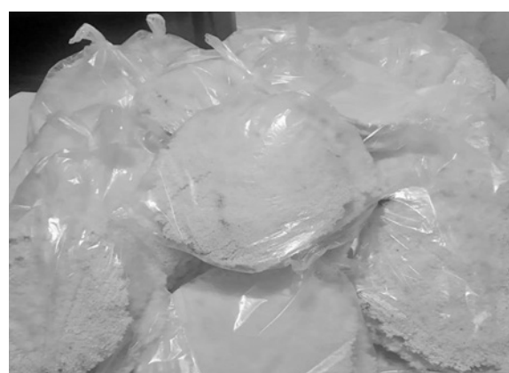
Tem tapioca com recheios para todos os gostos

da tapioca é que consigo meu sustento e de minha família”, contou.