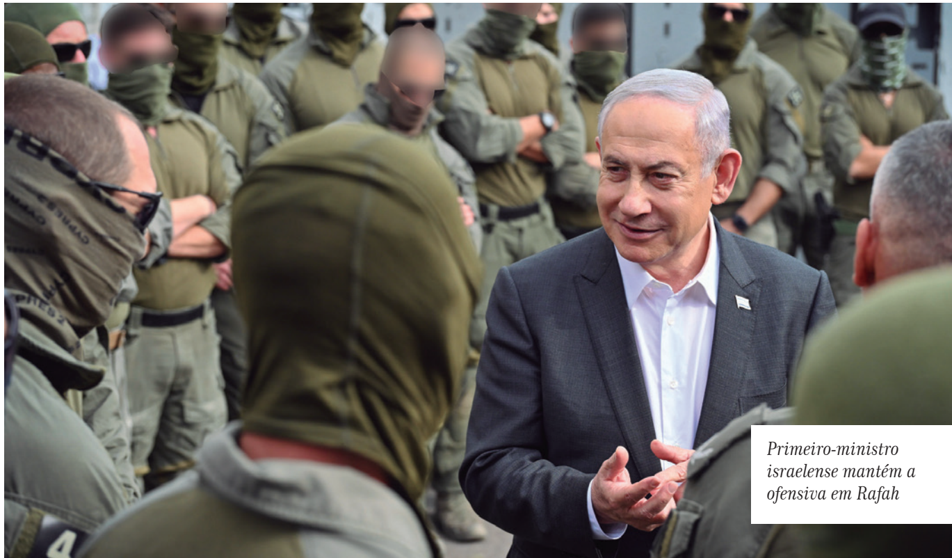
Primeiro-ministro israelense mantém a ofensiva em Rafah

A escalada ocorre uma semana depois que Milei obteve sua primeira vitória legislativa, fazendo com que o projeto de lei no centro de sua reforma econômica fosse aprovado na câmara baixa do Congresso, depois de ter sido forçado a retirar uma versão mais abrangente no início deste ano. O projeto de reforma do Estado e os pacotes de impostos propostos estão agora sendo debatidos no Senado, dominado pela oposição.