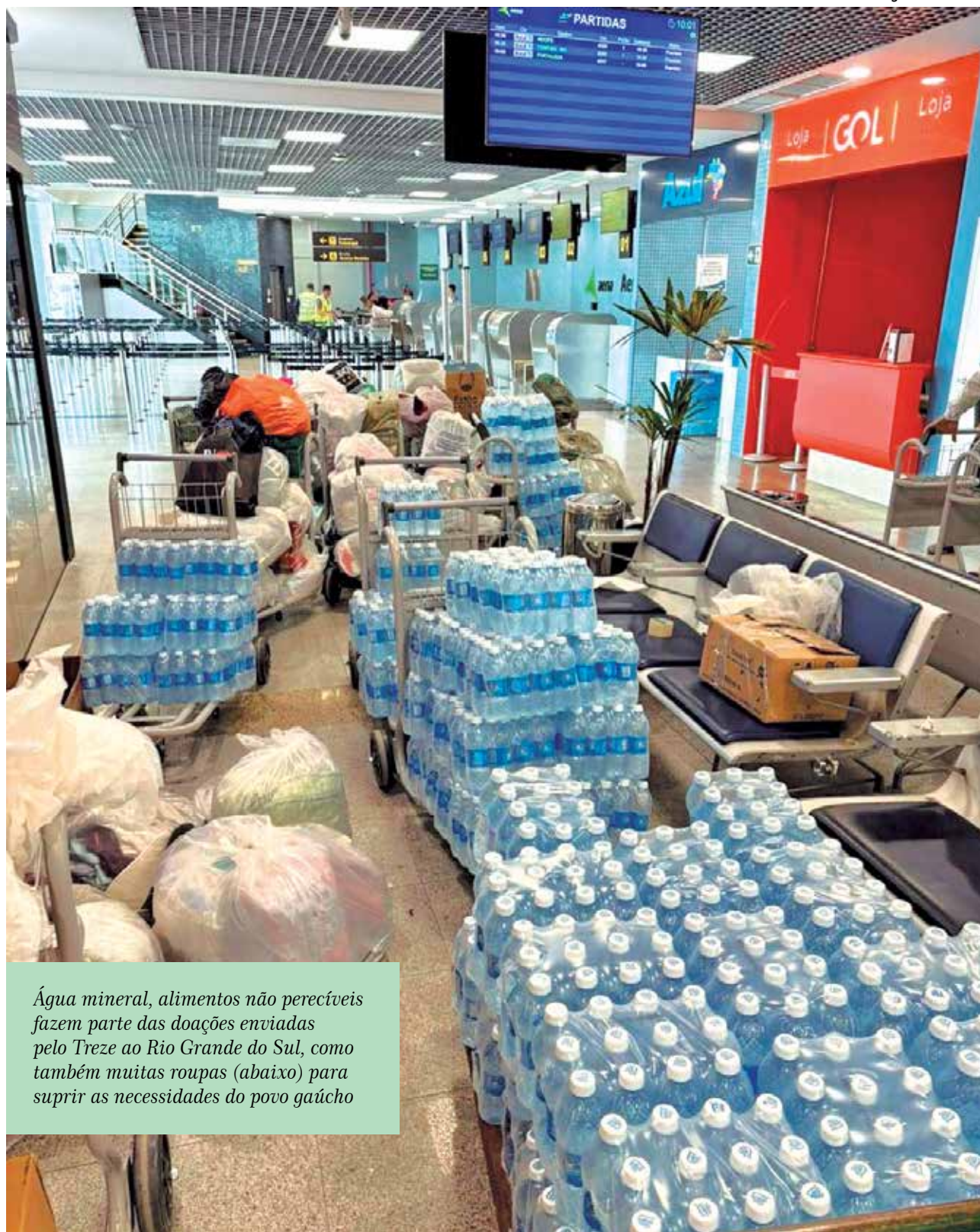
Água mineral, alimentos não perecíveis fazem parte das doações enviadas pelo Treze ao Rio Grande do Sul, como também muitas roupas (abaixo) para suprir as necessidades do povo gaúcho

“Mostre a força da maior torcida da Paraíba e marque este golaço praticando solidariedade para aqueles que tanto precisam neste momento!”, frisou a publicação realizada pelo Treze. De acordo com boletim divulgado ontem pela Defesa Civil do estado, já haviam sido registradas mais de 100 mortes e outras quatro estavam sendo investigadas. Além disso, 131 pessoas estavam desaparecidas até o momento e outras 362 ficaram feridas em decorrência do desastre climático.