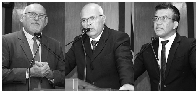
Pronunciamentos estão relacionados à Operação Mandare

“Trata-se de intimidação, atos de violências praticados em residenciais, onde são impostas regras aos mora-