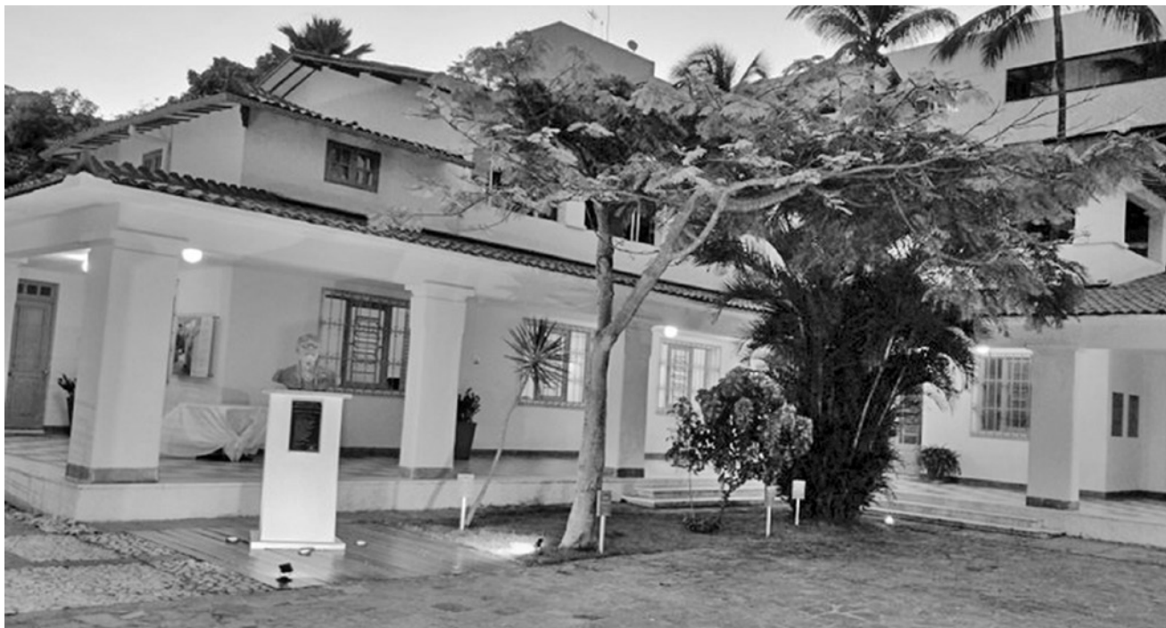
Residência abriga o Auditório Juarez da Gama Batista, no Cabo Branco, onde serão feitos os debates, na terça-feira, às 9h

A professora contou que os alunos vão produzir um relatório sobre a visita ao jornal e sobre os gêneros jornalísticos midiáticos.