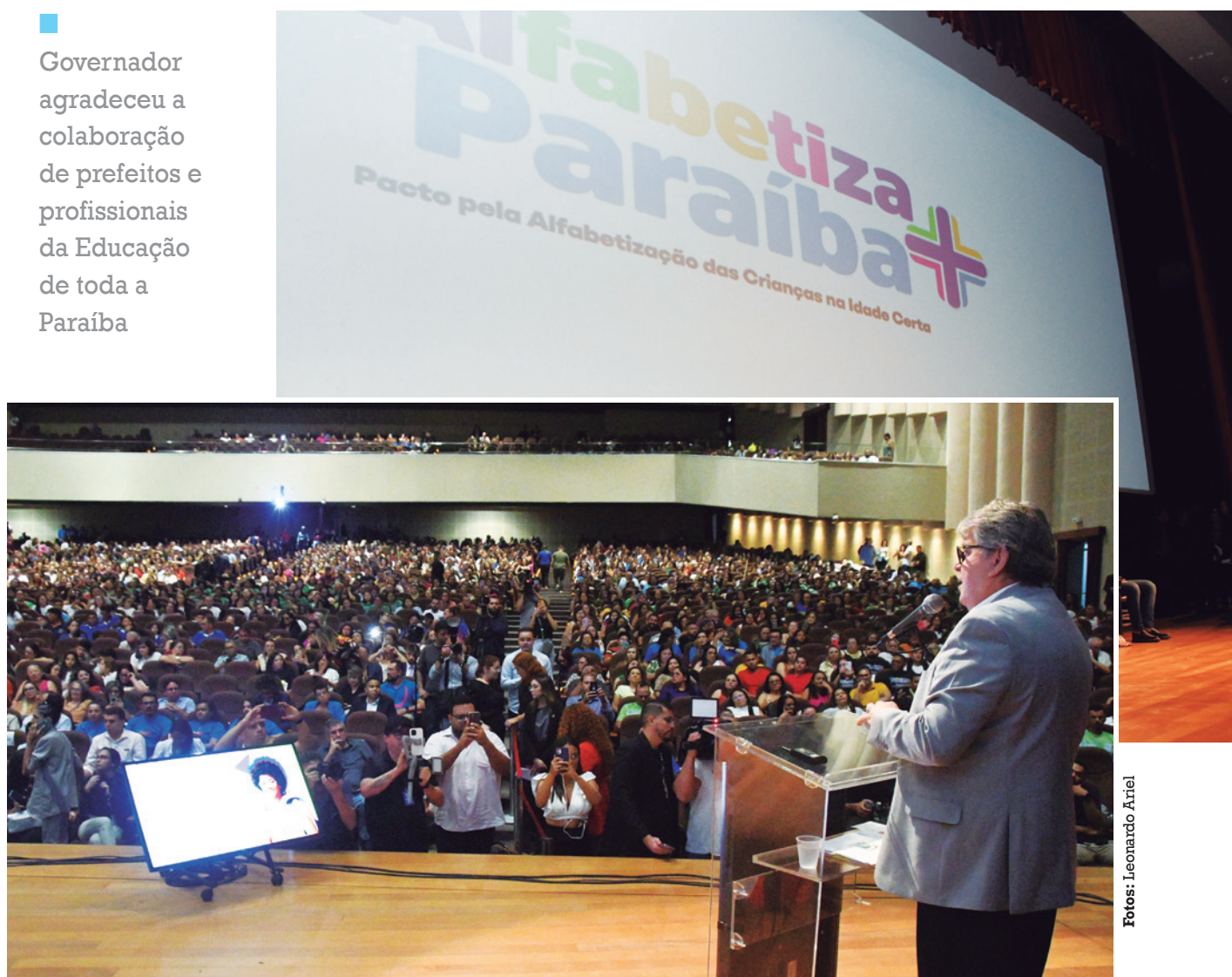
Chefe do Executivo estadual destacou que a educação transforma realidades e abre caminhos para um futuro melhor

■ Governador agradeceu a colaboração de prefeitos e profissionais da Educação de toda a Paraíba