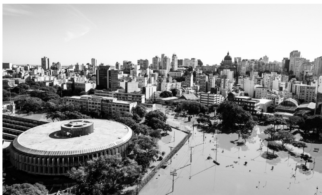
Chuvas provocaram inundações, enxurradas, deslizamentos e desmoronamentos em todo o estado

Ainda de acordo com o governador, os cálculos, bem como as ações já delineadas para responder à situação de calamidade pública no estado serão divulgados. "Vamos detalhar as ações projetadas que contemplariam as