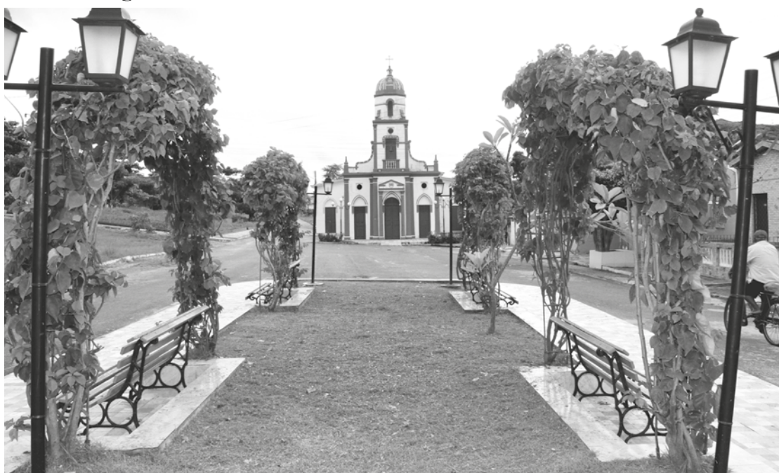
A paz das pequenas cidades