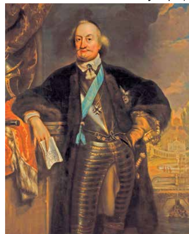
Conde João Maurício de Nassau (1604-1679): mal do tabaco