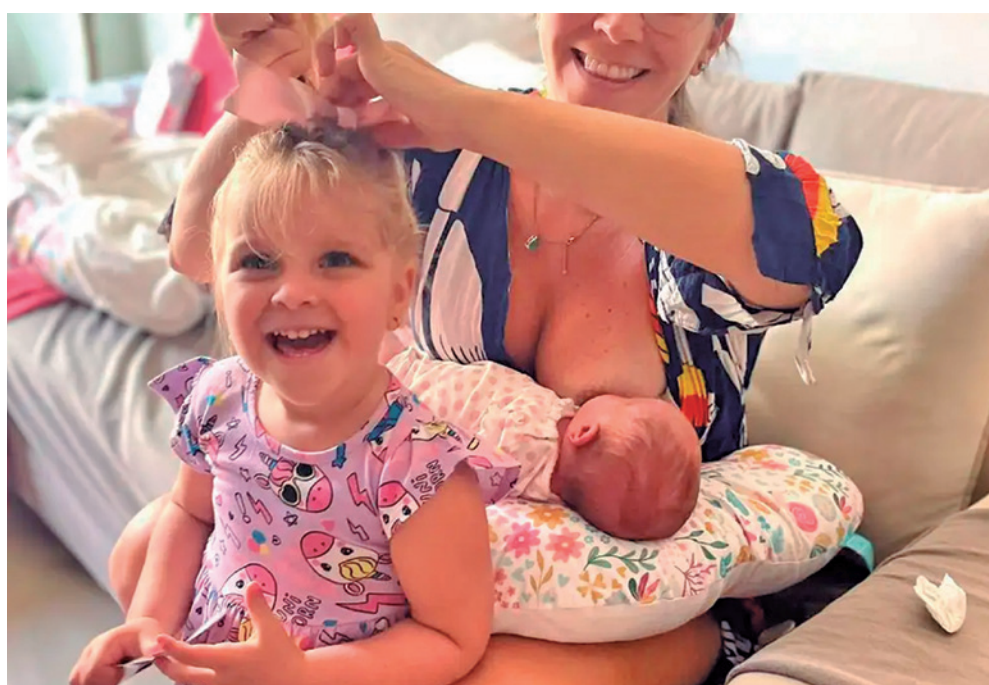
Propósito é aumentar a coleta do leite materno em torno de 30%, mais de 300 litros