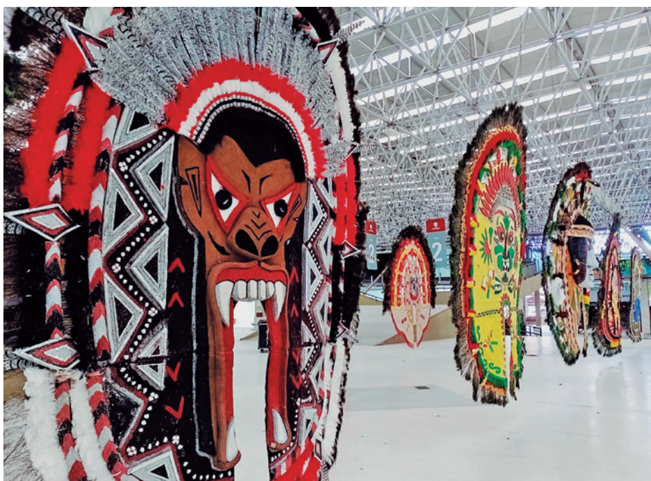
Exposição pode ser visitada até 30 de junho na Praça do Povo do Espaço Cultural

Em 18 de novembro de 2022, foi sancionada pelo governador a Lei nº 12.452/22, que “reconhece as Tribos Indígenas Carnavalescas como Patrimônio Cultural Imaterial do Estado da Paraíba. As Tribos Indígenas Carnavalescas constituem-se como manifestação popular que envolve dança, música, encenação e poesia oral, que pertencem à categoria de formas de expressão, identificadas também como uma dança dramática.