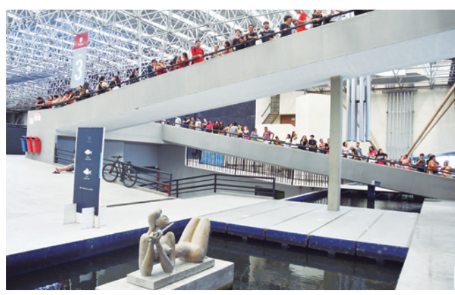
Equipes do TRE-PB atenderam 2.267 eleitores na capital