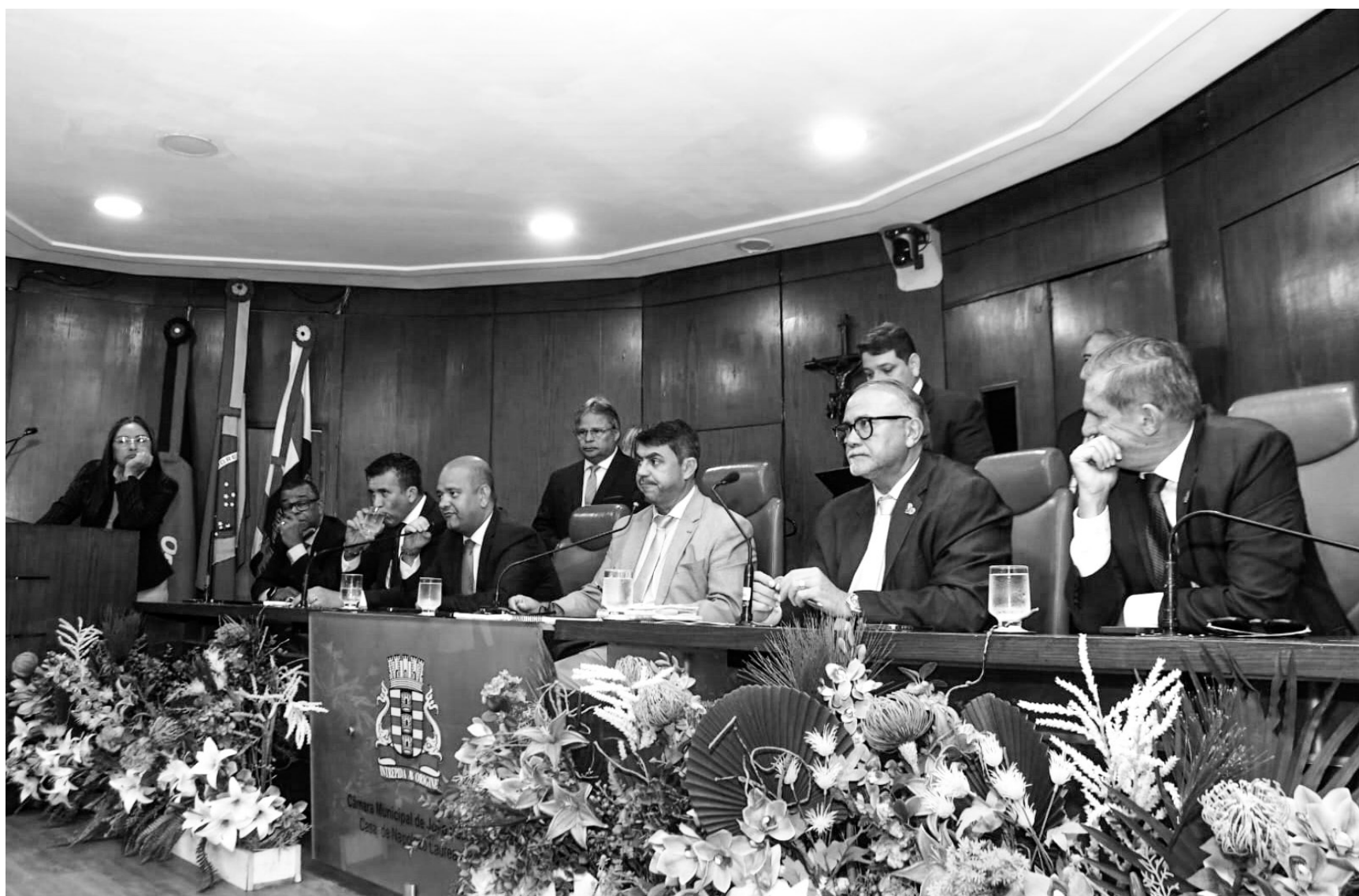
Montante será utilizado na urbanização e revitalização das margens do Rio Jaguaribe, como também em intervenções na área de mobilidade urbana

ma de esgotamento sanitário para coleta e tratamento de efluentes das casas regularizadas”, explica a mensagem de Cícero Lucena.