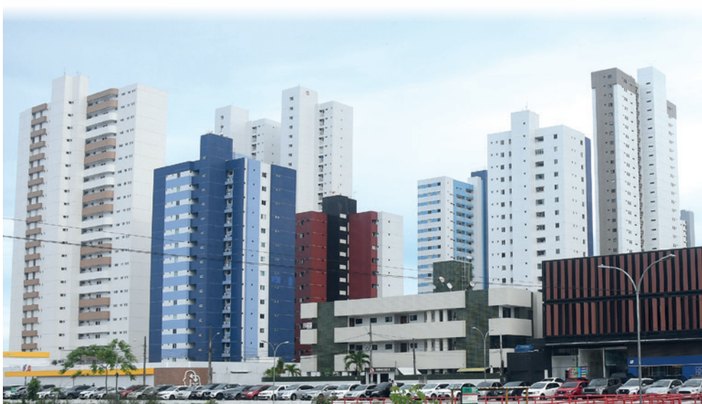
Bessa, Aerooclube e Jardim Oceania tiveram maiores altas nos preços do metro quadrado