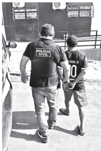
A prisão aconteceu em Picuí

Após um levantamento minucioso, os investigadores identificaram os assaltantes e suas respectivas residências. O delegado informou ter representado pela prisão preventiva da dupla, bem como pela bus-