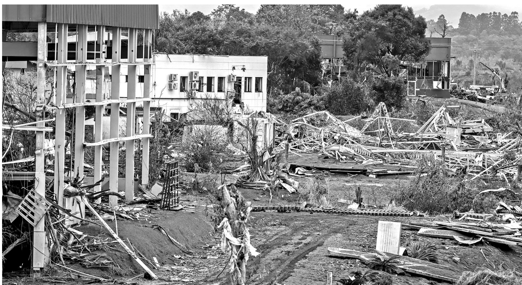
Representante do BNDES afirma que bancos de desenvolvimento terão que enfrentar a realidade dos eventos climáticos extremos e dos refugiados climáticos

"O volume dos recursos envolvidos e o prazo necessário tornam inevitáveis uma participação mais direta do governo", disse Barbosa. "O BNDES vai cumprir seu papel, de auxiliar o