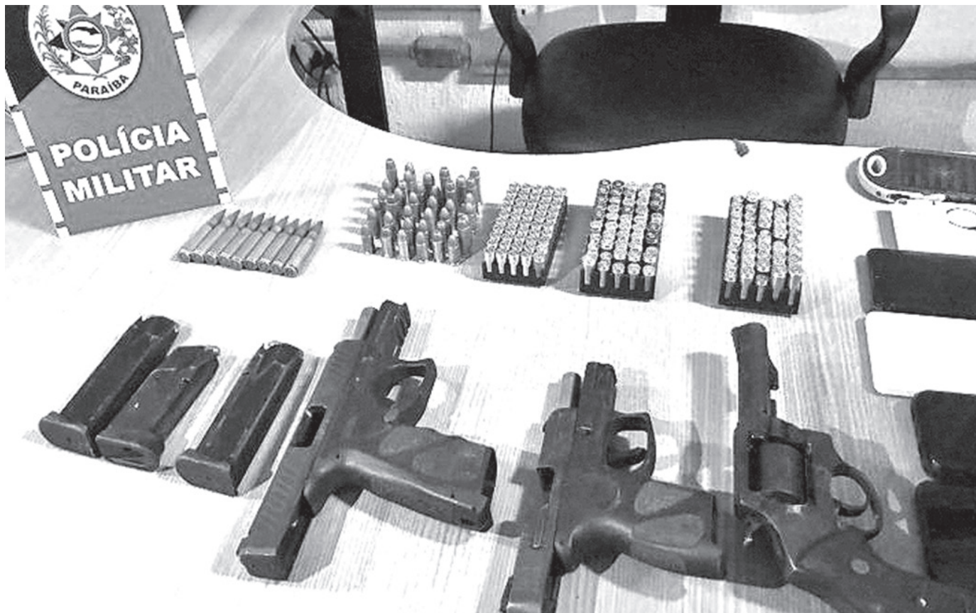
Dois pistolas e um revólver estavam em poder do grupo, que também tinha uma grande quantidade de munições

Quatro dos suspeitos foram detidos na primeira ação, em um carro roubado. Com eles, foram apreendidas duas pistolas, um revólver e 238 munições de vários calibres. Os detidos nessa ação têm 29, 25, 18 e 17 anos e são das cida-