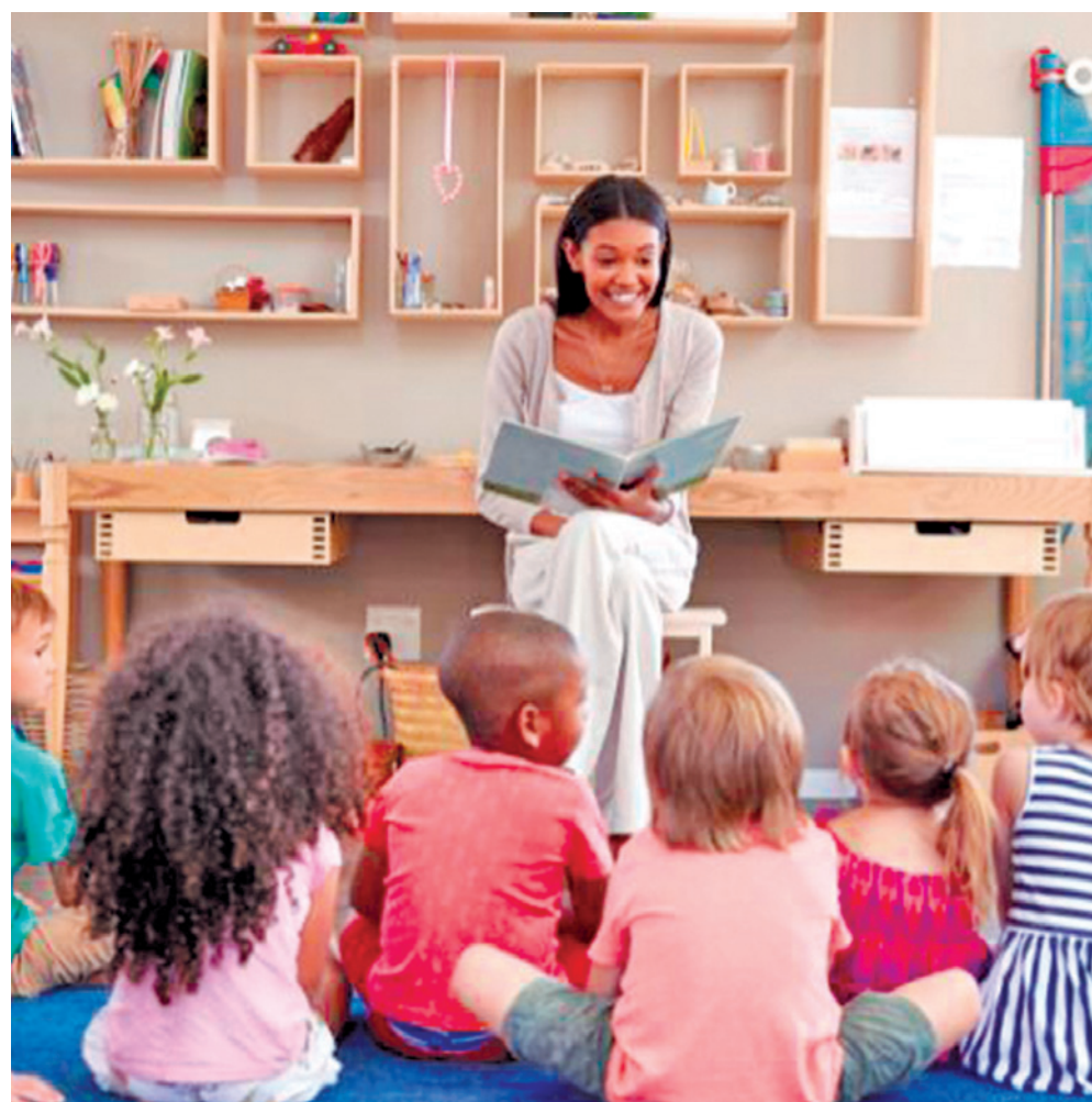
Ação proposta pelo MPPB visa a promoção da igualdade racial na rede pública de ensino

A cópia da recomendação também foi enviada à Secretaria da Mulher e da Diversidade Humana, ao Conselho Estadual de Educação, às gerências regionais de Ensino, ao Conselho Estadual de Promoção à Igualdade Racial; à Assembleia Legislativa; ao Conselho Estadual de Direitos Humanos; e aos movimentos negros existentes na Paraíba.