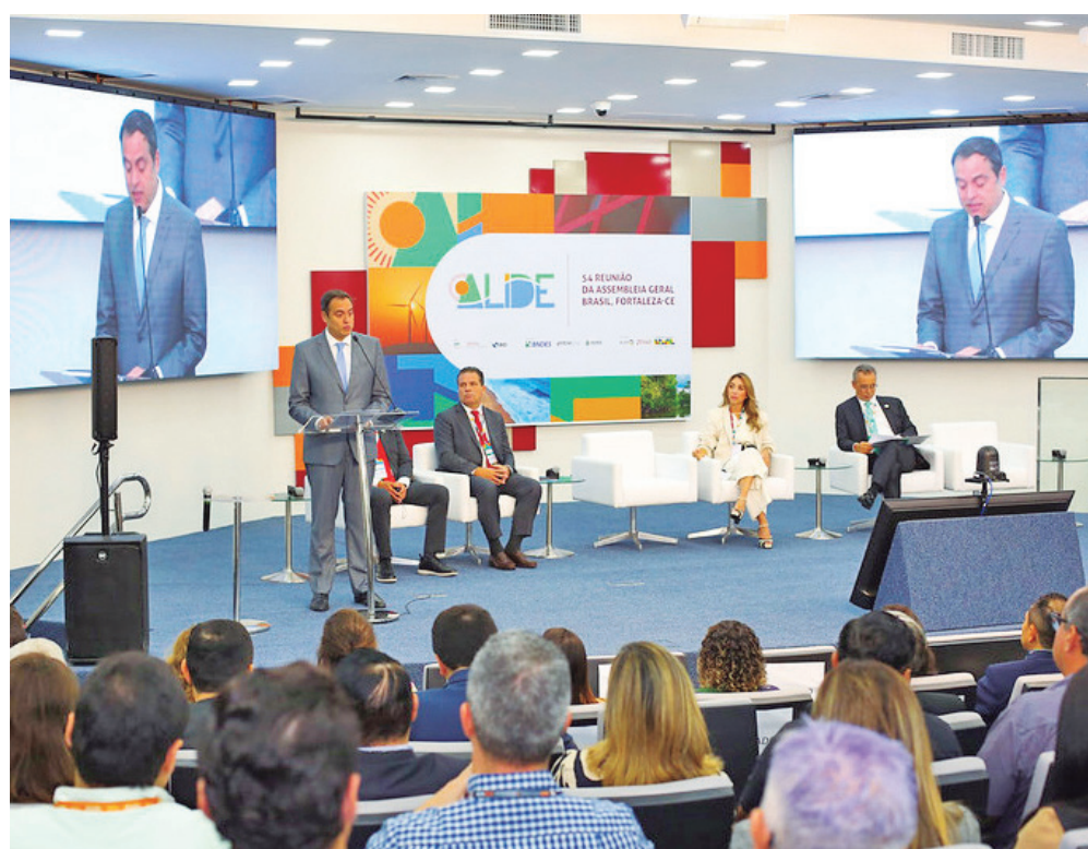
Instituições se comprometeram a aprimorar a seleção de critérios ambientais e sociais

O documento destaca o compromisso de reforçar o apoio aos setores produtivos para melhorar as condições macroeconômicas locais, como níveis de dívida e taxas de juros. Além disso, as instituições se comprometeram a facilitar a inclusão social e financeira de comunidades indígenas, jovens empreendedores, idosos e projetos liderados por mulheres.