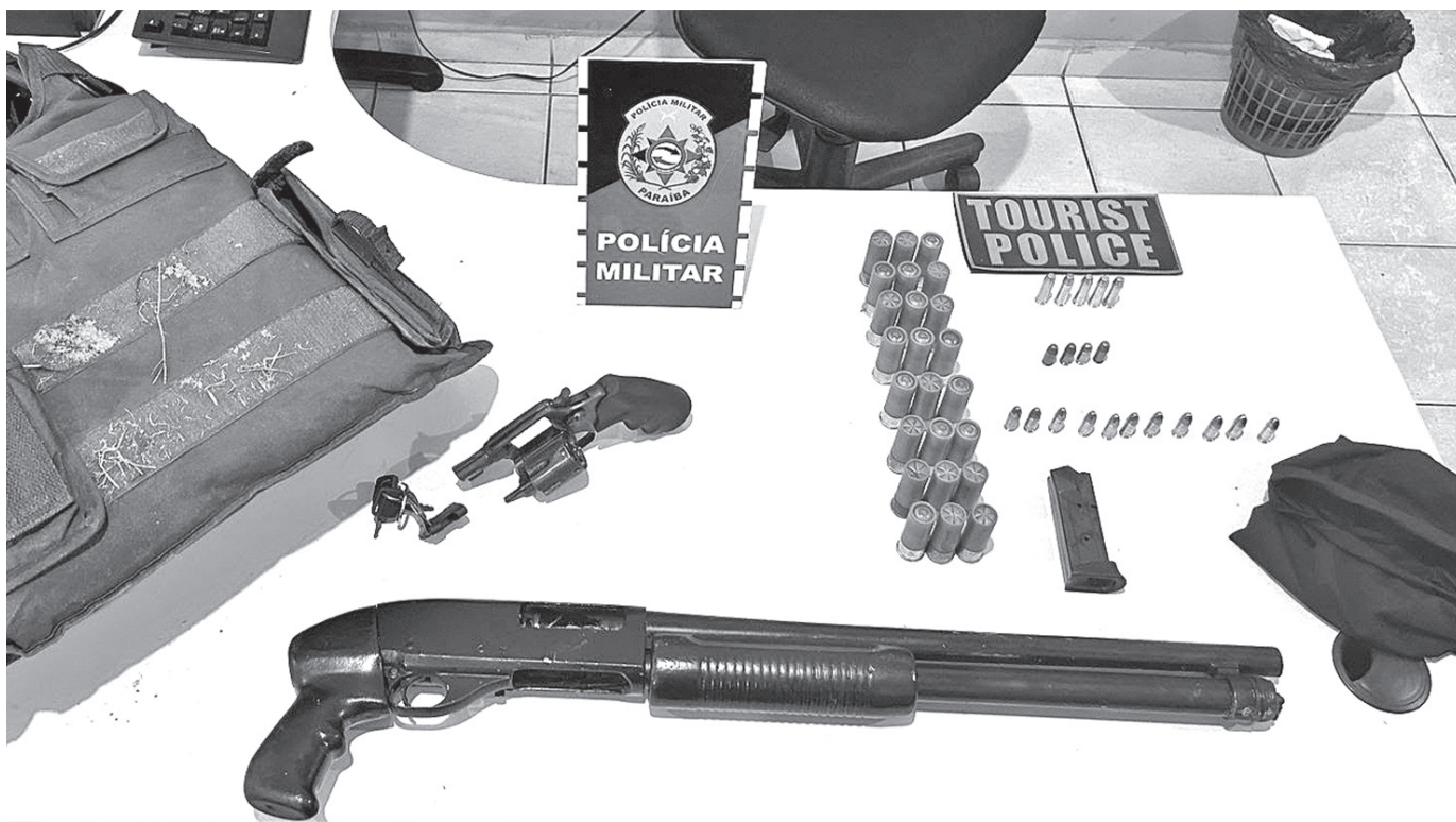
Com o grupo que pretendia assaltar o carro-forte, os policiais apreenderam armas, inclusive uma escopeta calibre 12