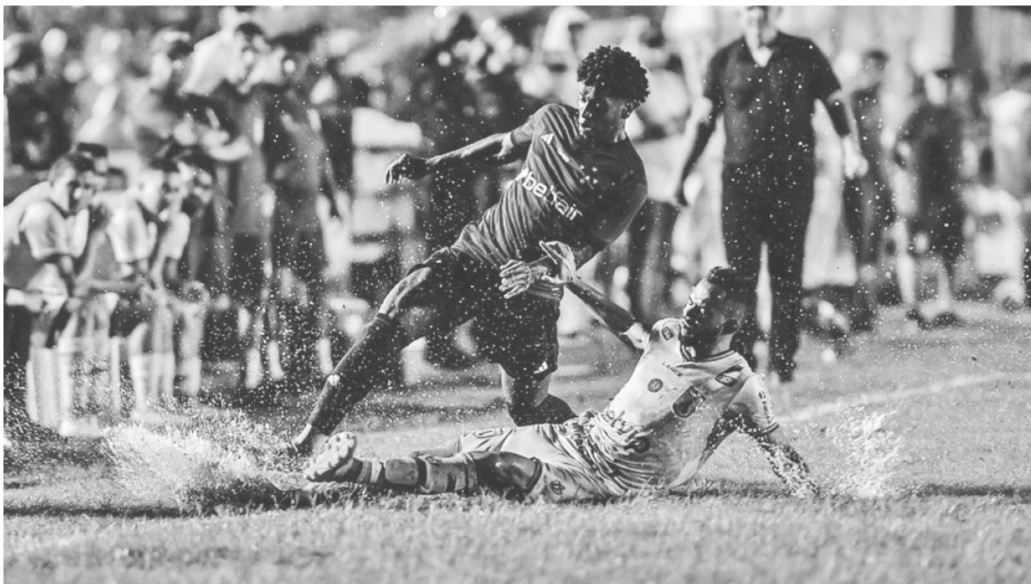
Na primeira partida pela Copa do Brasil, o Sousa venceu o Cruzeiro por 2 a 0, no Estádio Marizão, embaixo de muita chuva