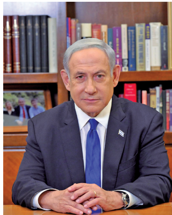
Para Netanyahu, o mandato é um ato antisemita