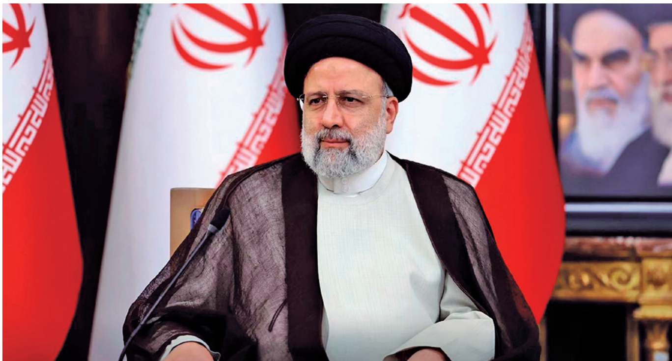
Ebrahim Raisi era considerado um político ultraconservador. Ele foi eleito presidente em 2021, no primeiro turno do pleito

Até o fechamento desta edição, o Hamas ainda não havia se pronunciado sobre o assunto.