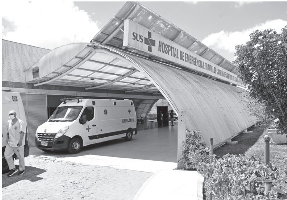
Em 2023, foram atendidos 14 pacientes com queimaduras por explosão de fogos no Trauma-CG

“Pode ser uma Unidade Básica de Saúde, uma UPA [Unidade de Pronto Atendimento], ou o que for mais perto para o paciente. Até porque, nas grandes queimaduras, as primeiras horas de atendimento fazem toda a diferença no resultado. E também, para a transferência ser correta, você não pode pegar um grande queimado, colocar num carro comum e transportar até o Trauma, mas levar para o serviço de saúde, onde o paciente vai ser estabilizado e transferido em ambulância para o Hospital de Trauma”, esclarece Isis.