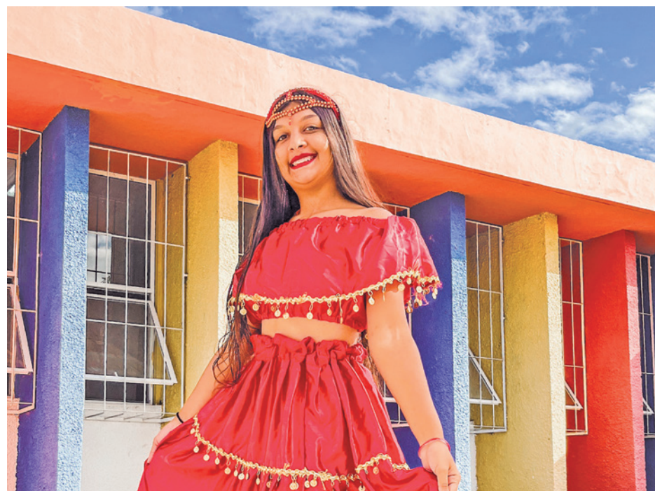
Programação do evento, lançado hoje, inclui apresentações culturais em Condado