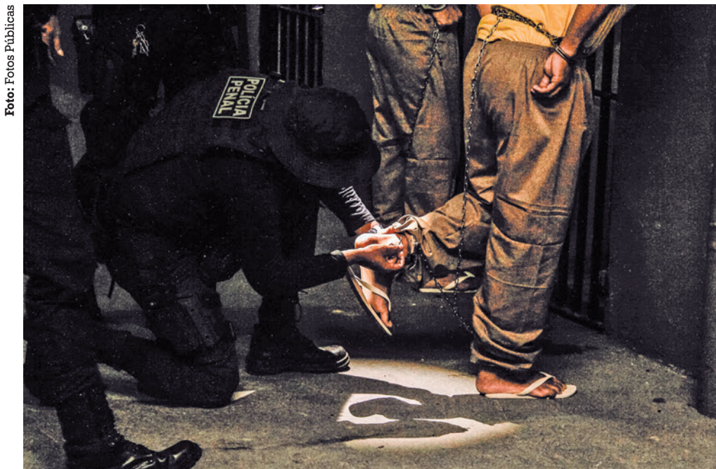
Obra reúne artigos científicos e relatos de 33 profissionais que trabalham na Seap-PB