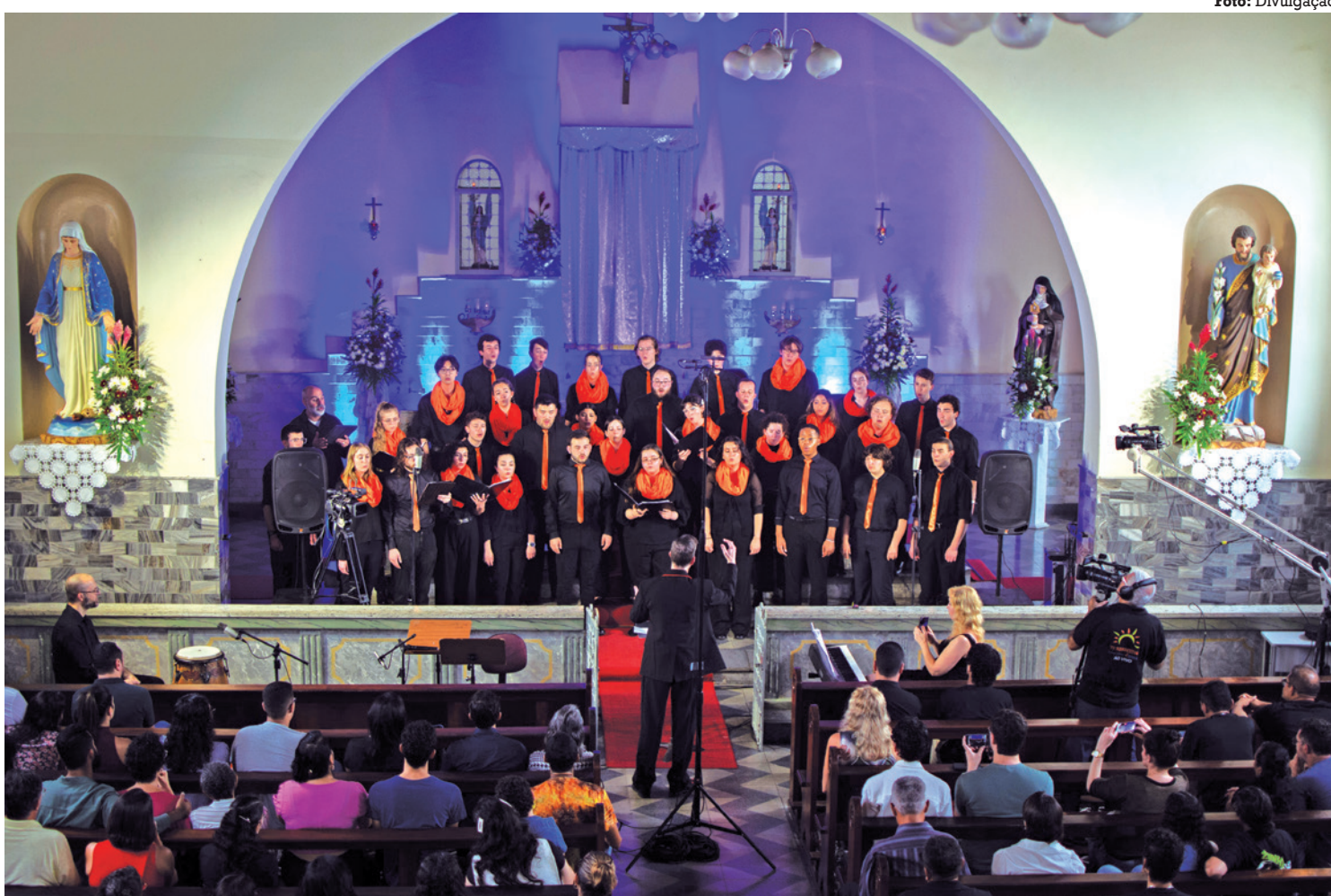
O Syracuse University Singers se apresentou no evento, que foi realizado no Mosteiro de Santa Clara no sábado pela manhã

A programação conta com diversas categorias, dividindo as atrações em “Master”, “Jovens Talentos”, “Músicas do Mun-