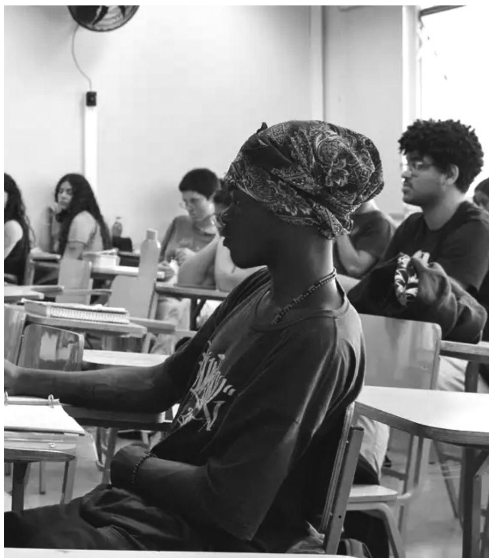
Proposta do senador Paulo Paim, do PT-RS, substituirá Lei de Cotas no Serviço Público