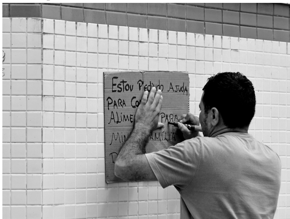
Reforçando o pedido