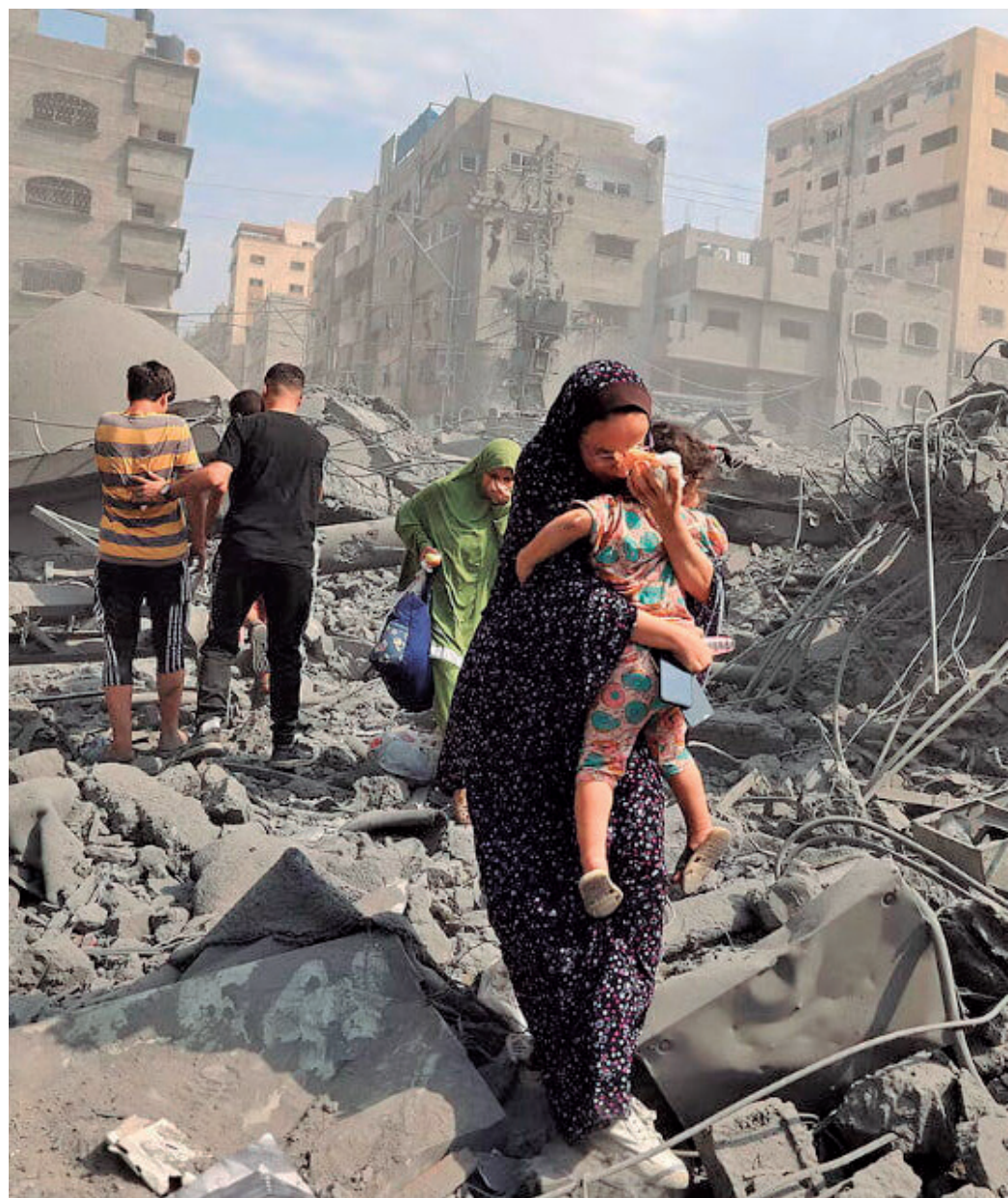
Ataques a Gaza, desde outubro de 2023, já deixaram 43.900 mortos, ao menos 16.700 crianças

Conselho de Segurança da ONU votou a favor da resolução, mas ela não foi adotada devido ao veto dos EUA