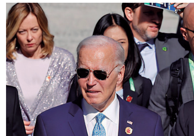
Biden permitirá que a Ucrânia use minas terrestres

A embaixada americana disse que o fechamento do local foi realizado no contexto de contínuos ataques de mísseis e drones russos na cidade. Diferentemente de outras embaixadas do Ocidente, a do Reino Unido permaneceu aberta.