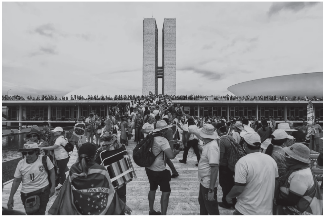
Requerimento é referente aos atos golpistas que resultaram na depredação da Praça dos Três Poderes

“Além de demonstrar a gravíssima trama criminosa dos chefes do golpe, que poderiam vir a se beneficiar da anistia proposta, a perspectiva de perdão ou impunidade dos envolvidos tem servido de estímulo a indivíduos