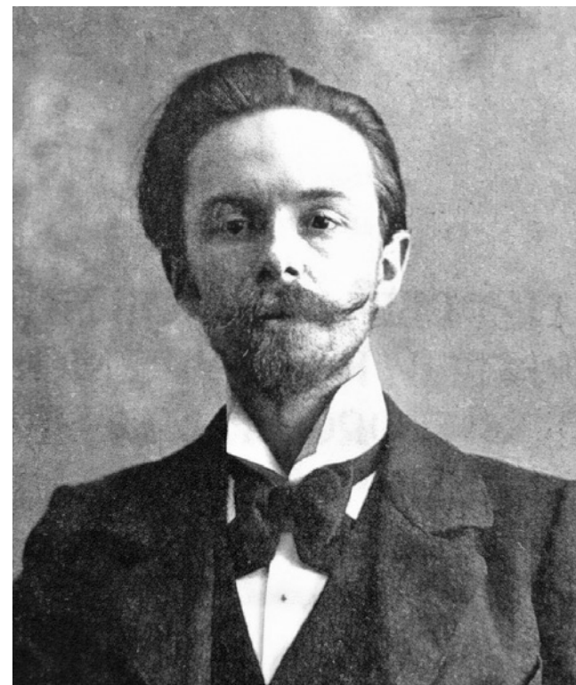
Scriabin: atingir os confins do universo e da imaginação