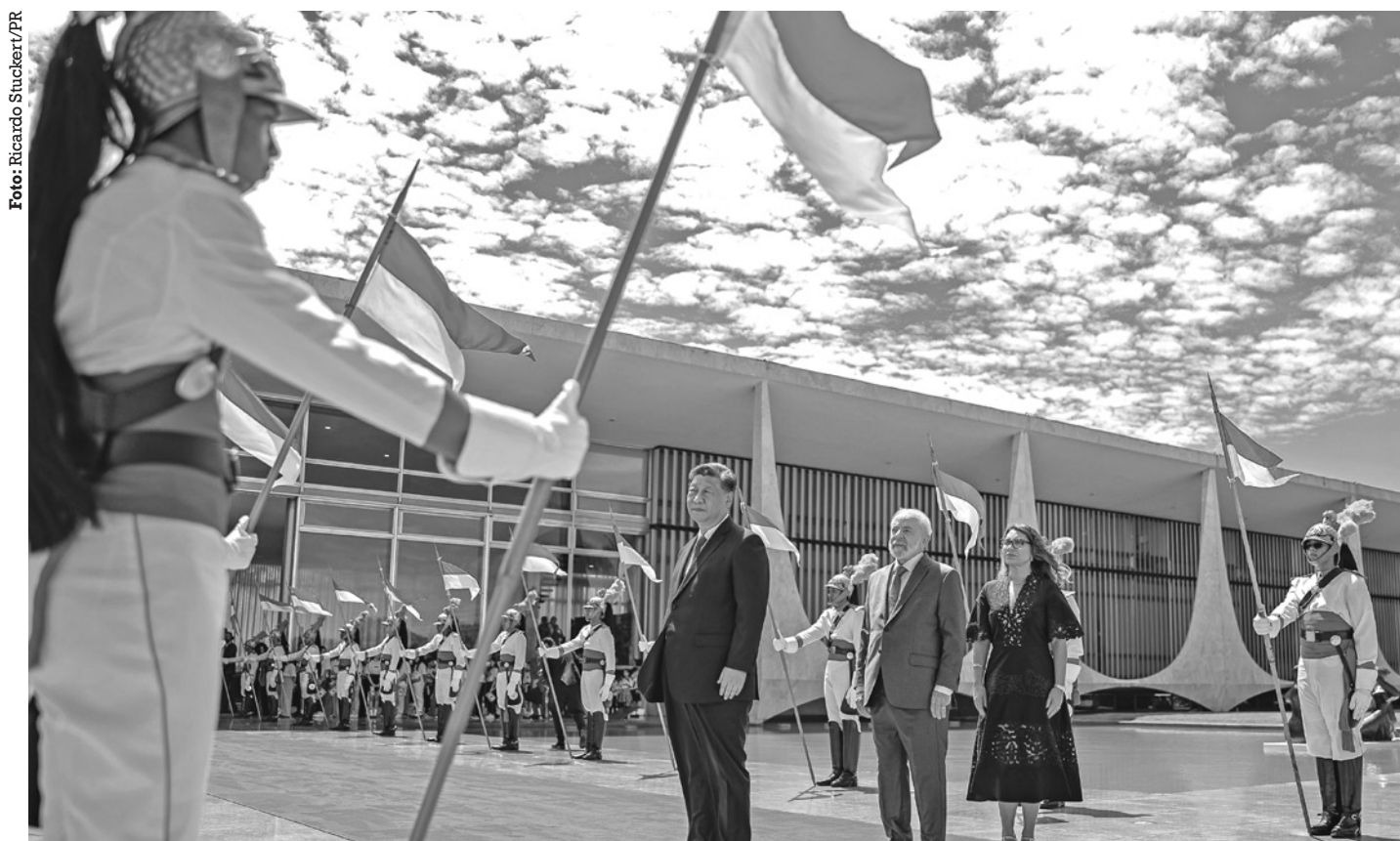
Líder chinês foi recepcionado pelo presidente Lula, com honras militares, ontem, no Palácio da Alvorada, em Brasília

No fim da tarde, um jantar foi servido ao chinês no Palácio Itamaraty, sede da diplomacia brasileira. Xi Jinping deve deixar o Brasil na manhã desta quinta-feira (21).