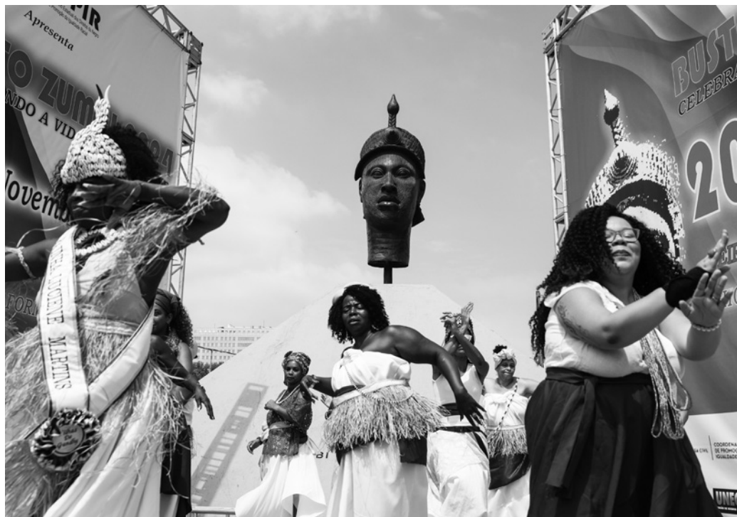
No Rio de Janeiro, festividades se concentraram em frente ao Monumento de Zumbi dos Palmares