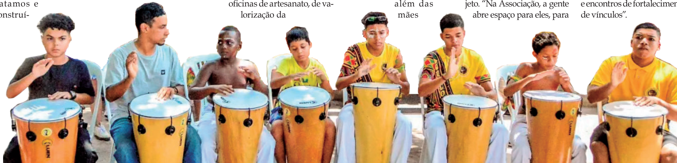
Além de artesanato, pintura, dança e palestras, evento contou com apresentações da iniciativa de musicalidade com diferentes instrumentos, que tem cerca de 50 jovens participantes

adquirirem o conhecimento em todas as oficinas. Além dessas que estão hoje, aqui no evento, temos computação, tanto o básico quanto o avançado, como montar sua própria empresa on-line, música, maquiagem para as mulheres negras, danças afro, teatro e encontros de fortalecimento de vínculos”.