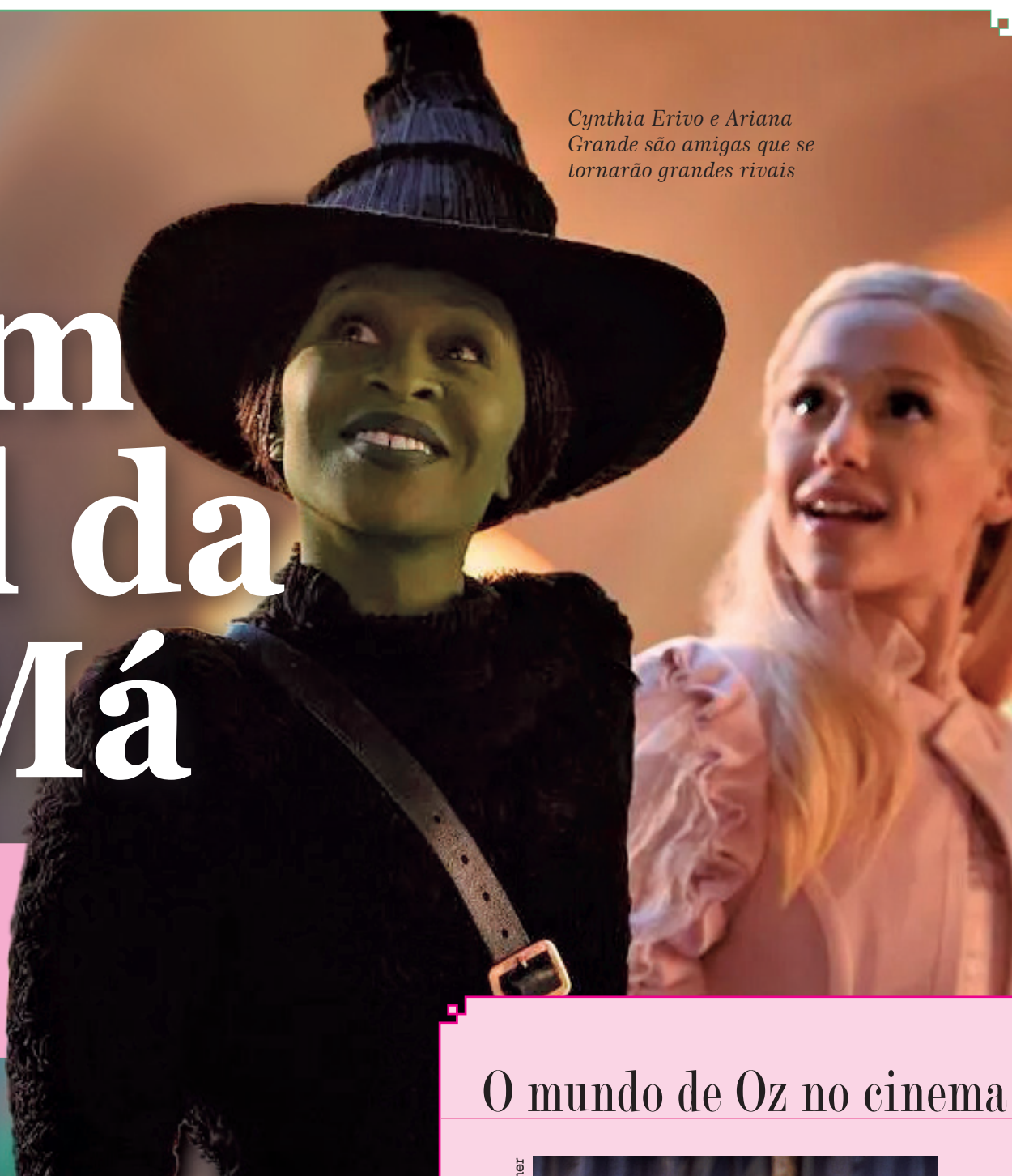
Cynthia Erivo e Ariana Grande são amigas que se tornarão grandes rivais

O prelúdio de “O Mágico de Oz” que faz sucesso há 20 anos, na Broadway, estreia hoje nos cinemas: “Wicked”