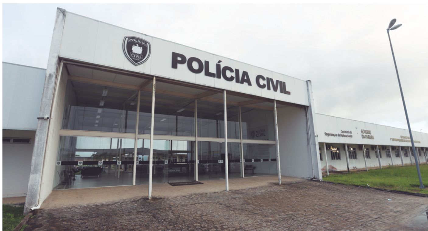
Ao todo, o concurso público do órgão de segurança ofereceu 1.400 vagas; até agora, já foram convocados e nomeados 485 pessoas

“Esse é um grande momento para a Polícia Civil e para a Segurança Pública da Paraíba que irá melhorar a qualidade do serviço público prestado à população. Nós desejamos sorte a todos os aprovados e nomeados neste concurso”, frisou João Azevêdo, chefe