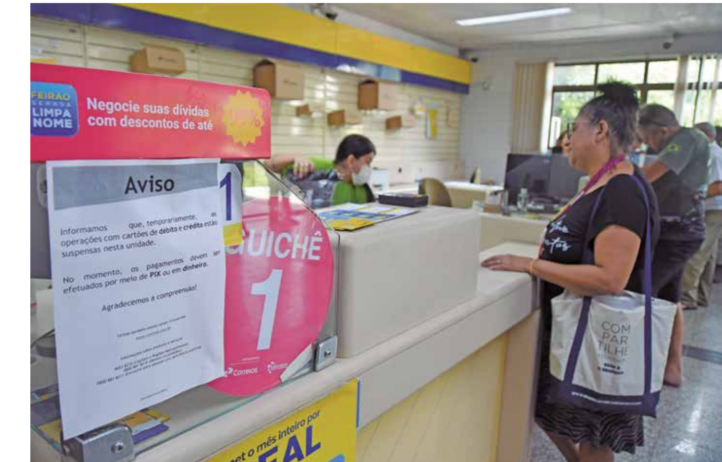
Segundo economista, feirões de renegociação de dívidas permitiram a liberação de crédito e o aumento do consumo

De acordo com o economista, o crescimento econômico local em algumas áreas, impulsionado pelo Turismo e pela Construção Civil, pode ser apontado entre os fatores que contribuem para a variação positiva nos Serviços. “Essas atividades absorvem uma mão-de-obra que não necessariamente tem qualificação alta, então acabam atingindo amplamente a população e gerando renda. E sabemos que, quando se aumenta o acesso à renda, diminuem os indicadores de desemprego, e isso aca-