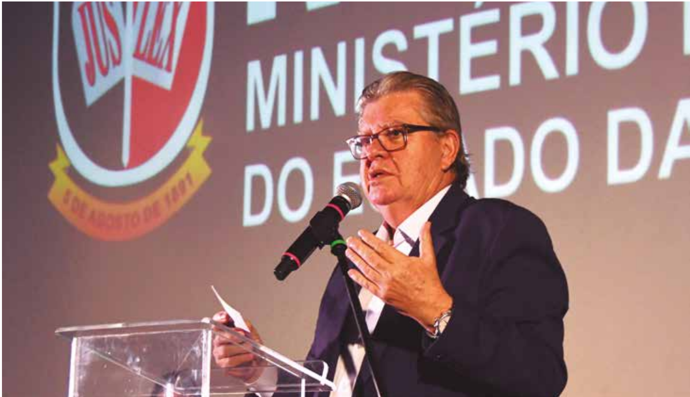
Chefe do Executivo destacou investimentos do governo e resultados positivos conquistados pelo estado nos últimos anos

“Hoje estamos em um ambiente pensado para provocar reflexão, inspiração e encontro. A proposta desse evento é olhar para o presente com a lucidez de quem já enxerga o