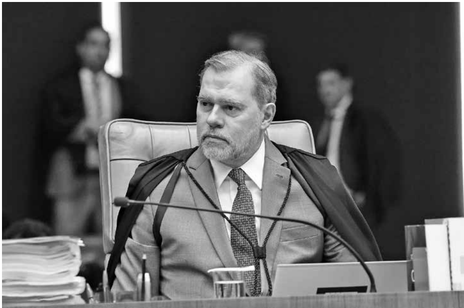
Relator Dias Toffoli defendeu que o ressarcimento fique fora do arcabouço fiscal

seu projeto até 30 de janeiro de 2026. Fain O Fain tem como objetivo a concessão de estímulos fiscais e financeiros para a implantação, ampliação, revitalização e relocalização de indústrias consideradas de relevante interesse para o Estado. O Fundo concede crédito presumido do Imposto sobre Circulação de Mercadorias e Serviços (ICMS) com percentuais variando de 48% a 74,25%, com prazo de 15 anos, renovável por igual período para todas as empresas industriais. As variações dos percentuais dependerão da quantidade de empregos diretos gerados e do volume de investimentos realizados, além da localização escolhida pela empresa no estado. Para solicitar a concessão do benefício fiscal, as empresas interessadas devem elaborar um Projeto Econômico Financeiro, o qual deverá vir acompanhado de requerimento, como também da documentação relacionada no roteiro disponibilizado no site da Cinep.