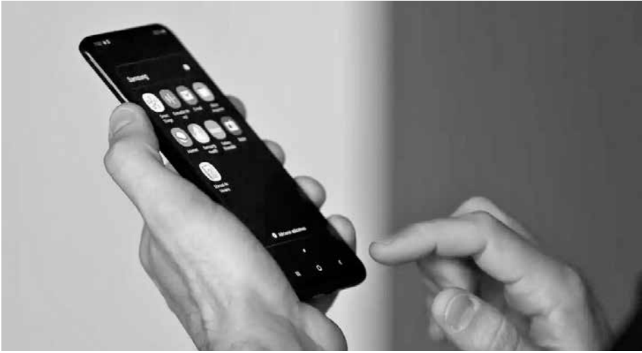
Objetivo é que o usuário emita um único alerta para agilizar o bloqueio do aparelho

tais, além de facilitar a recu- peração de celulares pelas polícias estaduais. Como Basta baixar e entrar no app por meio de outro dispositivo, fazer o registro indicando a data e o horário do ocorrido, bem como a linha telefônica utilizada no celular