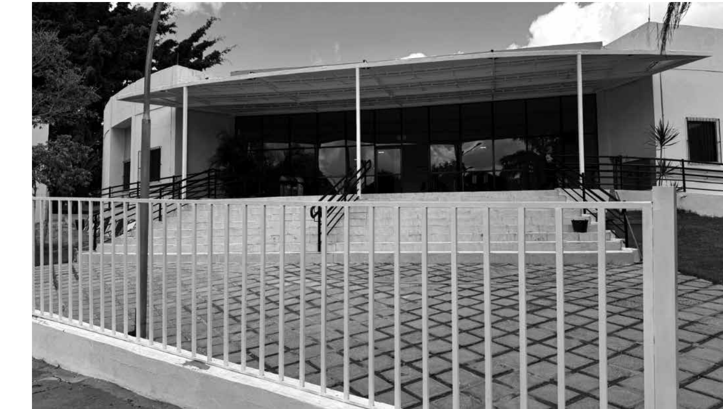
Reformas fazem parte do projeto de modernização liderado pelo desembargador Oswaldo Trigueiro do Valle Filho

No Fórum Eleitoral de Campina Grande, que atende quatro Zonas Eleitorais (16ª, 17ª, 22ª e 72ª), as mudanças foram significativas. A obra está com 95% de conclusão e a previsão é de finalização para a próxima quarta-feira (17). A reforma incluiu a mudança de piso, a renovação de rampas de acesso, a pintura completa e a instalação de um novo gradil de ferro na parte externa. O edifício ainda recebeu impermeabilização do teto, reformulação dos ba-