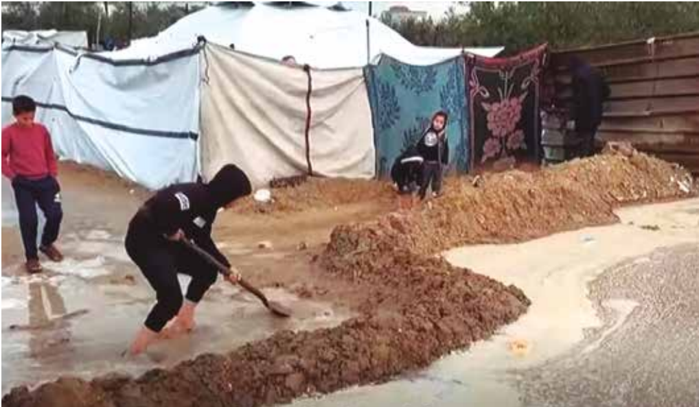
Tempestade agravou a precária situação de milhares de deslocados internos que vivem em tendas

A maioria das vítimas fatais decorreu de desabamentos relacionados ao temporal. Cinco pessoas morreram no bairro de Bir al-Naja, em Beit Lahia, com o colapso de uma residência. Em al-Rimal, pelo menos, duas outras fatalidades foram registradas após a queda de um muro. As baixas temperaturas também causaram