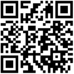
Acesse o formulário de cadastramento por meio do QR Code.

A vacinação contra o HPV faz parte do calendário do Programa Nacional de Imunizações (PNI) e é considerada essencial para a prevenção de diversos tipos de câncer associados ao vírus. A faixa etária de 15 a 19 anos representa uma oportunidade final de garantir a proteção antes da vida adulta, período em que os riscos de exposição aumentam significativamente.