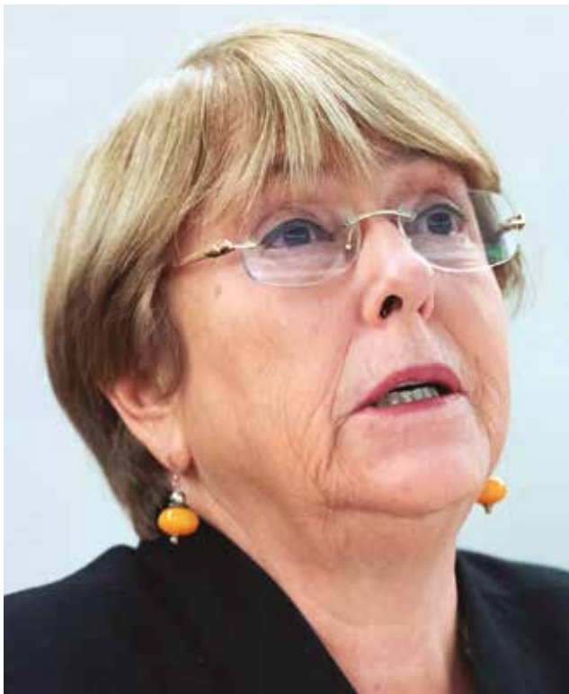
Ex-presidente do Chile, Michelle pretende comandar a ONU

A candidatura de Bachelet, que foi a primeira mulher a governar o Chile e já liderou a ONU Mulheres e o Alto Comissariado para os Direitos Humanos, surge num contexto em que se multiplicam apelos para que uma representante da América Latina, preferen-