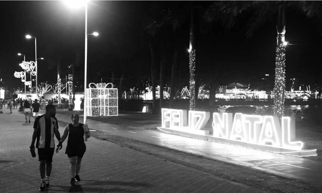
Então é Natal