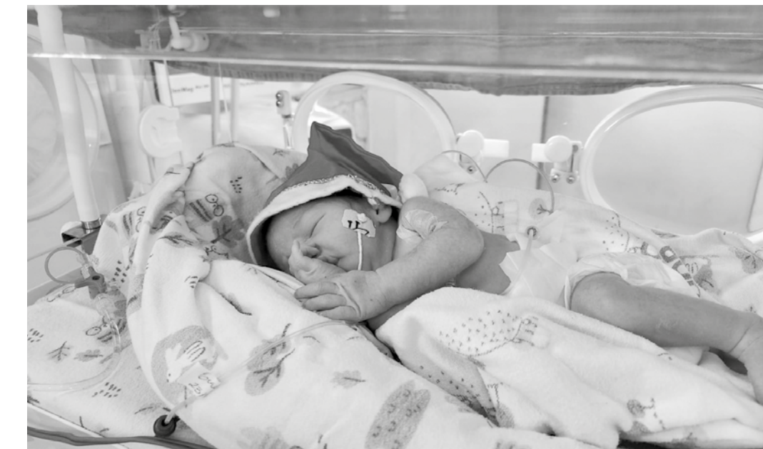
Bebês foram vestidos pela equipe de enfermagem do hospital com roupinhas alusivas ao Natal

No Hospital Edson Ramalho, a humanização faz parte do cuidado integral ao paciente e à família, especialmente no contexto neonatal, em que o apoio emocional é