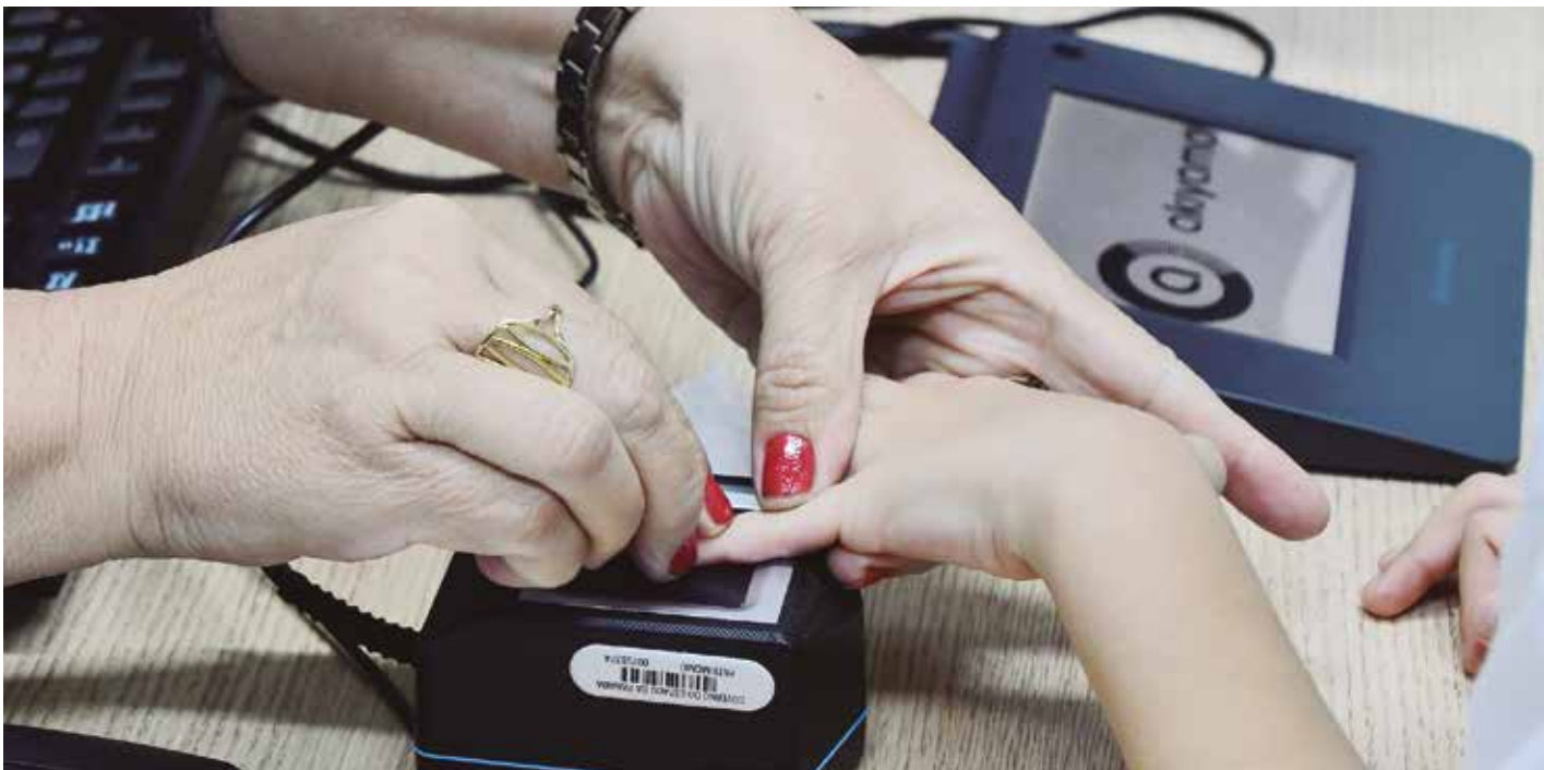
Novo sistema de coleta de digitais do espaço, na Casa da Cidadania do Bessa, evita o contato dos pequenos com a tinta