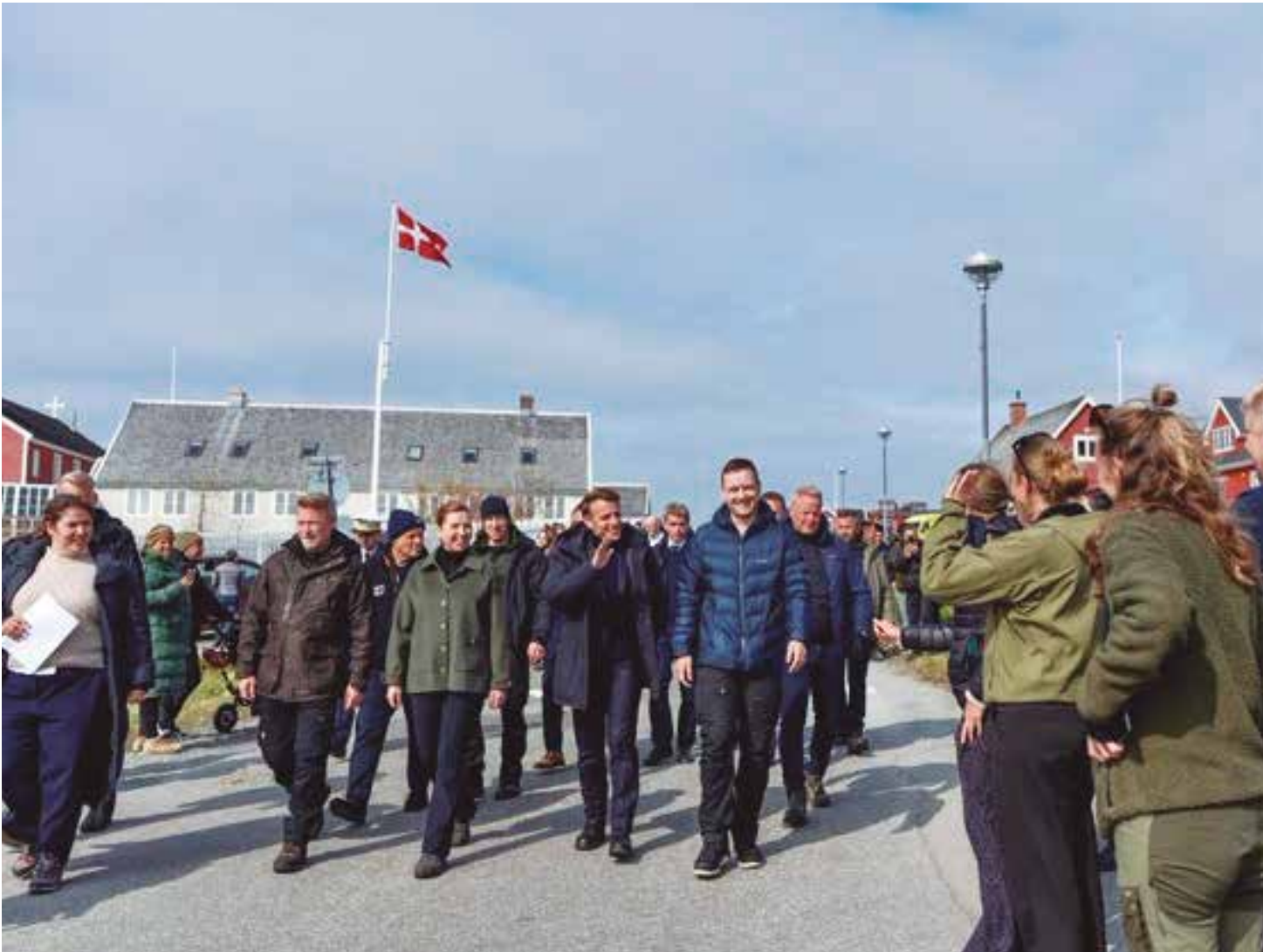
Emmanuel Macron (C) é um dos representantes que declarou seu apoio e afirmou que a “Groenlândia pertence ao seu povo”

Pesquisas recentes indicam que a população local rejeita a anexação pelos Estados Unidos. Após eleições regionais em março, o território é governado por uma coligação de grupos políticos moderados pró-independência. Nos últimos anos, a Dinamarca tem aumentado investimentos militares e econômicos na Groenlândia.