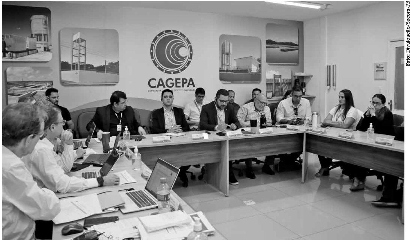
Programação da visita segue até sexta-feira e inclui reuniões na sede da Cagepa; recursos da parceria vão financiar 24 projetos

Os recursos serão destinados para 24 projetos, dos quais 21 são de abastecimento de água e três de esgotamento sanitário. O projeto prevê a construção de rede coletora de esgoto, adutoras, estações