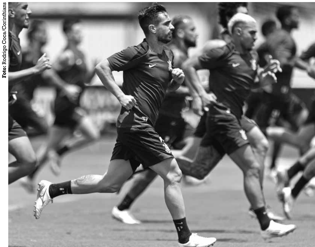
Jogadores do Corinthians em atividade física visando a primeira decisão da temporada

No jogo de ida, disputado no Estádio Olímpico de la Universidad Central, em Caracas, o Corinthians do-