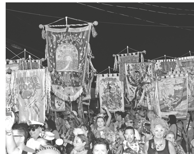
Muriçocas em 2024: confiança no espírito carnavalesco