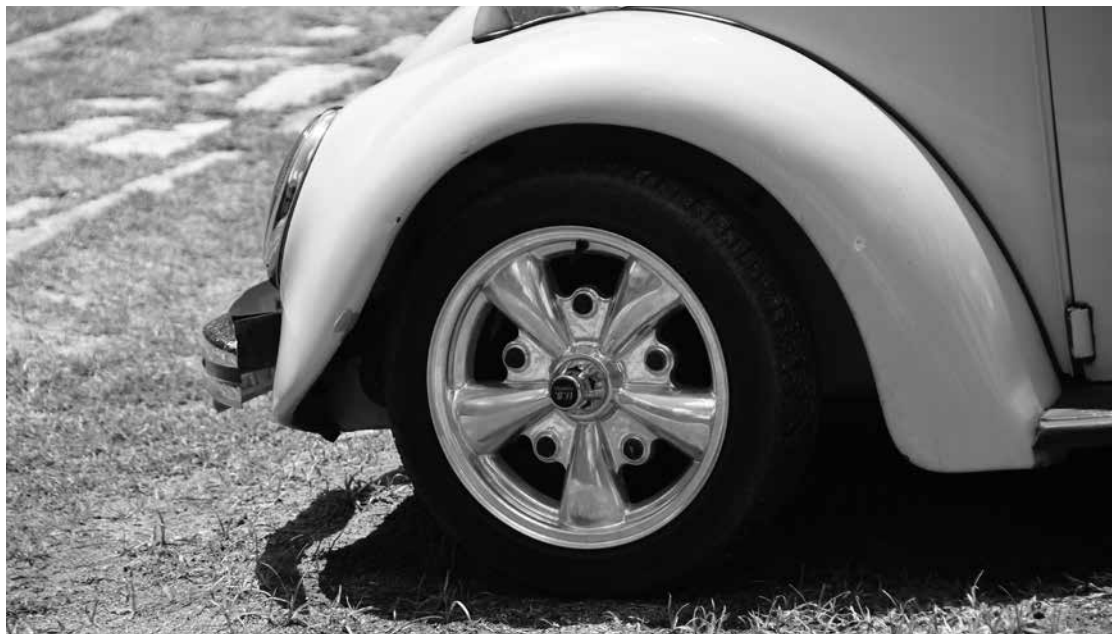
Se meu Fusca falasse