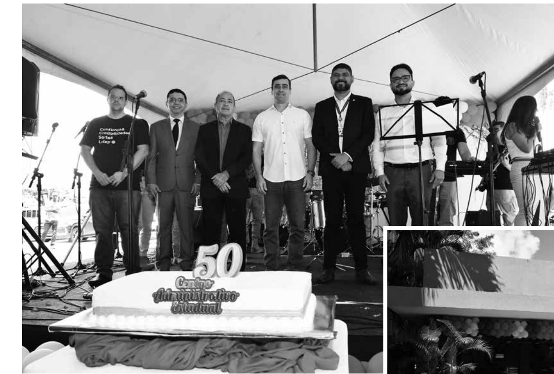
Além de ter música e café da manhã, aniversário foi marcado pela reinauguração da sede do Protocolo Geral, responsável por receber todos os processos administrativos do estado

Considerado o núcleo de decisões da Paraíba na década de 1970, o Centro Administrativo comporta hoje 10 órgãos do governo, com cerca de três mil servidores. Idealizado pelo arquiteto Tertuliano Dionísio, durante o governo de Ernani Sátyro, o local começou a ser construído em 1972. Em 50 anos de existência, guardou um legado im-