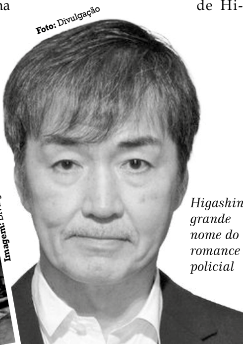
Higashino: grande nome do romance policial