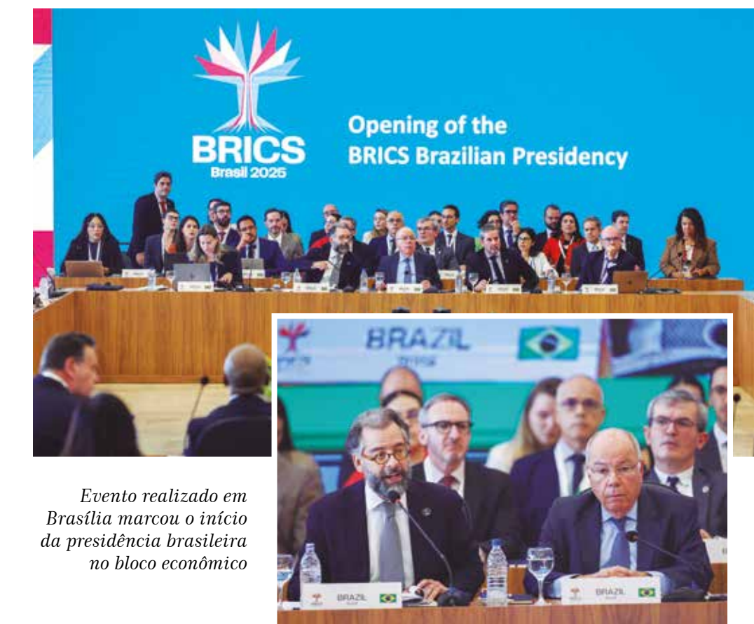
Evento realizado em Brasília marcou o início da presidência brasileira no bloco econômico

O chanceler brasileiro criticou a falta de financiamento para a adaptação e mitigação