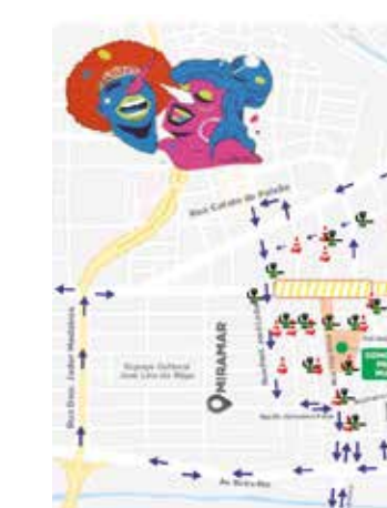
Mapa da autarquia indica opções para os condutores

A Via Folia, no trecho a partir da bifurcação com a Av. Rui Carneiro e a Av. Tito Silva, será bloqueada no sentido Centro-praia a partir das 10h, com as equipes operacionais orientando o posicionamento dos trios elétricos. Às 18h, haverá intervenções e desvios para o bloqueio total do corredor da folia, incluindo a Praça das Muriçocas, com proibição de acesso