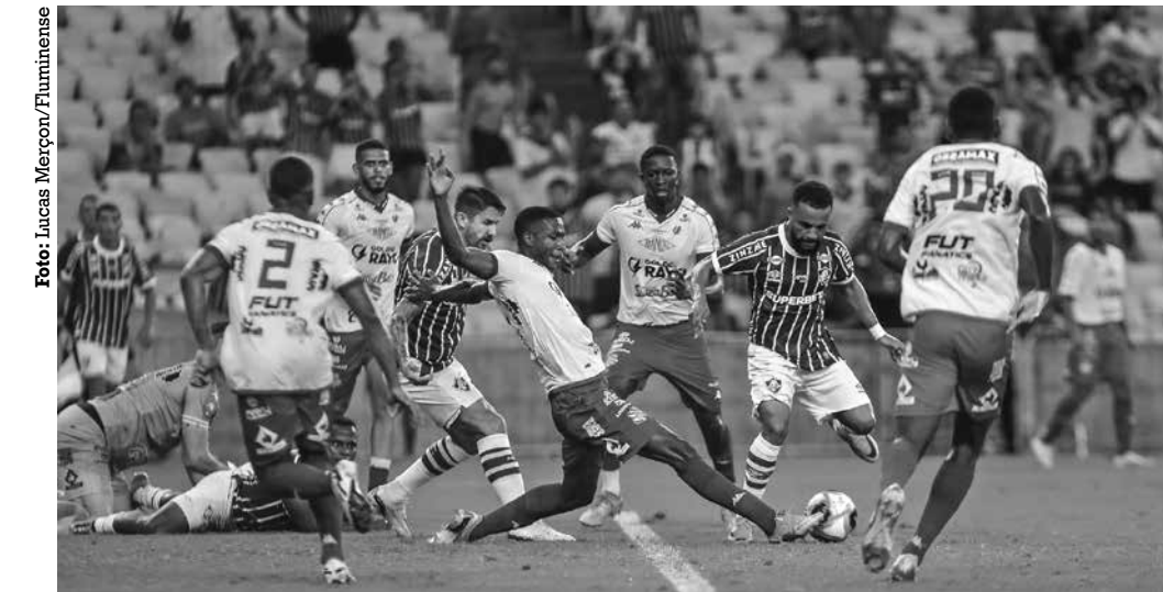
Pelo Carioca, o Fluminense chegou às semifinais depois de derrotar o Bangu por 3 a 2

O time paraense buscou um meio judicial para levar o jogo para o Estádio Roseirão, onde normalmente faz seus jogos, mas não conseguiu