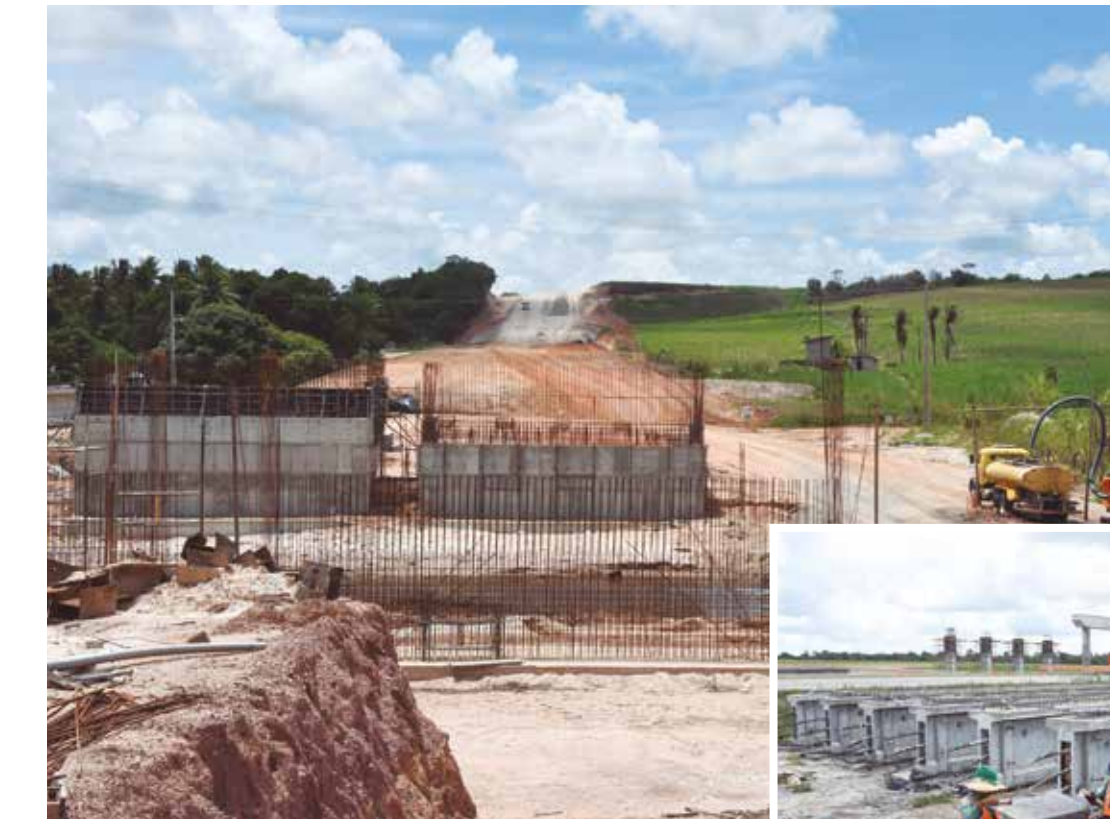
Com 18,7 km de extensão, empreendimento inclui um viaduto sobre a BR-230, duas pontes sobre os rios Mumbaba e Gramame e uma passarela em Cicerolândia

das pelo Governo da Paraíba em Campina Grande, o titular da Seirh detalhou o andamento da construção do Centro de Convenções da cidade, que mobiliza R$ 168 milhões em recursos e poderá receber suas primeiras atrações em breve. “O bloco de congressos e feiras está praticamente concluído, então há possibili-