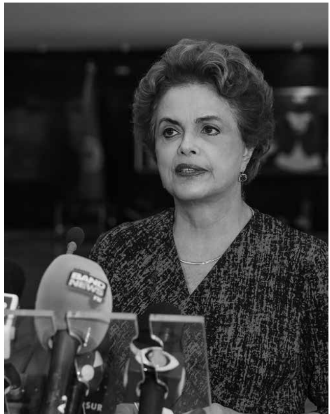
Ex-presidente responde bem ao tratamento de saúde

“Dilma Rousseff passa bem e tem mantido suas atividades de trabalho normalmente durante o período em que está internada. A presidente agradece as mensagens de apoio e solidariedade recebidas”, diz a nota divulgada ontem.