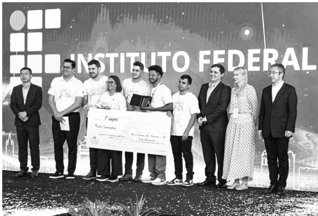
Competição ainda terá duas etapas: a latino-americana, em março, e a global, em maio

O programa ICT Competition atrai, anualmente, cerca de 170 mil estudantes de duas mil universidades e faculdades de mais de 80 países. Nas finais de 2024, foram 160 equipes classificadas, de 49 países dos cinco continentes. A Huawei ICT Competition é dividida em etapas: a brasileira (preliminar e final nacional); a latino-americana; e a global, que será realizada na sede da Huawei, em Shenzhen, na China, em maio deste ano. Em todas as fases, os competidores testam os conhecimentos por meio de provas e exames práticos por equipes.