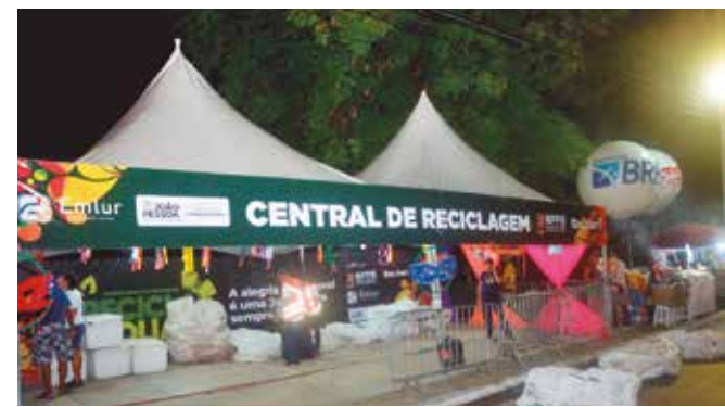
Trabalho é feito por três associações de catadores da capital

A Emlur disponibilizou, na Via Folia, 10 pontos de entrega voluntária (PEVs) para que as pessoas descartem materiais recicláveis. Além disso, os serviços de varrição e coleta de resíduos começam logo depois da passagem do último trio elétrico de cada noite. No sábado passado (22), mais de 130 profissionais participaram da ação. No fim de semana, foram coletadas 175 toneladas de resíduos.