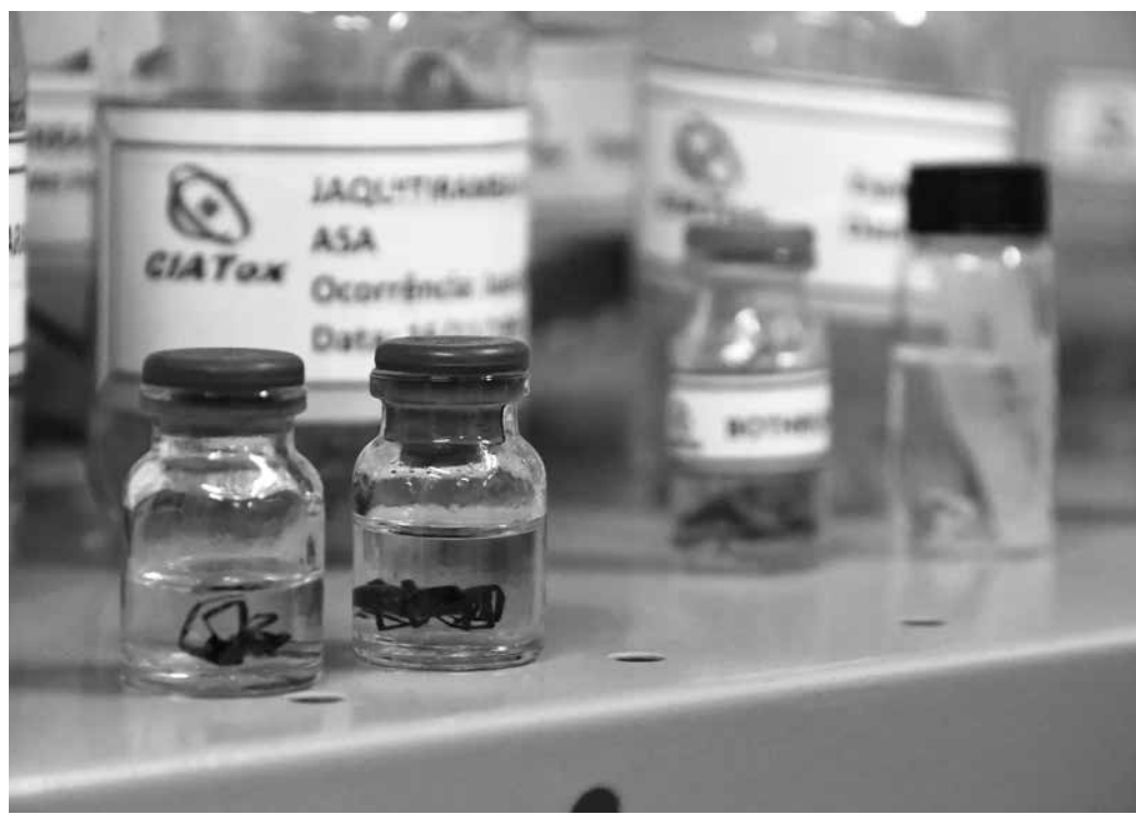
Aranhas-marroms costumam se alojar em locais escuros, secos e quentes, como armários

Segundo ele, os casos relativos a esse tipo de ocorrência são difíceis de contabilizar, pois, quando as pessoas levam a aranha para o centro, ela está toda fragmentada ou esmagada. “Isso dificulta a identificação, já que ela é relativa-