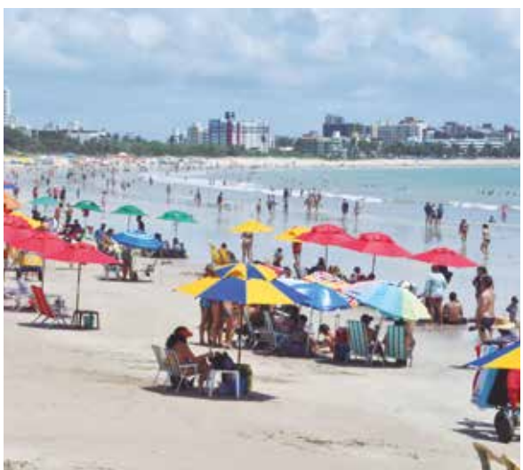
Requalificação da Praia do Bessa está entre os projetos

“É uma oportunidade de usar esses recursos para que a gente possa planejar, cada vez mais, o crescimento da nossa cidade, principalmente, nos projetos de intervenção na orla ma-