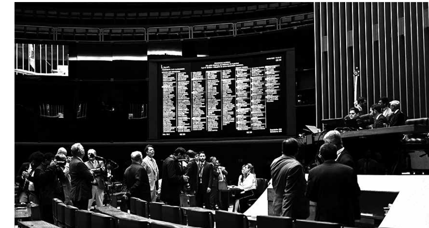
Em sessão conjunta, o Congresso Nacional fez uma votação simbólica para aprovar o Projeto de Lei Orçamentária Anual

nador aceitou um acréscimo de R$ 3 bilhões para o Vale-Gás, o aumento de despesas previdenciárias em R$ 8,3 bilhões e o crescimento de R$ 338 milhões no seguro-desemprego. Houve ainda redução de R$ 7,7 bilhões no Bolsa Família e de R$ 4,8 bilhões em ações de apoio à implantação de Escolas em Tempo