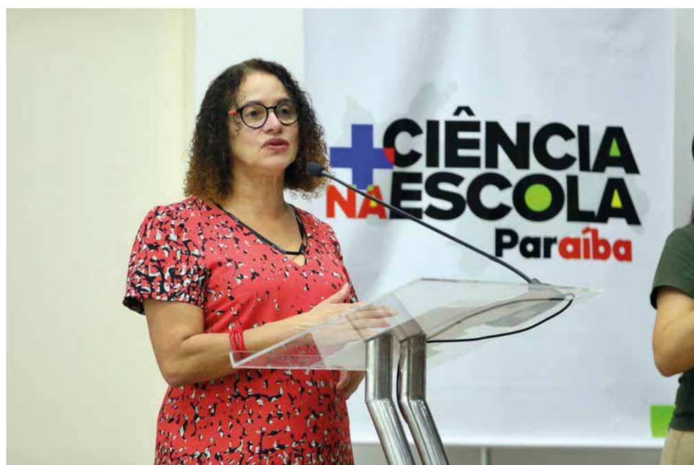
Ministra Luciana Santos participou do lançamento, ontem, em Campina Grande

O lançamento, realizado em cerimônia na Universidade Federal de Campina Grande (UFCG), foi apresentado por Luciana Santos, titular do Ministério da Ciência, Tecnologia e Inovação (MCTI). “Eu já estive aqui para anunciar investimos na Fundação Parque Tecnológico da Paraíba e, agora, eu estou de volta para trazer o Mais Ciência na Escola para os alunos paraibanos. Ao todo, investiremos R$ 6 milhões para oferecer cursos de formação e bolsas a 60 professores e 600 alunos da rede pública de ensino. Temos que fazer, desde cedo, que os brasileiros tenham o gosto pela ciência e pelo estudo, juntando teoria e prática