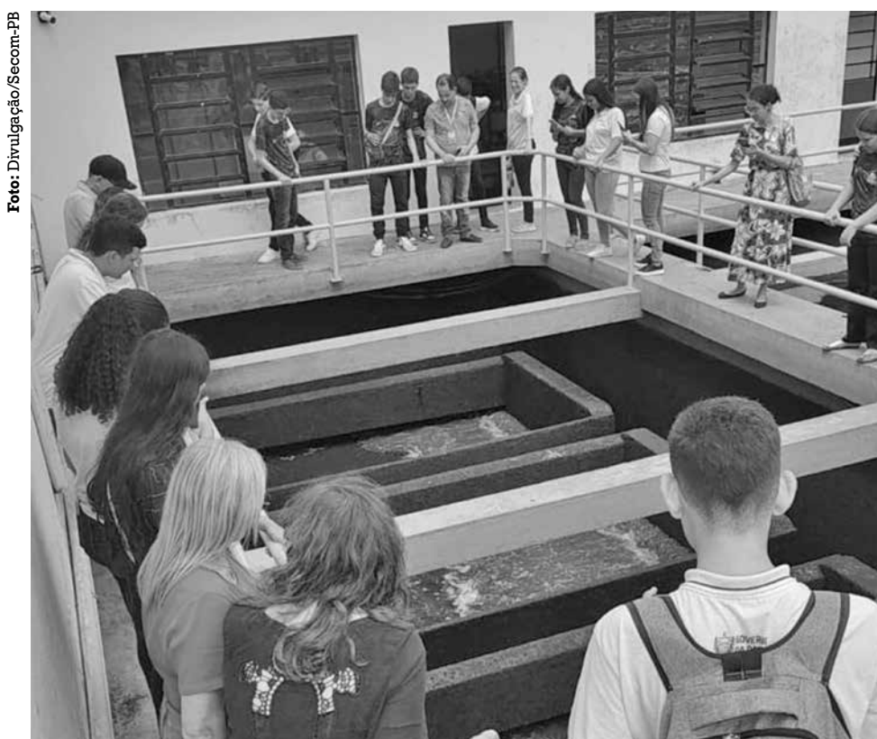
Companhia abriu as portas para receber alunos das redes estadual e municipal de JP

Os clientes da Cagepa com alguma pendência também serão atendidos pelo Portas Abertas e terão a oportunidade de aproveitar condições facilitadas para a negociação dos débitos. Uma equipe de Atendimento Comercial da companhia estará a postos nos locais das ações em João Pessoa e Campina Grande, para oferecer condições mais flexíveis de parcelamento do débito, com redução de percentual de entrada e aumento do número de parcelas.