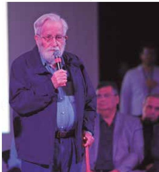
Linguista, filósofo, sociólogo Noam Chomsky discursou na capital paulista, em 2019