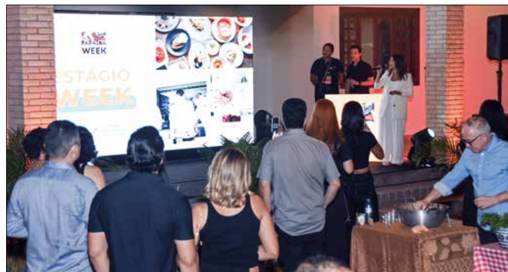
Lançamento do evento aconteceu ontem, à noite, na Casa Altiplano Engemax, na capital

Os ganhadores devem encaminhar os documentos exigidos para o e-mail notacidade@lotep.pb.gov.br .