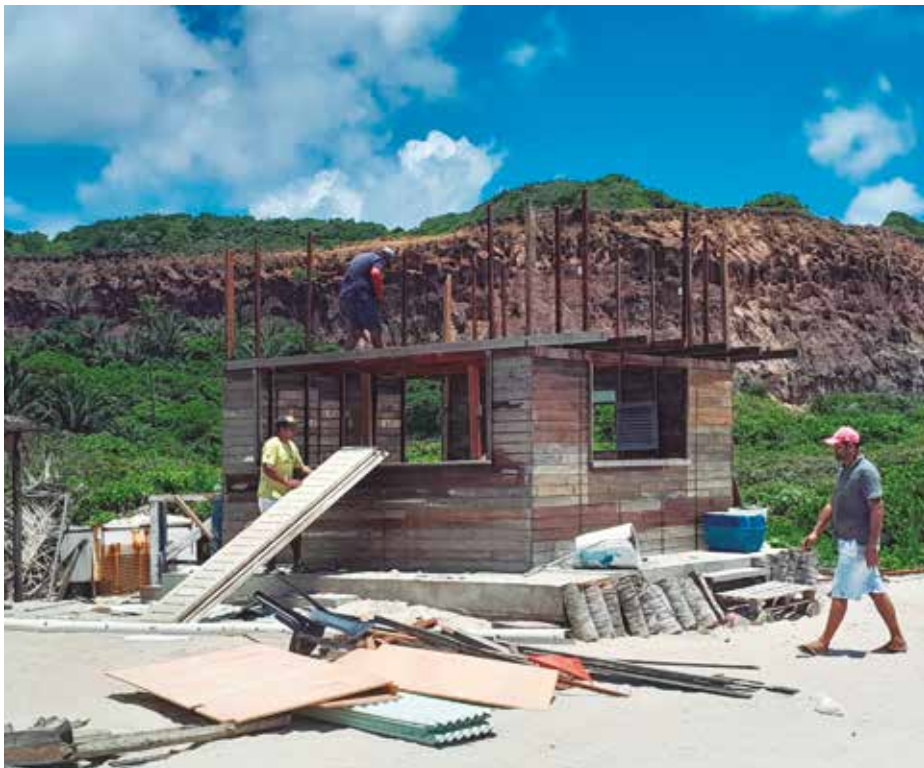
Empreendimento não tinha autorização para operar no local, próximo à foz do Rio Miriri

De acordo com o MPF, a desocupação foi necessária devido à ausência de licenciamento ambiental e urbanístico para o funcionamento do estabelecimento, chamado Bar do Geraldo, que estava instalado na faixa de domínio da União, destinada ao uso público, além de gerar impactos ambientais na área legalmente protegida, incluindo danos à vegetação de restinga. A situação irregular do bar foi identificada durante diligências conjuntas do MPF, da SPU e das forças de policiamento, que investigavam o trânsito indevido de veículos