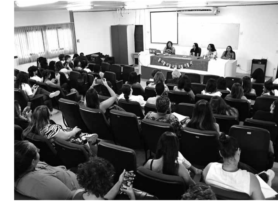
Apresentada ontem, no campus da universidade em João Pessoa, publicação foi elaborada com base nas demandas e necessidades dessa população

Ela é uma das coordenadoras do Laboratório de Pesquisa e Extensão em Subjetividade e Segurança Pública (Lapsus), que junto ao Ministério da Justiça e Segurança Pública (MJSP) e à Defensoria Pública do estado (DPE-PB), compõe o projeto Mulheres e Prisões. Foi dessa iniciativa que nasceu a cartilha, contando também com a participação do Escritório