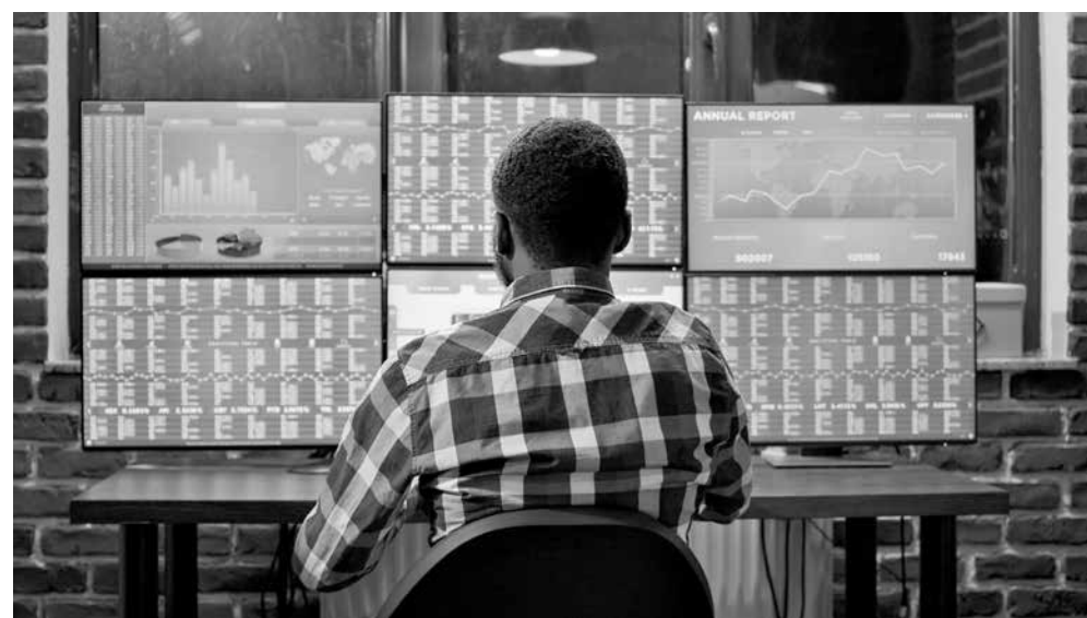
Especialista recomenda que investidores redobrem a atenção ao planejamento financeiro

costumam recorrer ao crédito para consumo ou financiamento de bens, a recomendação do especialista é redobrar o planejamento financeiro. “Com os juros mais altos, é essencial avaliar bem antes de assumir dívidas. Ao mesmo