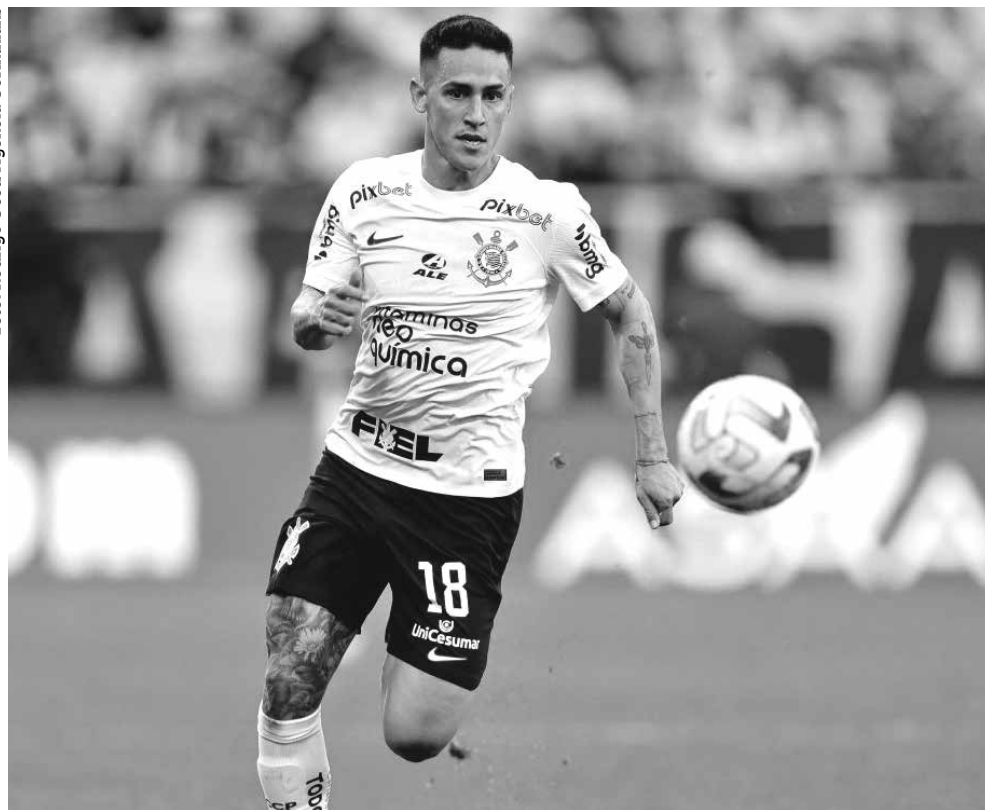
Rojas cobra uma dívida de R$ 40,4 milhões ao Corinthians por direitos de imagem

São Jorge, acumulou lesões e não conseguiu corresponder às expectativas, passando a maior parte do tempo no banco de reservas. Foram 30 jogos, com três assistências e nenhum gol.