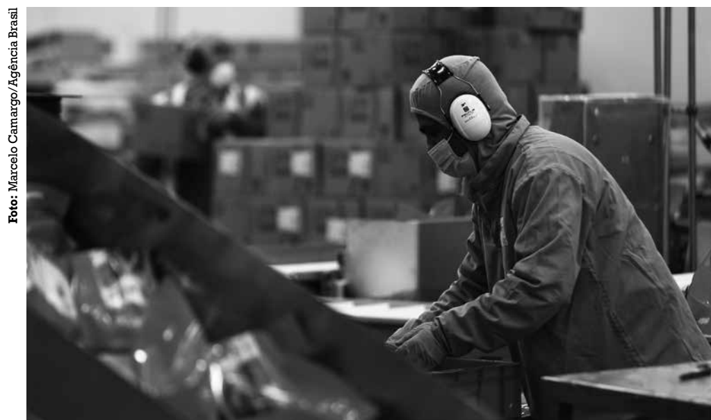
Levantamento aponta que aperfeiçoamento de processos é maior em empresas de grande porte

■ Em relação aos produtos, 27,6% eram novidades para o mercado nacional