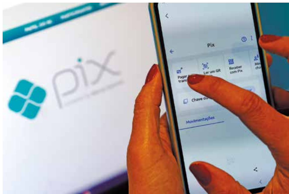
Parceria com bancos e uso do Pix mudou o comportamento do contribuinte paraibano

Caso o contribuinte tenha dúvida de ter realizado ou não o pagamento, o sistema Pix informa que o documento já foi pago e baixado no sistema financeiro e livra o contribuinte de qualquer erro humano no ato do pagamento, pois o sistema criado pelo Banco Central é realizado por meio da leitura de um QR Code, ou seja, não existe a necessidade de digitação.