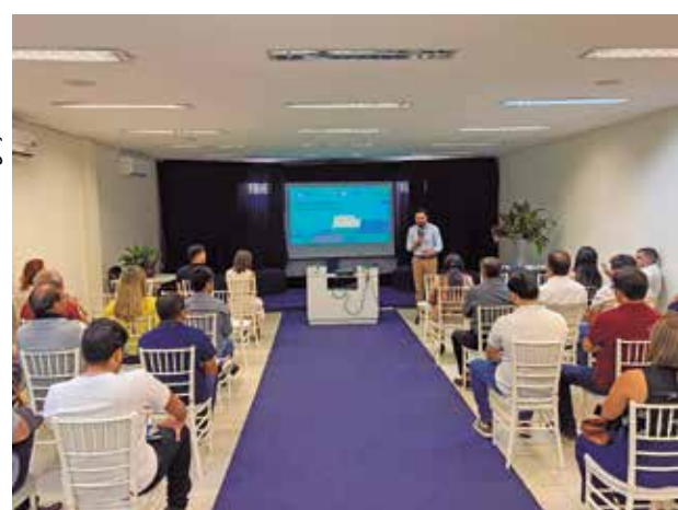
Projeto foi apresentado, ontem, na cidade de Patos

Um dos propósitos do projeto é fortalecer o surgimento de lideranças na região em defesa da criação de estratégias visando o desenvolvimento das cidades, assim como trabalhar a execução de um mapeamento e criação de soluções com direcionamento ao ambiente de negócios. Outro diferencial concentra-se no processo de mobilização de diferentes setores da sociedade em favor de ações sustentáveis, em benefício da comunidade local.