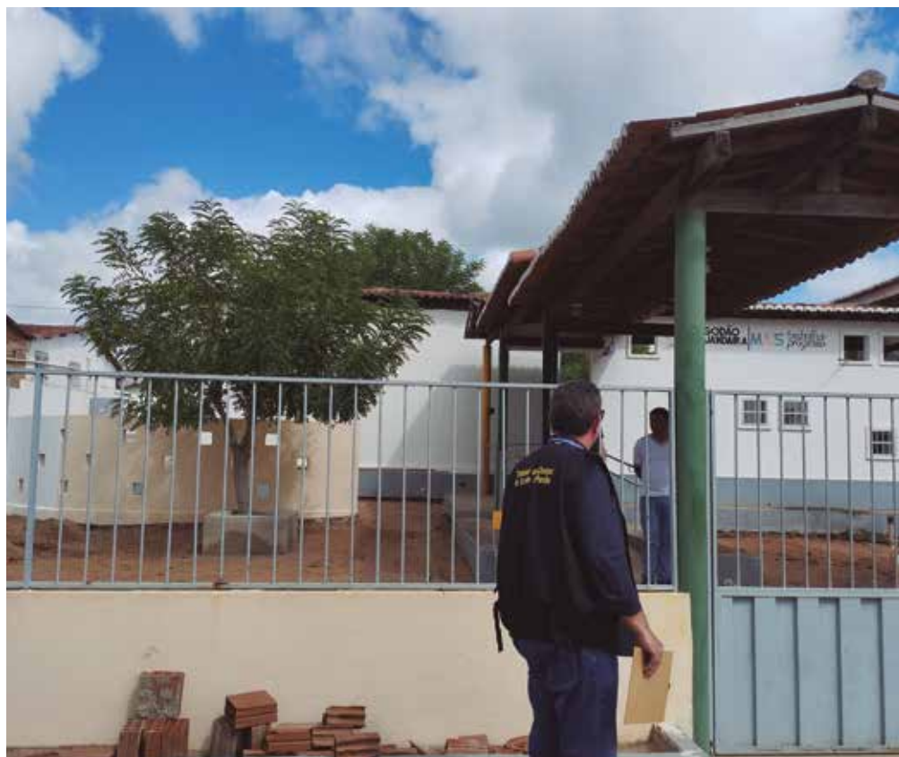
Técnicos do TCE-PB visitam 81 municípios para inspecionar creches e escolas