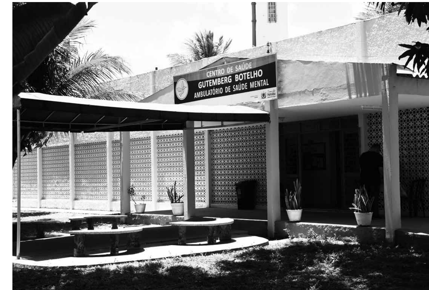
Localizado na Avenida Dom Pedro II, espaço está aberto para todos os moradores da Região Metropolitana de João Pessoa

O espaço também oferece as PICs a pacientes do interior, em alguns dias da semana. “Entendemos a dificuldade de acesso a essas práticas no horário convencional, então escalamos alguns profissionais para acolher essa demanda durante o dia. O paciente vem