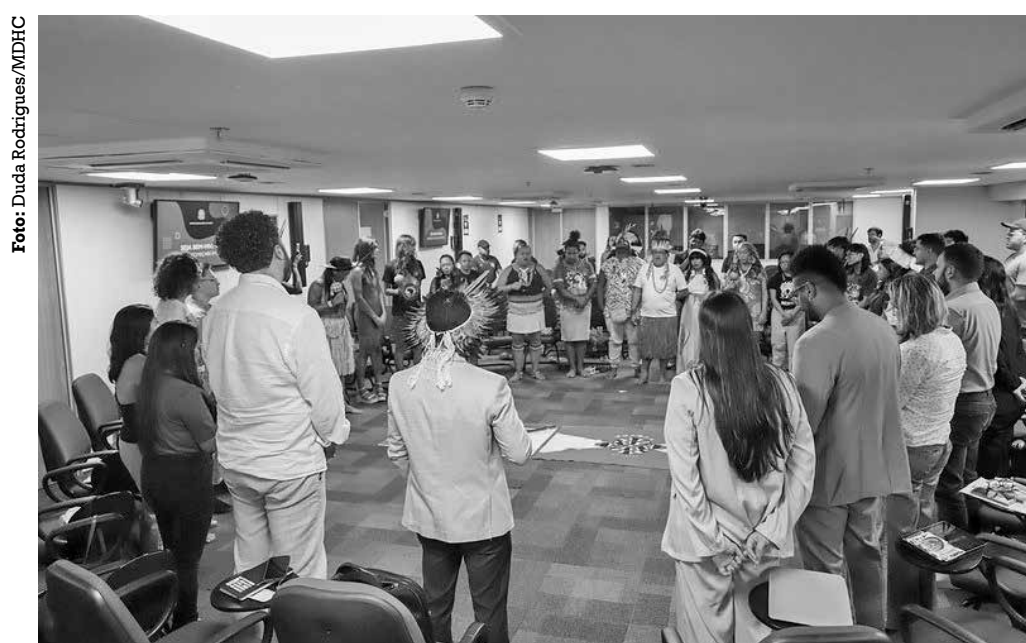
Reunião foi a última etapa preparatória para a estratégia nacional dos próximos debates