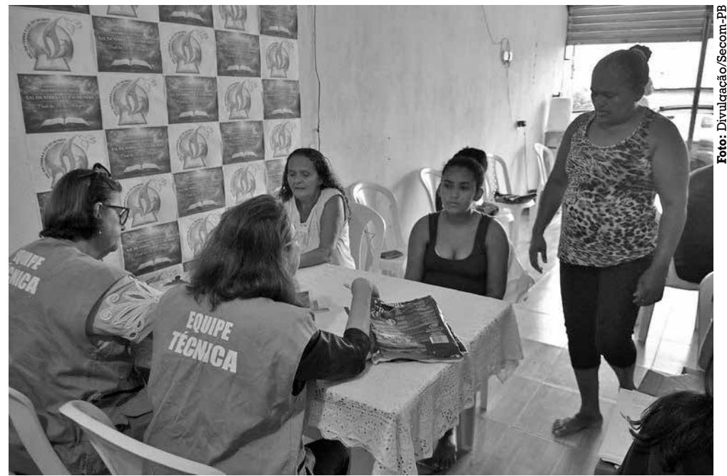
Proposta inicial é reassentar 100 famílias atingidas que decidiram viver noutra localidade

tucional, a Sedh também tem acompanhado o processo, oferecendo suporte técnico e social, com foco na organização comunitária e no fortalecimento da autonomia das famílias beneficiárias. A construção da agrovila representa não apenas a garantia de moradia, mas também a possibilidade de reparação social,