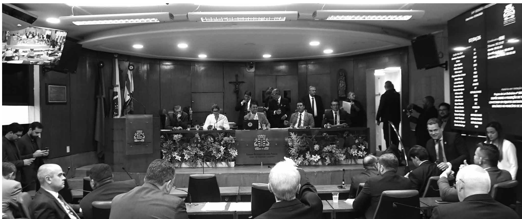
Vereadores discutiram ações de enfrentamento da violência tanto em plenário quanto na Comissão de Constituição, Justiça, Redação e Legislação Participativa