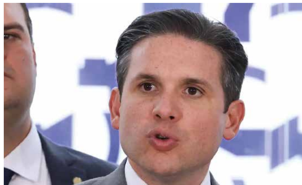
Segundo Motta, a proposta já está em análise na Comissão de Constituição e Justiça da Casa

Motta declarou que após a aprovação na CCJ, encaminhará a criação de uma comissão especial para debater e deliberar sobre a matéria. Segundo o presidente da Câmara, a intenção é que o texto seja votado nessa comissão especial ainda em