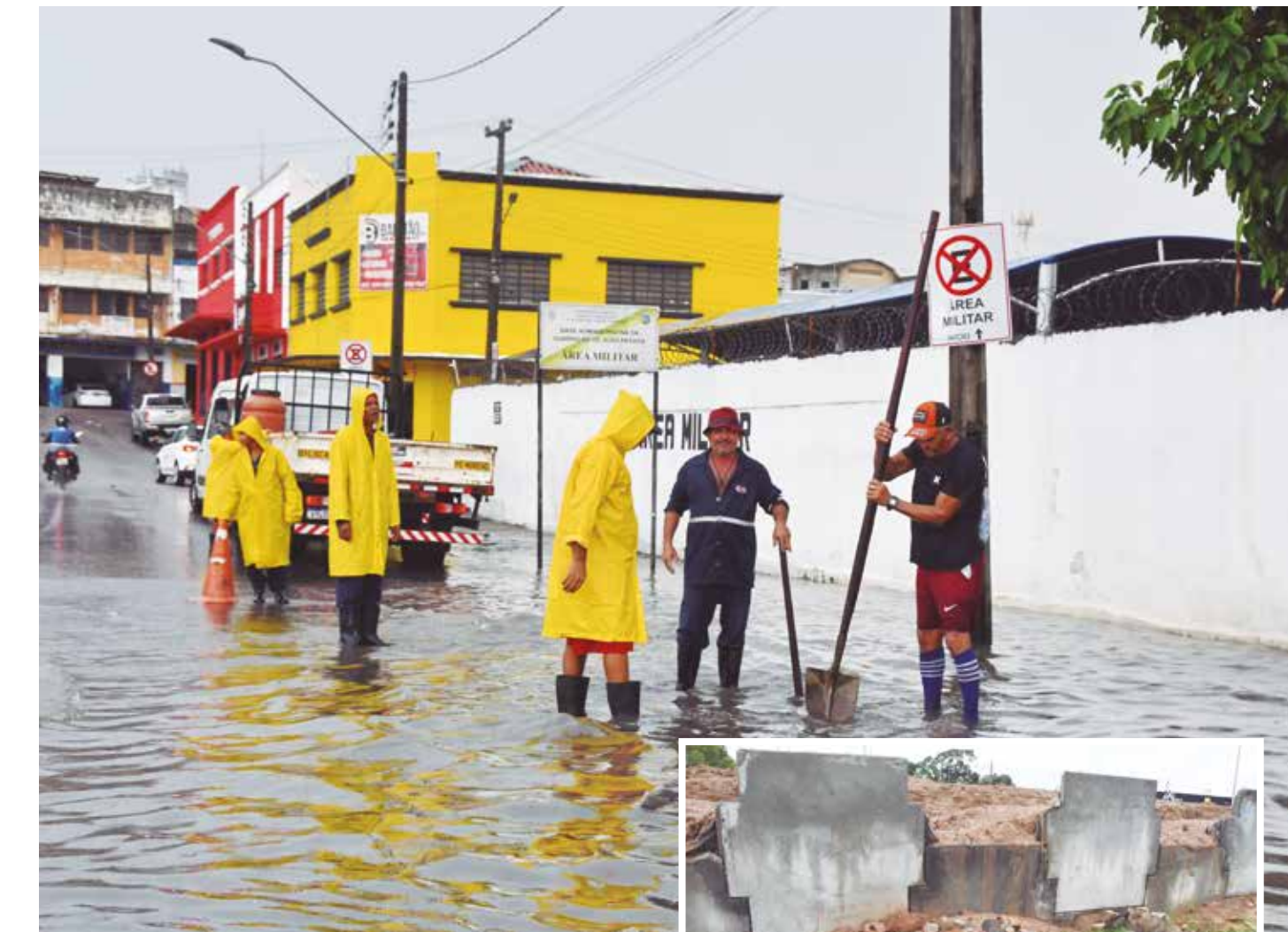
Focos de alagamentos foram identificadas no encontro da Avenida Sanhauá com a Rua General Lima Mindêlo; queda de estrutura em construção de viaduto também chamou atenção