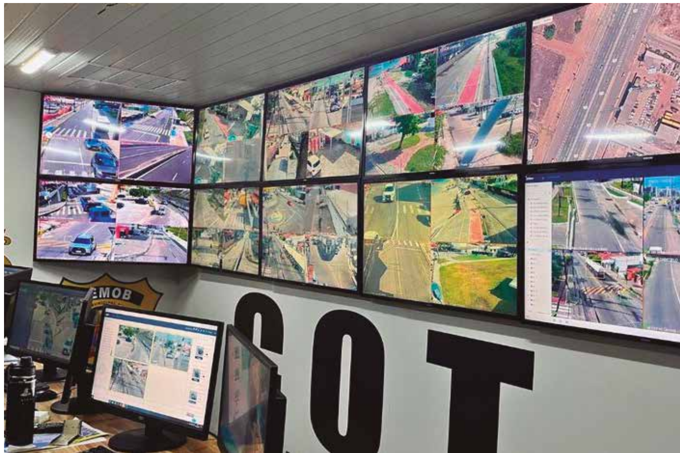
Representantes da Justiça Eleitoral sugeriram que Central de Monitoramento da Semob integre a logística do pleito