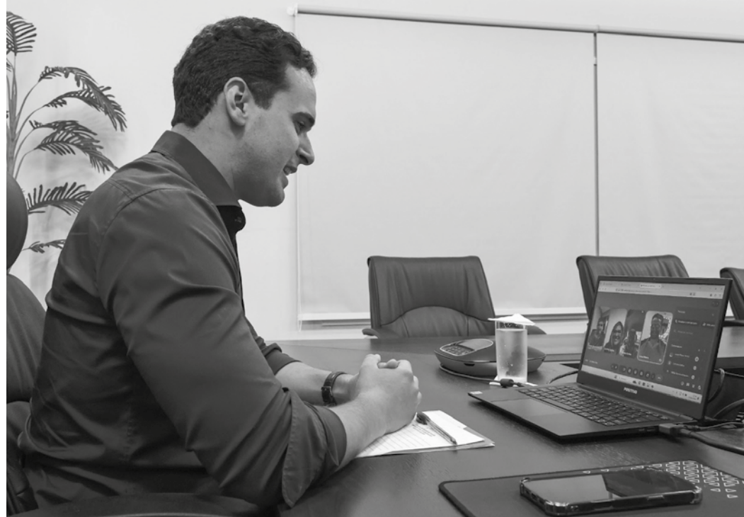
Governador Lucas Ribeiro participou de reunião remota com prefeitos e gestores da AeC

A previsão é de que cerca de 200 postos de trabalho sejam gerados inicialmente em cada uma das cidades, com um potencial muito grande de expansão desse número. Estamos falando de uma empresa que abre portas, especialmente para os jovens que buscam a primeira oportu-