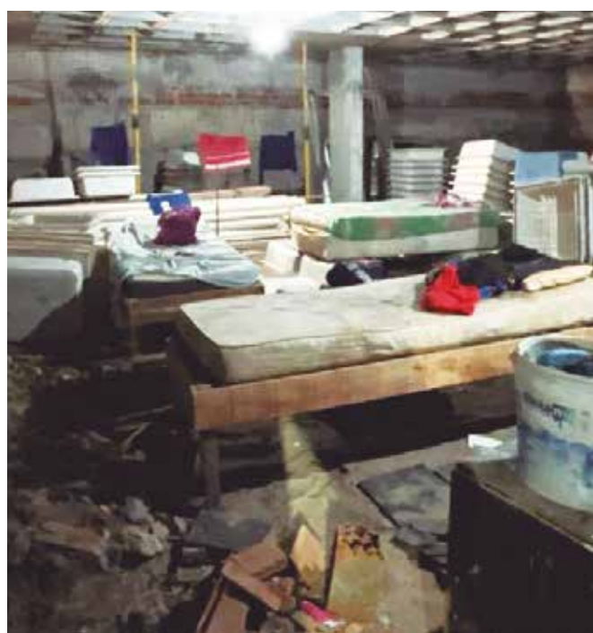
Maioria dos casos foi registrada na área da construção civil

Dos 35 registros totais da Paraíba no cadastro, 20 estão ligados à construção civil. Em