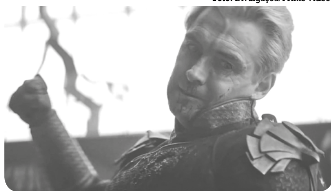
O Capitão Pátria virou um ditador: é hora do confronto final

Diante dos eventos da quarta temporada, o antagonista Homelander — ou Capitão Pátria (na pele de Antony Starr) — agora comanda uma ditadura na América. A season fina-