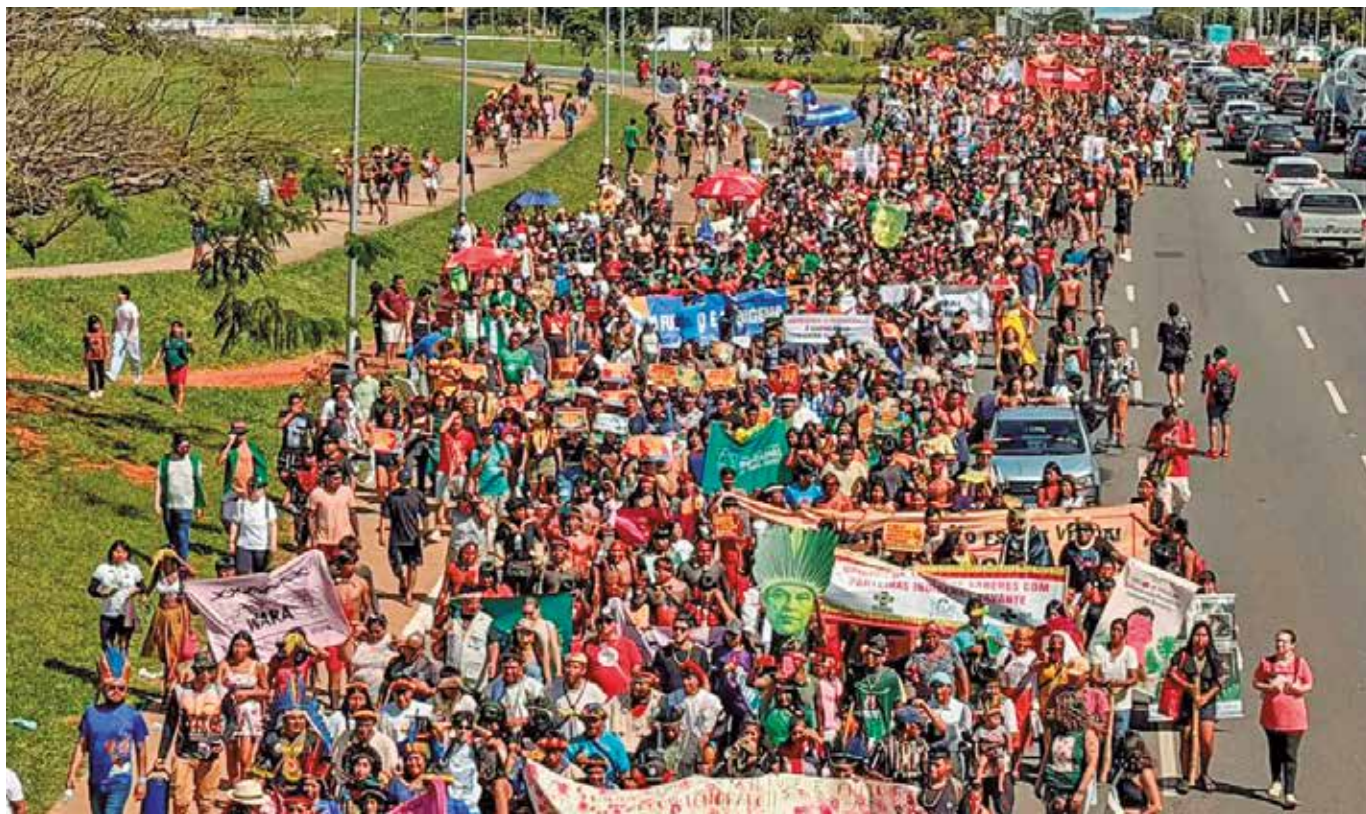
Protesto de ontem foi dirigido aos deputados federais e senadores por aprovarem leis contrárias aos interesses dos nativos

Em 2023, o Supremo Tribunal Federal (STF) julgou