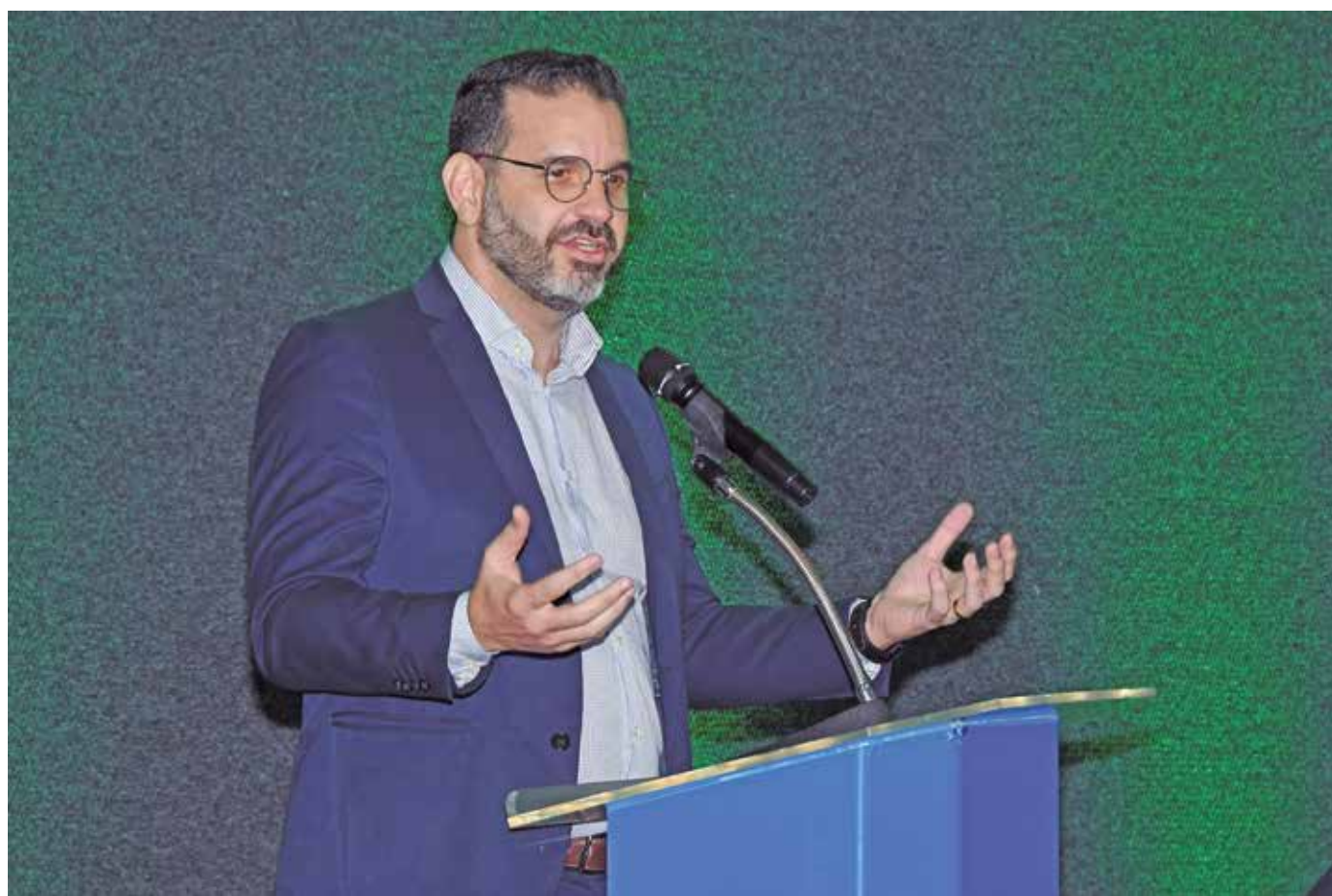
Polari afirmou que investimento passa de R$ 600 milhões; estimativa é que o faturamento chegue a R$ 2 bilhões por ano