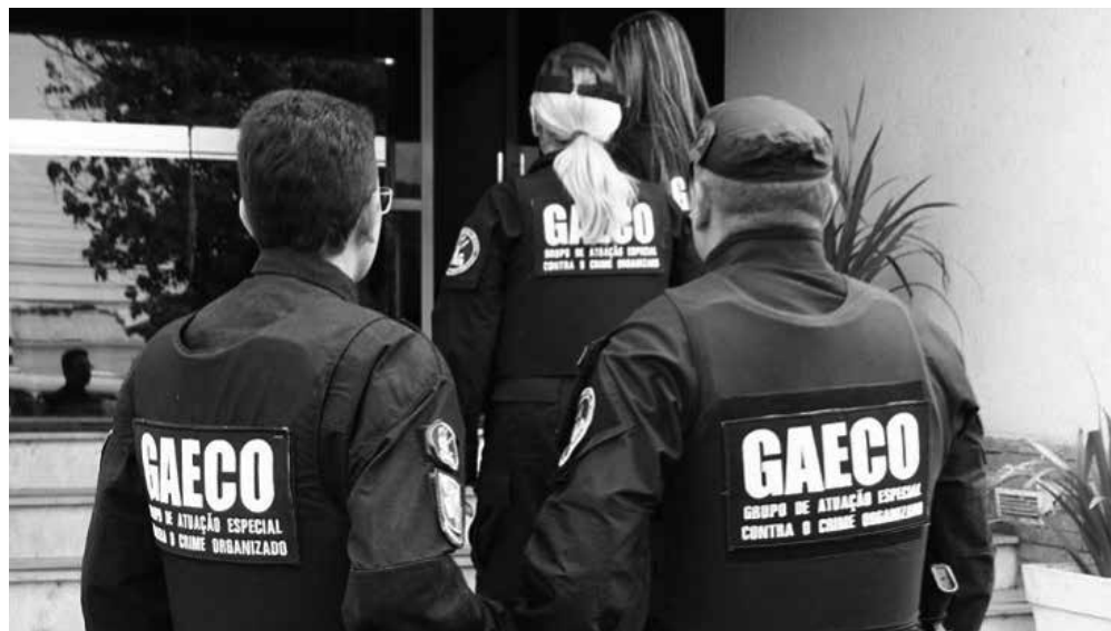
As apurações sobre o caso mobilizaram representantes da CGU, da PF, do MPF e do MPPB

A denúncia apontou, ainda, a violação de deveres fiduciários por parte de gestores do Sesi-PB, que, em uso de suas funções, permitiram e participaram do desvio de recursos, em benefício próprio e de terceiros.