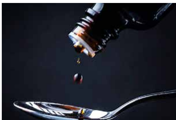
Usuário deve ficar atento ao uso dessa substância

A decisão fundamenta-se em um parecer técnico da Gerência de Farmacovigilância do órgão, que identificou um aumento signifi-