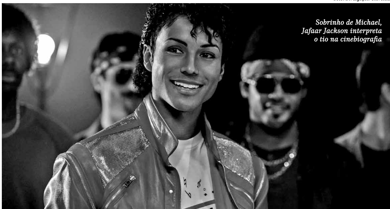
Sobrinho de Michael, Jaafar Jackson interpreta o tio na cinebiografia