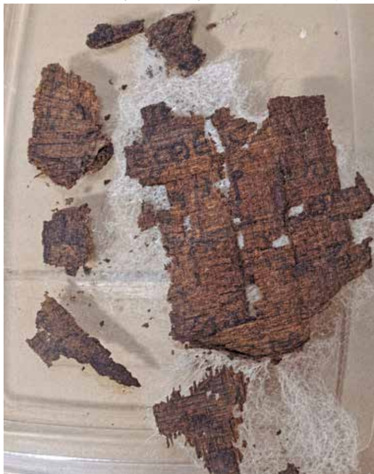
Pedaços do papiro descobertos no abdômen de um corpo egípcio