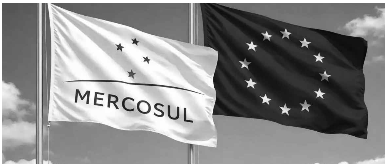
Iniciativa que identifica dados socioambientais é relevante no contexto da aproximação entre o Mercosul e a União Europeia

Já o número de investidores cadastrados no programa aumentou em 288.041, alcançando a marca de 35.097.988 pessoas, crescimento de 9,8% em relação a março de 2025.