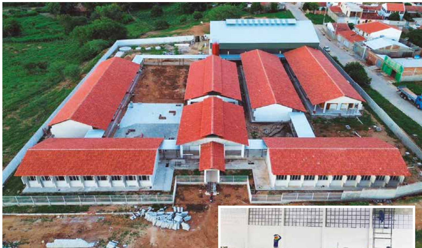
Estrutura segue o padrão de instituições federais de ensino, sendo dividida em seis blocos, com 12 salas de aula, ginásio poliesportivo, laboratórios, refeitório, biblioteca e até uma sala exclusiva para grêmios estudantis

Atualmente em fase de acabamento, a construção dispõe de 23 funcionários trabalhando para que a entrega seja feita daqui a dois meses. Um dos diferenciais da obra é a existência de uma sala exclusiva para grêmios estudantis. Além disso, to-