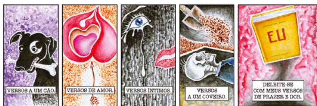
As tiras de Augusto & eu foram publicadas no jornal A União de 2013 a 2016