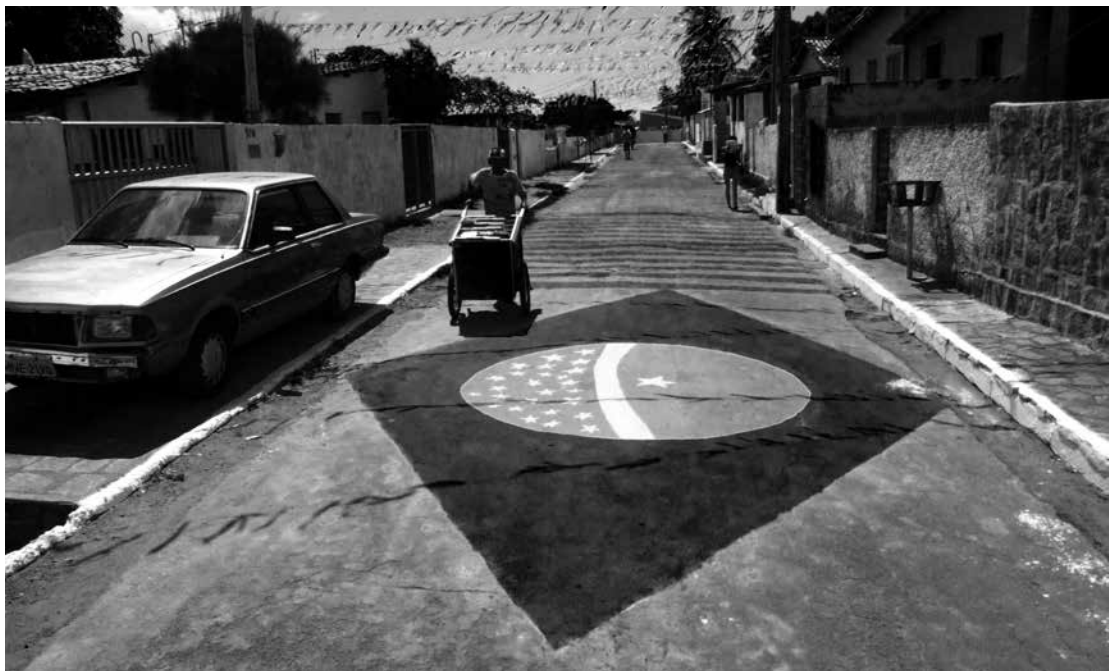
Lembranças patrióticas da Copa