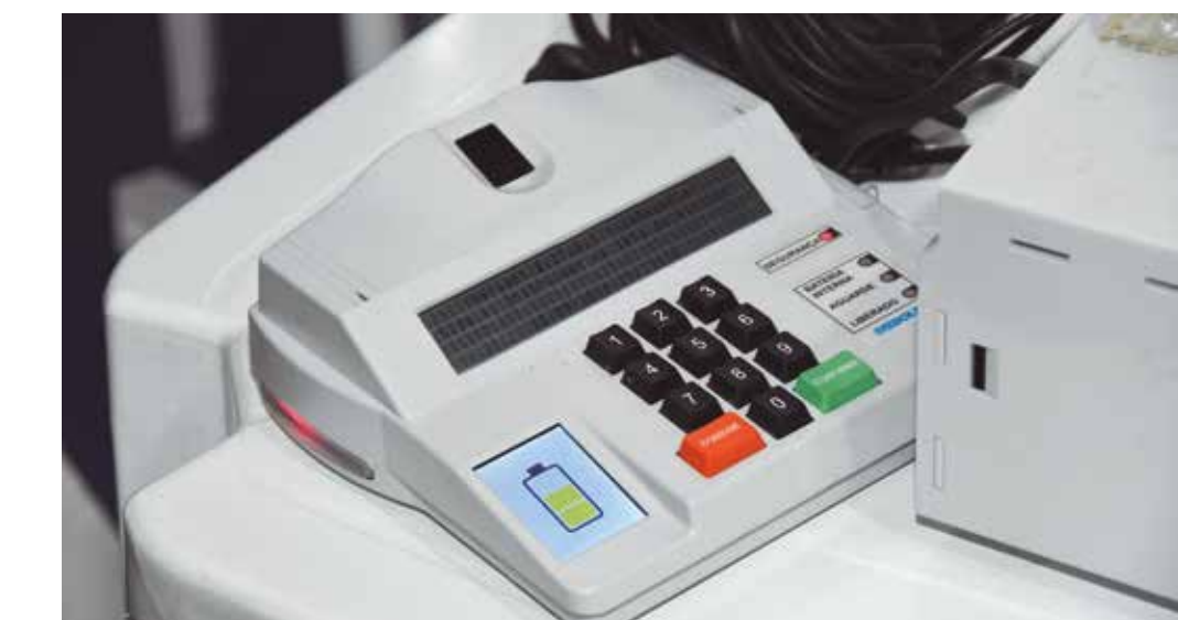
Documento determina plantão presencial aos membros do Ministério Público no dia do pleito

Nesse contexto, cabe aos promotores eleitorais na base levantar informações que possam indicar inelegibilidades, como rejeição de contas pú-