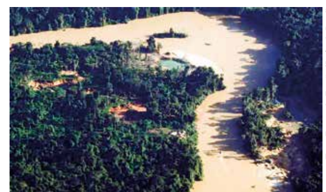
Substância é utilizada na extração de ouro nos rios

O problema da mineração ilegal na Amazônia no Brasil e em outros países é conhecido pela relatoria da Cidh. Há pouco mais de um mês, a Redesca alertou para a garantia do “direito humano à água nas Américas”, em especial no chamado “Planalto” ou “Escudo” das Guianas, formado por áreas da Guiana, Guiana Francesa, Suriname, Venezuela e Brasil.