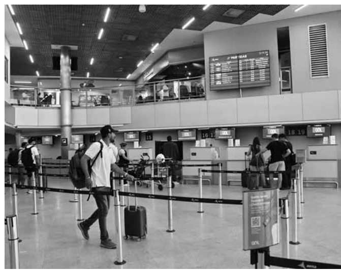
Estado registra redução de 8,9% dos voos, segundo a Anac

A diminuição na malha aérea preocupa não apenas as companhias, mas, principalmente, os consumidores. Com menos voos disponíveis, a tendência é de passagens mais caras e menor flexibilidade de horários. Na mais recente atualização do painel de tarifas do setor aéreo da Anac, com números de março de 2026, foi registrado um aumento de 17,8% em relação à tarifa de março de 2025.