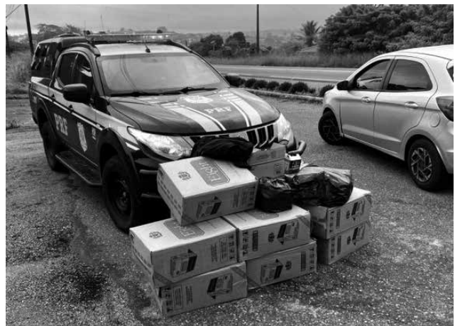
Material ilegal, trazido do Paraguai, incluía 355 isqueiros

Ao ser parado, o condutor do carro, um homem de