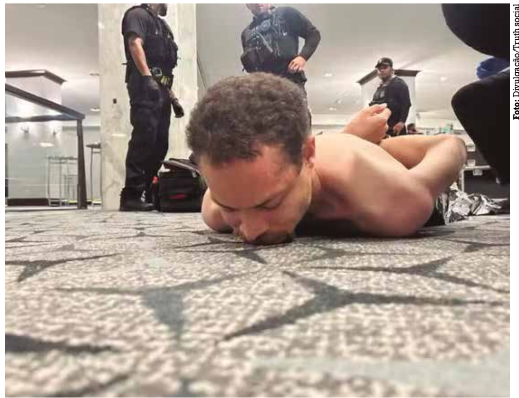
Atirador chegou a trocar tiros com autoridades antes de ser neutralizado pelo Serviço Secreto

Todos os anos, a Associação de Correspondentes da