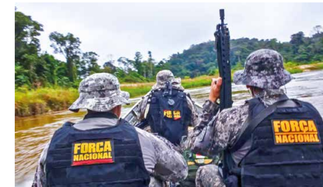
Apesar do número maior de homens da Força de Segurança Nacional, a ilegalidade existe

Quando considerados todos os tipos de conflitos, a violência por terra tem o maior percentual (75% ou 1.186 casos), seguida por conflitos tra-