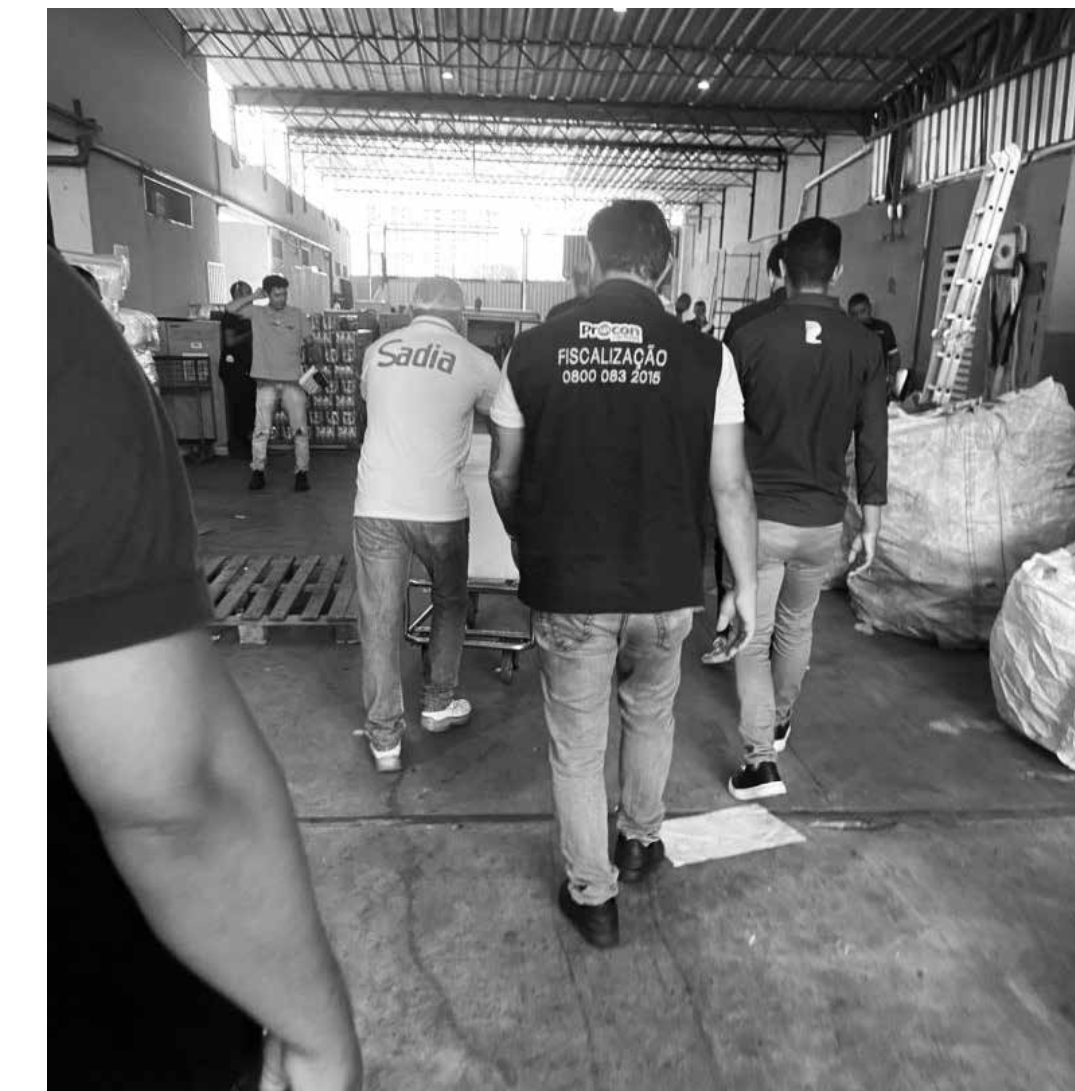
Fiscalização do órgão municipal constatou que os produtos estavam sem a data de validade

Outro conselho do titular do Procon-JP é que o