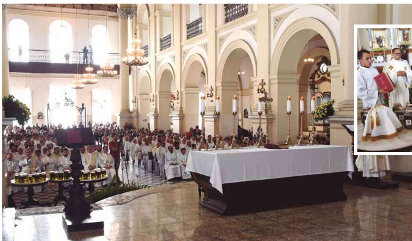
Rito inicial da Semana Santa aconteceu, durante a manhã de ontem, na Catedral Basílica de Nossa Senhora das Neves

ta, a leitura da paixão, a oração universal da Igreja e o silêncio na celebração da morte do Senhor, um tempo de recolhimento e reflexão pelo dom da vida que Jesus Cristo nos dá ao entregar a própria vida na cruz, derramando seu sangue para purificar os nossos pecados”, disse dom Delson.