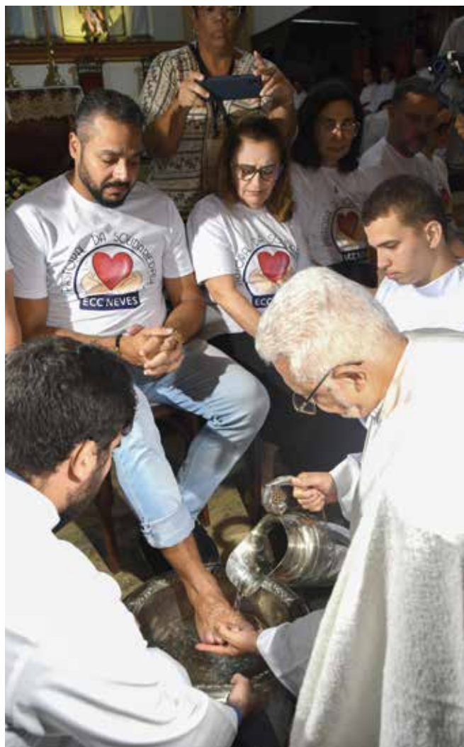
Liturgia simboliza o acolhimento dos fiéis por Cristo

A tarefa era desempenhada por servos, como forma de receber visitantes após longos deslocamentos a pé. Ao reproduzir esse gesto, a liturgia propõe