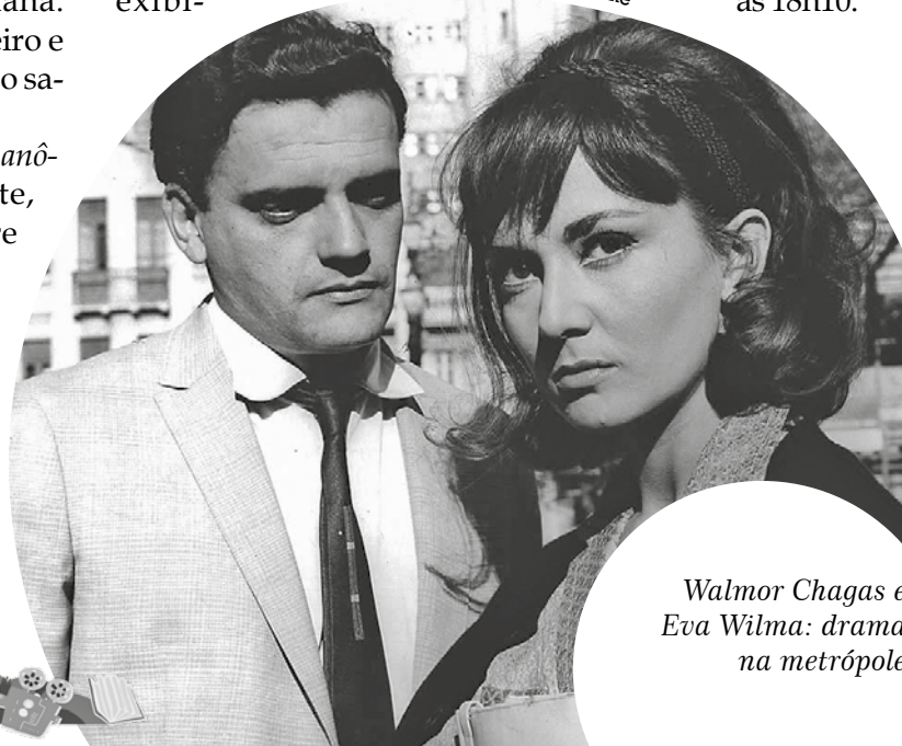
Walmor Chagas e Eva Wilma: drama na metrópole