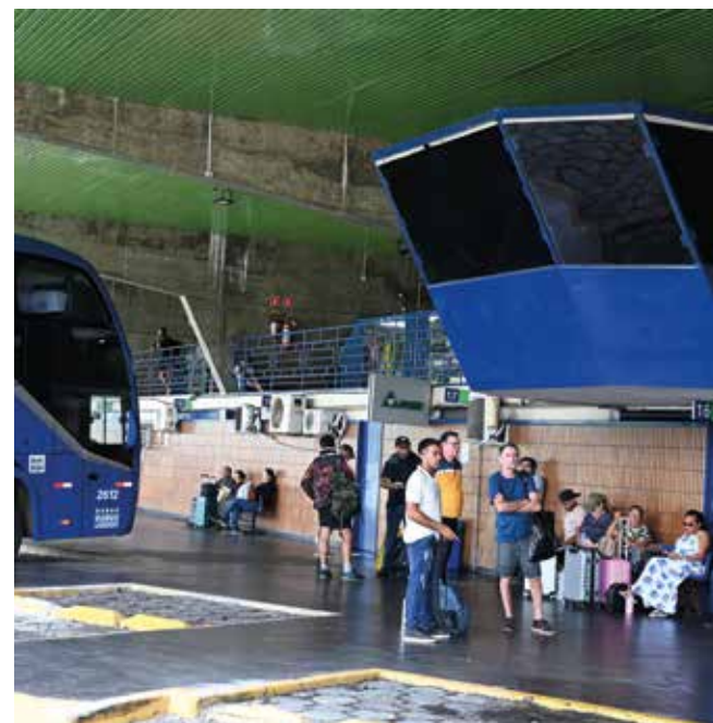
No terminal da capital, a projeção é de 17 mil viajantes

Em Campina Grande, no mesmo período, cerca de 13 mil viajantes devem passar pelo Terminal Rodoviário Argemiro de Figueiredo. As empresas agenda-