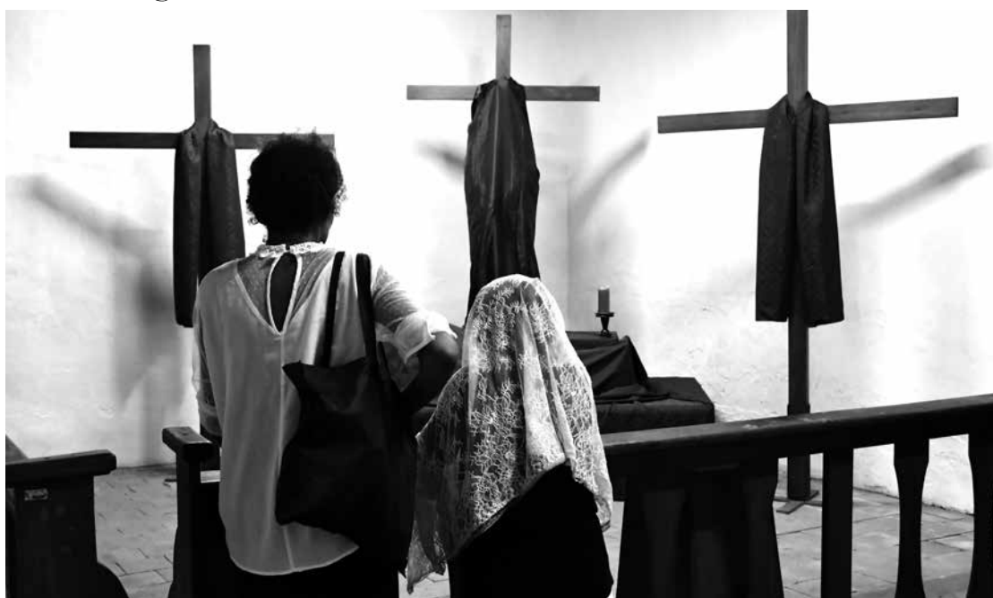
Sobre a dor