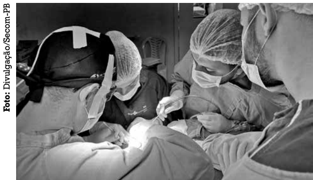
Expectativa é de realizar 12 procedimentos por mês

Estratégia abarcou a implantação de leitos reservas, a realização de visitas médicas diárias e a reorganização dos fluxos de trabalho no hospital