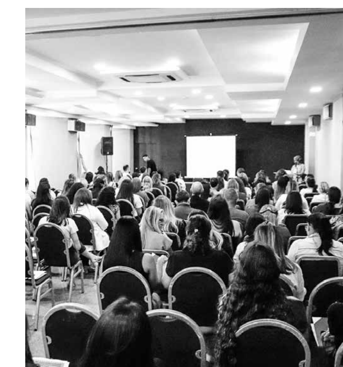
Evento reuniu profissionais de saúde em João Pessoa

A iniciativa teve como foco fortalecer a integração entre a SES e os profissionais que atuam diretamente na prevenção e controle das infecções relacionadas à assistência à saúde (Iras), promovendo atualização técnico-científica, troca de experiências e o fortalecimento de práticas voltadas à segurança do paciente. Nesta edição, um dos destaques foi o debate sobre o uso da inteligência artificial como ferramenta para aprimorar a vigilância epidemiológica, qualificar pro-