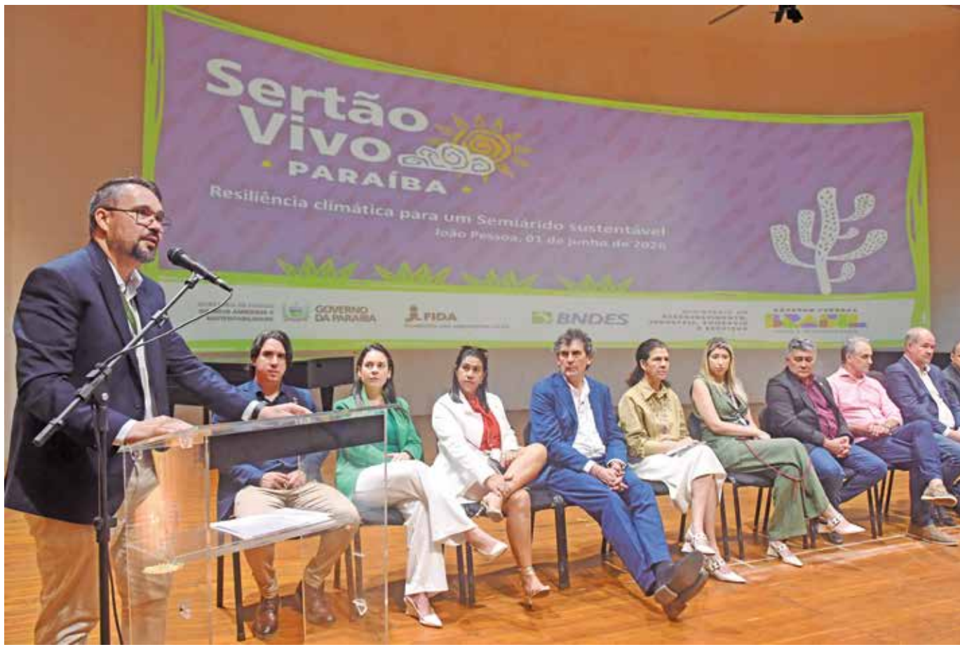
Iniciativa apoia projetos que promovam resiliência da população rural do semiárido, beneficiando mais de 150 mil pessoas