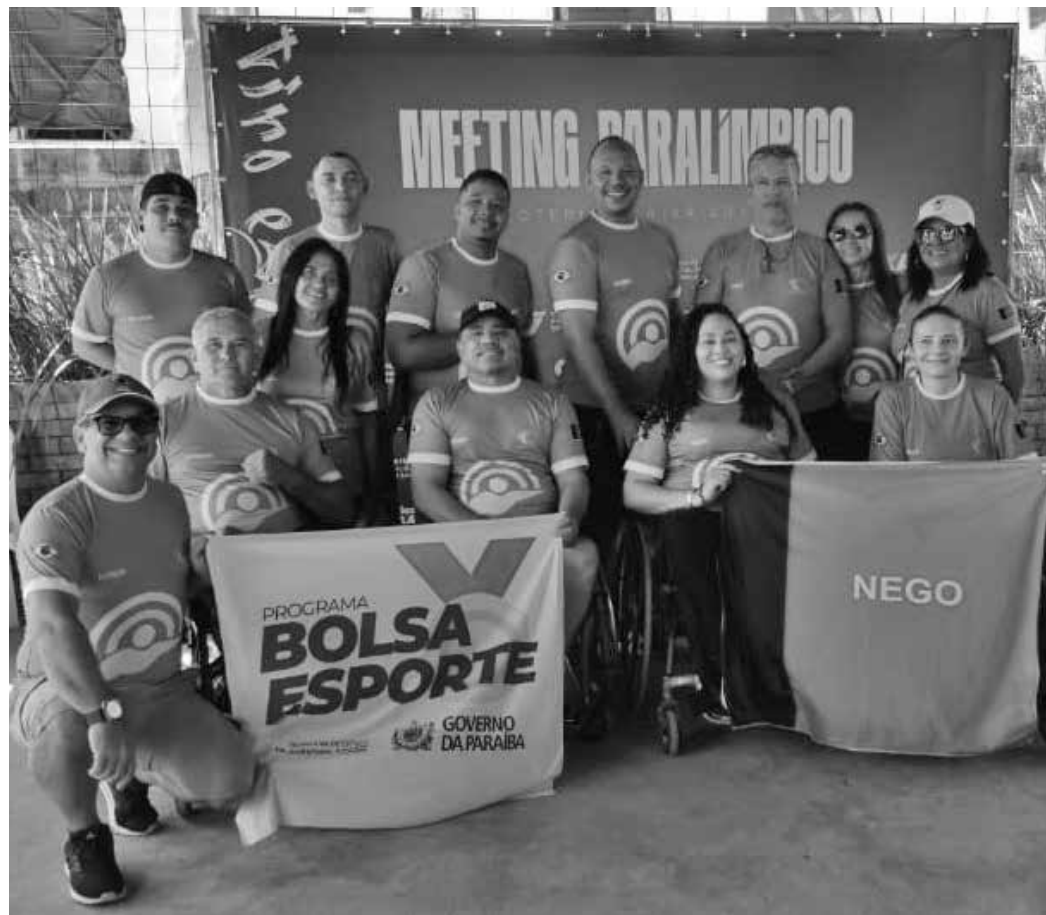
Competidores do tiro esportivo, que tiveram as disputas realizadas no Império Shot Clube