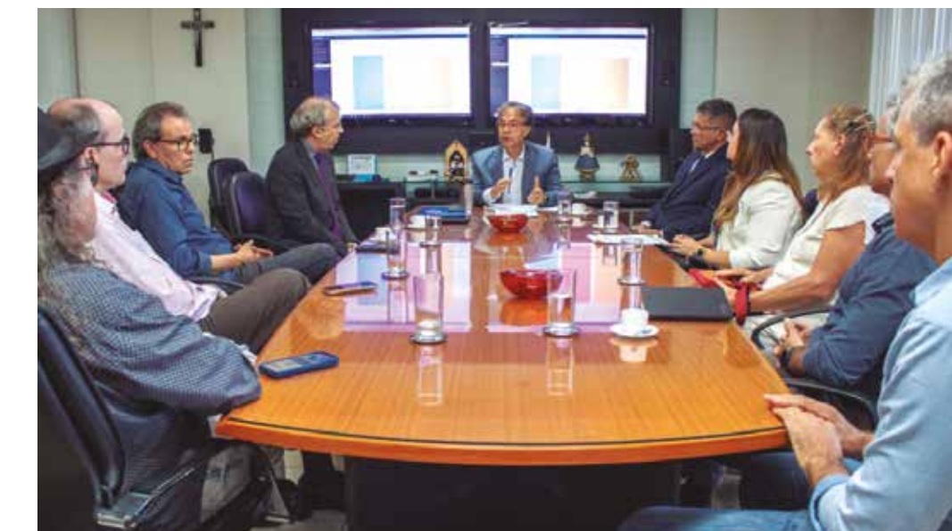
Técnicos do Tribunal de Contas do Estado avaliarão ferramenta apresentada pelas universidades