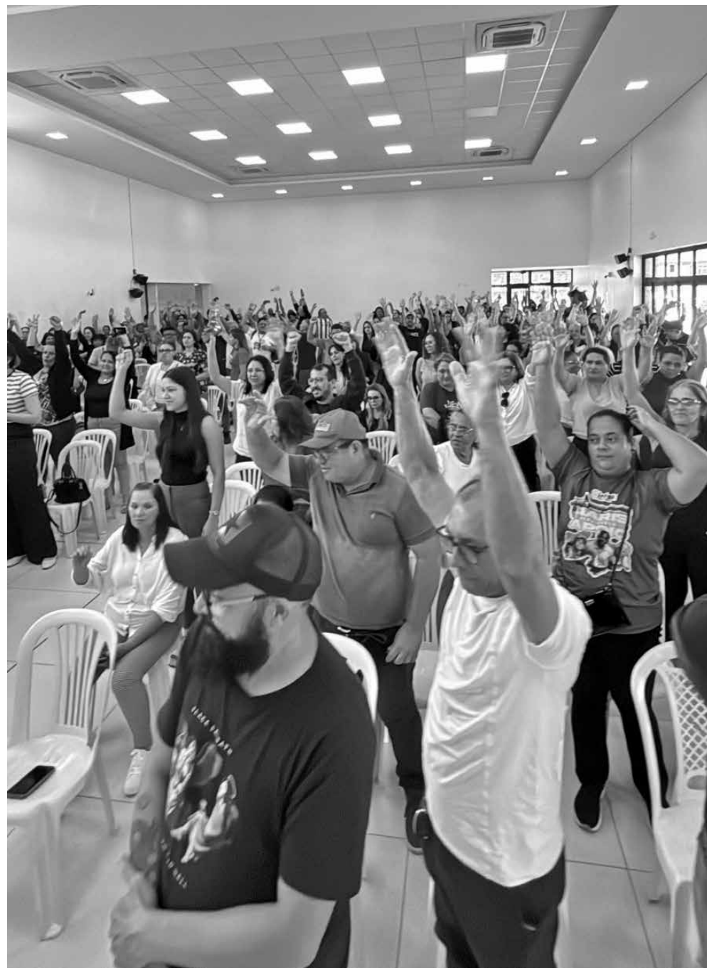
Paralisação foi aprovada ontem em assembleia e servidores aguardam negociações