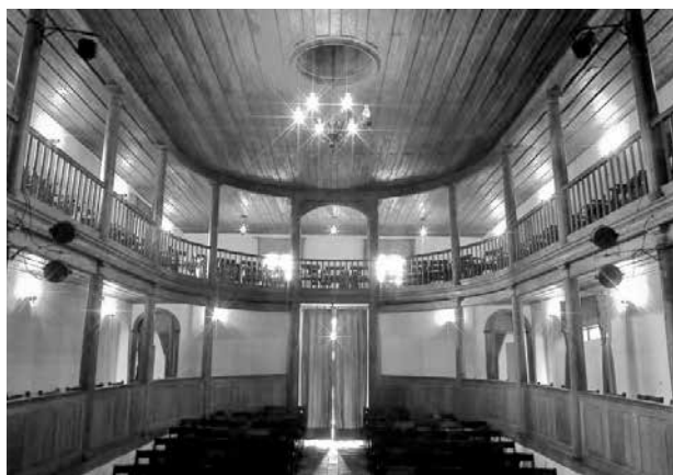
Palco, escadas e pisos foram reformados pela prefeitura