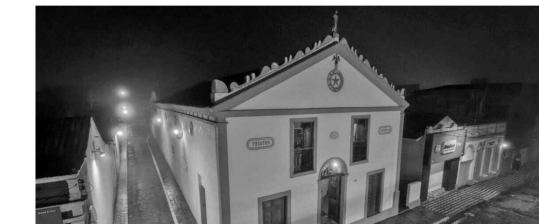
Espaço cênico foi erguido no século 19 e segue a tipologia de teatro de corte europeu

As intervenções concentraram-se na recuperação do palco, das galerias, do foyer, das escadas e dos pisos, com o emprego de madeiras nobres para garantir a estabilidade estrutural e a segurança do edifício. O Escritório Técnico do Iphan em Areia foi responsável pela elaboração dos projetos e pelo acompanha-