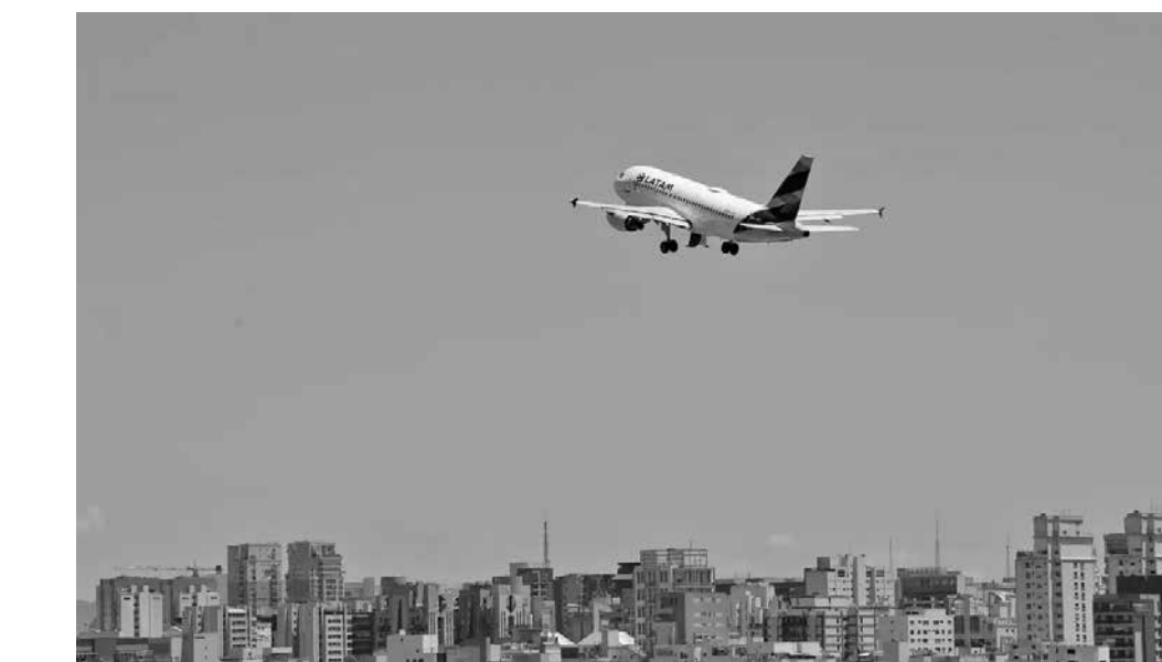
Mesmo com a queda, as companhias poderão parcelar a compra do querosene em seis vezes

Assim como o óleo diesel, a gasolina e o gás de cozinha, o QAV faz parte de um pacote de medidas do governo para frear o ímpeto do au-