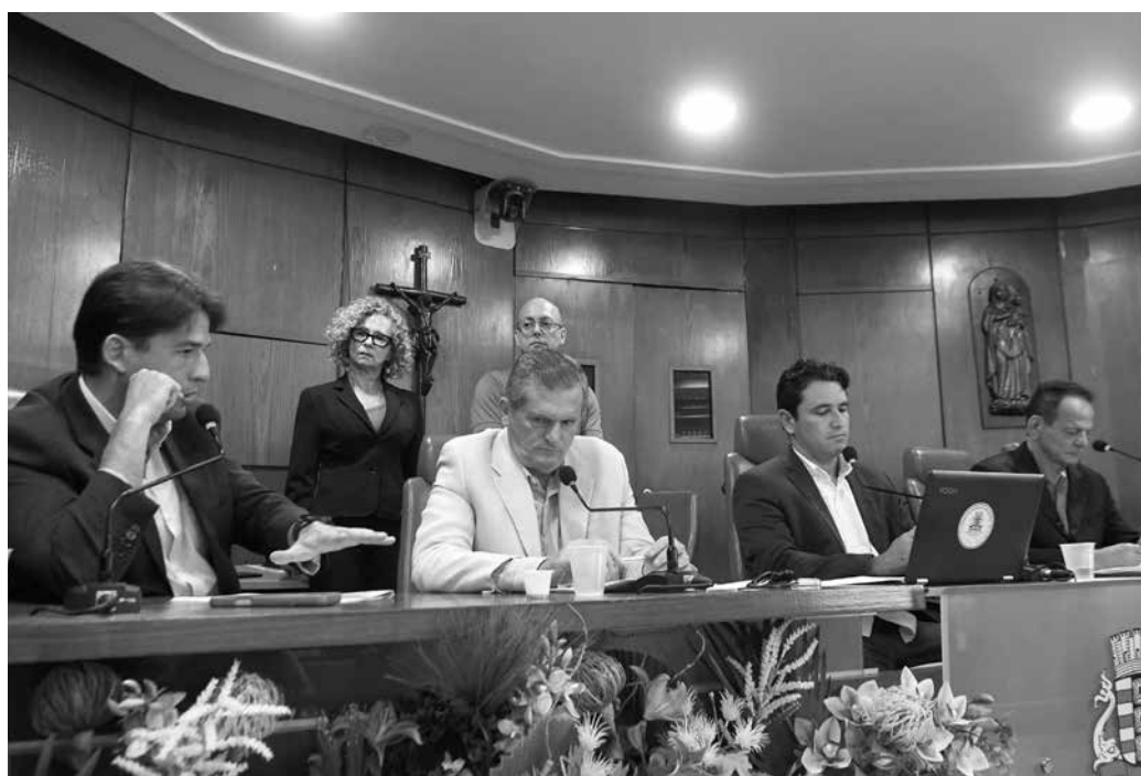
Com a aprovação pelo colegiado, matérias seguem para avaliação no plenário da CMJP

De acordo com a norma, o programa poderá ser desenvolvido por meio das seguintes ações: realização de campanhas educativas periódicas; oferta de palestras, oficinas e cursos de educação financeira em equipamentos públicos municipais; elaboração e divulgação de materiais informativos físicos e digitais; promoção de ações comunitárias de orientação financeira; divulgação de ca-