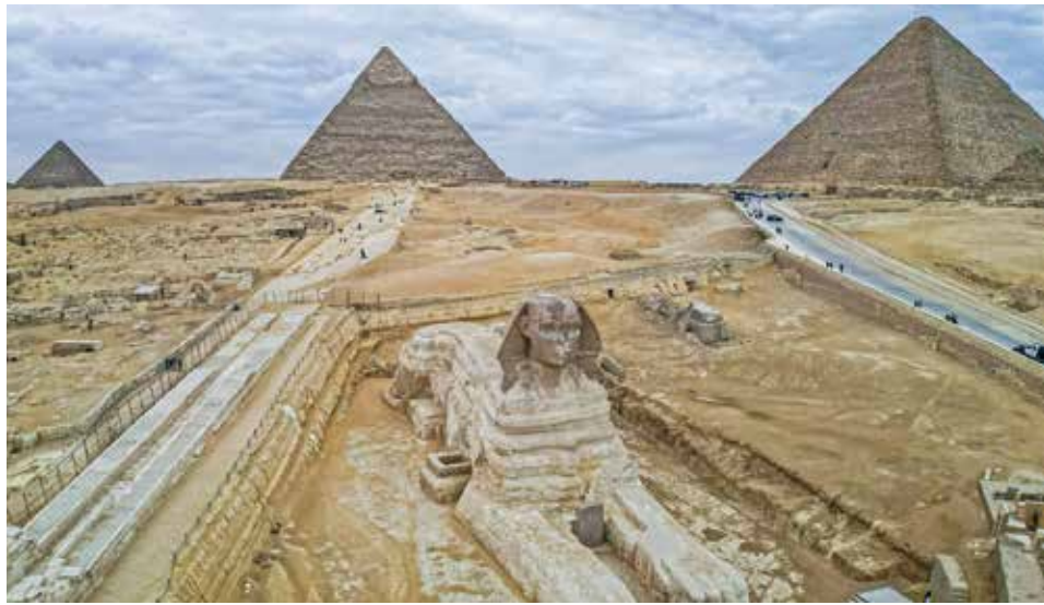
Terremotos afrouxaram pedras internas dos monumentos, mas exterior está preservado

“Praticamente não existem zonas que se comportem de forma muito diferente do resto”, apontou