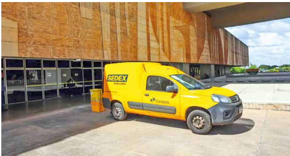
Os Correios executam um plano de reestruturação para tentar recuperar o equilíbrio financeiro

O Meu Pai Tem Nome é uma iniciativa promovida anualmente pelo Conselho Nacional das Defensoras e Defensores Públicos-Gerais (Condege) e realizada pelas defensorias públicas de todo o país.