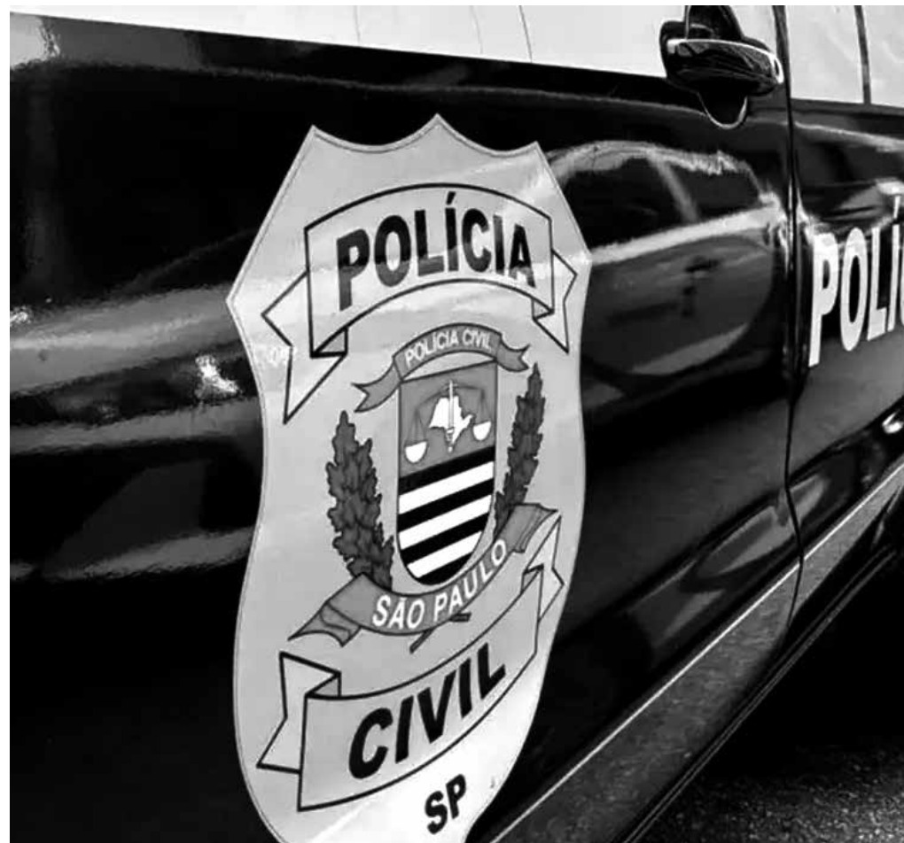
Foram cumpridos oito mandados de busca e apreensão para recolher documentos físicos e digitais

O Instituto de Karina é o principal alvo da operação, mas também foram cumpridos