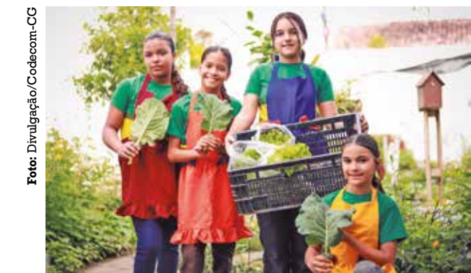
Programação foi aberta com a Horta de Africanidades

Por meio do QR Code, confira o cronograma de atividades do mês