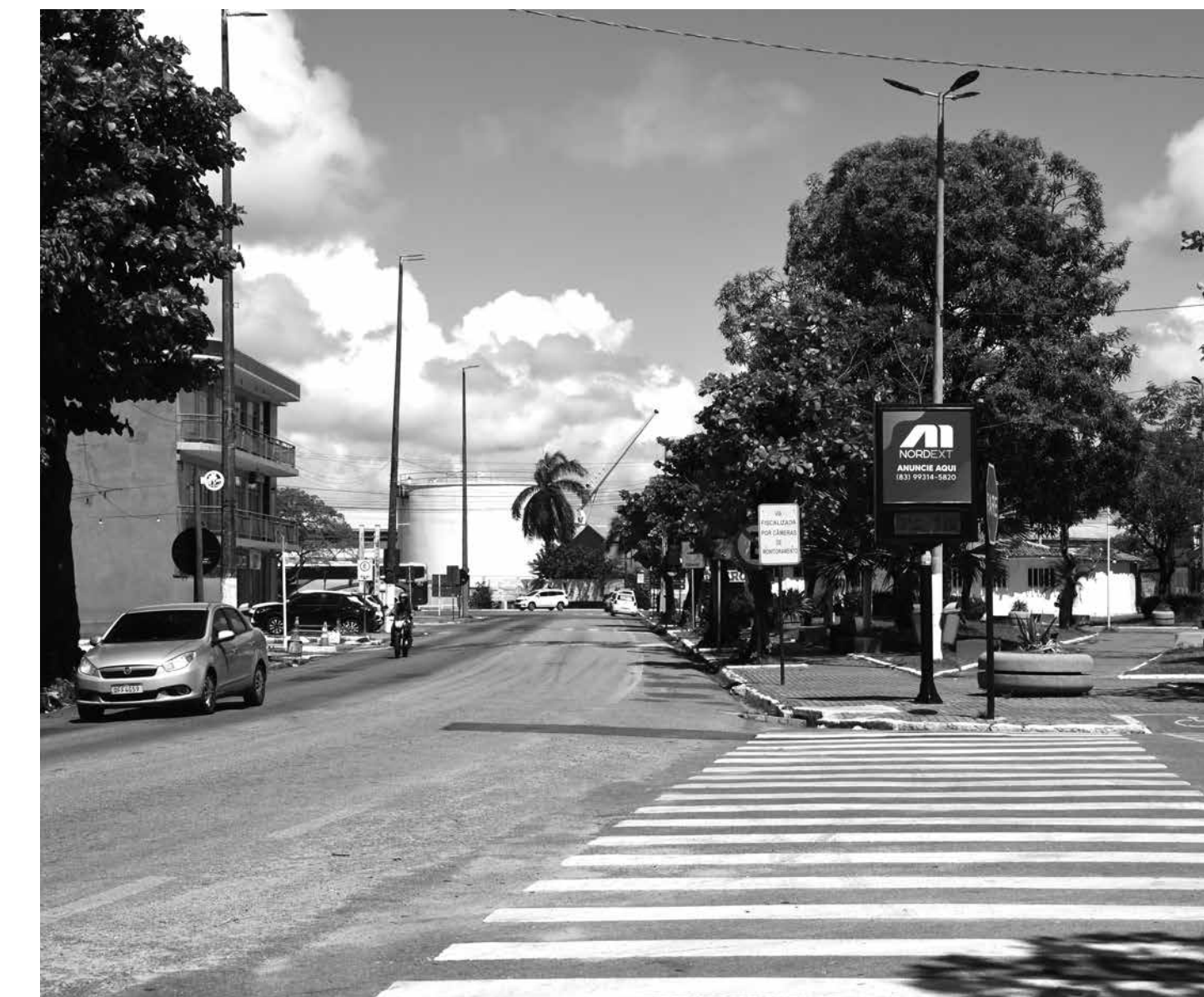
Medida alcança Cabedelo (foto), Bananeiras, Campina Grande, Cuité, Esperança, João Pessoa, Patos, Santa Luzia, Santa Rita, Sapé e Sousa

Nas recomendações encaminhadas aos gestores municipais, o MP Eleitoral orienta que sejam evitadas práticas que possam caracterizar promoção política durante os festejos. Entre as proibições, está o uso de palcos, sistemas de som, microfones, telões, locuções oficiais, apresen-