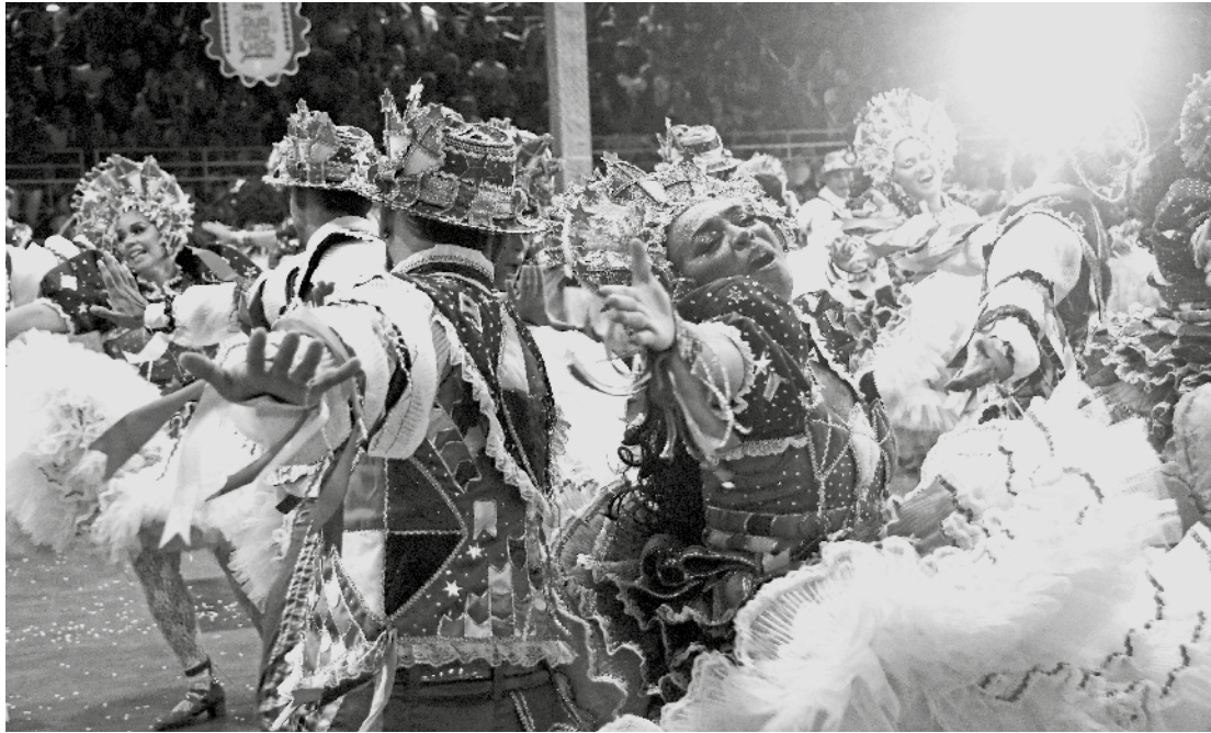
Luzes de São João