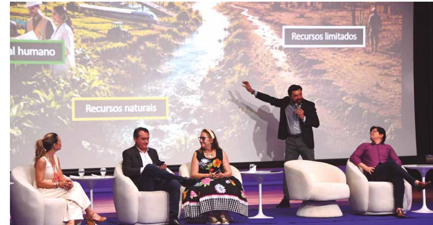
Organizada pelo Sebrae, com apoio do Governo do Estado e da Famup, a programação do encontro incluiu painéis sobre futuro das cidades, turismo e inovação

“Fazer com que eles [os municípios] possam entender qual é o grande potencial que cada um tem e que