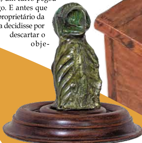
As obras de Romdias fazem alusão à indomabilidade da natureza e ficam disponíveis à visitação até julho