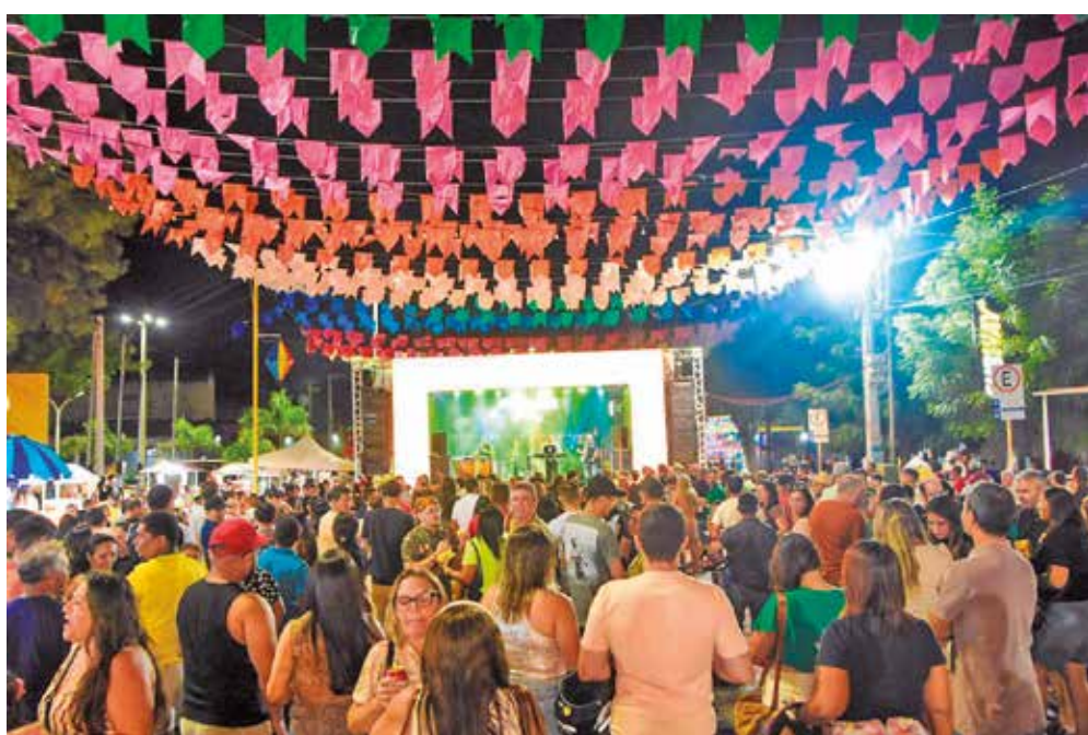
Programação começa na sexta-feira (19) e segue até a terça-feira (23), na Capital do Sertão

Esse gelo, no entanto, tende a rachar caso as autoridades e empresários busquem investir num marketing institucional e vender, para a Paraíba, o Nordeste e o Brasil, o que a cidade tem de melhor. A oportunidade está posta, tendo em vista que Campina Grande tem o festival junino, tem o clima serrano, charme natural, infraestrutura e hospitalidade. Falta ação coordenada e apoio aos empreendedores para que possam colocar novos modelos de empreendimentos imobiliários na esteira, saindo do tradicionalismo residencial e adentrando em um instrumento de capitalização do turismo capaz de atrair o investidor financeiro, fomentar a hotelaria e consolidar a cidade como destino além do mês de junho. Quem sair na frente vai descobrir que frio em Campina pode ser apenas o clima, mas não o mercado imobiliário. Está apenas esperando o produto certo para acender.