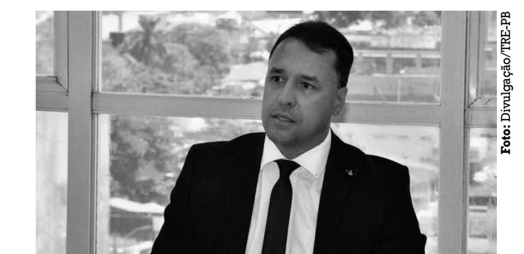
Juiz já atua no TRE-PB como auxiliar da presidência

No âmbito da Justiça Eleitoral, já desempenhou funções de grande responsabilidade, como juiz eleitoral titular no interior e na capital, além de exercer atribuições relevantes nas eleições, como presidente