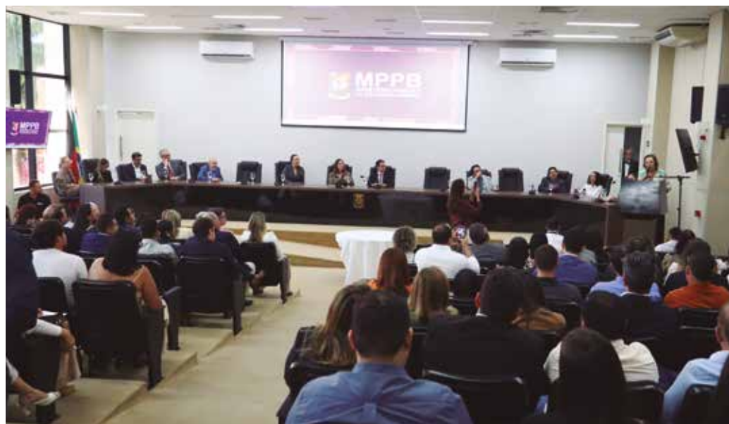
Projeto Voltando a Refletir, do MPPB, é uma parceria com o programa Antes que Aconteça

Para isso, os termos preveem a capacitação de multiplicadores, realizada pelo MPPB, junto com pessoas indicadas pelas próprias cida-