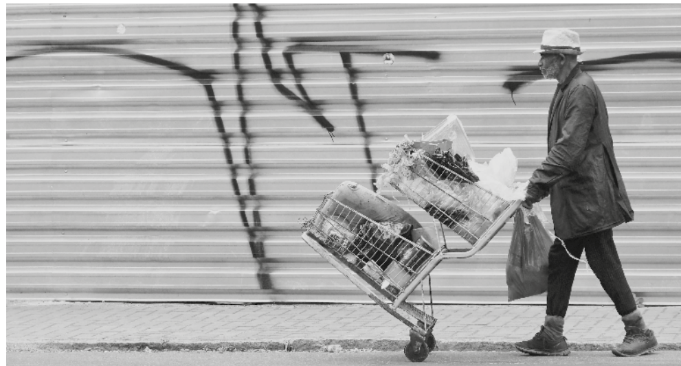
A elegância não tem classe social