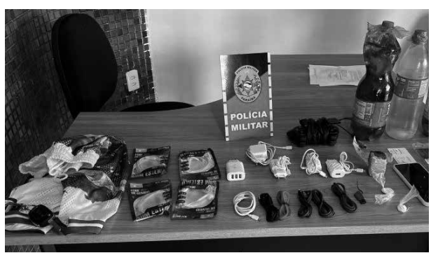
Objetos apreendidos incluem drogas, celulares e fones

delegada, o menor de idade passou pelos procedimentos necessários e foi entregue à mãe. Já o outro acusado foi autuado em flagrante, não apenas pela tentativa de introduzir materiais ilícitos no presídio, como também