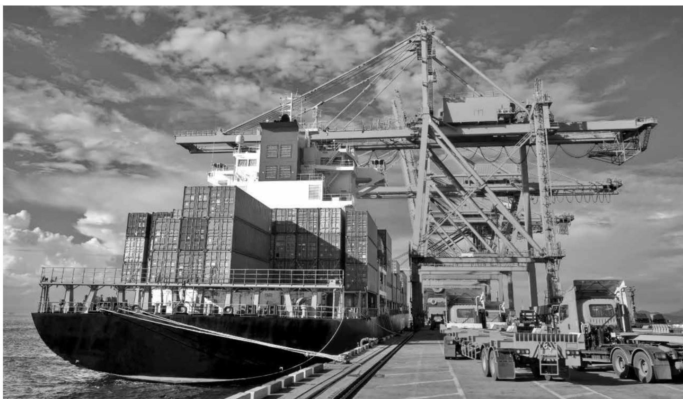
Novos tributos sobre itens nacionais ainda serão debatidos, antes de uma decisão final do governo dos Estados Unidos

Na investigação específica contra o Brasil, inicia-