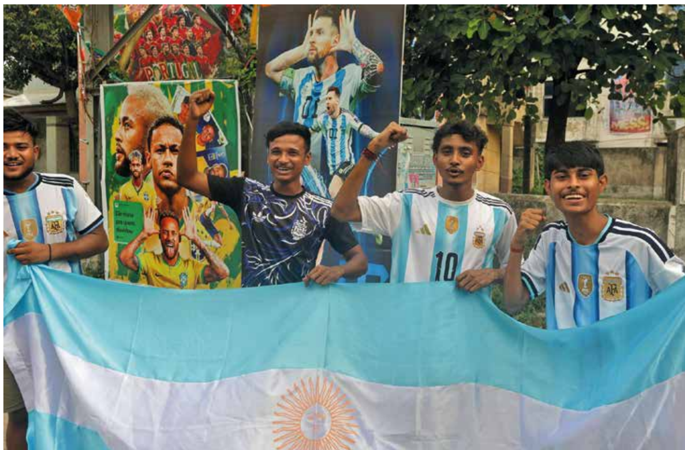
Jovens indianos replicam cânticos míticos do mundo do futebol e demonstram o grande amor pela seleção da Argentina

No cartaz dedicado ao astro da Seleção Brasileira, lê-se