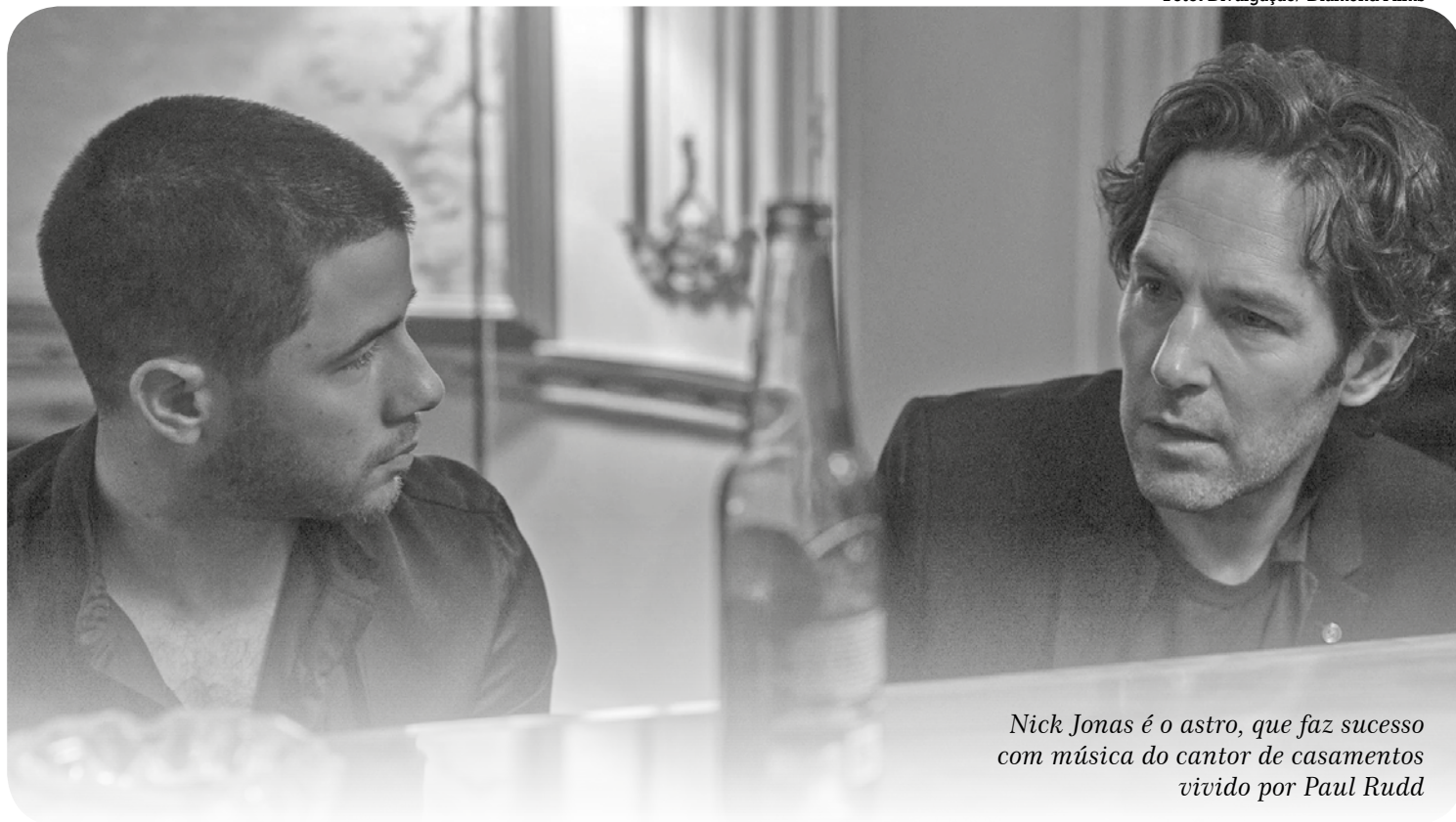
Nick Jonas é o astro, que faz sucesso com música do cantor de casamentos vivido por Paul Rudd