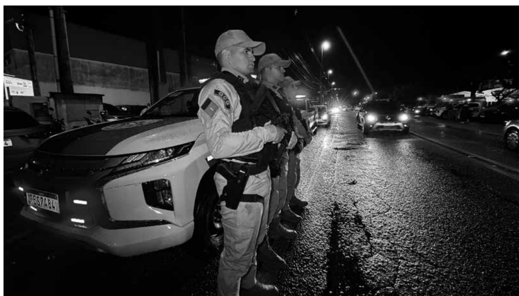
Ações contribuíram para uma queda de 50% nos registros de homicídio na Grande João Pessoa

Lançada no último dia 12, a Operação Paraíba Mais Segura, coordenada pela Secretaria de Estado da Segurança e da Defesa Social (Sesds), mobiliza efetivos da PMPB, da Polícia Civil da Paraíba (PCPB), do Corpo de Bombeiros e da Polícia Penal em atividades integradas de prevenção, fiscalização, inteligência e repressão qualificada à criminalidade, incluindo bloqueios policiais e investigações, em pontos considerados estratégicos para o fortalecimento da presença operacional do Estado.