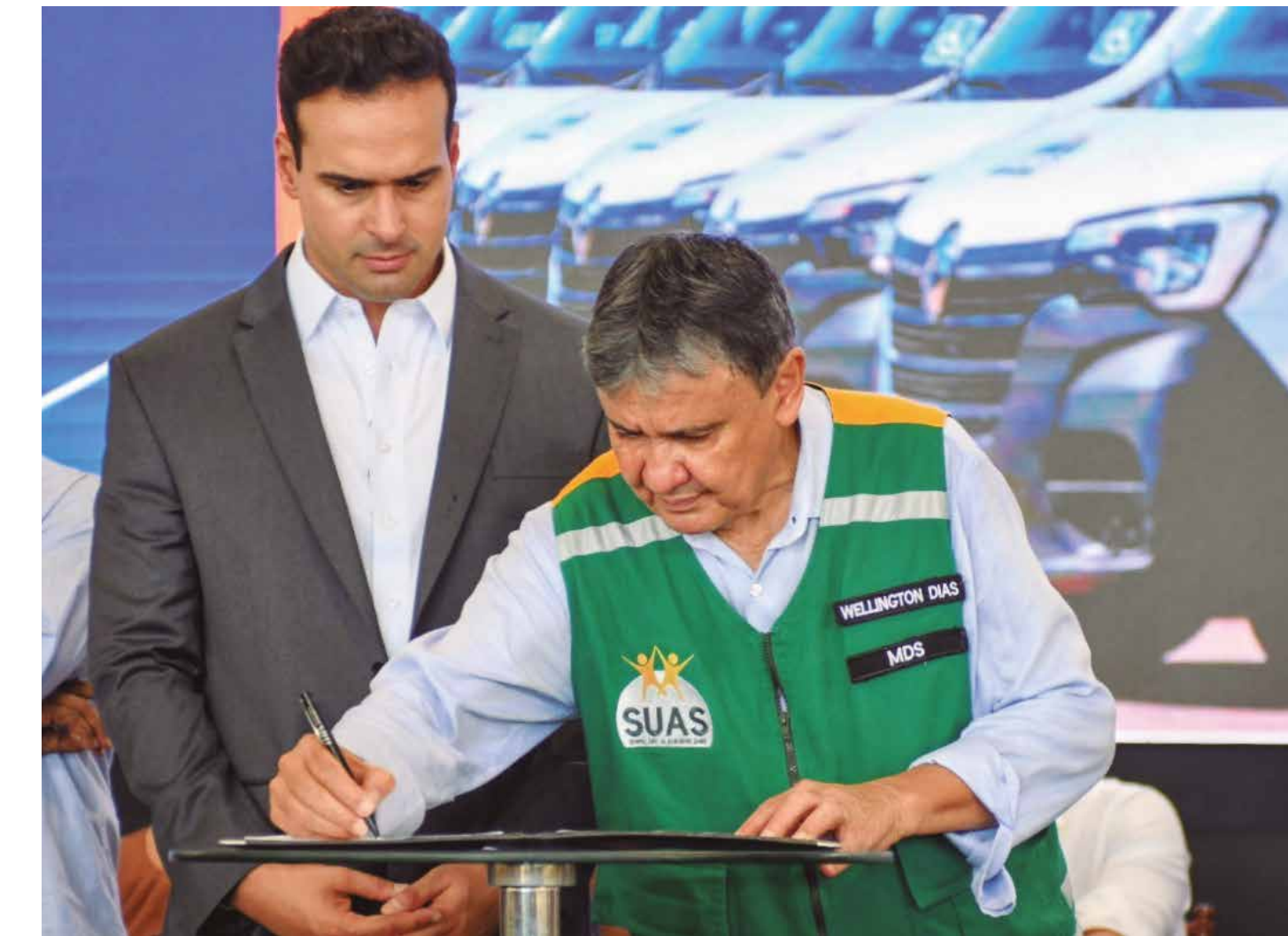
Vans foram entregues pelo governador Lucas Ribeiro e pelo ministro Wellington Dias, em solenidade na capital paraibana

O prefeito de Alagoa Grande, João Bosco Carneiro Neto, destacou o impacto direto do veículo na assis-