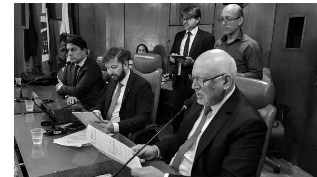
Projeto encaminhado pelo Executivo está em consonância com o Plano Plurianual 2026–2029

de apoio cultural, às emissoras executantes dos serviços de radiodifusão comunitária, de autoria do Executivo municipal;