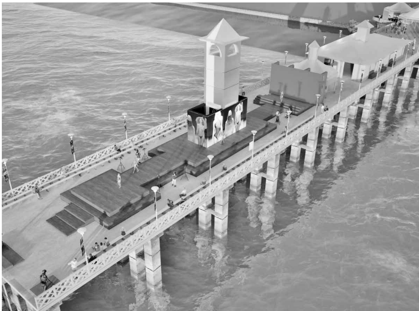
Ponte dos Ingleses foi o palco da moda autoral brasileira; evento integrou as comemorações dos 300 anos da capital cearense