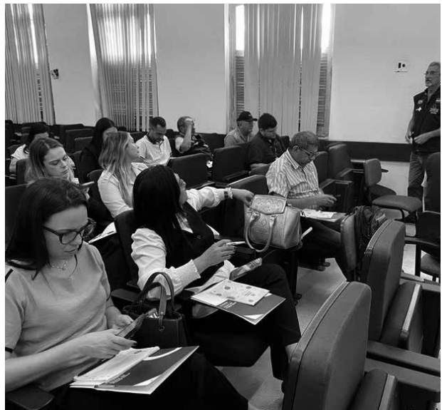
SES promove oficina com 12 Regionais de Saúde