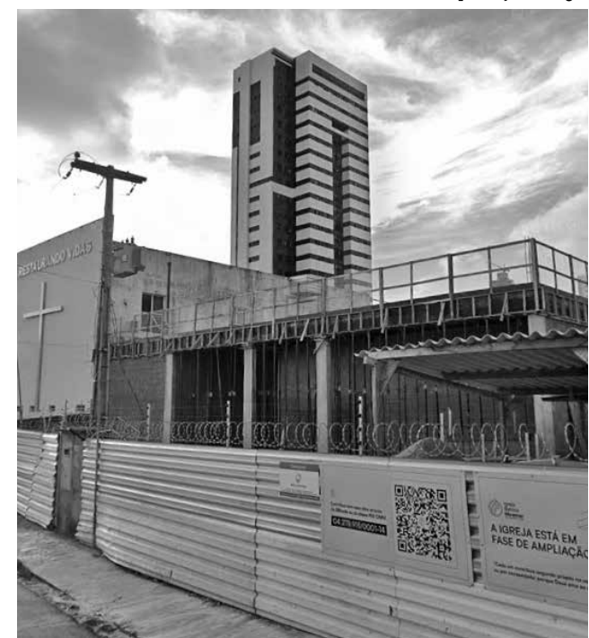
“Prédios ou estacionamentos, enfim o que render mais”