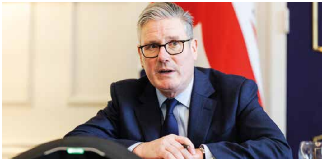
O primeiro-ministro Keir Starmer afirma que novas medidas visam à frota ilegal da Rússia

Da mesma forma, punem fornecedores de países terceiros que fornecem equipamentos militares críticos à Rússia, mas estão localizados na China, Tailândia e Turquia. Várias organizações que ajudam a Rússia a contornar as sanções finan-