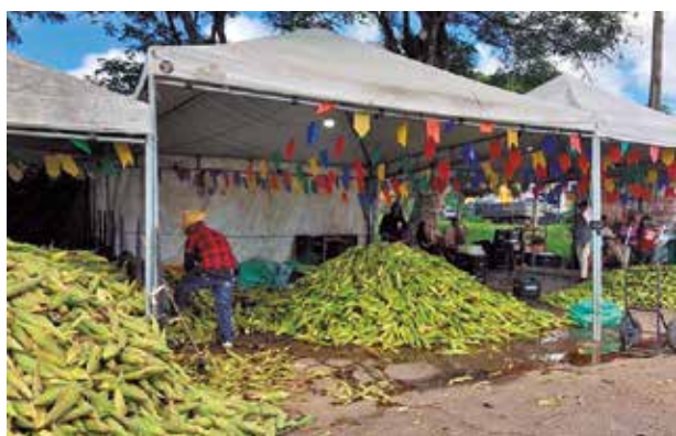
Preço da mão de milho varia de R$ 50 a R$ 60 no local

Do total de milho negociado na Feira de Milho da Empasa, 70% é produzido nos municípios de Conde e Alhandra. Outros 20% do produto têm origem nos demais municípios paraibanos e os 10% restantes vêm do estado vizinho do Rio Grande do Norte.