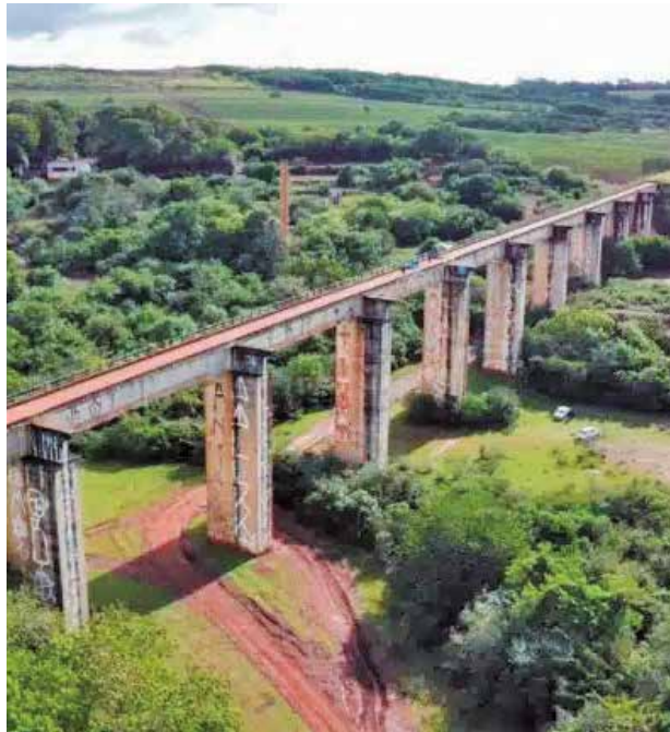
Ministério da Gestão avalia a demolição da armação