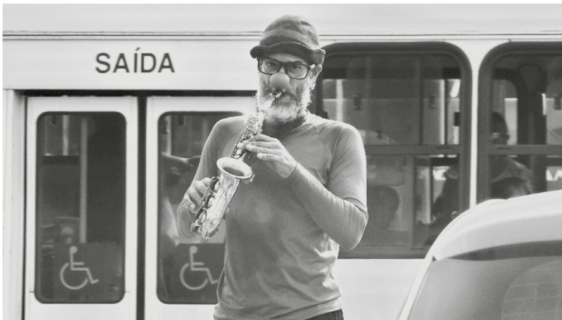
A saída é a música