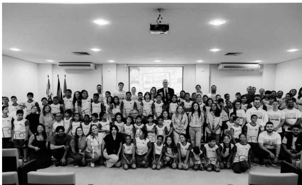
Programação promovida pela Semas reuniu 100 alunos da rede pública de ensino de Bayeux

A ação promovida pelo Tribunal de Justiça da Paraíba (TJPB), por meio da Unidade de Sustentabilidade e do Laboratório de Inovação (Lyno), da Esma, da Secreta-