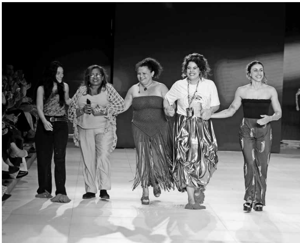
Representantes paraibanas no festival na Praia de Iracema levaram criatividade e transformação para o mercado