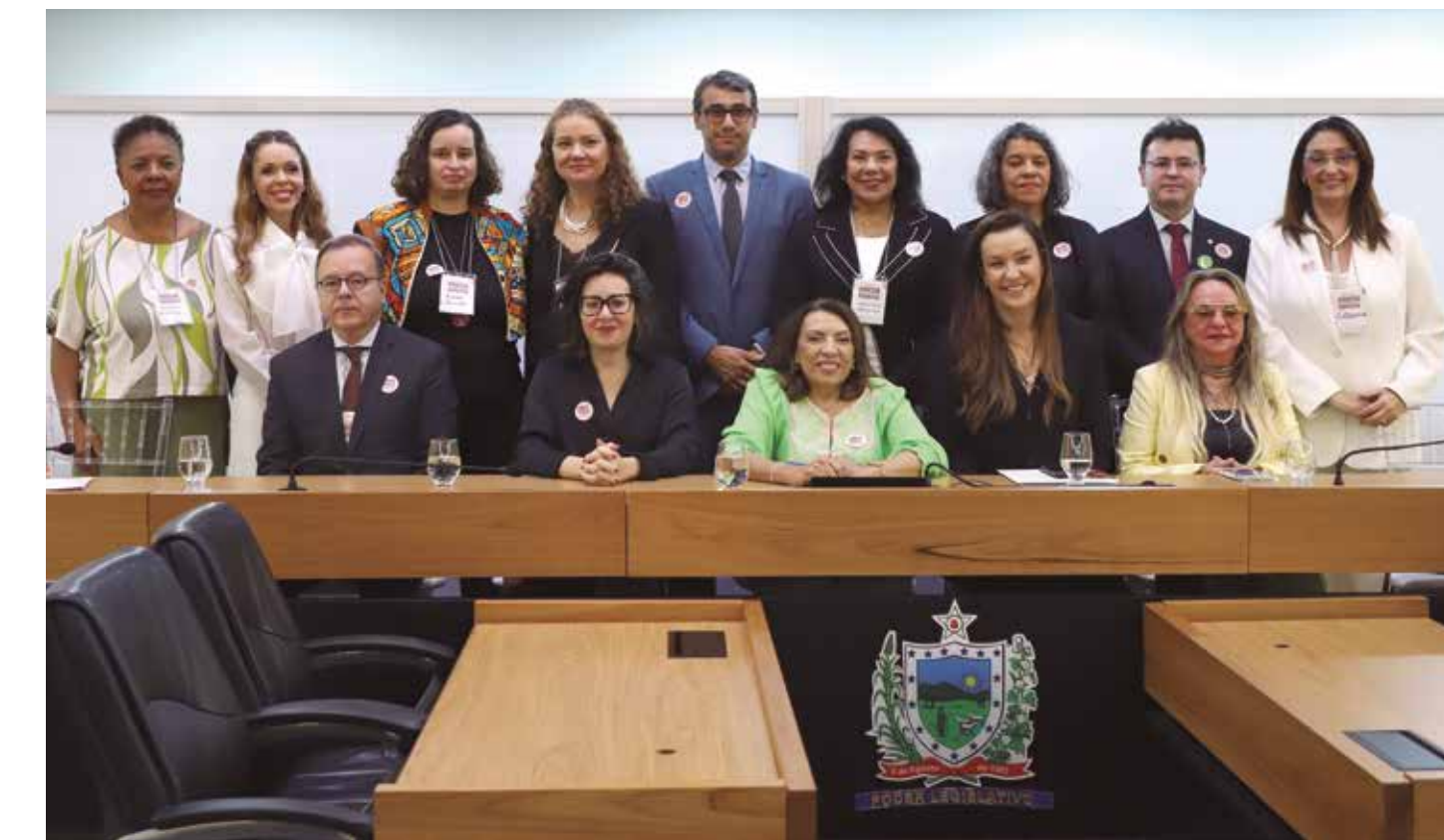
Realizada na sede da ALPB, a atividade integra as medidas previstas em sentença da Corte Interamericana de Direitos Humanos