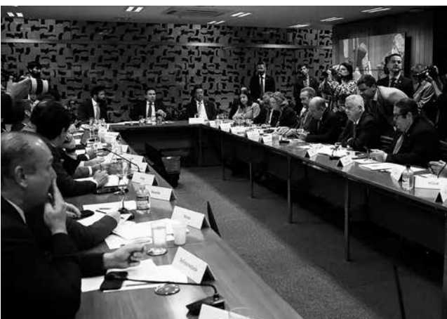
Com a mudança, a casa ficou livre para votar outras matérias

No seu relatório, a deputada destacou haver uma convergência central sobre “a íntima relação entre o discurso de ódio e inferiorização das mulheres e a prática de crimes graves”,