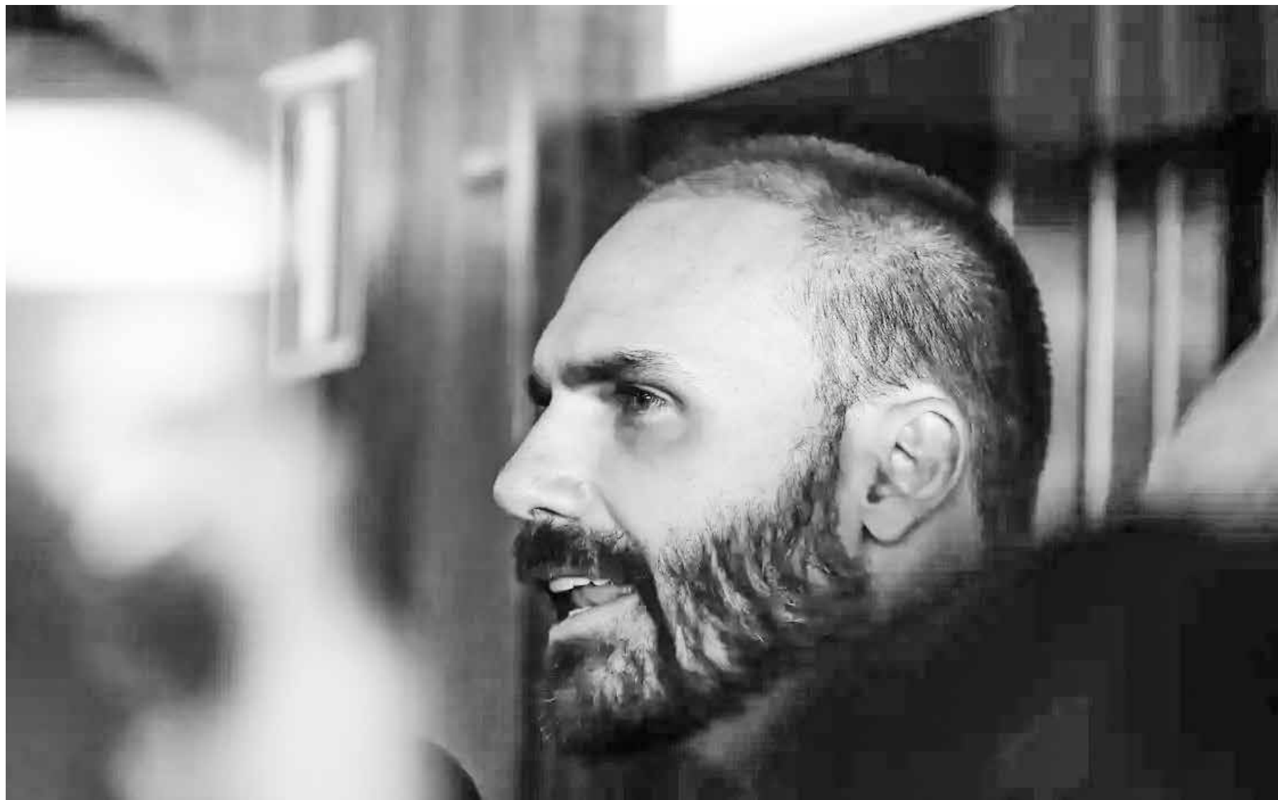
Em março, o filho do ex-presidente Jair Bolsonaro fugiu para os Estados Unidos e, após acumular faltas sem justificativas, teve seu mandato cassado

to de Eduardo Bolsonaro por faltas, devido ao fato de o deputado ter deixado de comparecer à terça parte das sessões deliberativas da Câmara dos