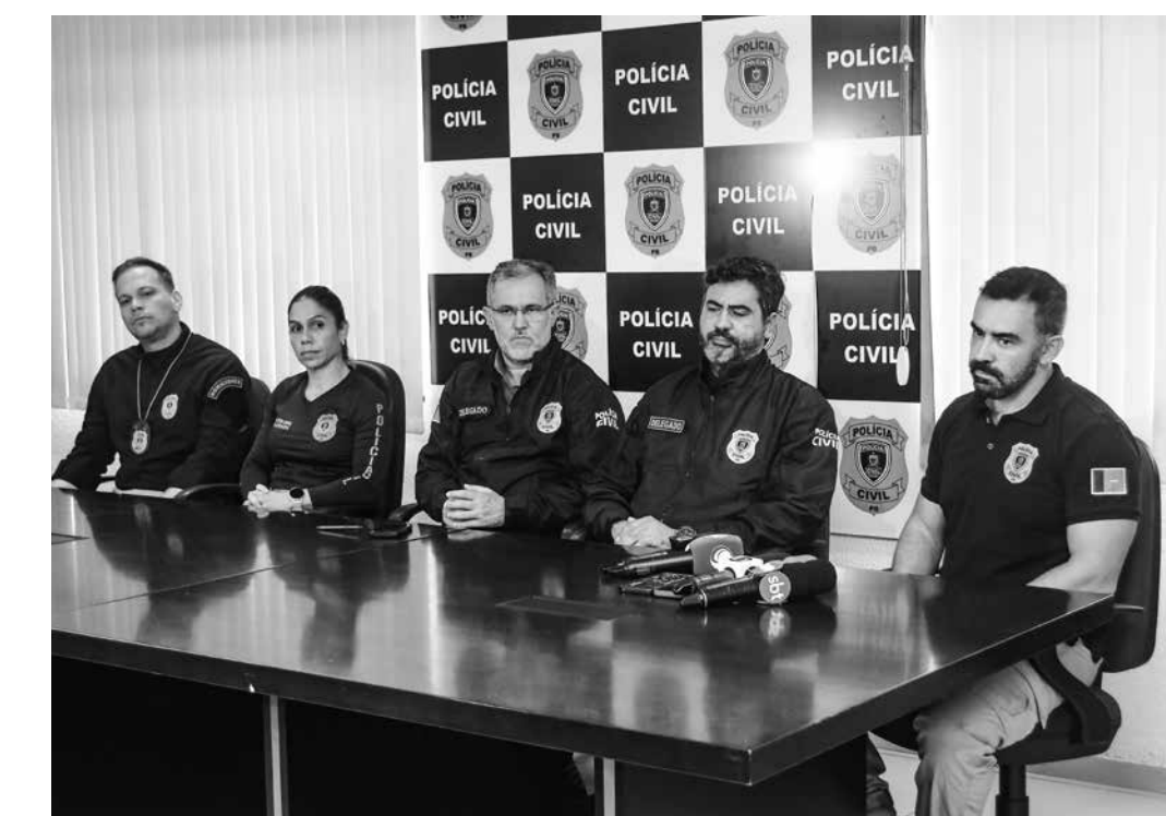
Autoridades policiais indicaram que vítimas não tinham envolvimento com a criminalidade

Rabelo esclareceu, ainda, que detalhes apurados pelas autoridades não podem ser