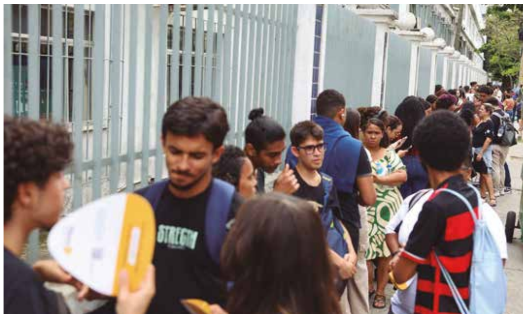
Exame nacional avalia o desempenho escolar dos estudantes ao término da Educação Básica

O pagamento da taxa de inscrição do exame pode ser feito em qualquer banco, casa lotérica ou por meio de aplicativos bancários. Não serão aceitos pagamentos de inscrições por meio de depósito em caixa eletrônico, via postal, transferência ou depósi-