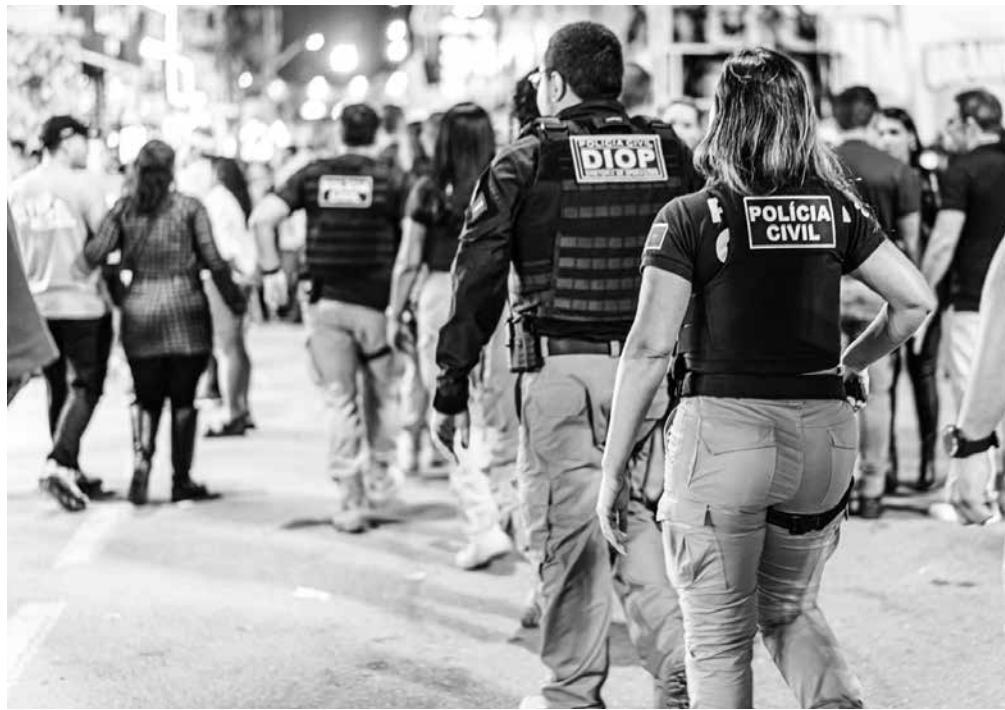
Policiais civis e militares, além dos bombeiros, atuam de forma integrada com o Cicc

Conforme as autoridades, a tecnologia e a inteligência providas pelo Cicc auxiliaram diretamente na execução de 43 das 73 detenções contabilizadas até o momento na região, incluindo ferramentas como o sistema de reconhecimento facial e o videomonitoramento de pessoas submetidas a medidas judiciais restritivas. As outras 30 prisões foram efetuadas pelas equipes da Polícia Militar da Paraíba (PMPB), em meio às ações de policiamento ostensivo.