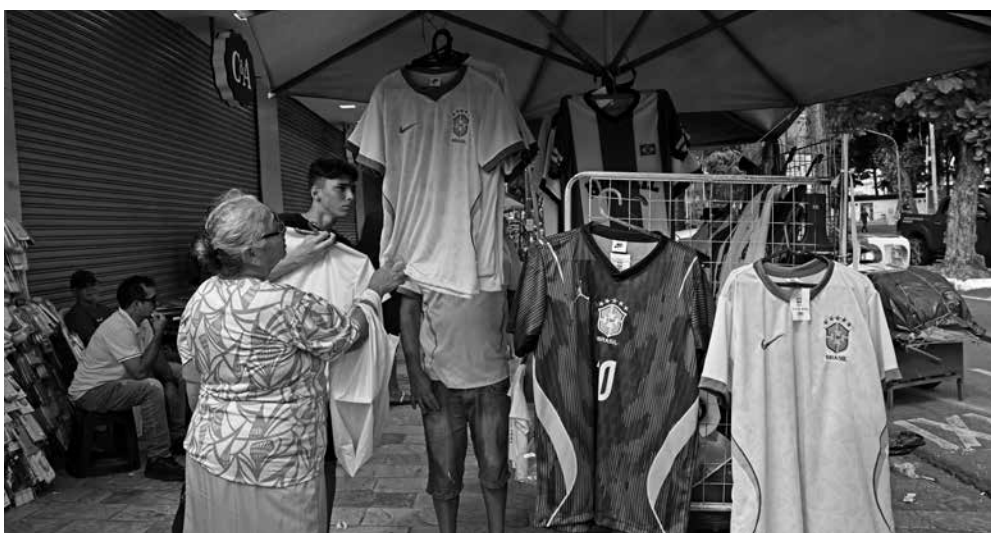
Primeira partida da Seleção na etapa mata-mata aquece vendas de camisetas e bandeiras