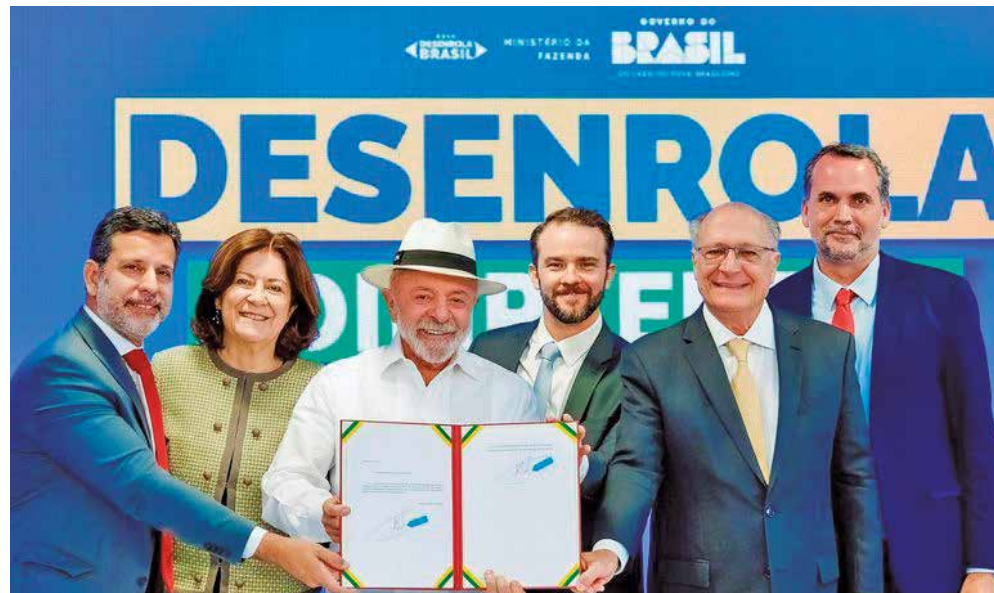
Lula assina MP ao lado de ministros durante cerimônia de lançamento no Palácio do Planalto

Também presente ao evento, o ministro da Educação, Leonardo Barchini, exaltou a iniciativa de ampliar o apoio aos estudantes que fizeram uso do Fies. “Pela primeira vez, estamos pegando esses jovens, que são egressos da escola pública,