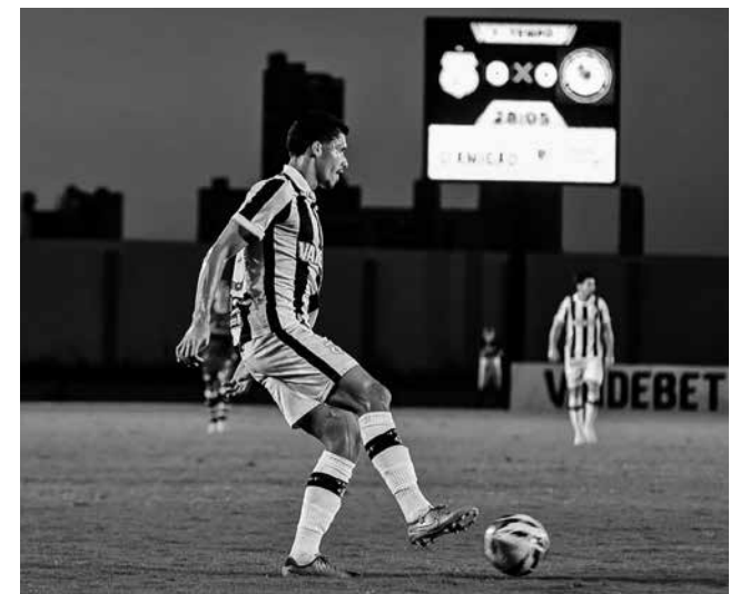
O Treze faz uma excelente campanha no Brasileiro