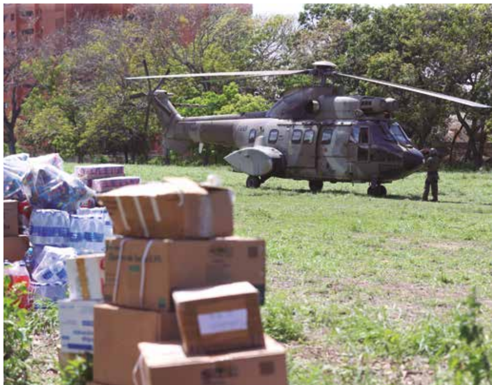
Já são 14 os países da UE que contribuíram com equipes e recursos para áreas afetadas

Isso eleva para 14 o número total de países da União Europeia que, até o momento, contribuíram com equipes de busca e res-