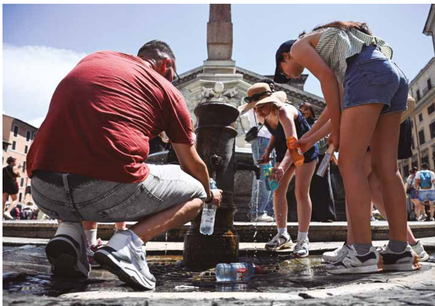
Autoridades italianas alertaram que o choque entre massas de ar pode dar origem a fortes tempestades em regiões do norte do país

As funerárias de Paris registraram, ontem, sua capacidade máxima por um aumento de óbitos durante a onda de calor recorde, que deixou pelo menos 1.000 mortos na França ao final da semana passada.