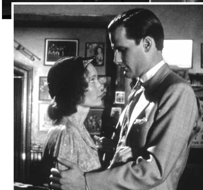
Jeff Daniels é o personagem que desce da tela para namorar Mia Farrow