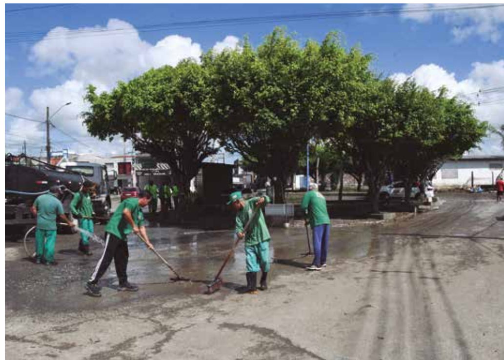
Gestão santa-ritense deslocou equipes de limpeza para remover lama e sujeira das vias

A Secretaria de Infraestrutura de Santa Rita lembra que, recentemente, foi feito um serviço de dragagem e de limpeza na região próxima aos rios Paraíba e Preto. “A prefeitura realizou o serviço de dragagem 20 dias antes da primeira enchente, mas é