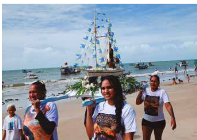
Fiéis conduzem imagem do santo pela orla de Tambaú, em JP

Comunidade da Praia da Penha celebrou o dia do apóstolo com procissão e barqueata