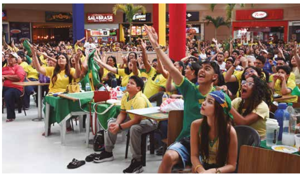
Vitória do Brasil contra o Japão, no sufoco, rendeu muitos gritos de desespero da torcida

O que estava em jogo era a permanência da Seleção na competição, e o time adversário vinha angariando, desde o início do torneio, comentários especializados que o colocavam como um dos melhores que o país asiático já apresentou nos campos. O otimismo, todavia, dominou os palpites de quem se aproximava dos