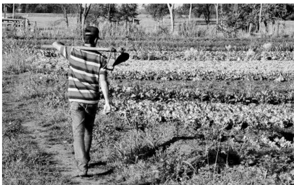
Plano Safra beneficiou mais de dois milhões de agricultoras e agricultores familiares

O avanço demonstra o fortalecimento da autonomia econômica das agricultoras familiares e o reconhecimento do papel das mulheres na produção de alimentos, na gestão das propriedades e na dinamização das economias locais.