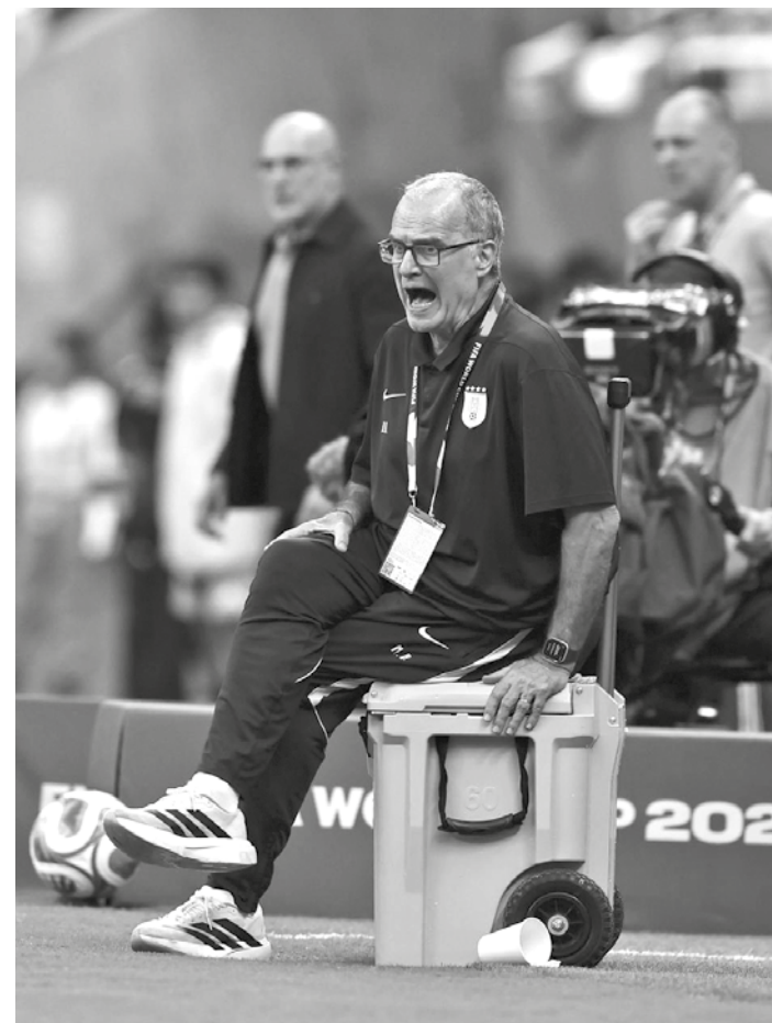
Bielsa bastante irritado com a atuação da seleção, na Copa