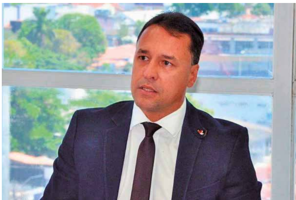
Magistrado foi escolhido por unanimidade pelo pleno do Tribunal de Justiça da Paraíba

Falhas no procedimento podem resultar em perda do direito ao recebimento do Fundo Partidário e do Fundo Especial de Financiamento de Campanha