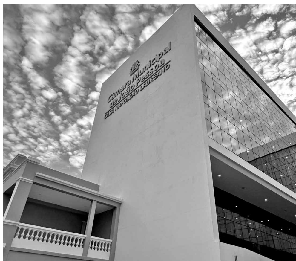
Casa Napoleão Laureano funciona em prédio mais amplo e moderno a partir de amanhã