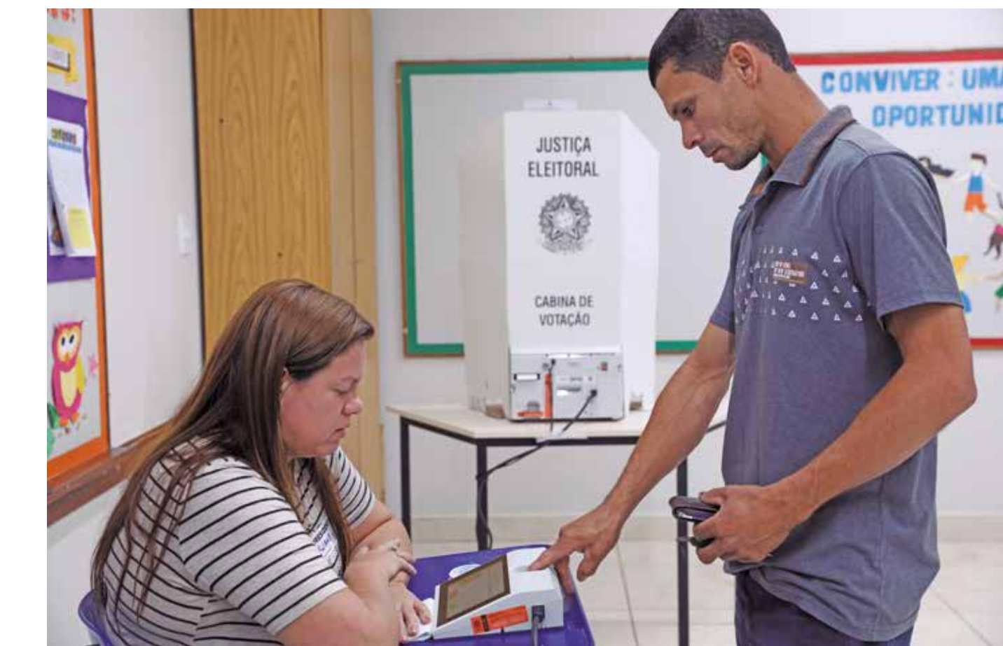
Inscrição como voluntário não garante convocação imediata, mas dados ficam disponíveis para chamados futuros

Os eleitores convocados receberão comunicação oficial da Justiça Eleitoral com