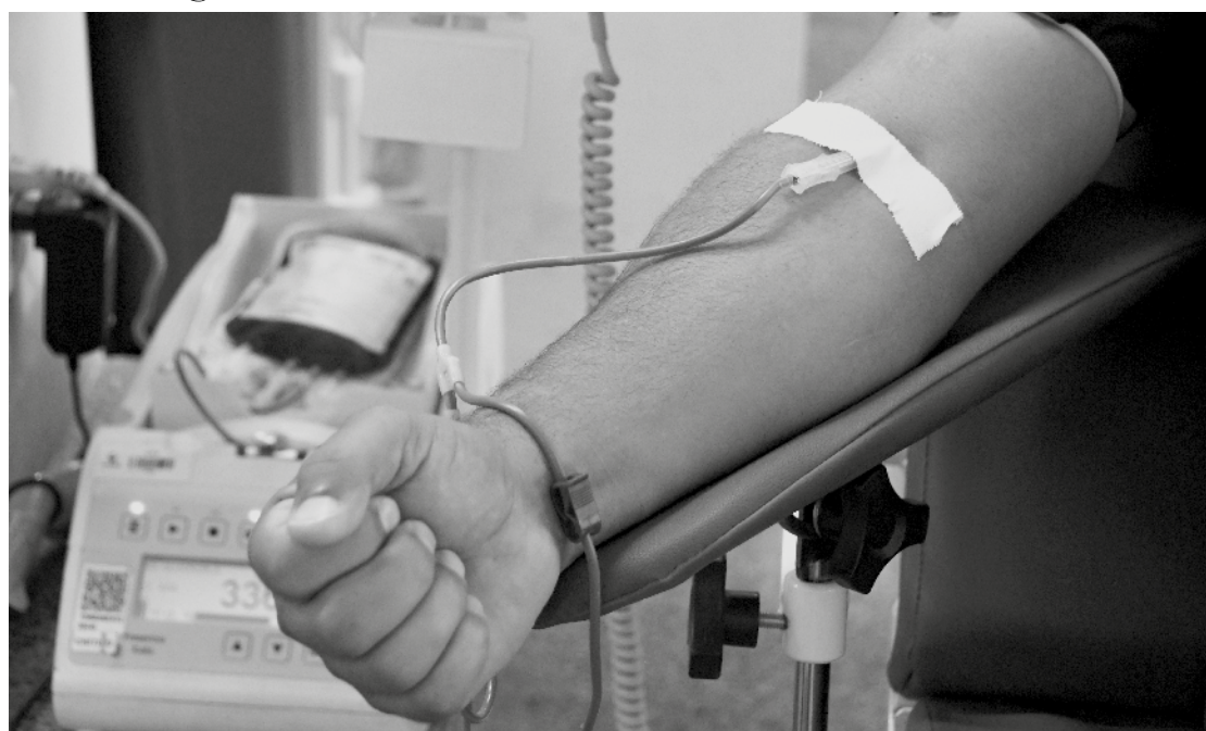
Solidariedade na veia