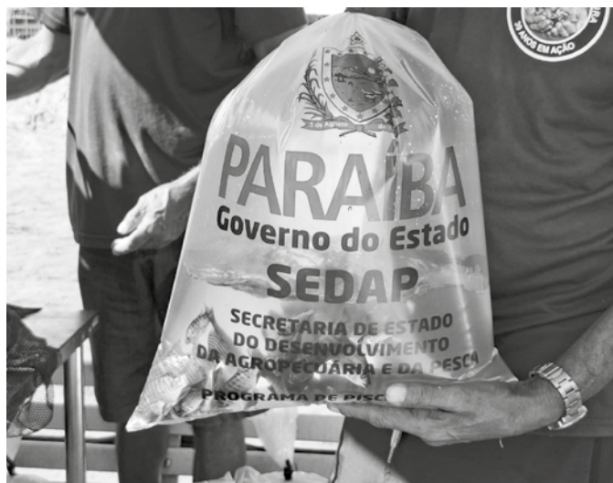
Pescadores de seis municípios paraibanos serão beneficiados

Serão entregues 50 mil alevinos para a Prefeitura de Condado, 50 mil para a de Teixeira, 30 mil à Prefeitura de Salgadinho, 20 mil para a colônia de Pescadores Z114, de São Mamede, e outros 20 mil para a Colônia de Pescadores Z89 da cidade de Malta. Já a Gerência Operacional Municipal da Empresa Paraibana de Pesquisa, Extensão Rural e Regularização Fundiária (Empaer-PB), órgão ligado à Sedap-PB, do município de Matureia, receberá 30 mil alevinos.