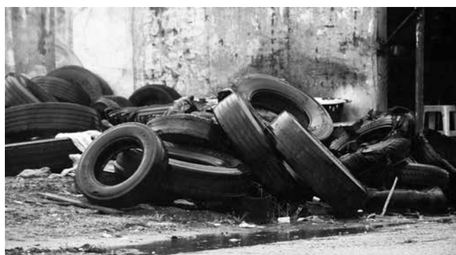
Pneus a céu aberto são criadouros para o Aedes aegypti

soa pode denunciar possíveis focos do mosquito por meio do Disk Dengue, ligando para os números (83) 3213-7781 e (83) 3213-7782. Já o contato (83) 99395-1971 está disponível para WhatsApp e permite também o envio de fotos e vídeos dos possíveis criadouros. Por meio dos mesmos canais, a população ainda pode tirar dúvidas com profissionais da Gerência de Vigilância Ambiental. O horário de funcionamento desse serviço é de segunda a sexta-feira, das 8h às 12h e das 13h às 17h.