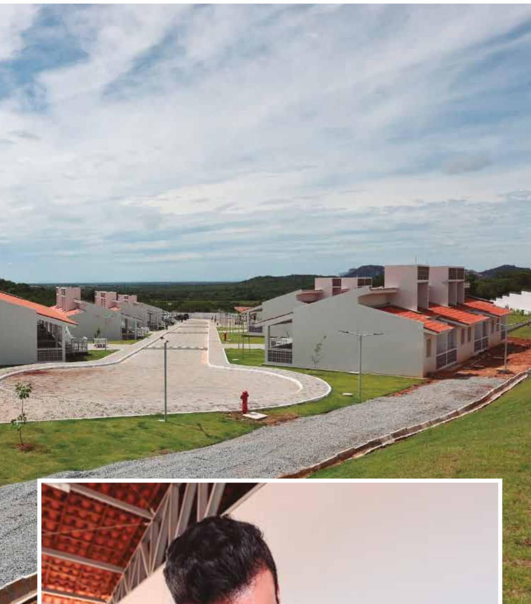
Complexo tem oito blocos e, em cada um, há cinco casas

■ Empreendimento, que recebeu investimentos superiores a R$ 11,8 milhões, fortalece a política estadual de cuidado com os idosos