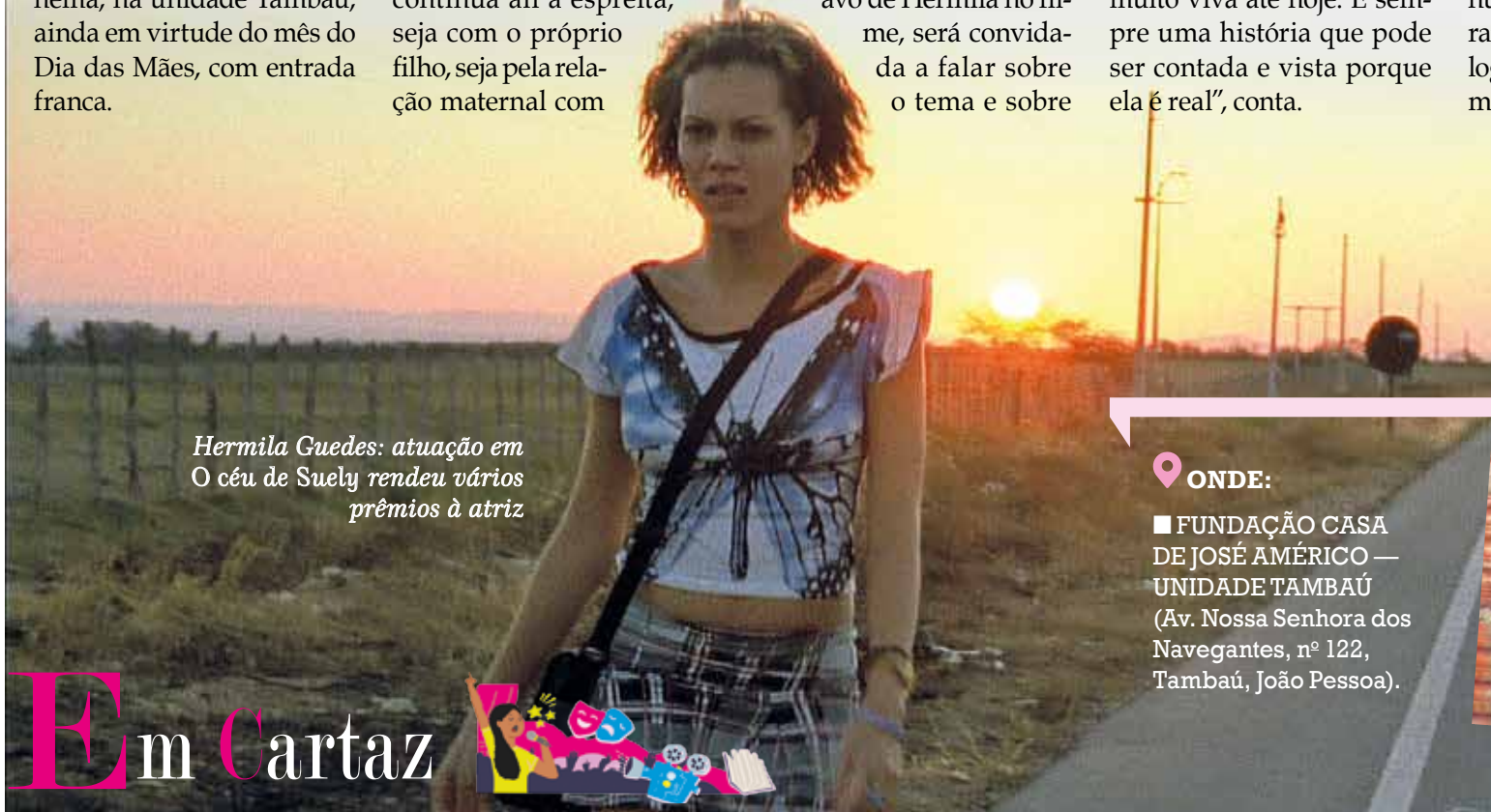
Hermila Guedes: atuação em O céu de Suely rendeu vários prêmios à atriz

Com O céu de Suely , Hermila Guedes ganhou vários prêmios de Melhor Atriz: o Prêmio Grande Otelo (da Academia Brasileira de Cinema), no Festival de Havana, no Festival do Rio e na Mostra de São Paulo.