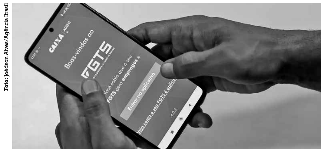
Será possível usar até 20% do saldo ou até R$ 1 mil, prevalecendo o maior valor

Por fim, outro problema comum é a fluência em outros idiomas. Segundo os empreendedores, existe uma carência de formação específica para os fundadores de negócios globais, incluindo a necessidade de um "inglês de negociação" e não apenas conversação básica. A falta de pessoal especializado para lidar com a complexidade de contratos internacionais também foi citada como um gargalo.