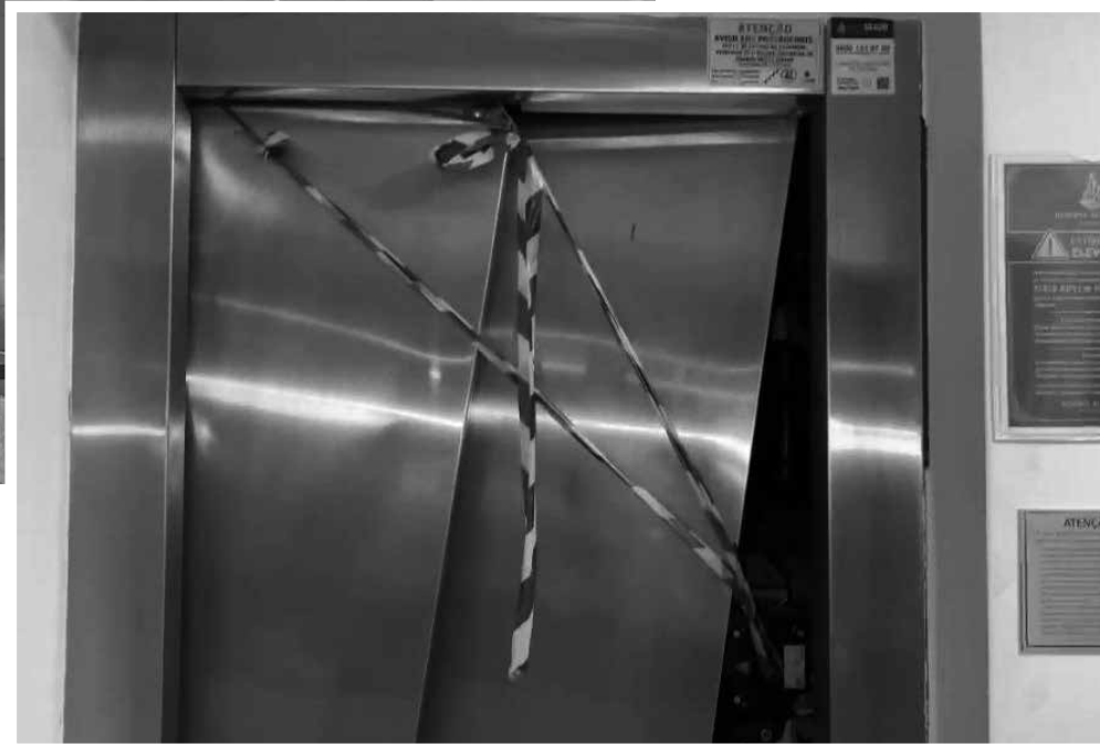
Estrutura despencou do terceiro andar; além da mulher, duas crianças ficaram feridas

Justiça havia determinado troca de equipamentos devido a “vícios estruturais”, mas construtora recorreu