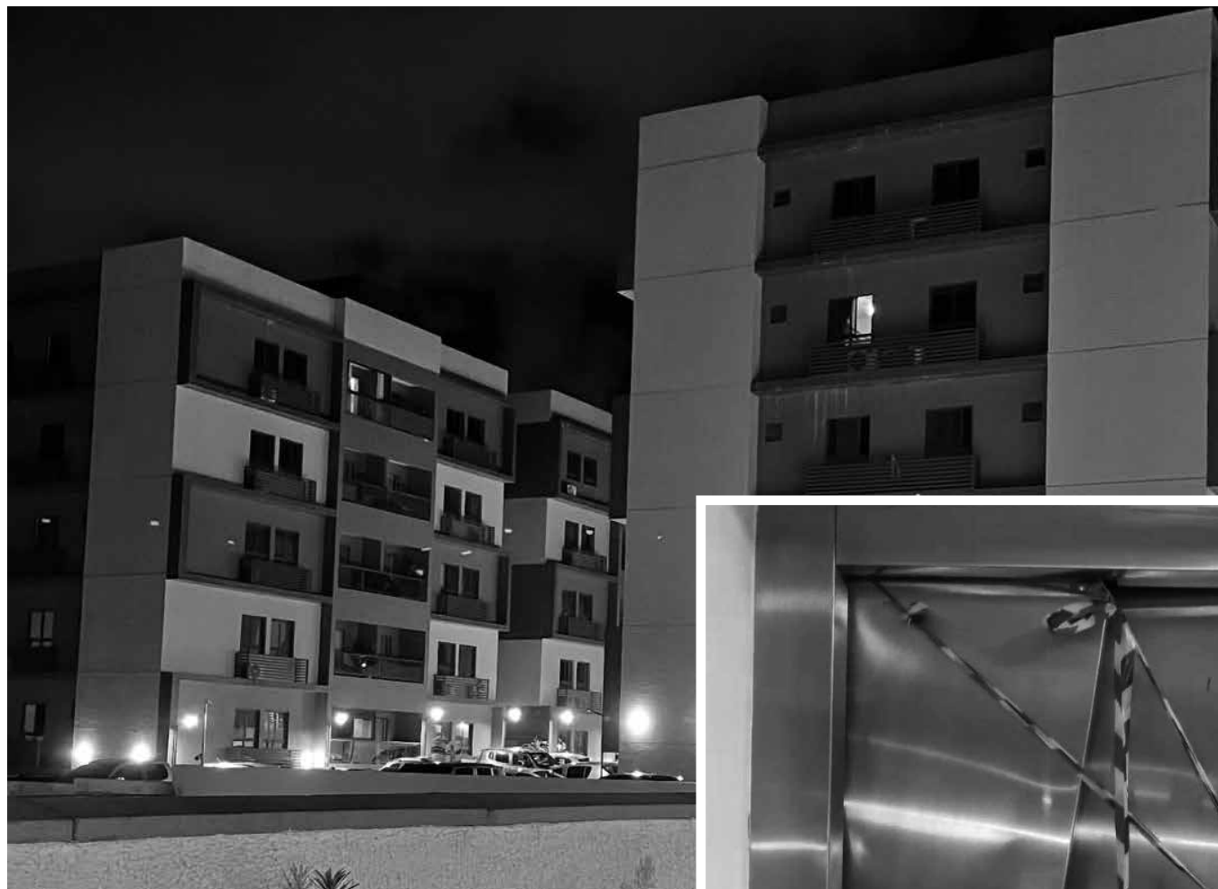
Condomínio já registrava problemas técnicos nos elevadores

Segundo relatos de moradores, a mulher foi retirada com ferimentos e dores pelo corpo, enquanto as duas crianças apresen-