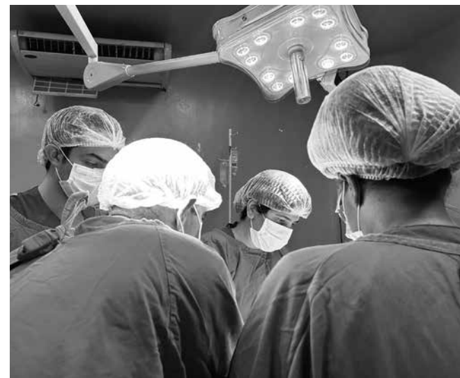
Doação de órgãos foi a 11ª registrada no estado em 2026

Essa foi a 11ª doação de órgãos registrada na Paraíba em 2026, sendo a quarta realizada no Hospital de Trauma de João Pessoa. Com a captação desta semana, o estado já contabiliza 47 transplantes realizados no ano. Na lista de espera, ainda aguardam 865 pessoas, sendo 663 para córneas, 165 para rins, 32 para fígado e cinco para coração.