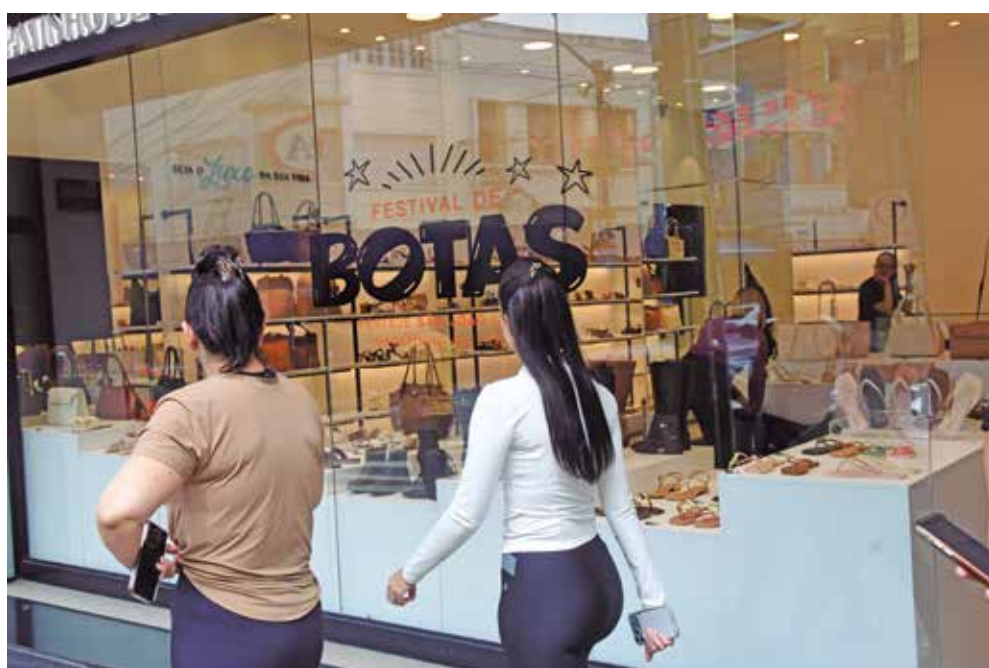
Peças clássicas do período junino, as botas já ganham destaque nas vitrines da cidade

Messias também destaca que as botas de cano alto têm liderado a procura neste ano, principalmente os modelos sem salto fino. "As consumidoras estão priorizando mais o conforto do que apenas a estética. As peças são feitas em napá e a maioria traz detalhes diferentes como as fivelas", pontuou.