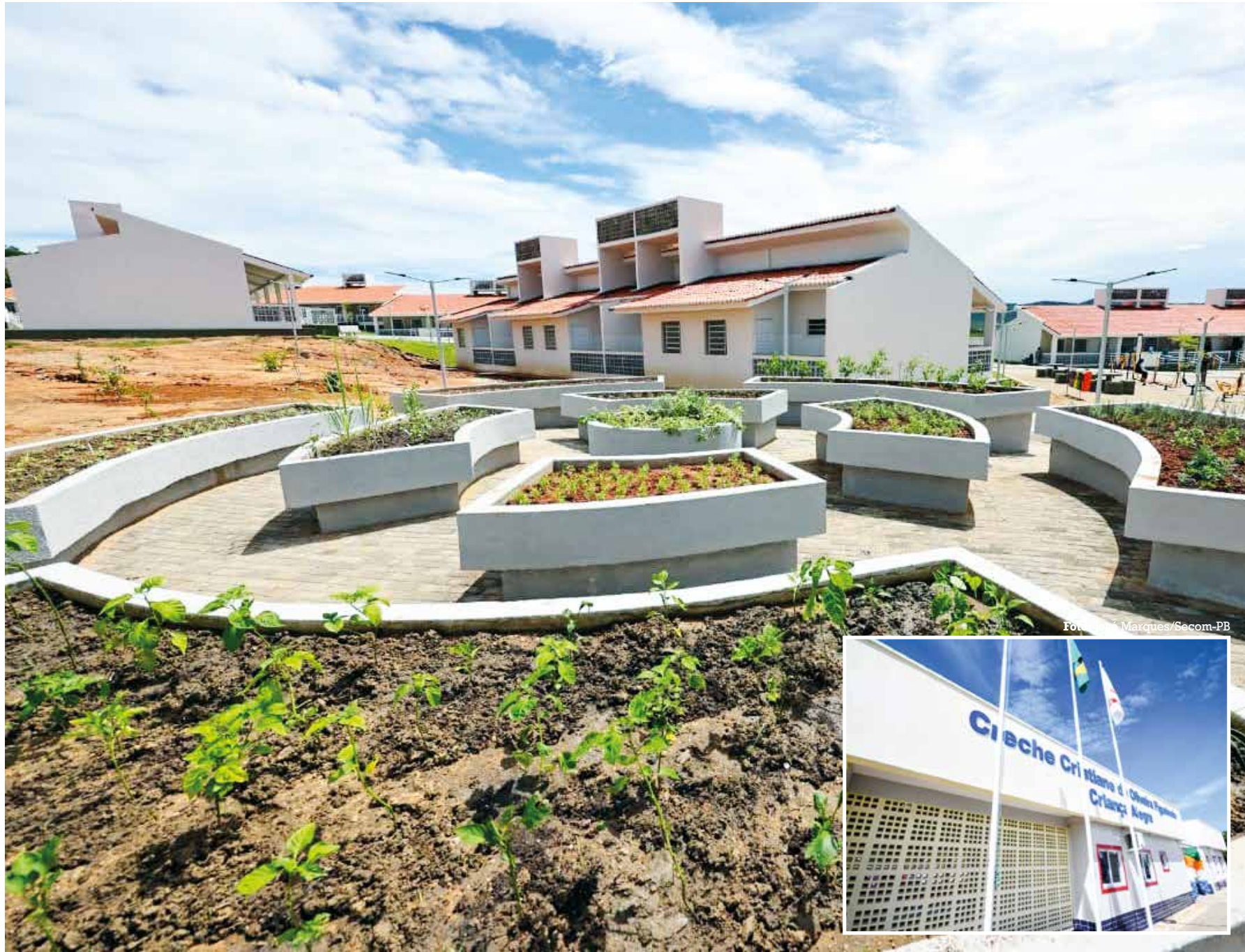
Residencial possui 40 unidades e infraestrutura especial para idosos; em Jericó, houve a entrega da primeira creche da Zona Rural