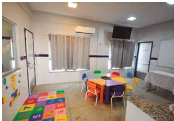
Unidade de ensino é fruto de parceria com a prefeitura

“Hoje, 50 crianças da Zona Rural já estão tendo acesso a uma educação de qualidade, ao cuidado e às experiências necessárias para o início da vida escolar. O que está sendo plantado aqui agora será refletido no futuro dessas crianças. E dessa mesma forma a nossa gestão