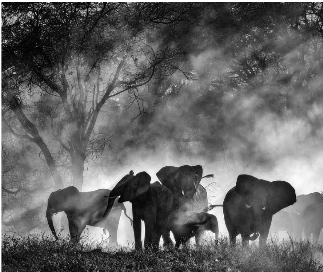
Cena do documentário dirigido pelo veterano alemão Werner Herzog e produzido pela National Geographic