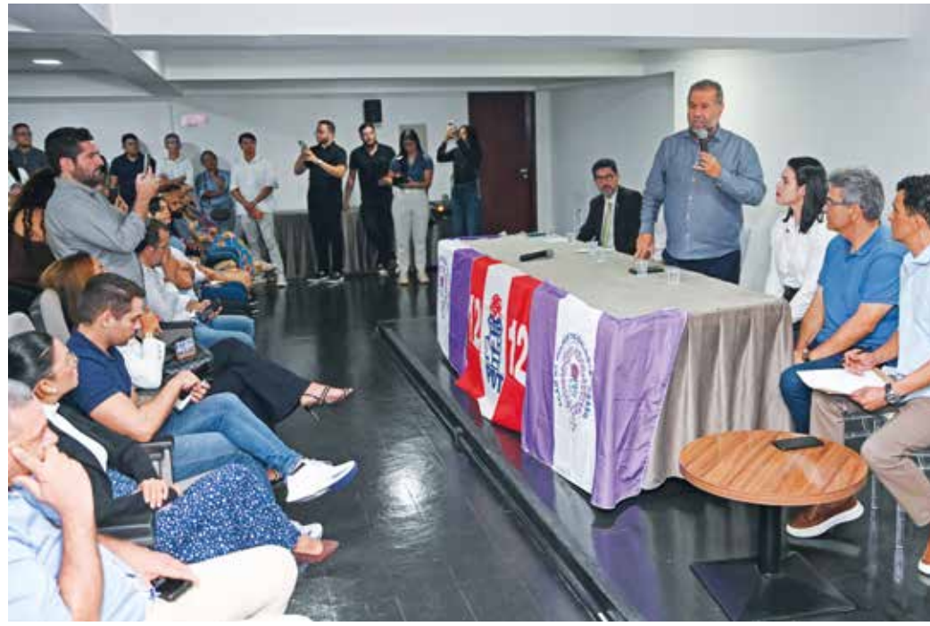
Solenidade de posse contou com lideranças políticas e o presidente nacional do partido, Carlos Lupi

O PDT paraibano busca recuperar o protagonismo histórico do partido, focando em bandeiras como a educação integral, a geração de oportunidades e a representatividade. “É uma honra ser recebida pelo PDT, que não é só um partido, mas um legado. Estou dividindo a vice-presidência com Rafaela e é uma honra estar ao lado de uma mulher tão forte e tão aguerrida. Queremos mais mulheres em posições de poder e decisão, contribuindo para o desenvolvimento do nosso estado”, des-