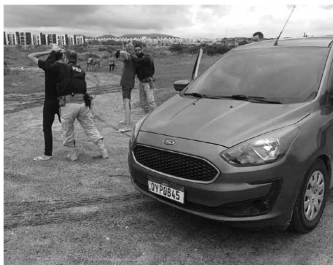
Organização é especializada em furtos de veículos e cargas

Durante a abordagem, foi preso em flagrante um dos envolvidos, suspeito de prestar apoio logístico ao grupo criminoso, realizando o transporte de integrantes entre a capital do Rio Grande do Norte e Campina Grande em diferentes ocasiões. As investigações apontam, ainda, que o grupo possui ligação com autores conhecidos por furtos de quadriciclos e veículos de alto valor, atuando de forma estruturada, com divisão de tarefas e utilização de veículos adulterados para difi-