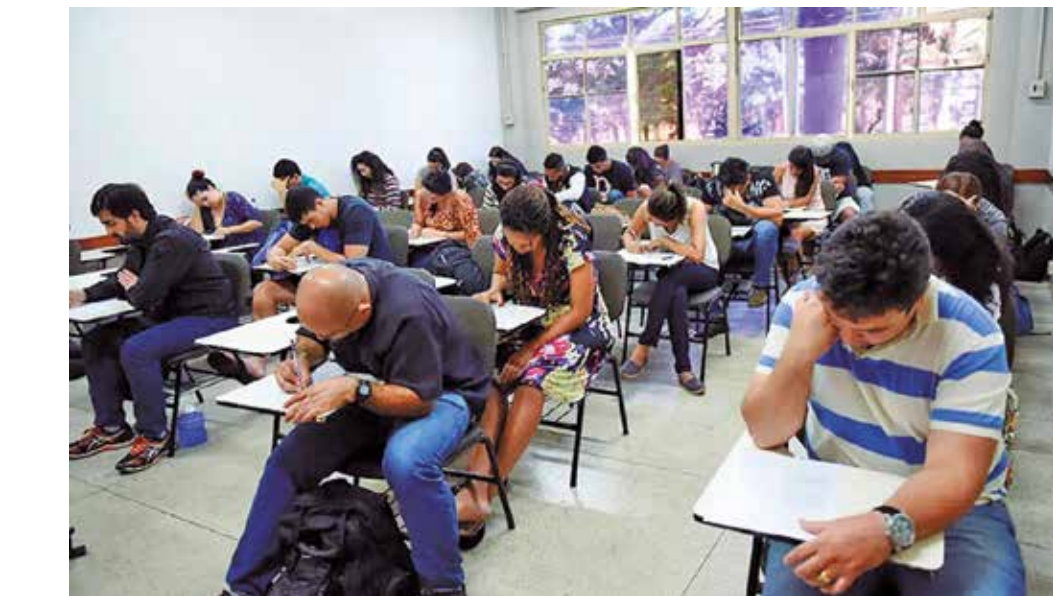
Todos os candidatos aos testes são voluntários, mas precisam atender aos requisitos

• 14. O candidato também é questionado sobre sua percepção do Encceja, hábitos de leitura, habilidades no uso de