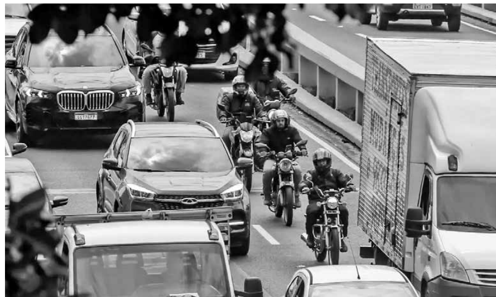
Mais de 25,9 milhões de brasileiros trabalham por conta própria, de acordo com o IBGE

No entanto, ele destaca que esse padrão não se estende para trabalhadores por conta própria e empregadores. "Se quiser trabalhar 24 horas por dia, ele pode, não tem nada que o impeça, a não ser a sua pró-