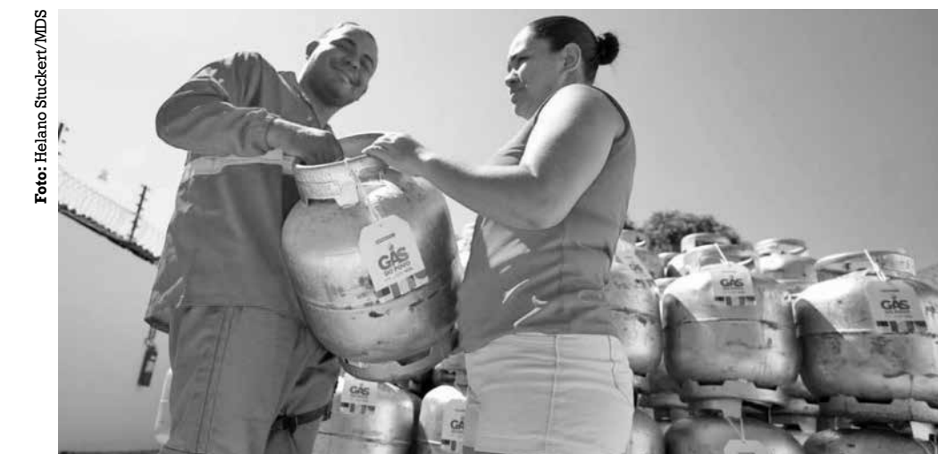
Números divulgados dos beneficiários paraibanos são referentes ao mês de maio

■ A Fepaf faz parte do Circuito Nordestino de Feiras da Agricultura Familiar