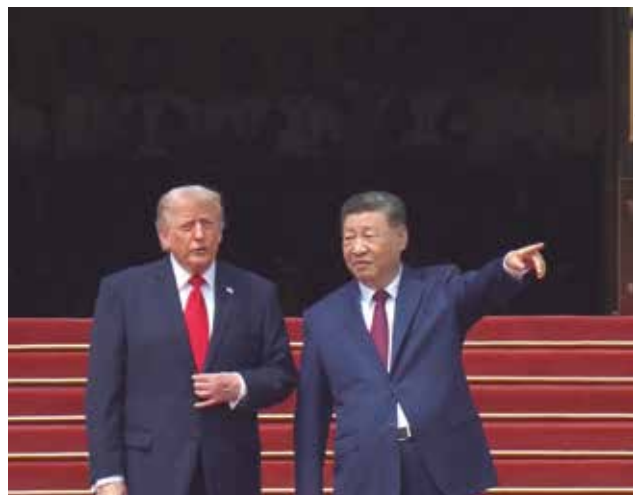
Trump (E) definiu seu homólogo como “um grande líder”

Descrevendo a questão de Taiwan como “o assunto mais importante nas relações” entre os dois países, o líder chinês destacou que “a independência de Taiwan e a paz no Estreito de Taiwan são incompatíveis”.