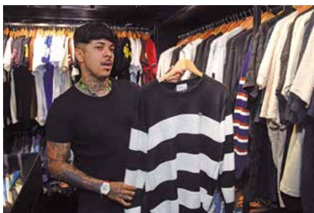
Suéteres de lã são muito procurados pelos forrozeiros