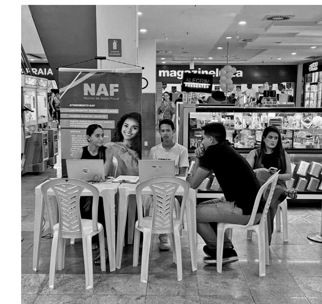
Interessados devem ir até o Shopping Tambiá, no Centro da cidade, das 10h às 12h

Nos dois casos, não se deve esquecer o login e a senha da conta Gov.br. Atrasos na entrega do Imposto de Renda estão sujeitos a multa de até 20% do total devido, no valor mínimo de R$ 165,74. “Nós estamos a menos de 15 dias, aproximadamente, para o fim do prazo da entrega dessa declaração. É muito importante que quem precisa declarar faça toda uma coleta desses documentos que são