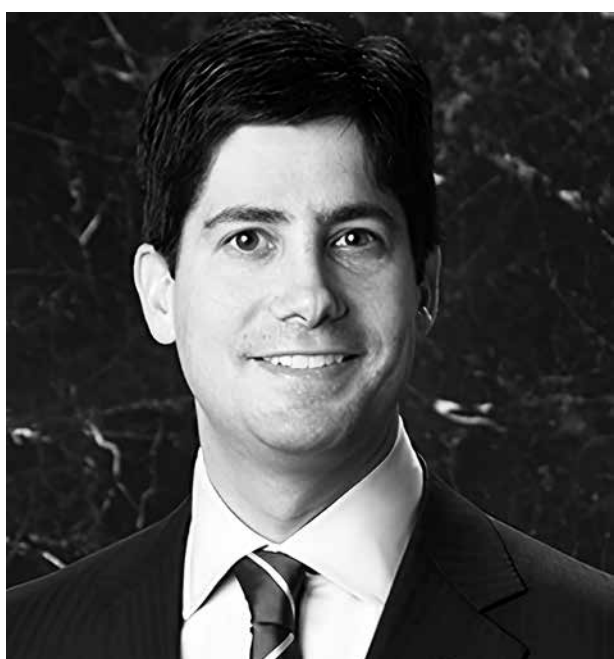
Kevin Warsh foi diretor do FED no período de 2006 a 2011

O presidente norte-americano ainda associou os recordes das bolsas de Nova York com a posse de Warsh: “Mercado acionário está subindo, significa que gostam de você”.