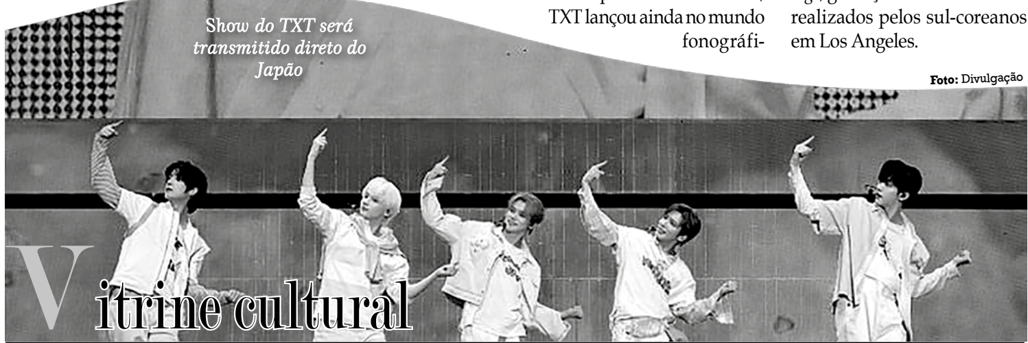
Show do TXT será transmitido direto do Japão

Realização da Trafalgar Releasing, esse evento é um dos vários shows do k-pop a chegar nos cinemas recentemente (o primeiro ao vivo). Em 2023, o grupo já havia passado pelos cinemas com Tomorrow X Together world tour — act: sweet mirage , gravação de um dos shows realizados pelos sul-coreanos em Los Angeles.