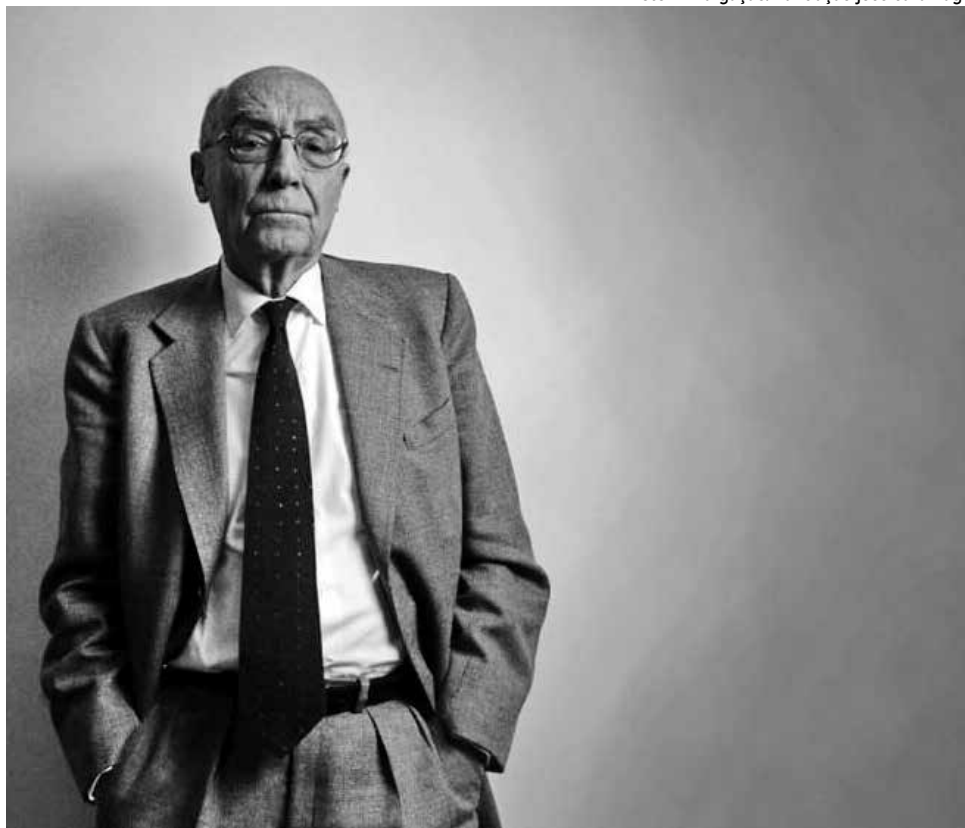
“Então Saramago foi o precursor da tia do WhatsApp que não usa pontuação?”

Em Pedagogia da autonomia (Paz e Terra, 1996), Paulo Freire dizia que “quem ensina aprende ao ensinar e quem aprende ensina ao aprender”. Sempre cito essa frase nas minhas oficinas de criação literária, onde não encaro as pessoas que se inscreveram como alunos, mas como colegas escritores. Todos têm suas próprias ideias sobre a escrita e, em aula, elas pesam tanto quanto as minhas. “Não há regras para a boa escrita além daquelas que você criou pra você e passa a seguir porque elas funcionam, ou parecem funcionar, pra você”, diz Elmore Leonard em outra passagem que gosto muito de citar também.