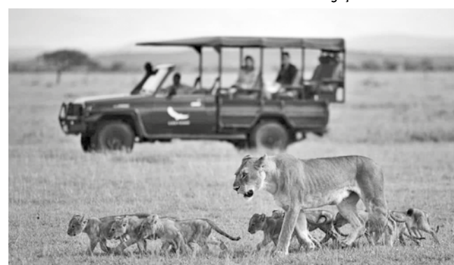
Leoa e filhotes com carro de turistas próximo: “É IA, não é?”