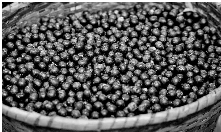
Parceria de cinco anos prevê o fornecimento de 15 mil toneladas do produto nacional

O bloqueio adicional dos R$ 22,1 bilhões será detalhado no próximo dia 29, com a publicação de um decreto presidencial com os limites de empenho (autorização de gastos) por ministérios e órgãos federais).