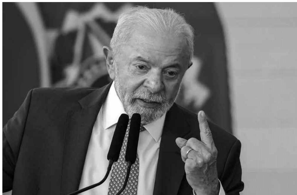
Há uma semana, Lula estava em empate técnico dentro da margem de erro de 2 p.p.