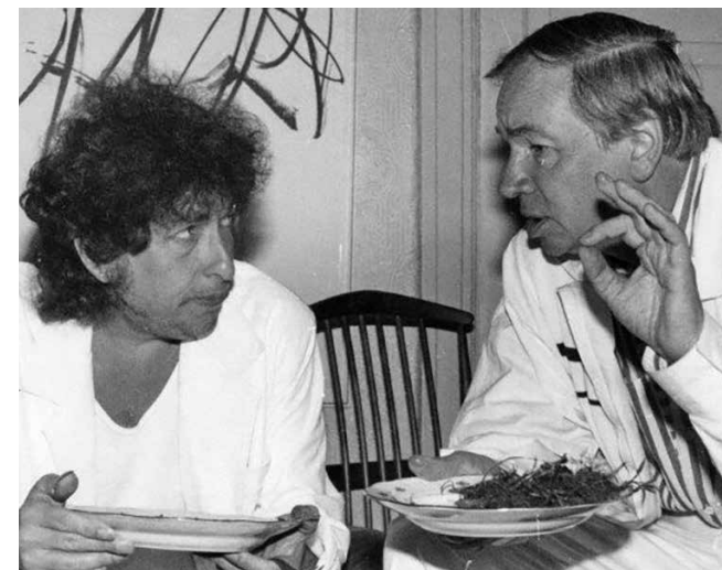
Voznessiênski hospedou ninguém menos que Bob Dylan