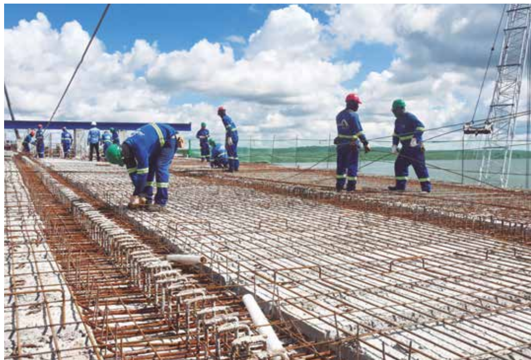
Trabalhadores da construção concentram-se, no momento, na execução de vigas e lajes

O projeto servirá para interligar os municípios de Ca-