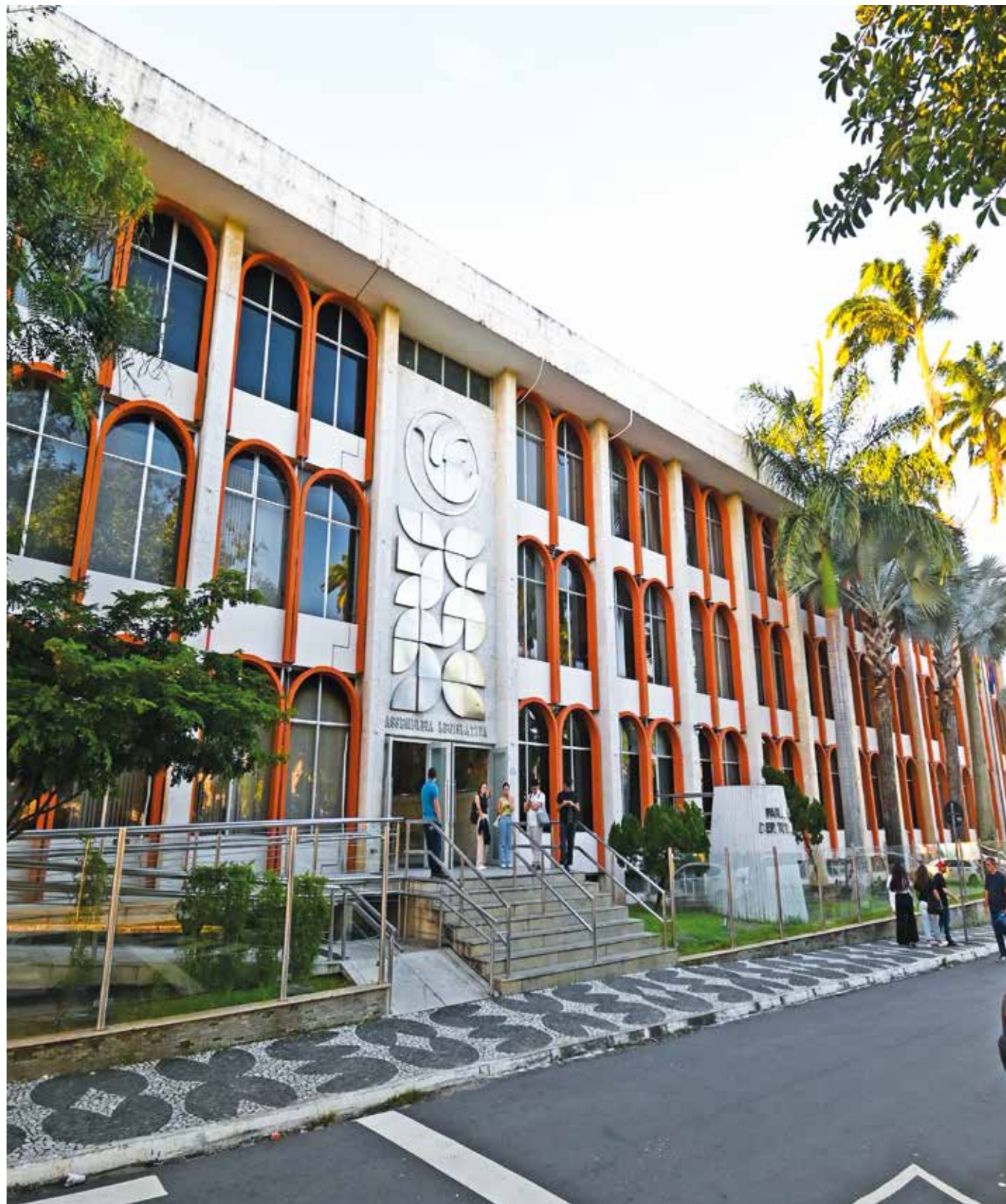
Sob gerenciamento do Legislativo, verba será aplicada em áreas essenciais, como saúde, assistência social e infraestrutura