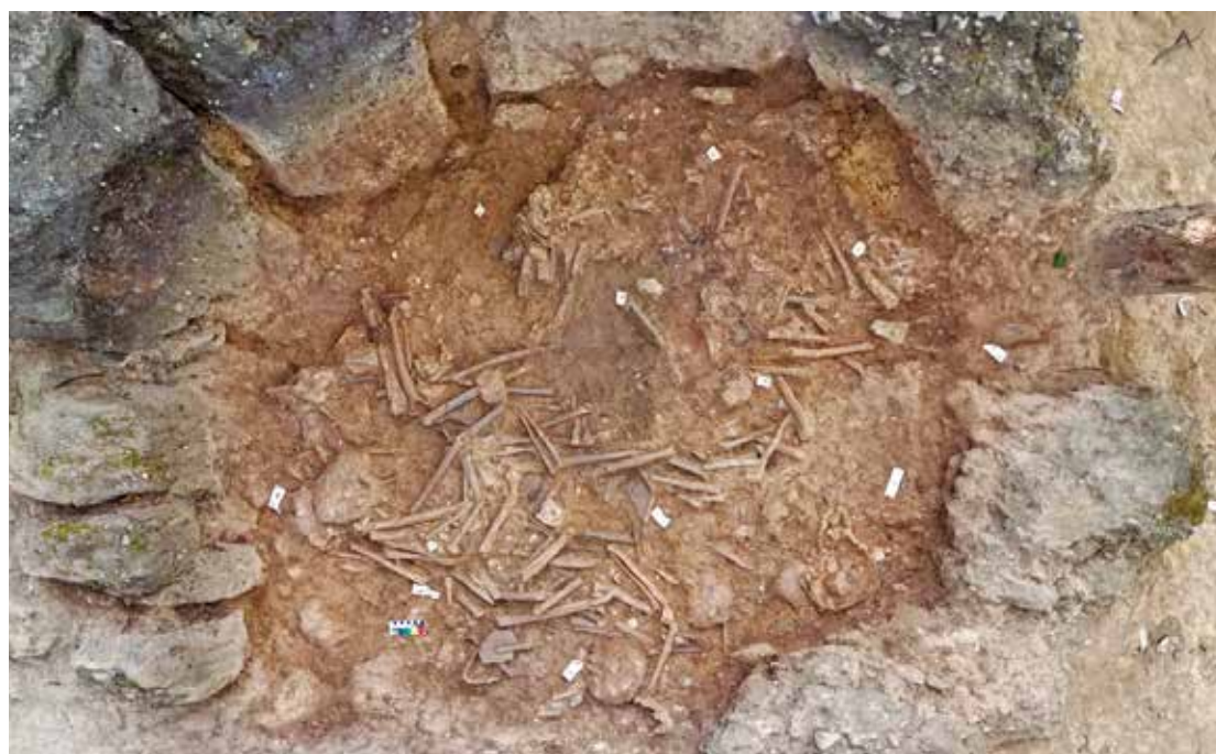
Registro de cima do ossuário no Jarro 1, num dos sítios arqueológicos do Planalto de Xieng Khouang

Milhares desses milenares recipientes de pedra — alguns com até três metros de altura — estão espalhados pela Planície dos Jarros, local que foi tombado como Patrimônio Mundial pela Organização das Nações Unidas para a Educação, a Ciência e a Cultura (Unesco). Embora os arqueólogos, há muito tempo, suspeitam que os jarros estivessem ligados a práticas funerárias, nenhuma evidência direta tinha confir-