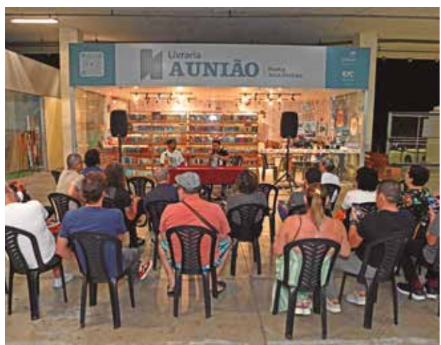
Lançamento da obra aconteceu na Livraria A União

Escrito ao longo de cinco anos e meio, O Dono e o Mal narra a trajetória da família Farias de Assumpção. A trama tem início com a migração de Batista, um homem preto e pobre, da Paraíba para o Amazonas durante a construção da Transamazônica. O que começa como um sonho de vida melhor transforma-se em um pesadelo multigeracional, personificado pela figura grotesca de “O Inglês”, uma entidade que simboliza o peso da colonização e da opressão estrutural.