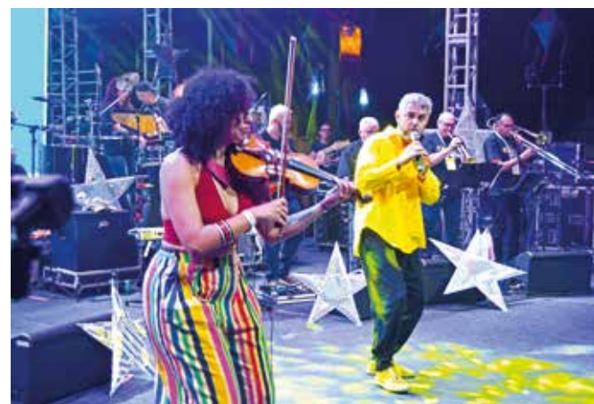
Apresentações ocorreram no Centro Cultural Elba Ramalho

Vindos de várias regiões do estado e trazendo ritmos