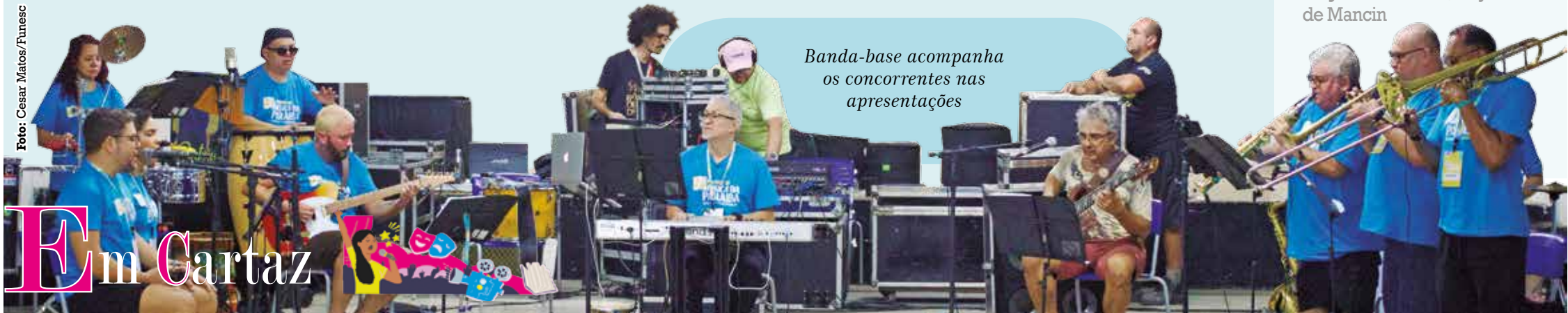
Banda-base acompanha os concorrentes nas apresentações