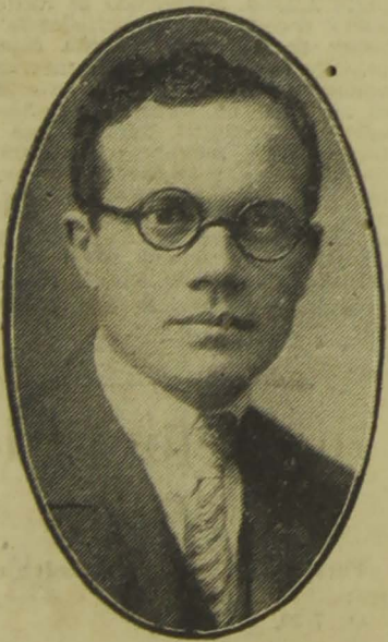
Dr. José Americo de Almeida

Viaja hoje de automovel para Recife o illustre politico conterraneo dr. José Americo de Almeida, candidato eleito á re-