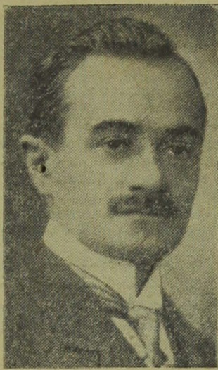
Presidente João Pessoa

encia, lá fóra, já vos disse, não são parahybanos. Aqui nasceram quando a Parahyba estava distraída... (O orador é muito applaudido).