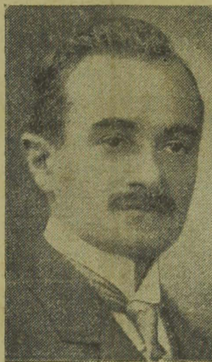
Presidente João Pessoa

um vibrante dobrado, enquanto o povo batia palmas e diversas senhori-nhas da elite misericordense jogavam flores e confetti no presidente João Pessoa.