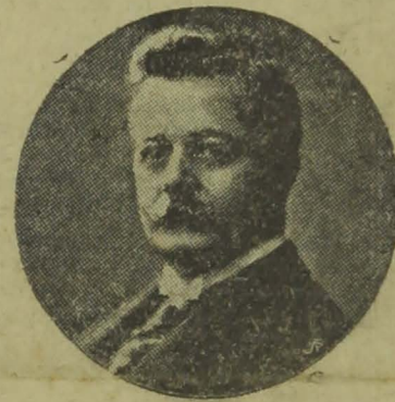
Senador Epitacio Pessôa

Em outra nota, "O Jornal" contesta, também, as noticias publicadas aqui e divulgadas nos Estados, de que o ex-