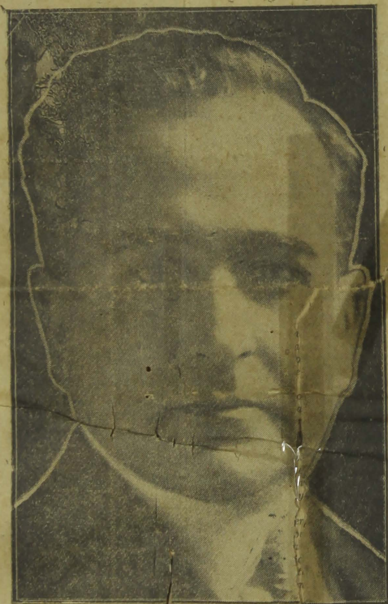
Presidente Getulio Vargas

Teve as proporções de uma formidável consagração popular a passagem do chefe gaúcho pelas ruas da capital do paiz