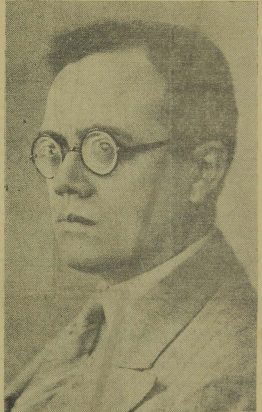
MINISTRO JOSÉ AMERICO

Os costumes bastardos dos governantes brasileiros formaram um ambiente irrespiravel e envenenado, onde a gangrena politica se desenvolvia assustadora; por isto, quando surge um espirito superior, devotado aos interesses patrios, com convicção firme e inabalavel de trabalhar honesta-