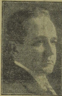
Presidente Getulio Vargas

Não quizemos, entretanto, iniciar a publici-