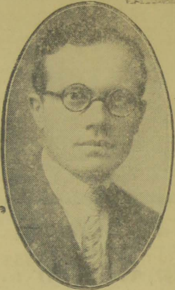
Ministro José Americo