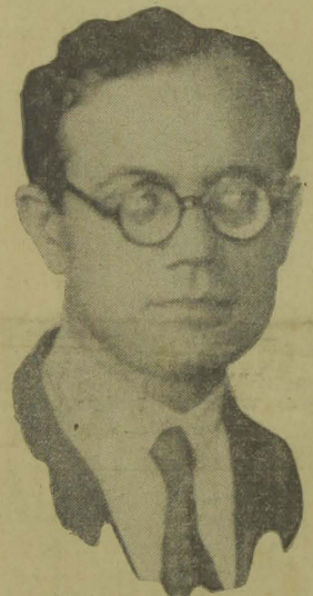
Ministro José Americo, que está realizando um vasto programma de socorro ás victimas da sécca acontceira em 1915, já agora a irrupção da calamidade está forçando o exodo para os brejos e littoral.