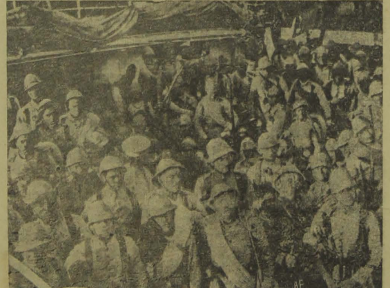
Forças da policia bahiana, que seguiram para o “front”.

RIO 2 — (Pelo radio) — O Departamento de Publicidade da Imprensa Nacional enviou uma nota dizendo que após forte pressão da