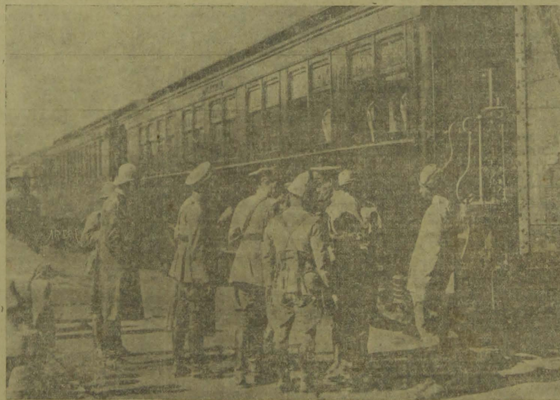
REVOLUÇÃO PAULISTA: — O wagon em que se acha installado o Quartel General Ambulante do general Góes Monteiro.

Transmittindo a opinião do sr. Assis Brasil o sr. Adalberto Corrêa accrescenta achar-se autorizado a declarar que o sr. Assis Brasil considerava um erro e um crime o movimento revolucionario paulista e que por conseguinte é contrario a qualquer movimento armado no Rio Gran-