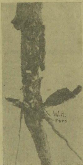
Raiz de algodoeiro atacado pelo rola (Tamanho natural)

Com essas medidas, de facil execução todas ellas, evitaremos a reprodução e consequente disseminação da praga, o que é tudo.