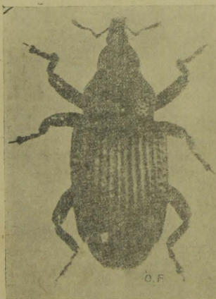
O besouro (insecto adulto) augmentado em 15 vezes o seu tamanho.

Attingida que seja a planta, por meio da tromba lhe vae ferindo a casca, de preferencia ao nivel do solo ou seja no ponto de união da haste com a raiz (colleto), assim preparando pequenas cavidades, no interior de cada uma das quaes deposita um unico ovo. Deste, decorridos que sejam de 10 a 15 dias, sae a larva ou lagarta que, apesar de extrema, mente pequena, é dotada de fortes peças bucaes (mandibulas) com que roe o algodoeiro, ro entre a casca e a madeira firme (na parte vegetativa).