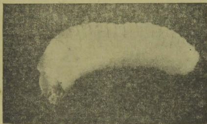
A lagarta (larva) augmentada em 10 vezes o seu tamanho.

terribéis, a qual se attribue seja propria do nosso (como de outros países sul-americanos, apesar de sua notificação em territorio brasileiro datar de vinte annos ou pouco mais apenas).