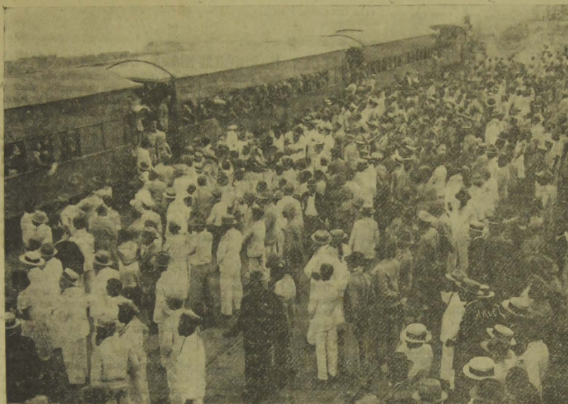
O povo, na estação da "Great Western", assiste á partida do trem que levou os bravos contreranos do 3.º B. P. a Cabedello